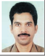
କିଶୋର ପାଣି, ଭୁବନେଶ୍ୱର