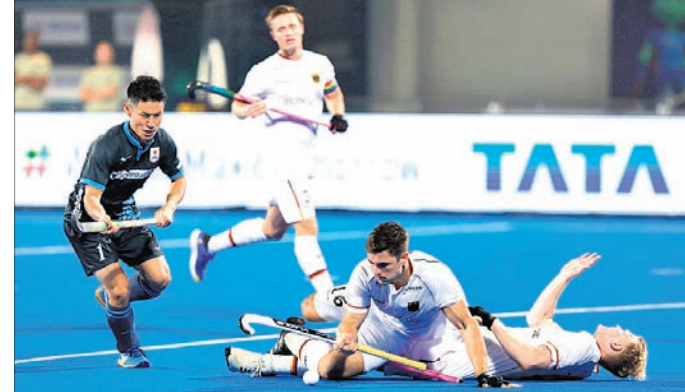
ଜର୍ମାନୀ ଓ ଜାପାନ ମଧ୍ୟରେ ଅନୁଷ୍ଠିତ ମ୍ୟାଚ୍‌ର ଏକ ସଂଘର୍ଷପୂର୍ଣ୍ଣ ସମ୍ବର୍କ।

ଦଳକୁ ଉତ୍ସାହିତ କରିଥିବା ବେଳେ ଦ୍ୱିତୀୟ ମ୍ୟାଚରେ ଉଭୟ ଜର୍ମାନୀ ଓ ଜାପାନ ଦଳର ପ୍ରଶଂସକମାନେ ଉପସ୍ଥିତ ହୋଇଥିଲେ। ଜାପାନର ଏକ ପ୍ରଶଂସକ ଦଳ ଗୋଟିଏ ଗ୍ରୁପ୍‌ରେ ବସି ପଢ଼ାକା ହଲାଜବା ସହ ବେଲ୍‌ଜିୟମ ବାଡ଼େଇ ନିଜ ଦଳର ଖେଳାଳିଙ୍କ ମନୋବଳ ବୃଦ୍ଧି କରିଥିଲେ।