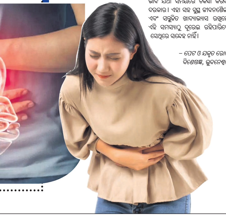
- ପେଟ ଓ ଯକୃତ ରୋଗ ବିଶେଷଜ୍ଞ, ଭୁବନେଶ୍ୱର