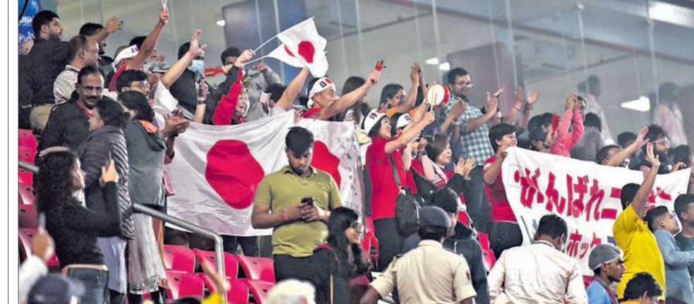
ଶନିବାର କଳିଙ୍ଗ ଷ୍ଟାଡ଼ିୟମରେ ମ୍ୟାଚ୍ ଉପଭୋଗ ଅବସରରେ ଜାପାନ ପ୍ରଶଂସକ।