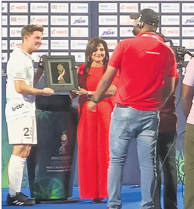
ଭୁବନେଶ୍ୱର, ୧୪।୧ (ସ୍ପୋର୍ଟ୍ସ ଟ୍ୟୁବୋ) ଭୁବନେଶ୍ୱର ଗଜପତିସ୍ତମ୍ଭ ପାଖରେ ଚାମ୍ପିୟନ ପୁରସ୍କାର ପ୍ରଦାନ କରାଯାଇଛି