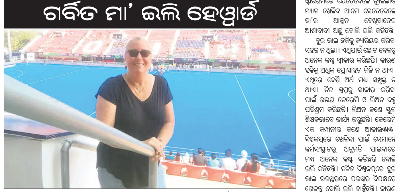
କଳିଙ୍ଗ ଷ୍ଟାଡ଼ିୟମରେ ହଳି ବିଶ୍ୱକପ୍ ମ୍ୟାଚ ଦେଖିବା ଅବସରରେ ଲଳି ହେଉଥାଏ।

କୋଣାର୍କ ମାତାପିତାଙ୍କର ସନ୍ତାନ ଯଦି ଜାତୀୟ ଦଳ ପକ୍ଷରୁ ଅନ୍ତର୍ଜାତୀୟ ସ୍ତରରେ ପ୍ରତିନିଧିତ୍ୱ କରନ୍ତି ତେବେ ଗର୍ବରେ ଛାତି ଫାଟିପଡ଼େ। ମାତ୍ର କୋଣାର୍କ ମାତାପିତାଙ୍କ ଦୁଇ ସନ୍ତାନ ଯଦି ଦୁଇଟି ଦେଶରୁ ପ୍ରତିନିଧିତ୍ୱ କରନ୍ତି ତେବେ ସେମାନେ କେତେ ପରିମାଣରେ ନିଜକୁ ଗୌରବଦିତ ମନେକରୁଥିବା ତାହା ଅନୁଭବ କଥା।