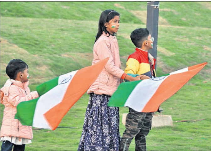
ରାଉରକେଲାରେ ବିର୍ଯ୍ୟ ପୁତ୍ରୀ ଷ୍ଟାଡ଼ିୟମକୁ କୁନି ପିଲାମାନେ ତ୍ରୁଟି ଧରି ପ୍ରବେଶ କରୁଛନ୍ତି ।