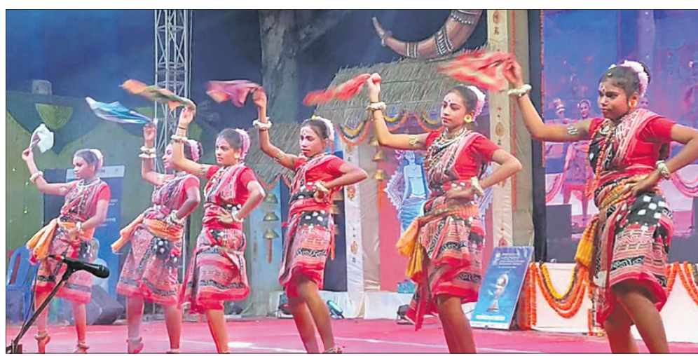
ନୂଆପଡ଼ା ମିନିଷ୍ଟ୍ରିୟମଠାରେ ଚାଲିଥିବା ପଲ୍ଲିଶ୍ରୀ ମେଳା ସହ କ୍ରୀଡ଼ା ଓ ସାଂସ୍କୃତିକ ମହୋତ୍ସବରେ ସମ୍ବଲପୁରୀ ନୃତ୍ୟ ପରିବେଷଣ କରାଯାଇଛି।