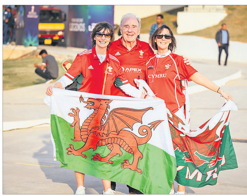
ବିର୍ଯ୍ୟ ପୁତ୍ରୀ ଷ୍ଟାଡ଼ିୟମରେ ଖେଳୁ ଦଳର ସମର୍ଥକ ।