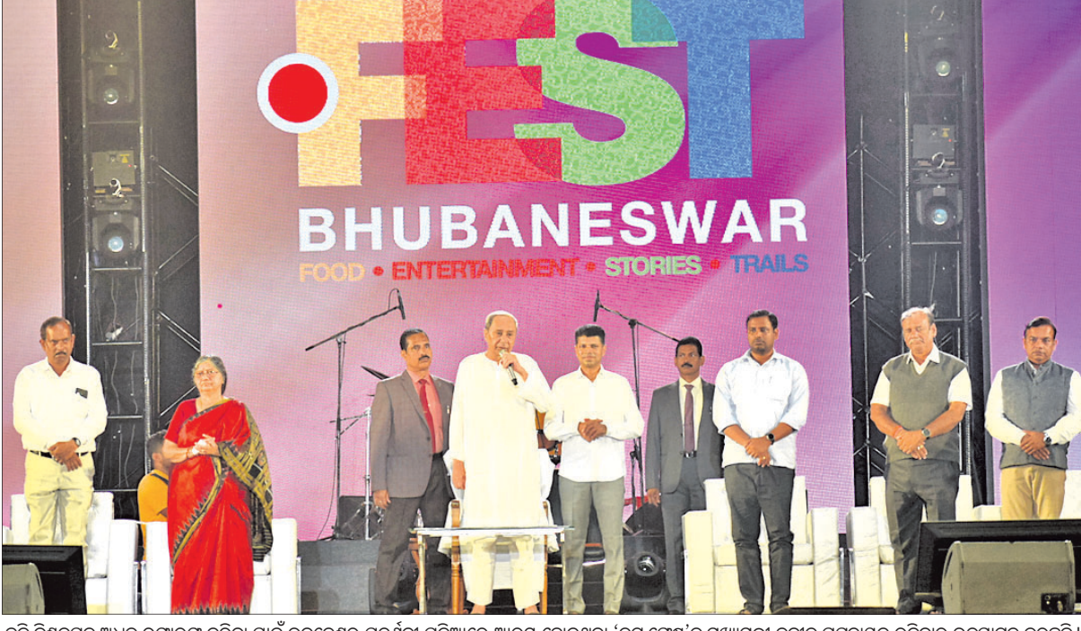
ହରି ବିଷ୍ଣୁଙ୍କୁ ଅଧିକ ଗଜାବଳୀ କରିବା ପାଇଁ ଭୁବନେଶ୍ୱର ପ୍ରଦର୍ଶନୀ ପଡ଼ିଆରେ ଆରମ୍ଭ ହୋଇଥିବା 'ଡବ୍ ଫେଷ୍ଟିଭ୍'ରୁ ପ୍ରଖ୍ୟାତ ନବାନ ପଟ୍ଟନାୟକ ରବିବାର ଉଦ୍‌ଘାଟନ କରୁଛନ୍ତି ।