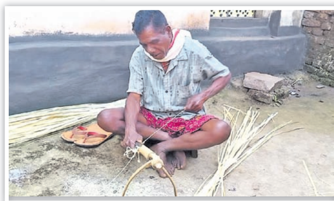
ଜଣେ ଲୋକ ବାଉଁଶରେ ଗୋପା କୁଣ୍ଡା ତିଆରି କରୁଛନ୍ତି।