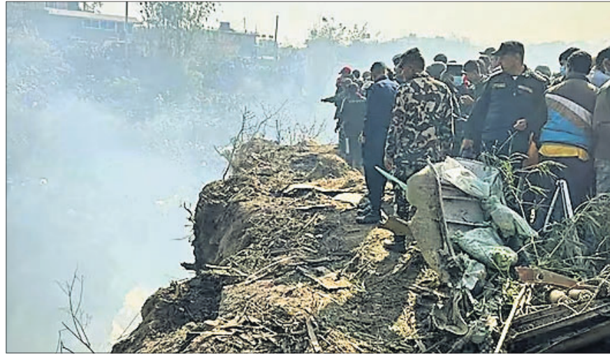
ଦୁର୍ଘଟଣାଗ୍ରସ୍ତ ବିମାନରେ ଲାଗିଥିବା ନିଆଁକୁ ଲିଭାଯାଉଛି।

ଭୁବନେଶ୍ୱର (ଜାତୀୟ ପ୍ରତିନିଧି)/ ରାଉରକେଲା ଅଫିସ୍, ୧୫/୧ ରାଉରକେଲାର ବିଦ୍ୟାପୁରା ଷ୍ଟାଡିୟମରେ ଭାରତ-ଇଂଲଣ୍ଡ ହକି ବିଶ୍ୱକପ ମ୍ୟାଚ୍ ଚଳିଥିଲା। ଭାରତୀୟ ଟୀମ୍ ୨-୧ ରାୟାଲ୍ ପ୍ରାୟ ଲାଙ୍ଗୁ ଦଳ ଗୋଟିଏ ଲେଖାଏ ପଏଣ୍ଟ ଭାଗ ରୋଲ୍‌ଗୁଡିଏ ଭାବେ ତ୍ରୁ ରହିଛି। ଦୁଇ ସମକକ୍ଷ ଦଳ ମଧ୍ୟରେ ମ୍ୟାଚ୍‌ଟି ତୀବ୍ର ସଂଘର୍ଷପୂର୍ଣ୍ଣ ହୋଇଥିଲେ ହେଁ କେହି ଷ୍ଟ୍ରୋକ୍ କରିପାରି ନ ଥିଲେ। ଫଳରେ ବିଶ୍ୱ ରାୟାଲ୍‌ଜର୍ ୫ ନମ୍ବରରେ ଥିବା