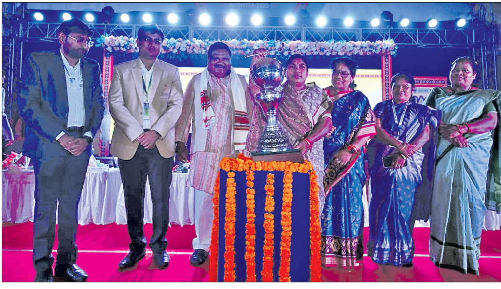
ସରସ ମେଳା ଉଦ୍‌ଘାଟନା କାର୍ଯ୍ୟକ୍ରମରେ ହକି ବିଶ୍ୱକପ ଟ୍ରଫିକୁ ସ୍ୱାଗତ କରାଯାଇଛି ।

ହକି ବିଶ୍ୱକପ ଅବସରରେ ରାଜରକେଳା ସହରରେ ଆରମ୍ଭ ହୋଇଛି ସରସ ମେଳା । ରବିବାର ସନ୍ଧ୍ୟାରେ ଏହି ମେଳାକୁ ମୁଖ୍ୟମନ୍ତ୍ରୀ ନବୀନ ପଟ୍ଟନାୟକ ଉଦ୍‌ଘାଟନ କରିଛନ୍ତି । ଭଞ୍ଜ ଭବନ ପଡ଼ିଆରେ ଆୟୋଜିତ ଏହି ମେଳା ଆସନ୍ତା ୨୭ ଚାରିଖ ଯାଏ ଚାଲିବ । ରାଜରକେଳା ସହରରେ ପ୍ରଥମ ଥର ପାଇଁ ଏହି ମେଳା ଆୟୋଜନ କରାଯାଇଥିବାରୁ ମୁଖ୍ୟମନ୍ତ୍ରୀ ଭିତ୍ତି ବାର୍ଦ୍ଧା କରିଆଣ୍ଡେ ଶୁଭେଚ୍ଛା ଜଣାଇଛନ୍ତି । ସରସ ମେଳା ବୁଲିବାକୁ ଆସି ମିଶନ ଶକ୍ତି ମା'ମାନେ ବିକ୍ରି କରୁଥିବା ଉତ୍ପାଦକୁ କିଣିବା ପାଇଁ ମୁଖ୍ୟମନ୍ତ୍ରୀ ଜନସାଧାରଣଙ୍କୁ ଅପିଲ କରିଛନ୍ତି । ଉଦ୍‌ଘାଟନା କାର୍ଯ୍ୟକ୍ରମରେ ମହିଳା ଓ