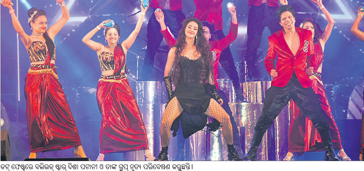
ଡବ୍ ଫେଷ୍ଟିଭ୍‌ରେ ବଲିଉଡ୍ ଷ୍ଟାର୍ ବିଶା ପଟ୍ଟନାୟକ ଓ ତାଙ୍କ ଗୁପ୍ତ ନୃତ୍ୟ ପରିବେଷଣ କରୁଛନ୍ତି ।