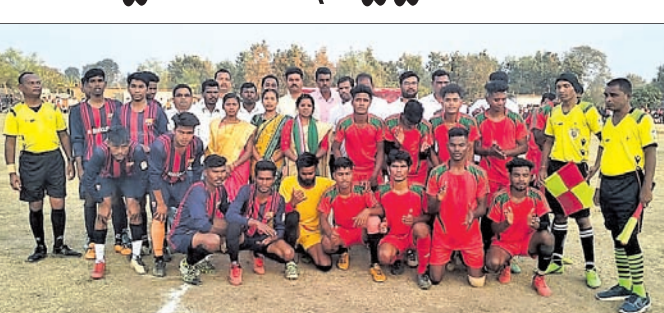
ଖେଳାଳିଙ୍କ ସହିତ ଅତିଥିମାନେ।

କୋକସରା, ୧୫।୧ (ଡି.ଏନ.ଏ.) କଳାହାଣ୍ଡି ଜିଲ୍ଲା କୋକସରା ବ୍ଲକ୍ ବରାଡ଼ଙ୍ଗା ପଞ୍ଚାୟତ ଶିଉନି ଗ୍ରାମରେ ନେତାଜୀ ଯୁବକ ସଂଘ ଆନୁକୁଲ୍ୟରେ ଚାଲିଥିବା ଶିଉନି ଚାମ୍ପିୟନ କପ୍ ପୁଟବଲ ରବିବାର କରି ଦେବାରୁ ସେ ନିଜ ରାଗ ପୁଷ୍ଟାଇବା ପାଇଁ ଜଣେ ଯୁବକଙ୍କୁ ମାଧ୍ୟମରେ ଗୋଟିଏ ପୁରୁଣା ଅତିଠ ରେକ ଭାଇରାଲ କରିମୋତେ ବଦନାମ କରୁଛନ୍ତି। କିନ୍ତୁ ଅଞ୍ଚଳବାସୀ ଓ ବୁଦ୍ଧିଜୀବୀମାନେ ଭଲ କରି ଭାଇରାଲ ଭିତଠକୁ ଶୁଣିଲେ ଜାଣି ପାରିବେ ଯେ ଦିନେ କୌଶସି ଏଥିରେ ଭୁଲ ନ ଥିବା କ୍ଷମ୍ଭ ଜଣାପଡ଼ିଛି ବୋଲି ବିତଠ କହିଛନ୍ତି। ମୋ ନାରେ କୌଶସି ଅଭିଯୋଗ ନା ଷ୍ଟାର ନା ଜନସାଧାରଣଙ୍କ ପକ୍ଷରୁ କେବେ ମଧ୍ୟ ଅଭିଯୋଗ ଆସିନାହିଁ। ଭାବରାଲ ଅତିଠରେ ମୋ ପାଟିକୁ କୌଶସି ଖରାପ ଭାଷା କିମ୍ବା ଅପମାନ କିମ୍ବା ଅପମାନ କିମ୍ବା ପ୍ରଶ୍ନକରିବା ସହିତ ଏହାକୁ ଖଣ୍ଡନ କରିଥିଲେ। ଏହି ଘଟଣା ନେଇ ଅଞ୍ଚଳର ବୁଦ୍ଧିଜୀବୀ ଶିକ୍ଷାବିତ୍ରମାନେ ଯୋଗ ପ୍ରକାଶ କରିଛନ୍ତି।