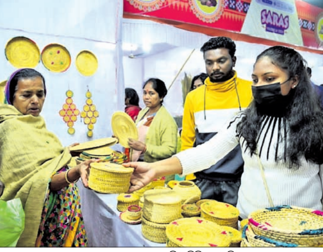
ଗ୍ରାହକମାନେ ଖୁଲରେ କିଣାକିଣି କରୁଛନ୍ତି ।

କରାଯାଇଛି । ସରସ ମେଳାରେ ମୋଟ ୨୫୦ଟି ଖୁଲ ପଡ଼ିଛି । ରାଜ୍ୟ ତଥା ରାଜ୍ୟ ବାହାରୁ ଆସିଥିବା ମହିଳା ସ୍ୱୟଂ ସହାୟକ ଗୋଷ୍ଠୀ ଓ ଉତ୍ପାଦକ ପ୍ରଦର୍ଶନ ସହ ବିକ୍ରି କରୁଛନ୍ତି । ସୁନ୍ଦରଗଡ଼ ସମେତ ବିଭିନ୍ନ ଜିଲାର ଏସଂସଦଙ୍କ ସେମାନଙ୍କ ପ୍ରସ୍ତୁତ ଚେରାକୋଟା