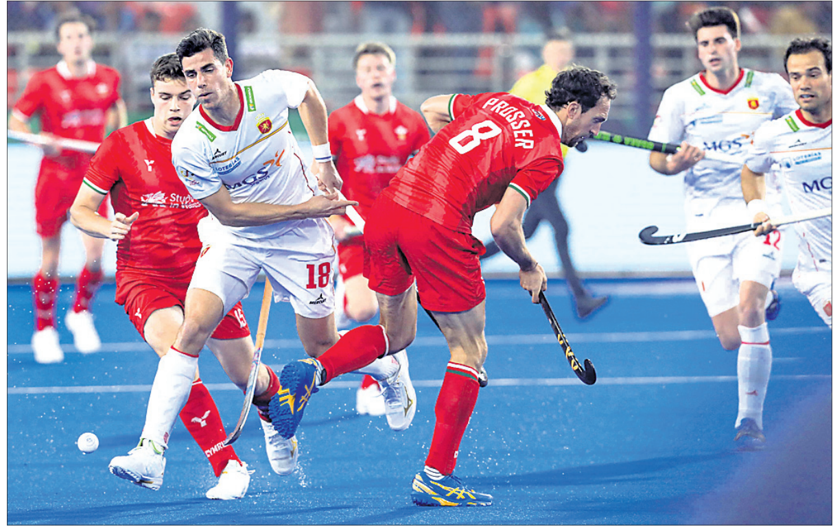
ବଲ୍ ପାଇଁ ଶ୍ରେୟ ଓ ଫ୍ଲେକ୍ସ ଖେଳାଳିଙ୍କ ମଧ୍ୟରେ ସଂଘର୍ଷ।