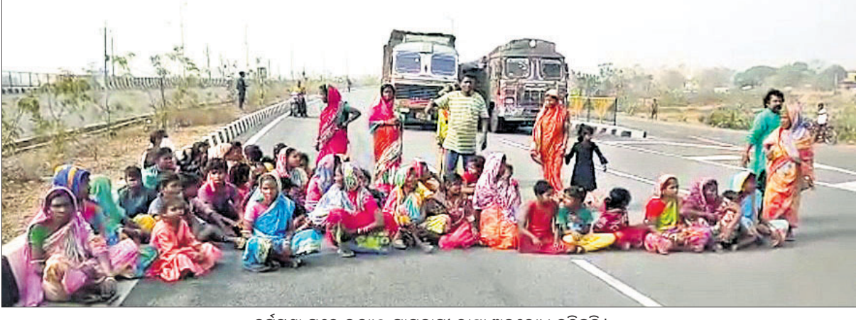
ଦୁର୍ଭିକ୍ଷା ପରେ ଉତ୍ତମ ଗ୍ରାମବାସୀ ରାସ୍ତା ଅବରୋଧ କରିଛନ୍ତି ।

ଭୁବନ, ୧୫।୧ (ଡି.ଏନ.ଏ.) ମା' ସିକ ରାମତଣ୍ଡାଙ୍କୁ ଦର୍ଶନ କରିବାକୁ ଘରୁ ବାହାରିଥିଲେ କୁହାଯାଉଛି । ହେଲେ ରାସ୍ତାରେ ମାଷ୍ଟରମାଲକ୍ସ ଟ୍ରକ୍ ଧକା ଦେଇ ୫୦ ମିଟର ଯାଏ ଘୋଷାରି ନେଲା । ଫଳରେ ଘଟଣାସ୍ଥଳରେ ଉଡ଼ିଗଲା ବାଇକ୍ ଆରୋହୀଙ୍କ ପ୍ରାଣବାୟୁ ଏବଂ ଅଧା ରହିଗଲା ଦିଅଁ ଦର୍ଶନ । ତେଜାମାଳି ଜିଲ୍ଲା ଭୁବନ ଥାନା ଜାତୀୟ ରାଜପଥ ୫୩ରେ ରବିବାର ସକାଳେ ଘଟଣା ଏଭଳି ଏକ ଦୁଃଖଦ ଦୁର୍ଘଟଣା । ମୃତକ ହେଲେ ଏସ୍‌ସିଏର ୨୩୯୯ ଓଡ଼ିଆ ଘୋଷାରି ନେଇ ଟ୍ରକ୍ ଉତ୍ତରଜନା ଦେଖାଦେଇଥିଲା । ଉତ୍ତର ଅଞ୍ଚଳବାସୀ ୫୩୩୩ ଜାତୀୟ ରାଜପଥ ଅବରୋଧ କରିଥିଲେ ।