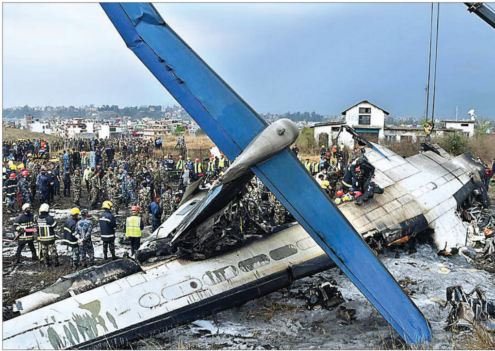
୨୦୧୮ ମାର୍ଚ୍ଚ ୧୨ରେ କାଠମାଣ୍ଡୁ ଅନ୍ତର୍ଜାତୀୟ ବିମାନବନ୍ଦର ନିକଟରେ ଦୁର୍ଘଟଣାଗ୍ରସ୍ତ ହୋଇଥିବା ବିମାନର ଭଗ୍ନାବଶେଷ।

ବିଶ୍ୱର ସର୍ବୋଚ୍ଚ ୧୪ ପର୍ବତମାଳା ମଧ୍ୟରୁ ୮ଟି କେବଳ ନେପାଳରେ ଅବସ୍ଥିତ। ଏଭଳି ଶୃଙ୍ଗରେ ହଠାତ୍ ବଦଳୁଥିବା ପାଣିପାଗ ଯୋଗୁ ଏଠାରେ ଅଧିକାଂଶ ବିମାନ ଦୁର୍ଘଟଣା ଘଟୁଥିବା ବିଶେଷଜ୍ଞମାନେ ମତ ଦିଅନ୍ତି। ନେପାଳରେ ୨୦୦୦ ମସିହାରୁ ଅଦ୍ୟାବଧି ଘଟିଥିବା ବିମାନ ଓ ହେଲିକପ୍ଟର ଦୁର୍ଘଟଣାରେ ୩୫୦ ଜଣଙ୍କ ଜୀବନ ଗଲାଣି। ଏହାକୁ ଦୃଷ୍ଟିରେ ରଖି ସୁରକ୍ଷା କାରଣରୁ ୨୦୧୩ରୁ ସୁରୋପାୟ ସଂଘ (ଇୟୁ) ନିଜ ଏୟାରସେକ୍ଟର ନେପାଳ ଏୟାରଲାଇନ୍‌ରୁ ଅଧିକ ବିମାନଗୁଡ଼ିକର ଚଳାଚଳ ଉପରେ କଟକଣା ଲାଗି କରିଛି। ଅନ୍ତର୍ଜାତୀୟ ବିମାନଗୁଡ଼ିକ ବିମାନ ଚଳାଚଳ ସଙ୍ଗଠନ (ଆଇସିଏଓ) ମଧ୍ୟ ନେପାଳ ବିମାନଗୁଡ଼ିକର ସୁରକ୍ଷାକୁ ନେଇ ପ୍ରଶ୍ନ ଉଠାଇଛି। କେନ୍ଦ୍ରୀୟ ନେପାଳରେ ଅବସ୍ଥିତ ରୁରିକମ୍ ସିଟି ପୋଖରୀ ହେଉଛି ଦେଶର ଦ୍ୱିତୀୟ ବୃହତ୍ ସହର। ଏଠାରେ ଥିବା ଅର୍ଶୁପୁର୍ଣ୍ଣା ପର୍ବତଶ୍ରେଣୀର ମନୋରମ ଦୃଶ୍ୟ ଦେଖିବା ପାଇଁ ପର୍ଯ୍ୟଟକମାନଙ୍କ ଭିଡ଼ ଲାଗିରହିଥାଏ। ରାଜଧାନୀ କାଠମାଣ୍ଡୁରୁ ସ୍ଥଳପଥରେ ପୋଖରୀ ଯିବାକୁ ହେଲେ ୬ ଘଣ୍ଟା ଲାଗିଥାଏ। କିନ୍ତୁ ମାତ୍ର ୨୫ ମିନିଟରେ ବିମାନ ଯାତ୍ରା ସମ୍ପୂର୍ଣ୍ଣ ହୋଇଥାଏ। ଚାଇନାର ବେଲ୍