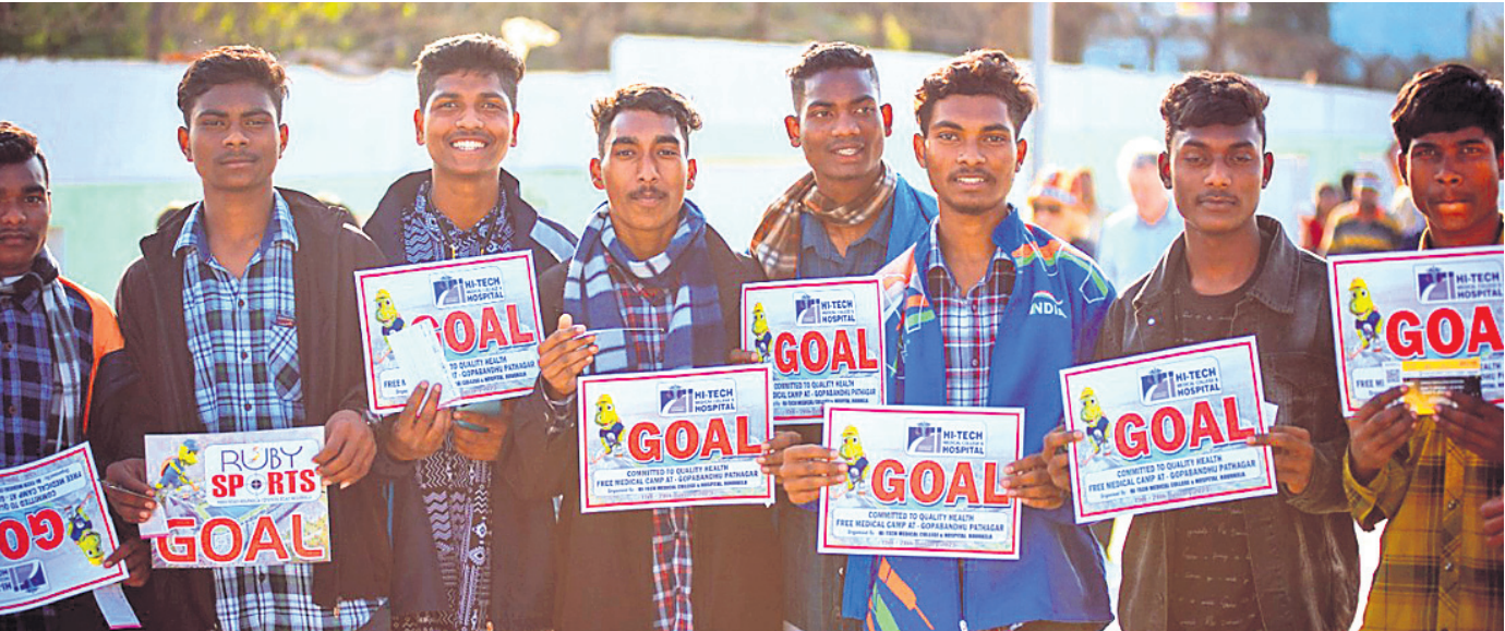
ଷ୍ଟାଡ଼ିୟମକୁ ଯିବା ପୂର୍ବରୁ ହକି ପ୍ରେମୀମାନେ ଗୋଲ ଲେଖାଥିବା ପ୍ଲାକାର୍ଡ ପ୍ରଦର୍ଶନ କରୁଛନ୍ତି ।