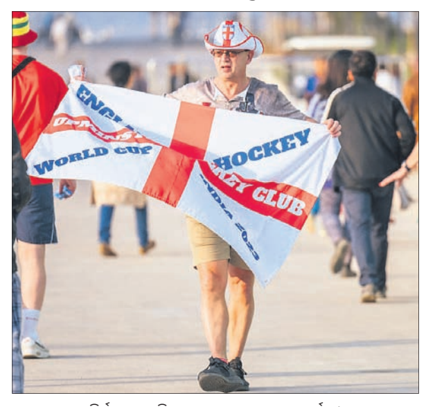
ବିଦ୍ୟାଳୟ ଷ୍ଟାଡ଼ିୟମରେ ଇଂଲଣ୍ଡ ଦଳର ସମର୍ଥକ।

ଭୁବନେଶ୍ୱର ଓ ରାଉରକେଲାରେ ଆରମ୍ଭ ହୋଇଛି ହକି ବିଶ୍ୱକପ-୨୦୨୩। ବିଶ୍ୱକପକୁ ନେଇ ସମଗ୍ର ଓଡ଼ିଶା ଉତ୍ସାହପୂର୍ଣ୍ଣ।