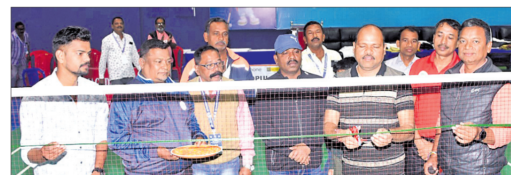
ରାଜ୍ୟ ବ୍ୟାଡମିଣ୍ଟନ ଚାମ୍ପିୟନଶିପକୁ ଅତିଥିମାନେ ଶୁଭାରମ୍ଭ କରୁଛନ୍ତି ।