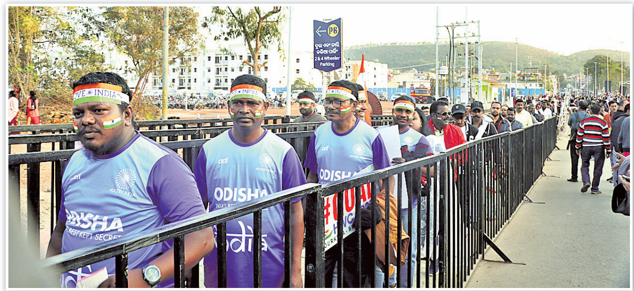
ଷ୍ଟାଡ଼ିୟମରେ ପ୍ରବେଶ ପାଇଁ ଦର୍ଶକଙ୍କ ଲମ୍ବା ଧାଡ଼ି ।