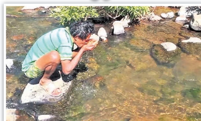
ଜଣେ ଆଦିବାସୀ ଝରଣା ପାଣି ପିଉଛନ୍ତି।

ଭବାନୀପାଟଣା, ୧୫।୧ (ସ.ପ୍ର.) ଉଭୟ କେନ୍ଦ୍ର ଓ ରାଜ୍ୟ ସରକାର ଆଦିବାସୀମାନଙ୍କ ପାଇଁ ବିଭିନ୍ନ ଯୋଜନା କରି କୋଟି କୋଟି ଟଙ୍କା ଖର୍ଚ୍ଚ କରୁଛନ୍ତି। ହେଲେ ପ୍ରଶାସନିକ ଅଧିକାରୀଙ୍କ ନାଲିଫିତା ତଳେ ସବୁ ଯୋଜନା ଅଟକି ପଡ଼ିଛି। ଏମାନଙ୍କ ପାଇଁ ନା ଅଛି ରାସ୍ତା, ଅବା ନା ଅଛି ପାନୀୟ ଜଳର ସୁଧା କିମ୍ବା ନା ଅଛି ଆବାସ ଯୋଜନାରେ ପଦା ଘର। ଆଦିବାସୀମାନେ ଜଙ୍ଗଲରେ ବାସବାସି ଜଙ୍ଗଲୀ ଜୀବଜନ୍ତୁଭଳି ବଞ୍ଚୁଛନ୍ତି।