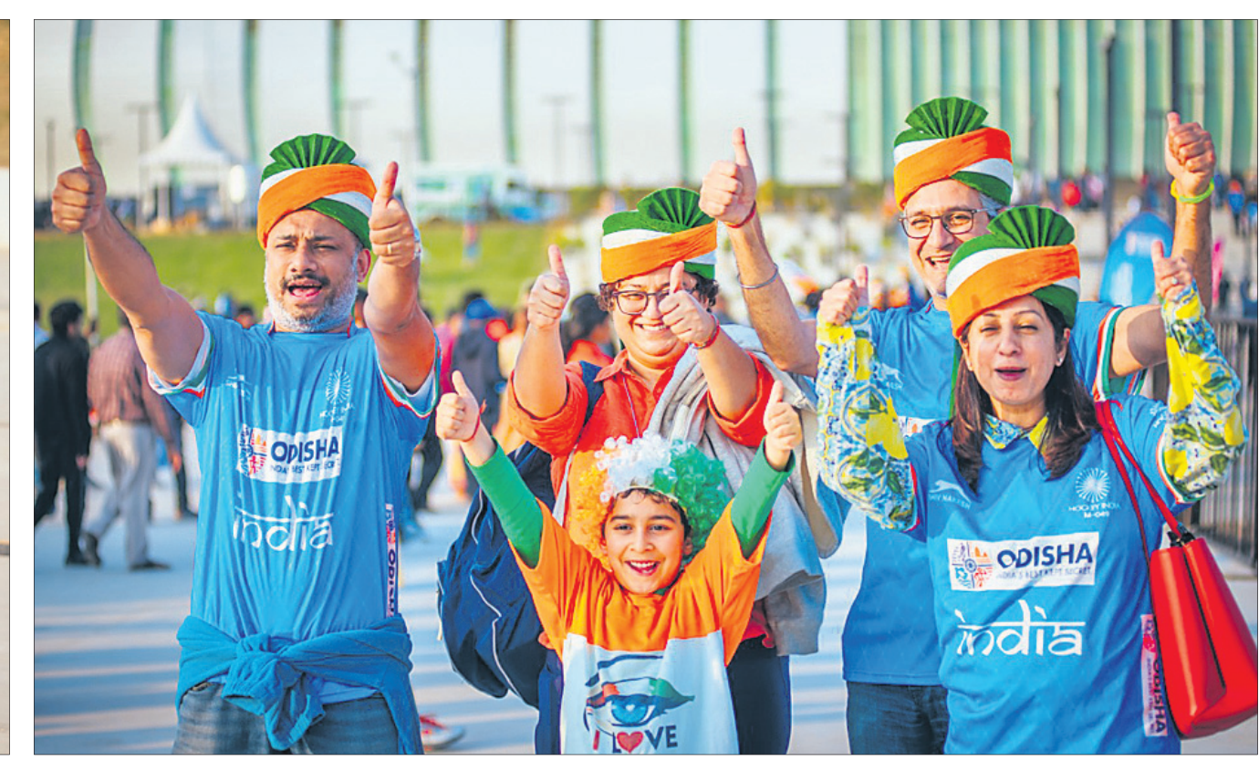
ଖୁସି ପୁହୁରିରେ ଭାରତୀୟ ଦର୍ଶକ ।