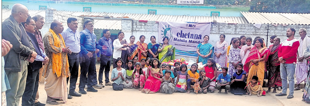
ସେବାଶ୍ରମରେ ଶିଶୁମାନଙ୍କୁ ବିଭିନ୍ନ ଉପକରଣ ବସ୍ତୁ କରାଯାଇଛି ।

ହେମନ୍ତ, ୧୫।୧।୧ (ଡି.ଏନ.ଏ.): ଏମ୍ପିଏସ୍. ଚେଟେନା ମହିଳା ମଣ୍ଡଳ ତରଫରୁ ସୁନ୍ଦରଗଡ଼ ଜିଲ୍ଲା ହେମନ୍ତ ଏକଲବ୍ୟ ସେବାଶ୍ରମରେ ଶନିବାର ଶିଶୁମାନଙ୍କୁ ଖାତା, ସେନ, ଫଳ ସହିତ ନିତ୍ୟ ବ୍ୟବହାର ସାମଗ୍ରୀ ବଣ୍ଟନ କରାଯାଇଛି । କାର୍ଯ୍ୟକ୍ରମରେ