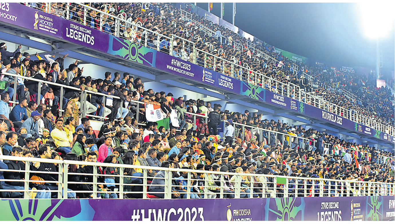
ଭାରତ-ଇଂଲଣ୍ଡ ମ୍ୟାଚ୍ ଅବସରରେ ବିର୍ଯ୍ୟ ପୁତ୍ରୀ ଷ୍ଟାଡ଼ିୟମରେ ଉପସ୍ଥିତ ଦର୍ଶକ ।

ନିକୋଲସ୍ ଦଳକୁ ସମର୍ଥନ କରିବା ପାଇଁ ଆମେ ଇଂଲଣ୍ଡରୁ ଆଜିକୁ ଏକ ସପ୍ତାହ ହେବ ରାଉରକେଲା ଆସି ରହିଛୁ ବୋଲି ନିକୋଲସ୍ ବାପା ଜନ କହିଥିଲେ । -ରିପୋର୍ଟ: ଦିନେଶ ମିଶ୍ର