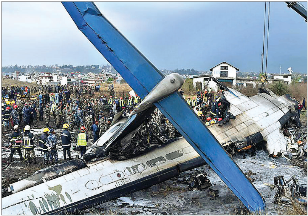
୨୦୧୮ ମାର୍ଚ୍ଚ ୧୨ରେ କାଠମାଣ୍ଡୁ ଅନ୍ତର୍ଜାତୀୟ ବିମାନବନ୍ଦର ନିକଟରେ ଦୁର୍ଘଟଣାଗ୍ରସ୍ତ ହୋଇଥିବା ବିମାନର ଭଗ୍ନାବଶେଷ।

ବିଶ୍ୱର ସର୍ବୋଚ୍ଚ ୧୪ ପର୍ବତମାଳା ମଧ୍ୟରୁ ୮ଟି କେବଳ ନେପାଳରେ ଅବସ୍ଥିତ। ଏଭଳି ଶୃଙ୍ଗରେ ହଠାତ୍ ବଦଳୁଥିବା ପାଣିପାଗ ଯୋଗୁ ଏଠାରେ ଅଧିକାଂଶ ବିମାନ ଦୁର୍ଘଟଣା ଘଟୁଥିବା ବିଶେଷଜ୍ଞମାନେ ମତ ଦିଅନ୍ତି। ନେପାଳରେ ୨୦୦୦ ମସିହାରୁ ଅଦ୍ୟାବଧି ଘଟିଥିବା ବିମାନ ଓ ହେଲିକପ୍ଟର ଦୁର୍ଘଟଣାରେ ୩୫୦ ଜଣଙ୍କ ଜୀବନ ଗଲାଣି। ଏହାକୁ ଦୃଷ୍ଟିରେ ରଖି ସୁରକ୍ଷା କାରଣରୁ ୨୦୧୩ରୁ ସୁରୋପାୟ, ସଂଘ (ଇୟୁ) ନିଜ ଏୟାରସେକ୍ଟ ନେପାଳୀ ଏୟାରଲାଇନ୍ସ୍ ଅଧୀନ ବିମାନଗୁଡ଼ିକର ଚଳାଚଳ ଉପରେ କଟକଣା ଲାଗି କରିଛି। ଅନ୍ତର୍ଜାତୀୟ ବିମାନଗୁଡ଼ିକ ବିମାନ ଚଳାଚଳ ସଙ୍ଗଠନ (ଆଇସିଏଓ) ମଧ୍ୟ ନେପାଳ ବିମାନଗୁଡ଼ିକର ସୁରକ୍ଷାକୁ ନେଇ ପ୍ରଶ୍ନ ଉଠାଇଛି। କେନ୍ଦ୍ରୀୟ ନେପାଳରେ ଅବସ୍ଥିତ ରୁରିକମ୍ ସିଟି ପୋଖରୀ ହେଉଛି ଦେଶର ତୃତୀୟ ବୃହତ୍ ସହର। ଏଠାରେ ଥିବା ଅର୍ଶୁପୁର୍ଣ୍ଣା ପର୍ବତଶ୍ରେଣୀର ମନୋରମ ଦୃଶ୍ୟ ଦେଖିବା ପାଇଁ ପର୍ଯ୍ୟଟକମାନଙ୍କ ଭିଡ଼ ଲାଗିରହିଥାଏ। ରାଜଧାନୀ କାଠମାଣ୍ଡୁରୁ ସ୍ଥଳପଥରେ ପୋଖରୀ ଯିବାକୁ ହେଲେ ୬ ଘଣ୍ଟା ଲାଗିଥାଏ। କିନ୍ତୁ ମାତ୍ର ୨୫ ମିନିଟରେ ବିମାନ ଯାତ୍ରା ସମ୍ପୂର୍ଣ୍ଣ ହୋଇଥାଏ। ଚାଇନାର ବେଲ୍