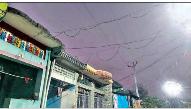
ଜନବସତି ଭାବରେ ବିକ୍ରୟ ତାର।

ନିଆଯାଇ ନାହିଁ। ବିକ୍ରୟ ସମ୍ପର୍କରେ ଜନବସତି ଭାବରେ ବିକ୍ରୟ ତାର, ଜନବସତି, ଛକ ବଜାର, ସହରାଞ୍ଚଳ ଆଦି ସ୍ଥାନରେ ସୁରକ୍ଷିତ ବିକ୍ରୟ ପରିବର୍ତ୍ତନ ପରିଲକ୍ଷିତ ହେଉନାହିଁ। ଚାଟା ପାଖାର ବର୍ତ୍ତମାନ ଉପଭୋକ୍ତା ନାଁରେ ଥିବା ବକେୟା ବିଲକୁ ଆଦା କରିବାରେ ଅଧିକ ଗୁରୁତ୍ୱ ଦେଉଥିବା ଦେଖିବାକୁ ମିଳୁଛି। ବର୍ତ୍ତମାନ ଯେଉଁ ଗ୍ରାହକଙ୍କ ଅଭିଯୋଗ ପାଇଁ ଏକ ଟେକ୍ସଟ୍ ମେସେଜ୍ କରିବା କଥା ଚାହା ହେଉଅଛି ବା ଲୋକଙ୍କ ମୁହଁକୁ ଶୁଣିବାକୁ ମିଳୁଛି ନିୟମାବଳୀ, କମ୍ପାନୀ ସହ ରୁକ୍ଷିତ ବେଳେ ନିରନ୍ତର ବିକ୍ରୟ ତାର, ଜନବସତି, ଛକ ବଜାର, ସହରାଞ୍ଚଳ ଆଦି ସ୍ଥାନରେ ସୁରକ୍ଷିତ ବିକ୍ରୟ ପରିବର୍ତ୍ତନ ପରିଲକ୍ଷିତ ହେଉନାହିଁ। ବିକ୍ରୟ ତାର ବିକାଶ ଓ ଅଧିକାରୀଙ୍କ ନିୟମାବଳୀ ପରିବର୍ତ୍ତନ ପରିଲକ୍ଷିତ ହେଉନାହିଁ। ବିକ୍ରୟ ତାର ବିକାଶ ଓ ଅଧିକାରୀଙ୍କ ନିୟମାବଳୀ ପରିବର୍ତ୍ତନ ପରିଲକ୍ଷିତ ହେଉନାହିଁ।