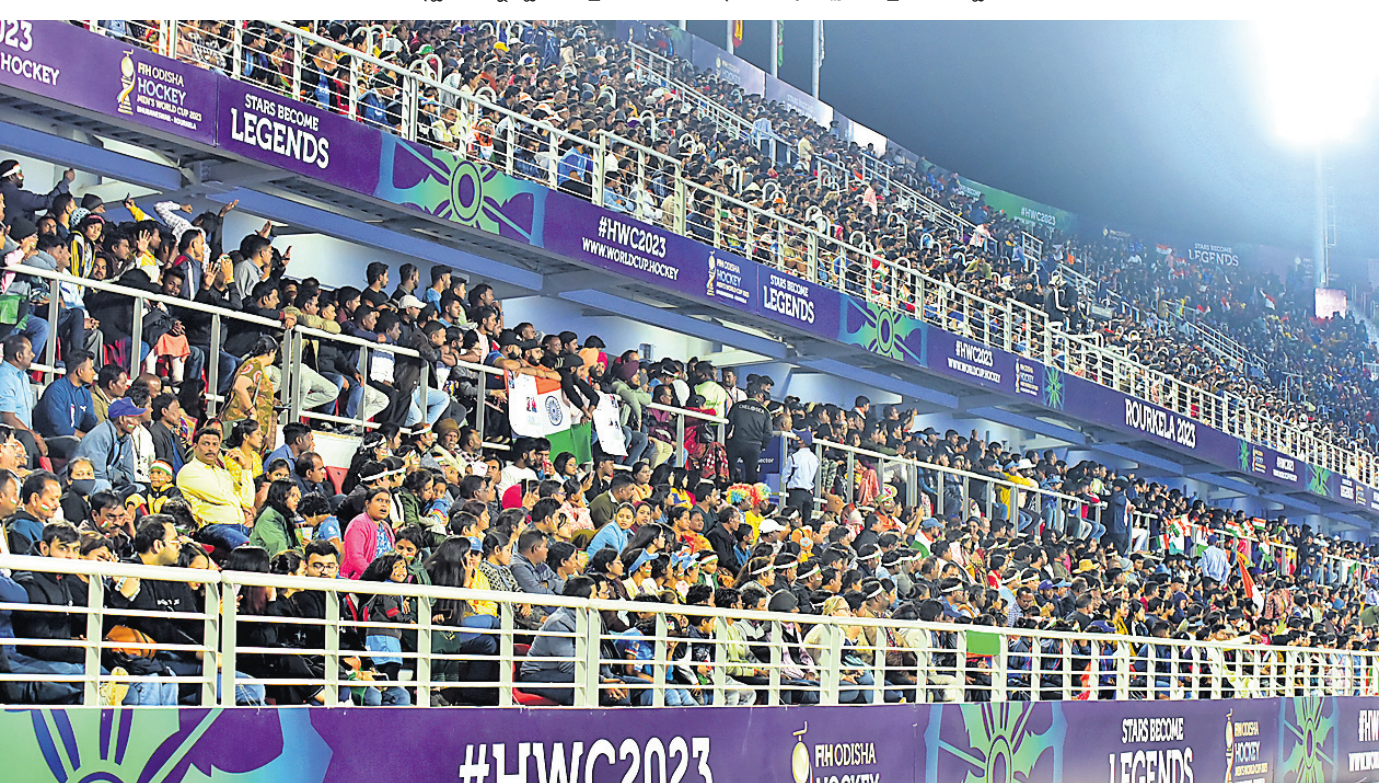
ଭାରତ-ଇଂଲଣ୍ଡ ମ୍ୟାଚ୍ ଅବସରରେ ବିର୍ଯ୍ୟ ପୁତ୍ରୀ ଷ୍ଟାଡ଼ିୟମରେ ଉପସ୍ଥିତ ଦର୍ଶକ ।

ନିକୋଲସ୍ ଦଳକୁ ସମର୍ଥନ କରିବା ପାଇଁ ଆମେ ଇଂଲଣ୍ଡରୁ ଆଜିକୁ ଏକ ସପ୍ତାହ ହେବ ରାଉରକେଲା ଆସି ରହିଛୁ ବୋଲି ନିକୋଲସ୍ ବାପା ଜନ କହିଥିଲେ । -ରିପୋର୍ଟ: ଦିନେଶ ମିଶ୍ର