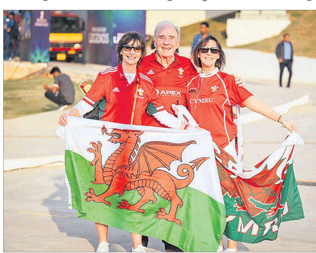
ବିର୍ଯ୍ୟ ପୁତ୍ରୀ ଷ୍ଟାଡ଼ିୟମରେ ଖେଳୁ ଦଳର ସମର୍ଥକ ।