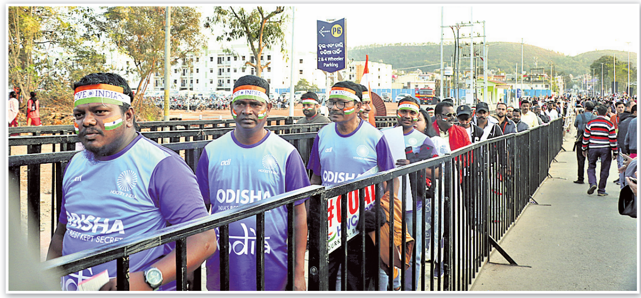
ଷ୍ଟାଡ଼ିୟମରେ ପ୍ରବେଶ ପାଇଁ ଦର୍ଶକଙ୍କ ଲମ୍ବା ଧାଡ଼ି ।