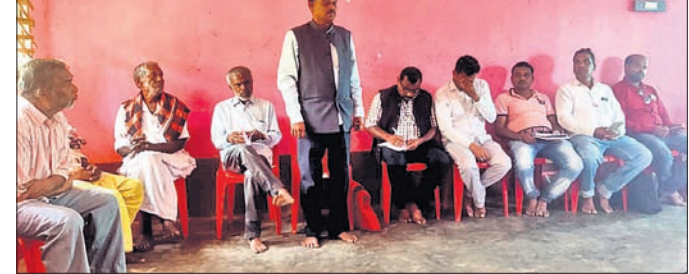
ସମ୍ମିଳନୀରେ ଉପସ୍ଥିତ ଭାରତୀୟ କମ୍ୟୁନିଷ୍ଟ ପାର୍ଟିର ନେତୃବୃନ୍ଦ।