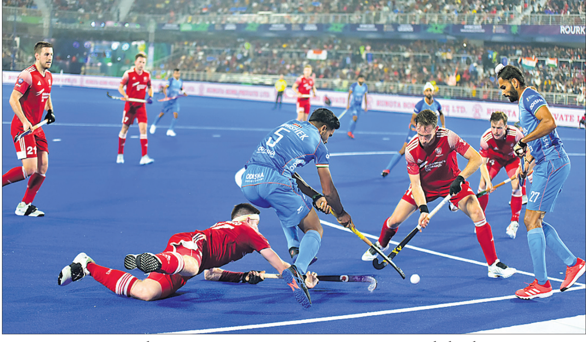
ରାଉରକେଲାର ବିଦ୍ୟାପୁଣ୍ଡା ଷ୍ଟାଡ଼ିୟମରେ ରବିବାର ଅନୁଷ୍ଠିତ ଭାରତ-ଇଂଲଣ୍ଡ ମ୍ୟାଚର ଏକ ସଂଘର୍ଷପୂର୍ଣ୍ଣ ମୁହୂର୍ତ୍ତ।