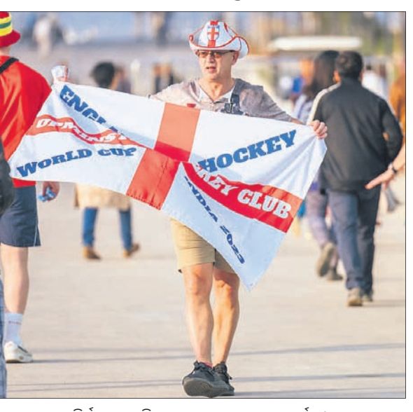
ବିଦ୍ୟାପୁଣ୍ଡା ଷ୍ଟାଡ଼ିୟମରେ ଇଂଲଣ୍ଡ ଦଳର ସମର୍ଥକ।

ଭୁବନେଶ୍ୱର ଓ ରାଉରକେଲାରେ ଆରମ୍ଭ ହୋଇଛି ହକି ବିଶ୍ୱକପ-୨୦୨୩। ବିଶ୍ୱକପକୁ ନେଇ ସମଗ୍ର ଓଡ଼ିଶା ଉତ୍ସାହପୂର୍ଣ୍ଣ।