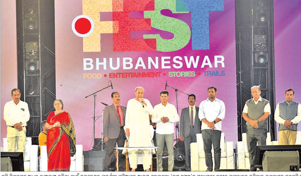
ହଳି ବିଶ୍ୱକର୍ମକୁ ଅଧିକ ରକ୍ଷାକର୍ମ କରିବା ପାଇଁ ଭୁବନେଶ୍ୱର ପ୍ରଦର୍ଶନୀ ପଡ଼ିଆରେ ଆରମ୍ଭ ହୋଇଥିବା 'ଡର୍ ଫେଷ୍ଟ୍'ରୁ ପ୍ରଶଂସାମଣ୍ଡା ନବୀନ ପଟ୍ଟନାୟକ ରିବିଦାର ଉଦ୍‌ଘାଟନ କରୁଛନ୍ତି ।