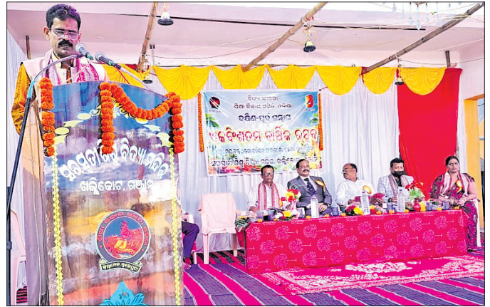
ଉତ୍ସବରେ ଉପସ୍ଥିତ ଅତିଥି