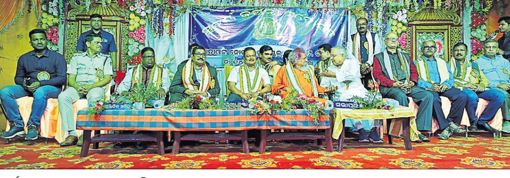
ସୁବର୍ଣ୍ଣ ଜୟନ୍ତୀ ଉତ୍ସବରେ ମହାସାଧନ ଅତିଥି