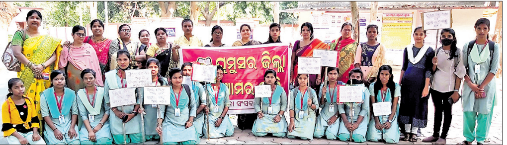
ଶୋଭାଯାତ୍ରାରେ ସାମିଲ ହୋଇଥିବା କର୍ମକର୍ତ୍ତା।

ଘୁମୁସର ଜିଲା ଦାବି ନେଇ ରବିବାର ମଧ୍ୟାହ୍ନରେ ଘୁମୁସର ଲେଖିକା ସଂସଦ ପକ୍ଷରୁ ଉଦ୍ଧାରଣ ଯାତ୍ରାରେ ୮୦୦ ମାମଲା ଉଦ୍ଧାରଣ ପର୍ଯ୍ୟନ୍ତ ଯାଇଥିଲା। ଶୋଭାଯାତ୍ରୀ ବାହାରି ଉପଜିଲାପାଳଙ୍କ କାର୍ଯ୍ୟାଳୟ ପର୍ଯ୍ୟନ୍ତ ଯାଇଥିଲା। ଉଦ୍ଧାରଣ ପର୍ଯ୍ୟନ୍ତ ଯାତ୍ରାରେ ୮୦୦ ମାମଲା ଉଦ୍ଧାରଣ ପର୍ଯ୍ୟନ୍ତ ଯାଇଥିଲା। ଉଦ୍ଧାରଣ ପର୍ଯ୍ୟନ୍ତ ଯାତ୍ରାରେ ୮୦୦ ମାମଲା ଉଦ୍ଧାରଣ ପର୍ଯ୍ୟନ୍ତ ଯାଇଥିଲା।