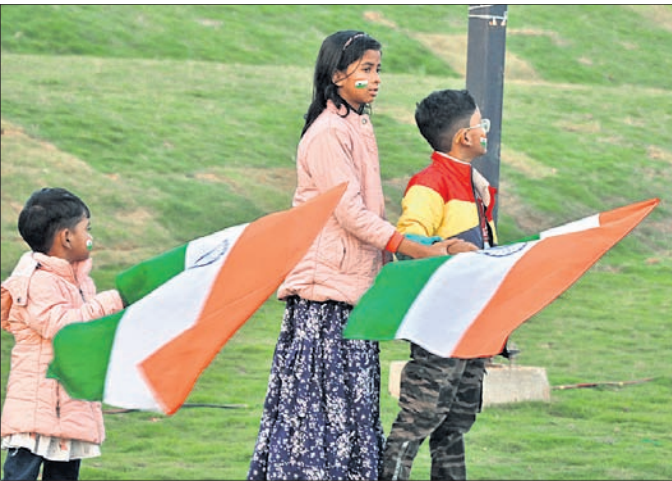
ରାଉରକେଲାରେ ବିର୍ଯ୍ୟ ପୁତ୍ରୀ ଷ୍ଟାଡ଼ିୟମକୁ କୁନି ପିଲାମାନେ ଦ୍ରୁତଗା ଧରି ପ୍ରବେଶ କରୁଛନ୍ତି ।