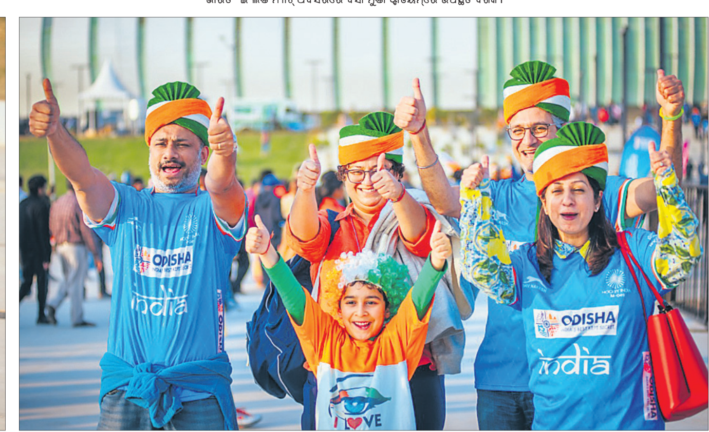
ଖୁସି ମୁହୂର୍ତ୍ତରେ ଭାରତୀୟ ଦର୍ଶକ ।