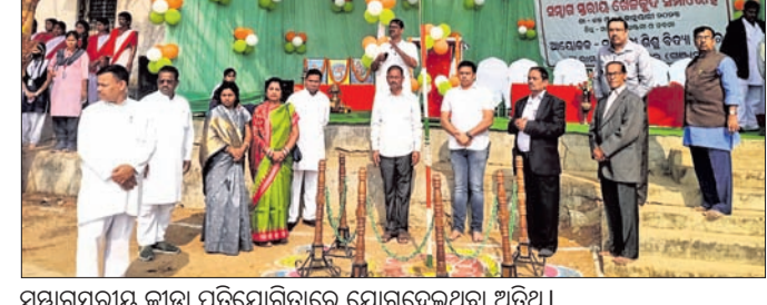
ସମାଗସ୍ତରୀୟ କ୍ରୀଡ଼ା ପ୍ରତିଯୋଗିତାରେ ଯୋଗଦେଇଥିବା ଅତିଥି