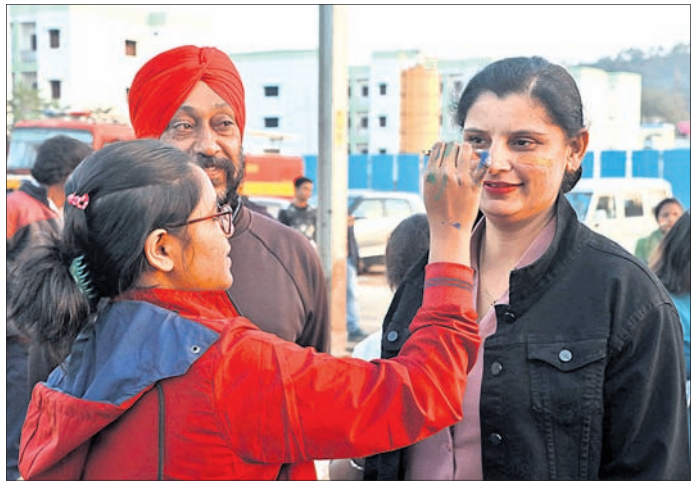
ଜଣେ ପ୍ରଶଂସକ ପୁଅକୁ ଚିତ୍ରିତ କରୁଛନ୍ତି ।