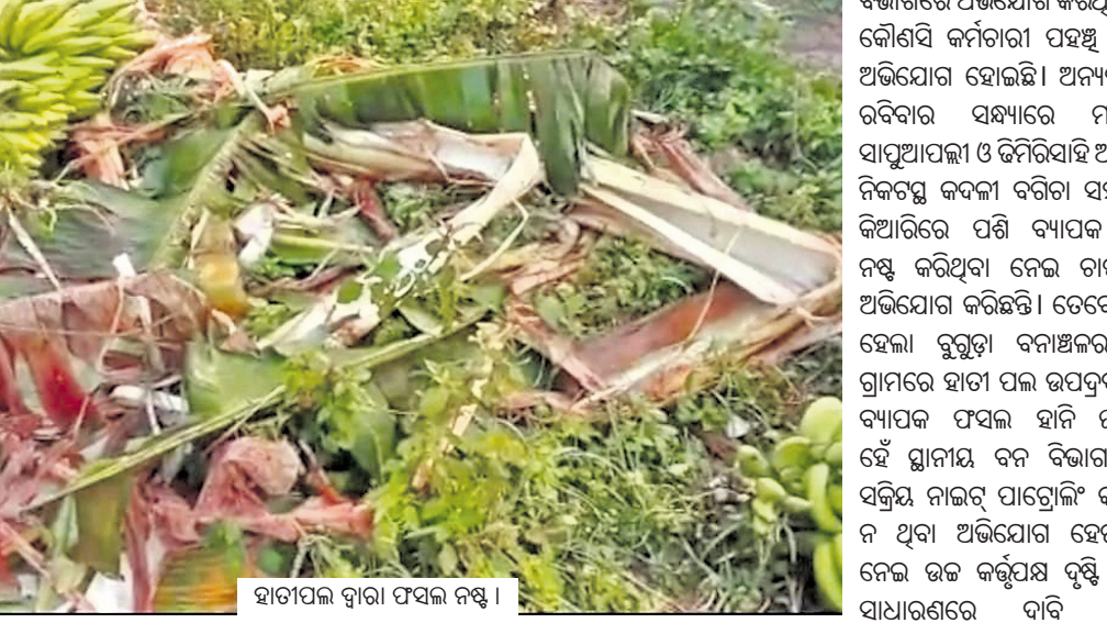
ହାତୀପଲ ବ୍ୱାରେ ଫସଲ ନଷ୍ଟ।