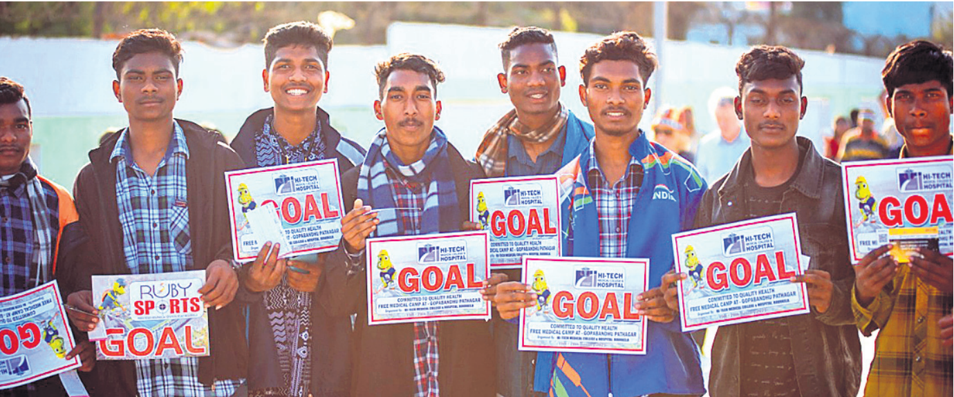
ଷ୍ଟାଡ଼ିୟମକୁ ଯିବା ପୂର୍ବରୁ ହକି ପ୍ରେମୀମାନେ ଗୋଲ ଲେଖାଥିବା ପ୍ଲାକାର୍ଡ ପ୍ରଦର୍ଶନ କରୁଛନ୍ତି ।