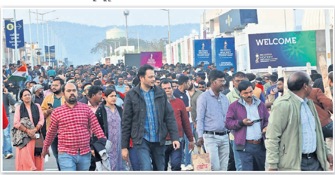
ଷ୍ଟାଡ଼ିୟମରେ ପ୍ରବେଶ ପାଇଁ ଦର୍ଶକଙ୍କ ଲମ୍ବା ଧାଡ଼ି ।