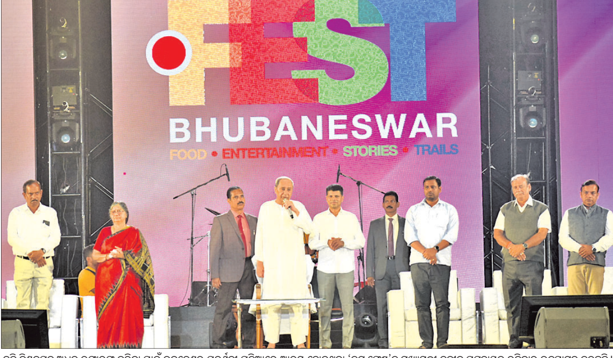
ହରି ବିଷ୍ଣୁକପୁରୁ ଅଧିକ ରଙ୍ଗରଙ୍ଗ କରିବା ପାଇଁ ଭୁବନେଶ୍ୱର ପ୍ରଦର୍ଶନୀ ପଡ଼ିଆରେ ଆରମ୍ଭ ହୋଇଥିବା 'ଡ଼' ଫେଷ୍ଟିଭୁକୁ ପୁଞ୍ଜିମନ୍ତ୍ରୀ ନବୀନ ପଟ୍ଟନାୟକ ରବିବାର ଉଦ୍‌ଘାଟନ କରୁଛନ୍ତି ।