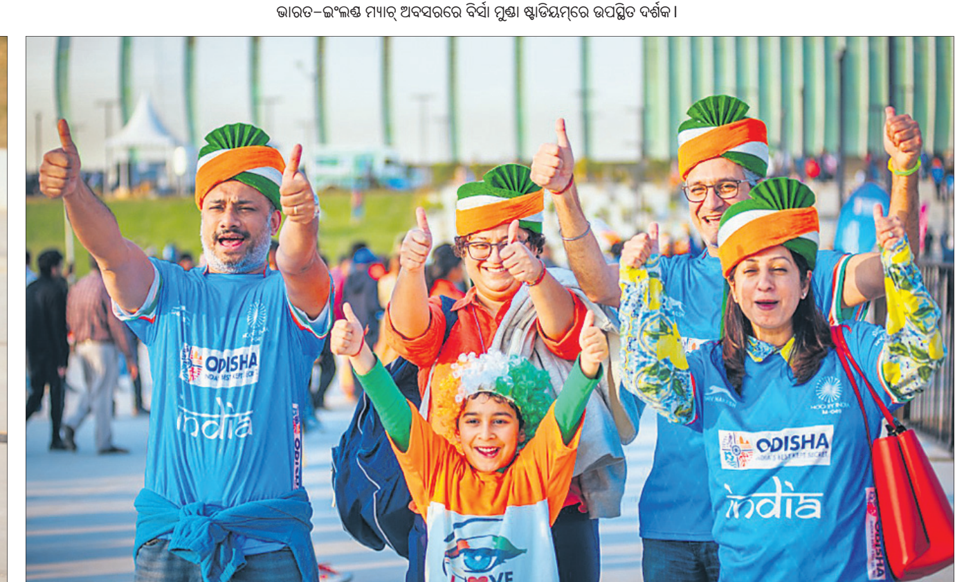
ଖୁସି ପୁହୁରିରେ ଭାରତୀୟ ଦର୍ଶକ ।