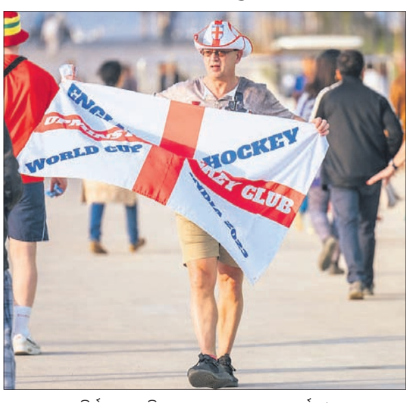
ବିଦ୍ୟାଳୟ ଷ୍ଟାଡ଼ିୟମରେ ଇଂଲଣ୍ଡ ଦଳର ସମର୍ଥକ।

ଭୁବନେଶ୍ୱର ଓ ରାଉରକେଲାରେ ଆରମ୍ଭ ହୋଇଛି ହକି ବିଶ୍ୱକପ-୨୦୨୩। ବିଶ୍ୱକପକୁ ନେଇ ସମଗ୍ର ଓଡ଼ିଶା ଉତ୍ସାହପୂର୍ଣ୍ଣ।