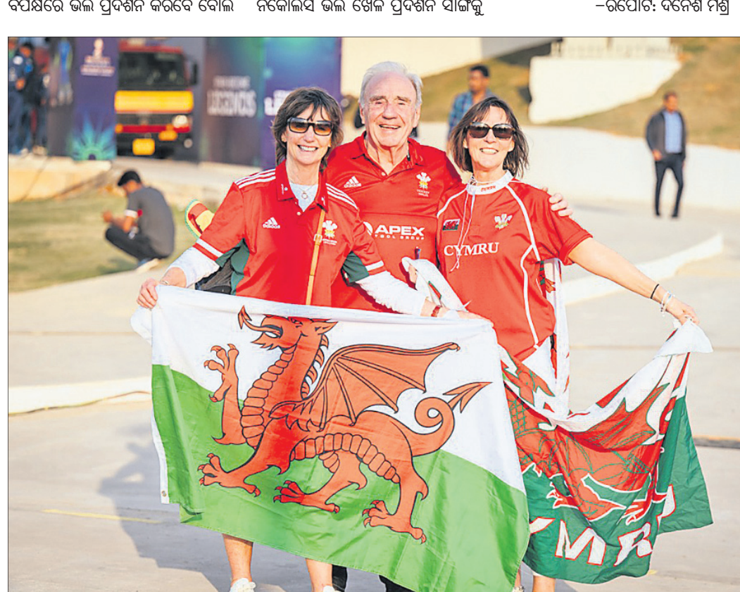
ବିର୍ଯ୍ୟ ପୁତ୍ରୀ ଷ୍ଟାଡ଼ିୟମରେ ଖେଳୁ ଦଳର ସମର୍ଥକ ।