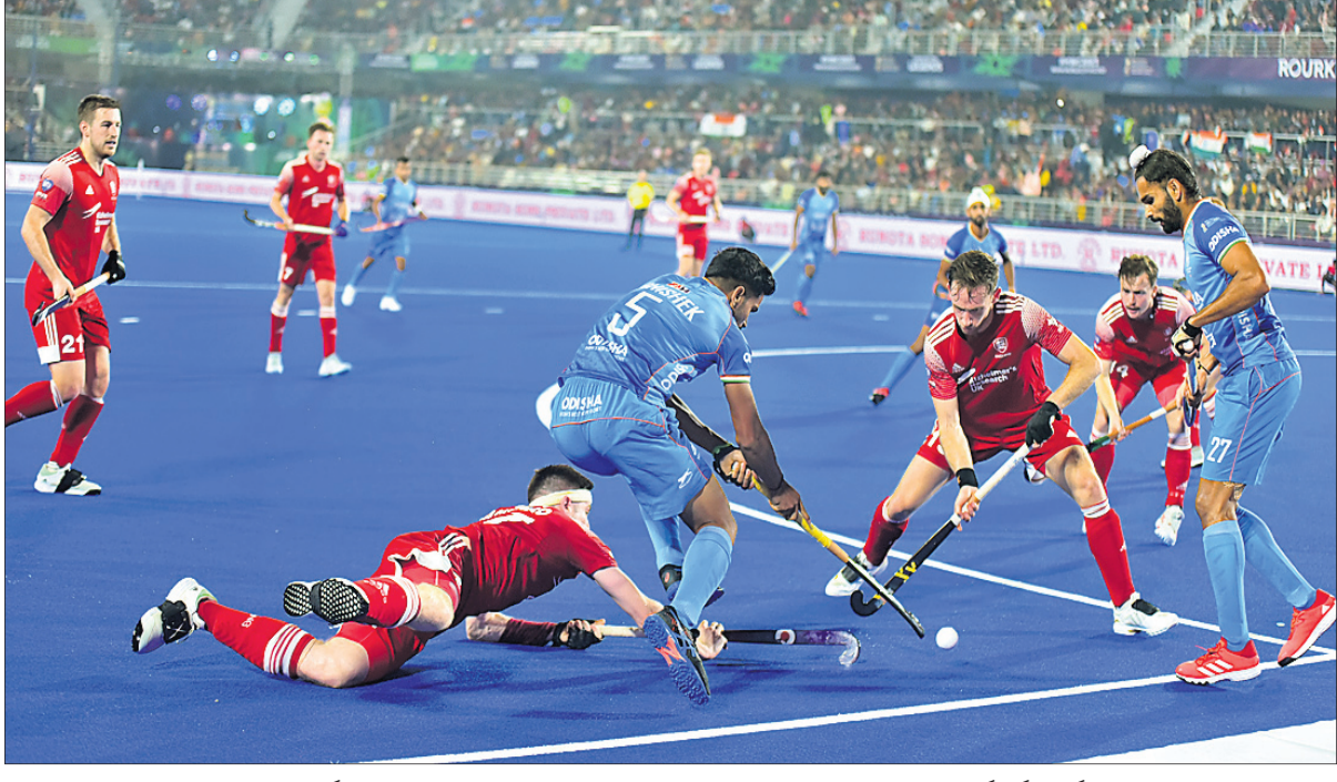
ରାଉରକେଲାର ବିଦ୍ୟାଳୟ ଷ୍ଟାଡ଼ିୟମରେ ରବିବାର ଅନୁଷ୍ଠିତ ଭାରତ-ଇଂଲଣ୍ଡ ମ୍ୟାଚର ଏକ ସଂଘର୍ଷପୂର୍ଣ୍ଣ ମୁହୂର୍ତ୍ତ।

ସକ୍ଷମ ହୋଇଥିଲେ। ତେବେ ମ୍ୟାଚ୍ ଶେଷହେବାର ୩ ମିନିଟ୍ ପୂର୍ବରୁ ନିରାଲେକ୍ଷ୍ମ ବ୍ୟକ୍ତିଗତ ଦ୍ୱିତୀୟ ଏବଂ ଦଳ ପକ୍ଷରୁ ୫ମ ଗୋଲଟି ଘୋର କରି ଶ୍ରେୟ ଶିବିରରେ ଖୁସିକୁ ଦ୍ୱିଗୁଣିତ କରିଥିଲେ।