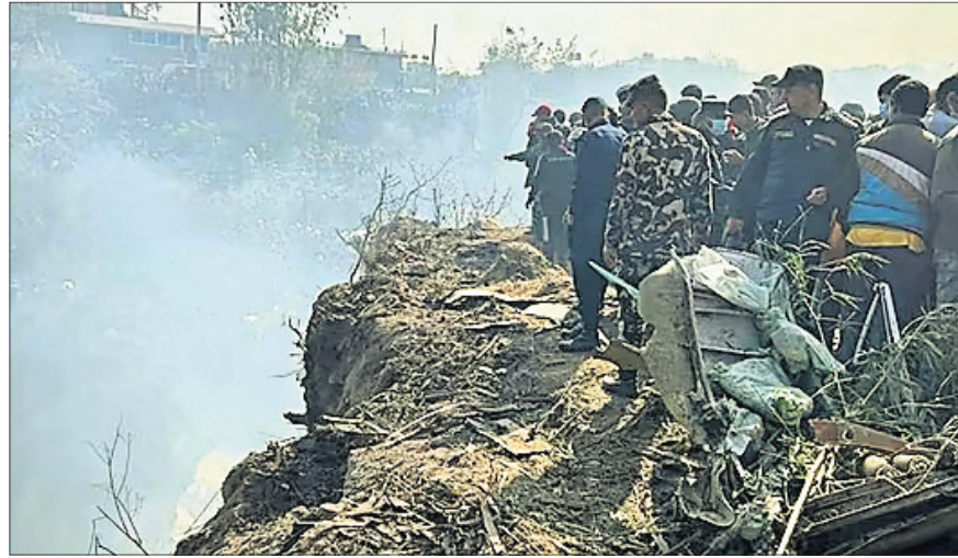
ଦୁର୍ଘଟଣାଗ୍ରସ୍ତ ବିମାନରେ ଲାଗିଥିବା ନିଆଁକୁ ଲିଭାଯାଉଛି।