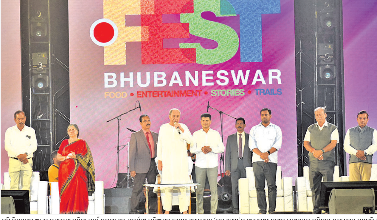
ହରି ବିଶ୍ୱକର୍ମକୁ ଅଧିକ ରକ୍ଷାକର୍ମ କରିବା ପାଇଁ ଭୁବନେଶ୍ୱର ପ୍ରଦର୍ଶନୀ ପଡ଼ିଆରେ ଆରମ୍ଭ ହୋଇଥିବା 'ଡ଼' ଫେଷ୍ଟିଭାକୁ ପ୍ରଘୋଷଣା ନବୀନ ପଟ୍ଟନାୟକ ରବିବାର ଉଦ୍‌ଘାଟନ କରୁଛନ୍ତି ।