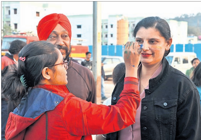
ଜଣେ ପ୍ରଶଂସକ ପୁଅକୁ ଚିତ୍ରିତ କରୁଛନ୍ତି ।