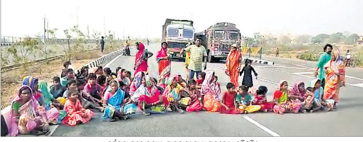
ଦୁର୍ଘଟଣା ପରେ ଉଦ୍ଧୃତ ଗ୍ରାମବାସୀ ରାସ୍ତା ଅବରୋଧ କରିଛନ୍ତି ।

ବାଇକ୍ ଚାଳକ ମୃତ ଅଥା ରହିଗଲା ରାମଚଣ୍ଡୀଙ୍କ ଦର୍ଶନ