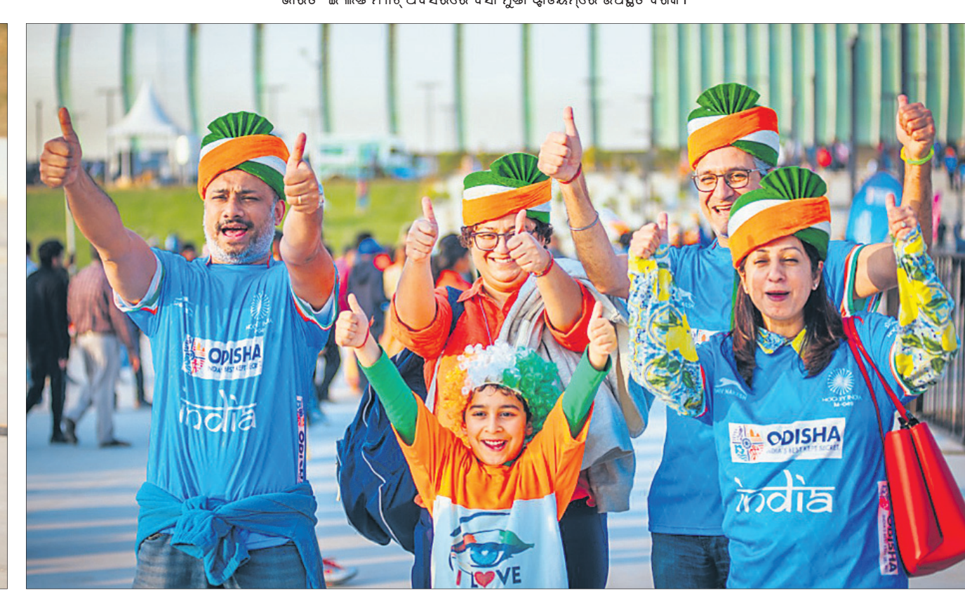
ଖୁସି ମୁହୂର୍ତ୍ତରେ ଭାରତୀୟ ଦର୍ଶକ ।