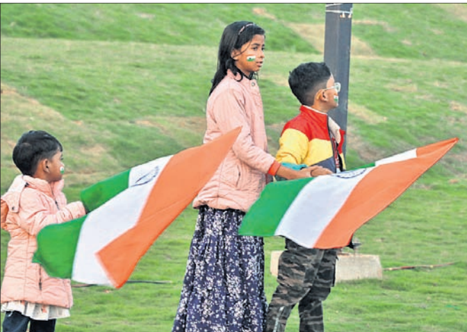
ରାଉରକେଲାରେ ବିର୍ଯ୍ୟ ପୁତ୍ରୀ ଷ୍ଟାଡ଼ିୟମକୁ କୁନି ପିଲାମାନେ ଦ୍ରୁତଗା ଧରି ପ୍ରବେଶ କରୁଛନ୍ତି ।