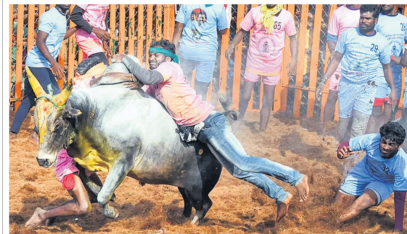
ପୋଙ୍ଗାଳ ଅବସରରେ ମଦୁରାଇରେ ଜଲିକାଟୁ ପ୍ରତିଯୋଗିତାରେ ଭାଗ ନେଇଥିବା ଯୁବକମାନେ ଷଷ୍ଠକୁ କାବୁ କରିବା ଲାଗି ଉଦ୍ୟମ କରୁଛନ୍ତି।

ଜୋଷୀମଠ, ୧୬୧ ଉତ୍ତରାଖଣ୍ଡ ଚମୋଲି ଜିଲ୍ଲାର ଜୋଷୀମଠ ସହର ଦିନକୁ ଦିନ ବଦିବାରେ ଲାଗିଛି। ସହରର ୮୪୯ ବିଲ୍ଡିଂରେ ଫାଟ ଦେଖାଯାଇଥିବାବେଳେ ୧୬୫ଟି ବିଲ୍ଡିଂ ବିପଦସଙ୍କୁଳ ଜୋନ୍‌ରେ ରହିଥିବା ସେମାନଙ୍କୁ ସ୍ଥାନାନ୍ତର ପ୍ରଶାସନ ପକ୍ଷରୁ କୁହାଯାଇଛି। ଜୋଷୀମଠର ୨୩୭ ପରିବାରର ପାଖାପାଖି ୮୦୦ ଜଣଙ୍କୁ ଅସ୍ଥାୟୀ ରିଲିଫ୍ ଶିବିରକୁ ସ୍ଥାନାନ୍ତର କରାଯାଇଥିବା ରାଜ୍ୟ ବିପର୍ଯ୍ୟୟ