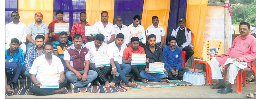
ବିଦ୍ୟାଳୟ ସମ୍ମୁଖରେ ଧାରଣାରେ ବସିଥିବା ପୁରାତନ ଛାତ୍ରମାନେ ।

କାର୍ଯ୍ୟସୂଚୀ ଅନୁଯାୟୀ ରଞ୍ଜନୀୟ ଶ୍ରୀଚୈତନ୍ୟ ଘଣ୍ଟ ମୁଦଙ୍ଗ ସଂଘ ଓ ଲୋକନୃତ୍ୟ ପକ୍ଷରୁ ପଶୁ ମୁଖା ନୃତ୍ୟ, ଗଜପତିର ତୁମ୍ପୁଲ ଲଞ୍ଜିଆ ଯୋରା ନୃତ୍ୟ ବଦ ପକ୍ଷରୁ ଲଞ୍ଜିଆ ସୌରା, ପଶୁମୁଦଙ୍ଗର ନନ୍ଦିନୀ ମୁଦଙ୍ଗ ଆର୍ତ୍ତ ସମ୍ପର୍କ ମଣ୍ଡଳୀ, କଟକର ସିଂଘମ ତ୍ୟାଗ୍ରୁ ଏକାଡେମୀ ପକ୍ଷରୁ ମତର୍ନ ତ୍ୟାଗ୍ରୁ, ସମଲପୁରର ରଞ୍ଜନୀୟ ସଂସ୍କୃତିକ ଅନୁଷ୍ଠାନ ପକ୍ଷରୁ ସମଲପୁରୀ ତ୍ୟାଗ୍ରୁ ଦେଖିବାକୁ ମିଳିଥିଲା । ସବୁଠାରୁ ଅଧିକ ଆକର୍ଷଣ ସୃଷ୍ଟି କରିଥିଲା ଲଞ୍ଜିଆର ଆଲତଳ ଫ୍ରେମ୍ ସଂକଳିତ ଦାନିଶ ଓ ତାଙ୍କ ବ୍ୟାଘ୍ର ବ୍ରାଉ ଅନୁଷ୍ଠିତ ମୁଖିକାଳ ନାଚ । ଏହା ଲୋକଙ୍କୁ ଭରପୂର ମନୋରଞ୍ଜନ ଦେଇଥିଲା ।