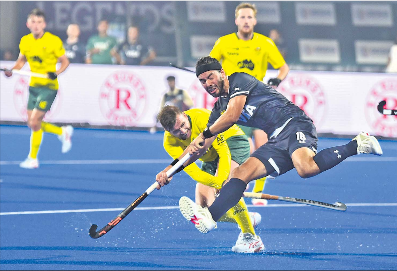
ଭୁବନେଶ୍ୱରସ୍ଥିତ କଳିଙ୍ଗ ଷ୍ଟାଡିୟମରେ ଯୋଗବାର ଅଷ୍ଟ୍ରେଲିଆ ଓ ଆର୍ଜେଣ୍ଟିନା ମଧ୍ୟରେ ଅନୁଷ୍ଠିତ ହକି ବିଶ୍ୱକପ୍ ମ୍ୟାଚ୍ରେ ଏକ ସଂଘର୍ଷପୂର୍ଣ୍ଣ ମୁହୂର୍ତ୍ତ।