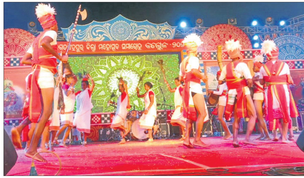
କଳାକାରମାନେ ନୃତ୍ୟ ପରିବେଷଣ କରୁଛନ୍ତି।