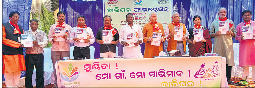
ଅତିଥିମାନେ ପୁସ୍ତକ ଉନ୍ନତକର କରୁଛନ୍ତି ।