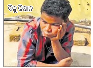
ଦେବଗଡ଼, ୧୬୧୧ (ଡି.ଏନ୍.ଏ.)