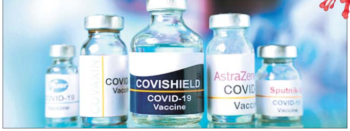
ପୁରୀ, ୧୬୧୧