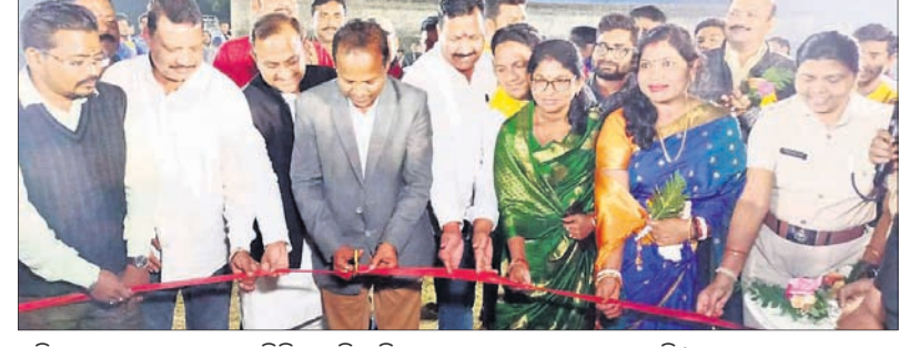
ଅତିଥିକ ବାସୀ ଅରଡ଼ବଜାର ପ୍ରିମିୟର ଲିଗ୍ ସିନେ-୪ର ଉଦଘାଟନା କରାଯାଇଛି ।

ଭୁବନେଶ୍ୱର, ୧୭/୧ (ସ.ପ୍ର.): ଭଦ୍ରକ ଜିଲାର ଭୁବନେଶ୍ୱରୀ ବ୍ଲକ୍ ଅଧୀନ କଳମଖୁଆ ପଞ୍ଚାୟତର କରଖିଲୁଗୁପୁର ଗ୍ରାମରେ ରବିବାର ବିଳମ୍ବିତ ରାତିରେ ଅଗ୍ନିକାଣ୍ଡ ଘଟି ଠ ବଖରା ଘର ଜଳିଯାଇଛି ।