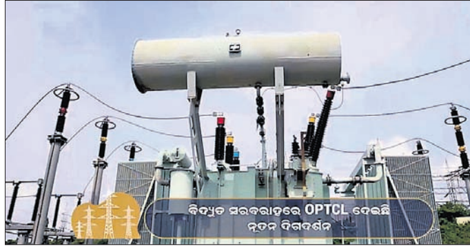
ବିଦ୍ୟୁତ୍ ସରକାରଙ୍କୁ ଉପକୃତ କରୁଥିବା ବିଦ୍ୟୁତ୍ ଶକ୍ତିର ଉପକରଣ ।

ରାଜ୍ୟର ୪ ଜିଲ୍ଲାରେ ୫ଟି ଉଚ୍ଚ ଶ୍ରେଣୀର ଗ୍ରାଡ୍ ସର୍ବ୍ୱେକ୍ଷଣକୁ ମୁଖ୍ୟମନ୍ତ୍ରୀ ନବୀନ ପଟ୍ଟନାୟକ ଯୋଗଦାନ କରିଛନ୍ତି । ଏଥିପାଇଁ ୨୫୪ କୋଟି ଟଙ୍କା ଖର୍ଚ୍ଚ କରାଯାଇଛି । ଏହି ଗ୍ରାଡ୍ ସର୍ବ୍ୱେକ୍ଷଣ ହେଲା ଗଞ୍ଜାମ ଜିଲ୍ଲାର ହିଞ୍ଜିଳିକାନ୍ତ, ମାଲକାନଗିରିର କାଳିମେଳା, ସୁବର୍ଣ୍ଣପୁରର ବୀରମହାରାଜପୁର ଓ କଟକ ଜିଲ୍ଲାର ଗୋଡ଼ିସାହି ଓ ବହୁଗ୍ରାମ । ଏହା ଦ୍ୱାରା ଉଚ୍ଚ ଶ୍ରେଣୀର ୨ ଲକ୍ଷ ଲୋକ ଉପକୃତ ହେବେ । ଏହି ଅବସରରେ ମୁଖ୍ୟମନ୍ତ୍ରୀ କହିଛନ୍ତି, ଜନସାଧାରଣଙ୍କ ଜୀବନଧାରଣା ମାନରେ ଉନ୍ନତି ପାଇଁ ଉତ୍ତମ ବିଦ୍ୟୁତ୍ ଶକ୍ତିର ଆବଶ୍ୟକତା ରହିଛି । ଏହାକୁ ସୁସ୍ଥିରେ ରଖି ରାଜ୍ୟ ସରକାର ରାଜ୍ୟରେ ବିଦ୍ୟୁତ୍ ସମ୍ପ୍ରଦାନ ଓ ଆବଶ୍ୟକ ଉପକରଣର ବିକାଶ ଉପରେ ସ୍ୱତନ୍ତ୍ର ଧ୍ୟାନ ଦେଉଛନ୍ତି । କୃଷି, ଶିଳ୍ପ ଓ ସାଧାରଣ ଜୀବନଯାପନ ସବୁ କ୍ଷେତ୍ରରେ ଉତ୍ତମ ଓ ନୀରବଚ୍ଛିନ୍ନ ବିଦ୍ୟୁତ୍ ଆବଶ୍ୟକତା ରହିଛି । ବିଜୁଳି ଶକ୍ତି ଆମ ସମସ୍ତଙ୍କ ପାଇଁ ଗୁରୁତ୍ୱପୂର୍ଣ୍ଣ । ତେଣୁ ଏହାକୁ ଅଧିକ ନିୟନ୍ତ୍ରଣ କରିବାକୁ ମୁଖ୍ୟମନ୍ତ୍ରୀ ଜନସାଧାରଣଙ୍କୁ ନିବେଦନ କରିଛନ୍ତି । ସୁନାମାୟୋଗ, ରାଜ୍ୟରେ ବିଦ୍ୟୁତ୍ ସମ୍ପ୍ରଦାନ ଶେଷରେ ଏକ ଦୃଢ଼ ଚିତ୍ତକୁ ନିରାକରଣ କରାଯାଇଛି । ବର୍ତ୍ତମାନ ପୂର୍ଣ୍ଣ ରାଜ୍ୟରେ ୧୮୫ଟି ଏକ୍ସଟ୍ରା ଭୋଲଟେଜ୍ ଗ୍ରାଡ୍ ସର୍ବ୍ୱେକ୍ଷଣ ଥିବାବେଳେ ୧୬,୦୦୦