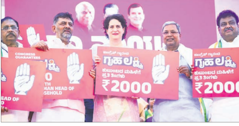
ବେଙ୍ଗାଲୁରୁରେ ଏକ ସଭାରେ କଂଗ୍ରେସ ସାଧାରଣ ସମାଜର ପ୍ରତିରୋଧୀ ଶାନ୍ତି ଉଦ୍‌ଧାରଣା ଓ ଅନ୍ୟ ନେତୃବୃନ୍ଦ।

ବେଙ୍ଗାଲୁରୁ, ୧୬୧୧ ଆଗକୁ କର୍ମଚାରୀ ବିଧାନସଭା ନିର୍ବାଚନ ଥିବାବେଳେ କଂଗ୍ରେସ ସମାଜକୁ ଆସିଲେ ପ୍ରତି ପରିବାରର ମହିଳା ମୁଖ୍ୟଙ୍କୁ ମାସିକ ୨ ହଜାର ଟଙ୍କା ଲେଖାଏ ସହାୟତା ଯୋଗାଇଦେବ ବୋଲି ଯୋଗବାର ପ୍ରତିଶ୍ରୁତି ଦେଇଛି। ଦଳର ଏକ ସମ୍ମିଳନୀରେ କଂଗ୍ରେସ ସାଧାରଣ ସମାଜର ପ୍ରତିରୋଧୀ ଏହା ଘୋଷଣା କରିଛି। ଏକ ନିର୍ଦ୍ଦେଶ ଦାଖଲକାରୀ ମୂଳ ଆଇ ଭାବେ ଗୃହଲକ୍ଷ୍ମୀ ଯୋଜନାରେ ପରମ ମହିଳା ମୁଖ୍ୟଙ୍କ ବ୍ୟାଙ୍କ ଖାତାକୁ ବର୍ଷକୁ ୨୪ ହଜାର ଟଙ୍କା ପର୍ଯ୍ୟନ୍ତ ବୋଲି ସେ କହିଛନ୍ତି। କର୍ମଚାରୀ ଆସନ୍ତା ମେ' ମାସରେ ବିଧାନସଭା ନିର୍ବାଚନ ହୋଇପାରେ। ରାଜ୍ୟର ପ୍ରତି ପରିବାରକୁ ୨୦୦