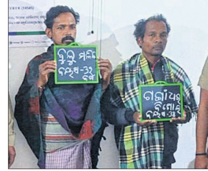
ଗିରଫ ୨ ଅଭିଯୁକ୍ତ।

ବାରହା ଶିକାର ପାଇଁ ବିଚ୍ଛିନ୍ନଥିଲେ ବିଦ୍ୟୁତ୍ ତାର ରାଜକିଆ, ୧୬.୧ (ଭି.ଏନ.ଏ.) କନ୍ଧମାଳ ଜିଲ୍ଲା ରାଜକିଆ ବ୍ଲକର ବାରହା ରେଞ୍ଜରେ ଗତ ରୁଧିରୀ ଏକ ଛୁଆହାତୀ ମୃତ୍ୟୁ ଘଟିଥିଲା। ଏହି ଘଟଣାରେ ବନ ବିଭାଗର ବିଦ୍ୟୁତ୍ ତାର କଟାଯାଇଥିଲା। ଏହାପରେ ବନ ବିଭାଗର ବିଦ୍ୟୁତ୍ ତାର କଟାଯାଇଥିଲା। ଏହାପରେ ବନ ବିଭାଗର ବିଦ୍ୟୁତ୍ ତାର କଟାଯାଇଥିଲା।