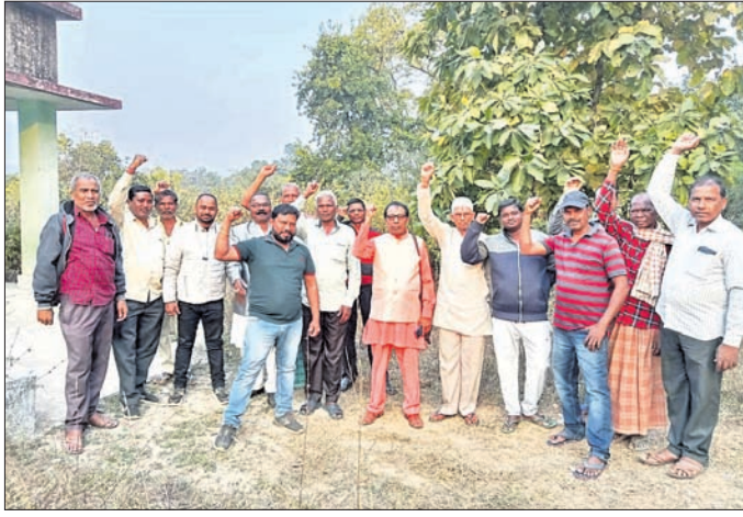
ବିଠିକରେ ଜମି ଅଧିଗ୍ରହଣକୁ ଛାଡ଼ି ନେଇ ଇଡ଼କୋ ବିରୋଧ କରୁଛନ୍ତି।

ଝରପୁରୁଡ଼ା ତହସିଲ ପିପିଲିମାଳ ଆଞ୍ଚଳିକ ସରକାରଙ୍କ ଅଧୀନ ୧.୦୫୮ ଏକର ସରକାରୀ ଜମିକୁ ଇଡ଼କୋ ରାଜ୍ୟ ବିଭାଗ ମାଧ୍ୟମରେ ଅଧିଗ୍ରହଣ କରିବାପାଇଁ ପ୍ରସ୍ତାବ ଆରମ୍ଭ କରିଛି। ଏଥିମଧ୍ୟରେ ଜଙ୍ଗଲ, ପତ୍ତି, ଗୋଦଳ ଆଦି କ୍ଷେତ୍ରରେ ଜମି ରହିଛି। ଏହିସବୁ ଜମିକୁ ଛାଡ଼ି ନେଇ ଇଡ଼କୋ ପୂର୍ବପୁରୁଷର ଦଖଲ କରି ବ୍ୟବହାର କରିଆସୁଛନ୍ତି। ରାଜ୍ୟ ବିଭାଗ ତରଫରୁ ଦଖଲରେ ଥିବା ପ୍ରକାଶ ନୋଟିସ୍ ଜାରି ହୋଇଛି। ଏ ସମ୍ପର୍କରେ କାହାର କୌଣସି ଅଭିଯୋଗ ଥିଲେ ସମୟସୀମା ମଧ୍ୟରେ ଲଖନପୁର ତହସିଲଦାରଙ୍କ କୋର୍ଟରେ ଅଭିଯୋଗ କରିପାରିବେ। ଏହି ନିର୍ଦ୍ଦେଶବଳରେ ପ୍ରକାଶନେ ଲଖନପୁର ତହସିଲ କୋର୍ଟରେ ହାଜର ହୋଇ