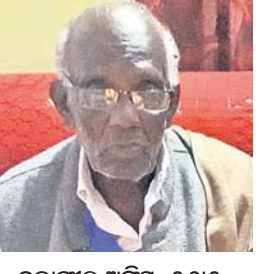
ବଲାଙ୍ଗୀର ଅଧିକାରୀ, ୧୬୧