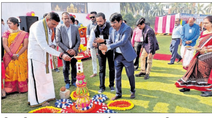
ଅତିଥିବୃନ୍ଦ ବିଜ୍ଞାନ ମେଳା ଏବଂ ଖାଦ୍ୟମେଳା କାର୍ଯ୍ୟକ୍ରମର ଶୁଭାରମ୍ଭ କରୁଛନ୍ତି।

ବରଗଡ଼ ସହର ଉପକଣ୍ଠ ବରାହଗୋଡ଼ା ସ୍ଥିତ ବିକାଶ ଶିକ୍ଷାନୁଷ୍ଠାନରେ ବିଜ୍ଞାନ ମେଳା ଏବଂ ଖାଦ୍ୟ ମେଳା ଅନୁଷ୍ଠିତ ହୋଇଯାଇଛି।