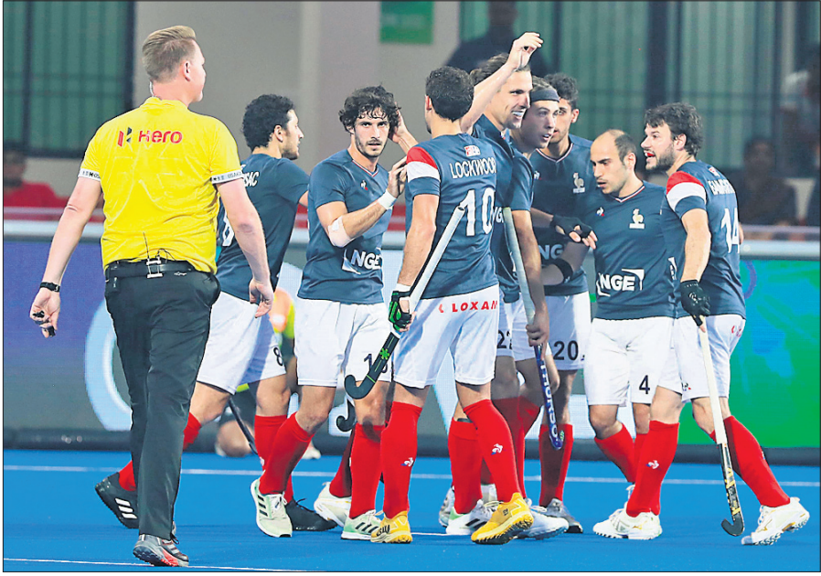
ବିଜୟରେ ଭଲସିତ ପ୍ରାନ୍ତ ଖେଳାଳି।

ଅଧିନାୟକ ଭିକ୍ଟରୀୟ ଭବଳ ଗୋଲ ବକରେ ପ୍ରାନ୍ତ ଚଳିତ ହକି ବିଶ୍ୱକପରେ ପ୍ରଥମ ବିଜୟ ସ୍ୱାଦ ଗଞ୍ଜିଛି। ସୋମବାର କଳିଙ୍ଗ ଷ୍ଟାଡ଼ିୟମରେ ଅନୁଷ୍ଠିତ ପୁଲ୍ ଖର୍ଚ୍ଚ ଏକ ମ୍ୟାଚରେ ଏହି ଦଳ ୨-୧ ଗୋଲରେ ଦକ୍ଷିଣ ଆଫ୍ରିକାକୁ ପରାସ୍ତ କରିଛି। ୨ ମ୍ୟାଚରୁ ଏହା ଥିଲା ପ୍ରାନ୍ତର ପ୍ରଥମ ବିଜୟ। ପ୍ରଥମ ମ୍ୟାଚରେ ଦଳ ୦-୮ ଗୋଲରେ ଚାଇନା ଫୋରୋଇଜର ଅଷ୍ଟ୍ରେଲିଆ ନିକଟରୁ ହାରି ଯାଇଥିଲା। ଏଠାରେ ବିଜୟ ଫଳରେ ପ୍ରାନ୍ତର କ୍ରମିତ ୩ଟି ଖେଳିବା ଆଶା ଉଜ୍ଜୀବିତ ରହିଛି। ଅନ୍ୟପକ୍ଷରେ ୨ ମ୍ୟାଚରୁ ଡଚ୍ଚ ପରାସ୍ତ ହେବା ପରେ ଦକ୍ଷିଣ ଆଫ୍ରିକା କ୍ରମିତ ପର୍ଯ୍ୟାୟରୁ ଏଲିମିନେଟ ହେବାର ସ୍ୱାଭାବିକ ପହଞ୍ଚିଯାଇଛି। ପ୍ରାନ୍ତ ବିଜୟରେ ଗୁରୁତ୍ୱପୂର୍ଣ୍ଣ ଭୂମିକା ଗ୍ରହଣ କରିଥିବା ଭିକ୍ଟରୀୟ ଚେୟରମ୍ୟାନ୍ ଦି ମ୍ୟାଚ୍ ବିବେଚିତ ହୋଇଥିଲେ। ପ୍ରାନ୍ତ ଏହାର ଅନ୍ତିମ ମ୍ୟାଚ୍ ୨୦ ଚାରିଶେଷରେ ଆକେଶିନା ସହିତ ଖେଳିବ। ରାଉରକେଲାର