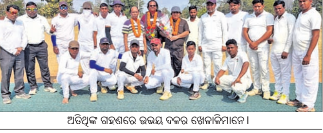
ଅତିଥିକ ଗହଣରେ ଭଉଣ୍ୟ ଦଳର ଖେଳାଳିମାନେ।