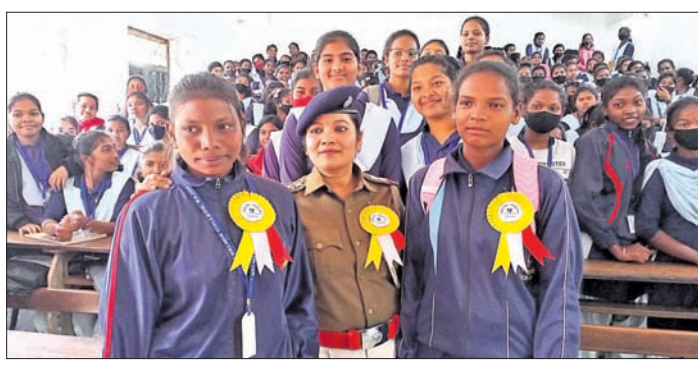
ଆତ୍ମରକ୍ଷା କୌଶଳ ପ୍ରଶିକ୍ଷଣ ଶିବିର ଉଦ୍‌ଘାଟନା କରୁଥିବା ।