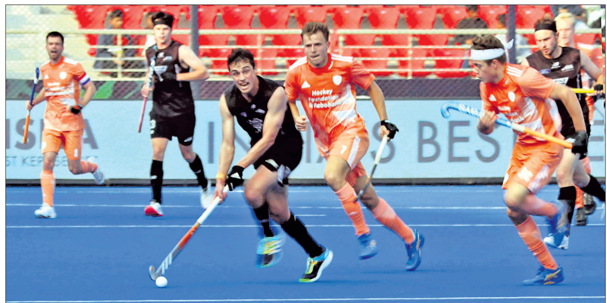
ନେଦରଲାଣ୍ଡ ଓ ଲୁକ୍ସେମ୍ବର୍ଗ ମ୍ୟାଚର ଏକ ଉଜ୍ଜ୍ୱଳ ପୂର୍ଣ୍ଣ ମୁହୂର୍ତ୍ତ।

ରାଉରକେଲା ଅଫିସ, ଭୁବନେଶ୍ୱର (ଜ୍ରାହା ପ୍ରତିନିଧି), ୧୬।୧ ଗତ ସଂସ୍କରଣର ରନରାପ୍ଟ ନେଦରଲାଣ୍ଡ ପ୍ରଥମ ଦଳ ଭାବେ ଚଳିତ ହକି ବିଶ୍ୱକପର କ୍ୱାର୍ଟର ଫାଇନାଲରେ ପ୍ରବେଶ କରିଛି। ରାଉରକେଲାରେ ବିର୍ସା ମୁଖ୍ୟ ସ୍ୱାଗତ୍ୟମରେ ଯୋଗଦାନ ଅନୁଷ୍ଠିତ ପୂର୍ଣ୍ଣ ସି' ମ୍ୟାଚରେ ଏହି ଦଳ