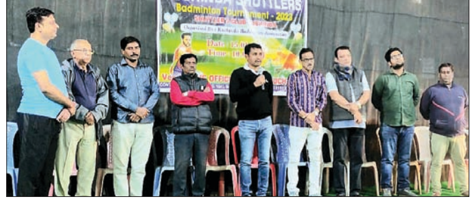
ଚୁର୍ଣ୍ଣାମେଣ୍ଟ ଉଦ୍‌ଘାଟନା କାର୍ଯ୍ୟକ୍ରମରେ ଅତିଥିମାନେ।