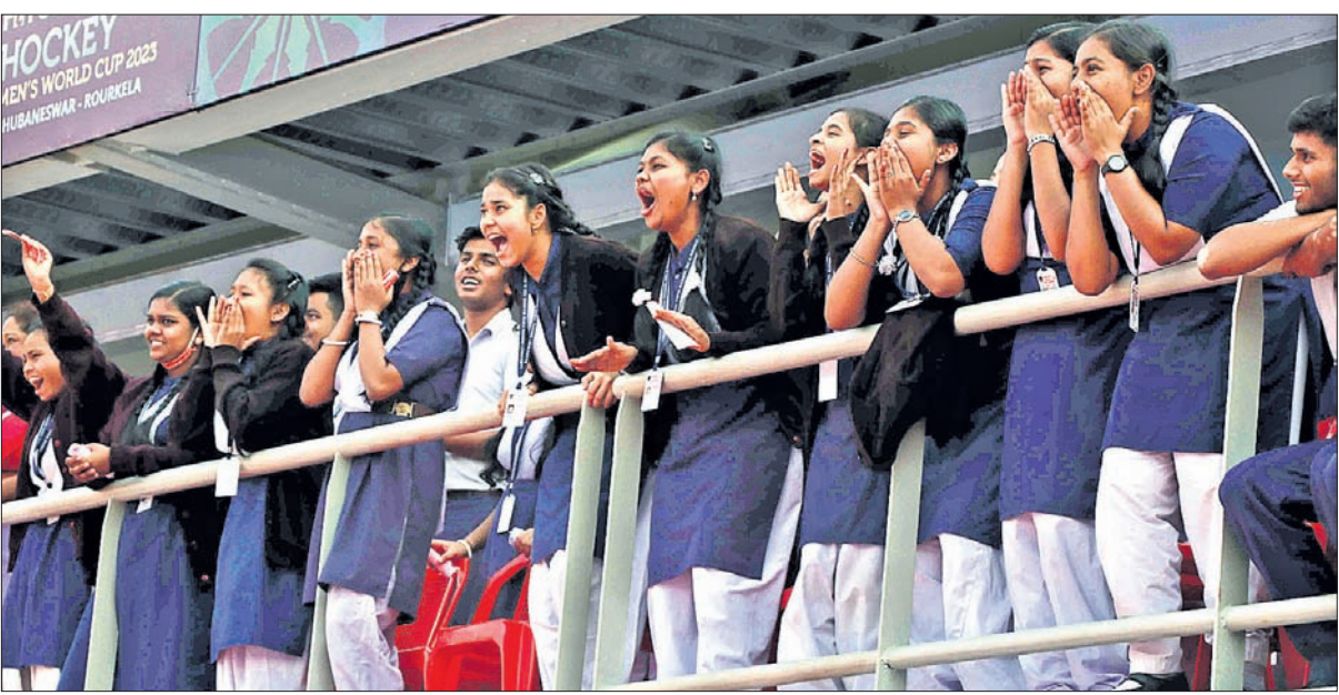
ବିର୍ସା ମୁଖ୍ୟ ସ୍ୱାଗତ୍ୟମରେ ମ୍ୟାଚ ଉପଭୋଗ କରୁଛନ୍ତି ସ୍କୁଲ ଛାତ୍ରୀ।