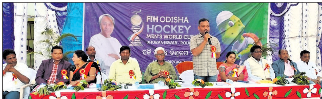
ଉଦ୍ଘାଟନା ସମାବେଶରେ ଅତିଥିବୃନ୍ଦ।

ବରଗଡ଼ ଜିଲ୍ଲା ଭବଳି ବ୍ଲକ୍ ଅନ୍ତର୍ଗତ ନୂଆଗଡ଼ ଲକ୍ଷ୍ମୀନାରାୟଣ ଉଦ୍ଘାଟନା ଖେଳ ପଡ଼ିଆରେ ଜିଲ୍ଲାସ୍ତରୀୟ ଯୋଗ, ଚେଷ୍ଟ ଓ କ୍ରିକେଟ ପ୍ରତିଯୋଗିତା ସୋମବାର ଉଦ୍ଘାଟିତ ହୋଇଛି।