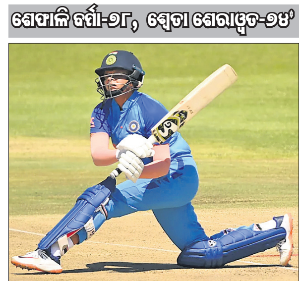
ଶର୍ ଖେଳିବା ଅବସରରେ ଶେଫାଳି ବର୍ମା।

ବେନୋନି (ଦକ୍ଷିଣ ଆଫ୍ରିକା), ୧୬।୧ (ପି.ଟି.) ଭାରତ ଅଧିନାୟକ ଶେଫାଳି ବର୍ମାଙ୍କ ଧୂଆଁଧାର ୬୮ (୩୪ ବଲ୍, ୧୨ ଚୋକା, ୪ ଛକା) ଏବଂ ଓପେନର ଶ୍ୱେତା ଶେରାଓତଙ୍କ ଉତ୍କଳ ଅପରାଜିତ ୬୪ (୪୯ ବଲ୍, ୧୦ ଚୋକା) ରନ୍ ସହାୟତାରେ ଭାରତ