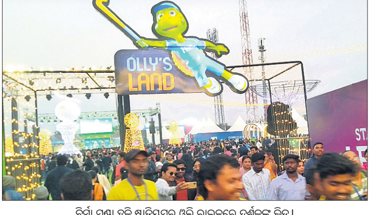
ବିର୍ସା ପୁଣ୍ୟା ହକି ଷ୍ଟାଡ଼ିୟମର ଓଲି ରାଇଜରେ ଦର୍ଶକଙ୍କ ଭିଡ଼।

ରାଉରକେଲା ଅଧିକ, ୧୬/୧ ରାଉରକେଲା ବିର୍ସା ପୁଣ୍ୟା ହକି ଷ୍ଟାଡ଼ିୟମରେ ପ୍ରଥମଥର କରି ପୁରୁଷ ହକି ବିଶ୍ୱକପ ଆୟୋଜିତ ହେଉଛି। ଏହି ବିଶ୍ୱକପ ମ୍ୟାଚ୍ ଦେଖିବାକୁ ଆସୁଥିବା ଦର୍ଶକଙ୍କ ପାଇଁ ଷ୍ଟାଡ଼ିୟମର ଦକ୍ଷିଣ ଷ୍ଟାଣ୍ଡରେ ଏକ ଓଲି ରାଇଜ (ଓଲି ରାଇଜ) ନିର୍ମାଣ କରାଯାଇଛି। ସୁନ୍ଦର ଆଲୋକମାଳାରେ ସୁସଜ୍ଜିତ ଓଲି ରାଇଜର ପ୍ରବେଶ ପଥରେ ଆଲୋକର ଏକ ୫ ଫୁଟର ହକି ବିଶ୍ୱକପ ନିର୍ମାଣ କରାଯାଇଛି। ଏହାସହ ଭାରତୀୟ ଦଳର ସମସ୍ତ ହକି ଚାଳକଙ୍କ ଷ୍ଟାଣ୍ଡ ନିର୍ମାଣ କରାଯାଇଛି। ସେଲ୍ଟି ଗୋଡ୍, ହକି ଖେଳର ବିଭିନ୍ନ ସାମଗ୍ରୀ ସାଜୁ ହକି ଇଣ୍ଡିଆ ଟି-ଶାର୍ଟ ଭଳି ବିଭିନ୍ନ ଜିନିଷ ନିକଟରେ ଦର୍ଶକଙ୍କ