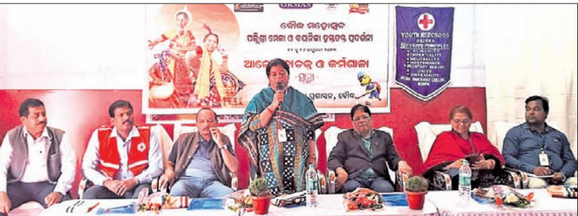
ଆଲୋଚନାଚକ୍ର ମଞ୍ଚାଧୀନ ଅତିଥି।

ବୌଦ୍ଧ, ୧୬୧୧(ସ୍ୱ.ପ୍ର.) ବୌଦ୍ଧ ମହୋତ୍ସବ ପଲ୍ଲିଶ୍ରୀ ମେଳା ଓ ବୟନିକା ପ୍ରଦର୍ଶନୀର ସୋମବାର ଉଦ୍‌ଯାପନା ଦିବସର ପୂର୍ବାହ୍ନରେ 'ଆମ ସ୍ୱାସ୍ଥ୍ୟ ସମସ୍ୟା' ଉପରେ ଏକ ଆଲୋଚନାଚକ୍ର ଓ କର୍ମଶାଳା ମହୋତ୍ସବ ପଡ଼ିଆ ଠାରେ ଅନୁଷ୍ଠିତ ହୋଇଥିଲା।