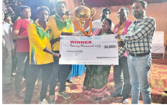
ଅତିଥିମାନେ ଚାମ୍ପିୟନ୍ ଦଳକୁ ଟ୍ରଫି ପ୍ରଦାନ କରୁଛନ୍ତି।