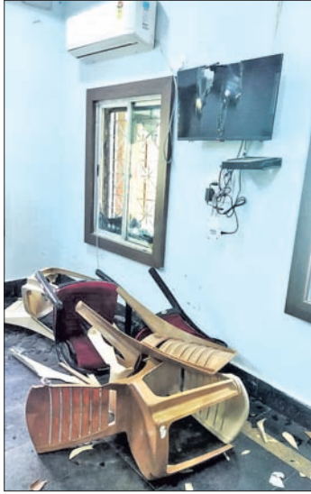
ଖପ୍ରାଖୋଳ କୁଳ ଅଧିକ ଭିତରେ ଚୈକି, ଚିକିତ୍ସା ଓ ଆସ୍ତ୍ରାପଣ ଭଙ୍ଗାଯାଇଛି।