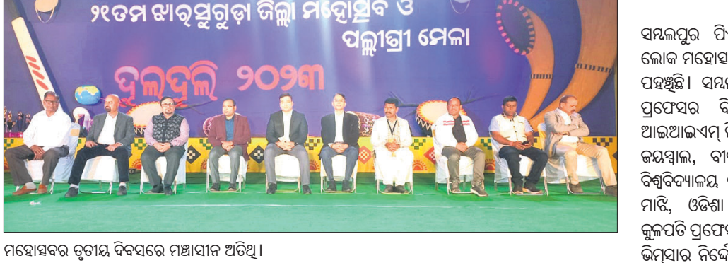
ମହୋତ୍ସବର ତୃତୀୟ ଦିବସରେ ମଞ୍ଚାସାନ ଅତିଥି।

କୃତ୍ରିମ, ୧୬୧୧(ଡି.ଏନ.ଏ.): କୁକୁଡ଼ା ଗୋକୁଳ ସାର୍ବଜନୀ ଗ୍ରାମ୍ୟ ମହାବିଦ୍ୟାଳୟର ଏନ୍‌ଏସ୍‌ଏସ୍ ପକ୍ଷରୁ ସୋମବାର କାର୍ଯ୍ୟକ୍ରମ ଆରମ୍ଭରେ ଶାନ୍ତକାଳିନୀ ଜାତୀୟ ସେବା ଯୋଜନା ଶିବିର ଅନୁଷ୍ଠିତ ହୋଇଯାଇଛି।