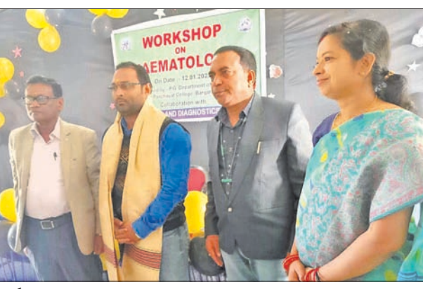
କର୍ମଶାଳାରେ ଆୟୋଜକ, ଅତିଥିବୃନ୍ଦ।

ଭାବେ ଯୋଗଦେଇ ଛାତ୍ରଛାତ୍ରୀଙ୍କୁ ଉତ୍ସାହିତ କରିଥିଲେ। ଛାତ୍ରଛାତ୍ରୀଙ୍କୁ ରାଜ୍ୟ ବାହାର ଖାଦ୍ୟ ନିଜେ ପ୍ରସ୍ତୁତ କରିବାକୁ ଧ୍ୟାନବାଦ ଦେବା ସହିତ ମାଗିଥିଲା ଏକ ପୂର୍ଣ୍ଣକର ଖାଦ୍ୟ ତଥା ବିଭିନ୍ନ ରୋଗ ପ୍ରତିରୋଧକ ଓ ଶକ୍ତି ବର୍ଦ୍ଧନକାରୀ ଖାଦ୍ୟ ଭାବେ ଜନସମାଜରେ ଆଦୃତ ଲାଭ କରିଛି ବୋଲି ସେ କହିଥିଲେ।