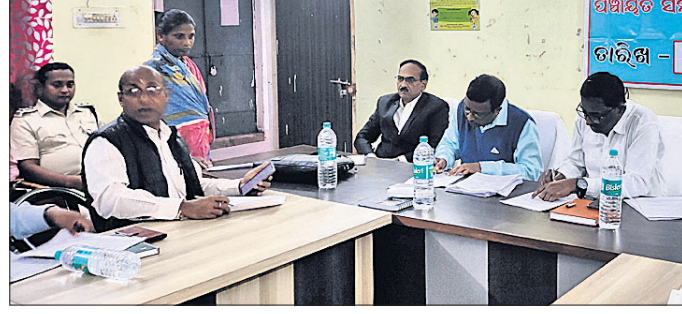
ଅଭିଯୋଗ ଶୁଣାଣି କରୁଛନ୍ତି ଅଧିକାରୀ।

ନାକଟିବେଢ଼ଲ ବୁକ୍ କାର୍ଯ୍ୟାଳୟ ସଭାଗୃହରେ ସୋମବାର ଜିଲ୍ଲା ପ୍ରଶାସନ ପକ୍ଷରୁ ମିଳିତ ଅଭିଯୋଗ ଶୁଣାଣି ଅନୁଷ୍ଠିତ ହୋଇଯାଇଛି।