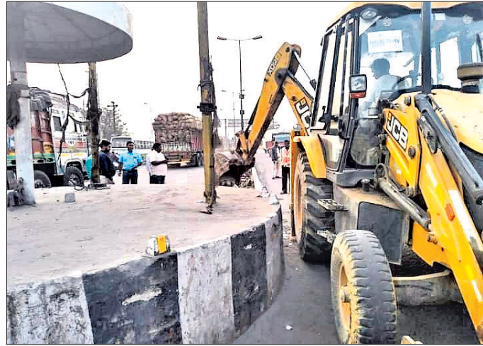
ଅର୍ଦ୍ଧଠାପାଲି ଛକରେ ତିଆରିକରକୁ ଭାଙ୍ଗି ଦିଆଯାଇଛି।

ସମ୍ବଲପୁର ଅର୍ଦ୍ଧଠାପାଲି ଛକରେ ପୋଲିସ୍ ଅନୁମୋଦନକ୍ରମେ ଏନ୍‌ଏଚ୍‌ଏଆଇ ପକ୍ଷରୁ ରାସ୍ତା ମଝିରେ କଂକ୍ରିଟ୍ ଡିଭାଇଡର କରି ଛକ ରାସ୍ତା ବନ୍ଦ କରିଦିଆଯାଇଥିଲା।