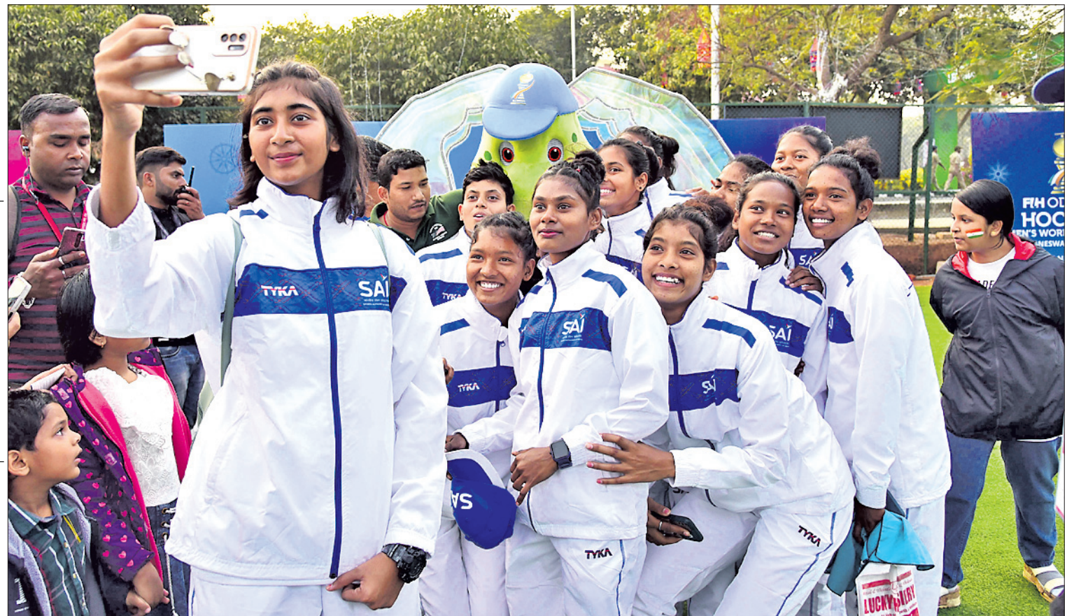
ପ୍ରାନ୍ତ-ଦକ୍ଷିଣ ଆଫ୍ରିକା ମ୍ୟାଚ୍ ସମୟରେ ଭୁବନେଶ୍ୱର କଳିଙ୍ଗ ଷ୍ଟାଡ଼ିୟମରେ ସେଲ୍ଟି ନେଉଛନ୍ତି କୋଲକାତା ସାକର ଛାତ୍ରୀ।