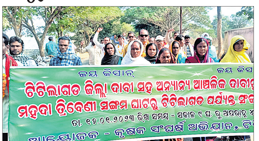
ଉପଜିଲ୍ଲାପାଳଙ୍କ କାର୍ଯ୍ୟାଳୟ ଅଭିଯୁକ୍ତ ଯାଉଥିବା କୃଷକ ସଂଘର୍ଷ ସମିତିର ଶୋଭାଯାତ୍ରା।