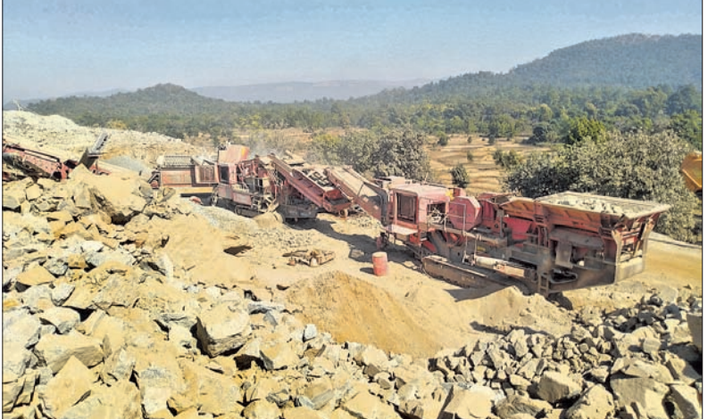
ପଥର ଖଣିରେ ବେଆଇନ ବ୍ଲାଷ୍ଟିଂ ହେଉଛି।