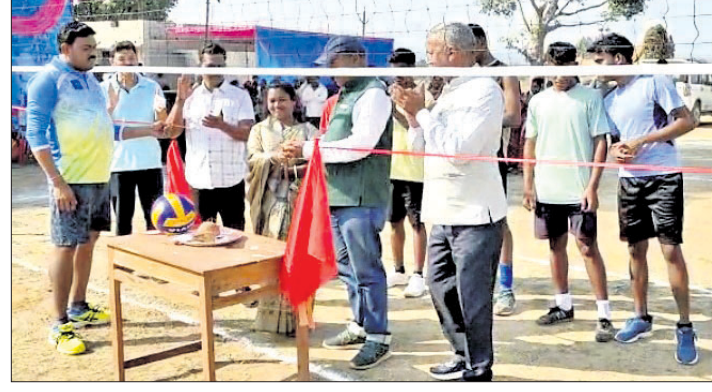
ଭଲିବଲ ଚୁର୍ଣ୍ଣାମେଣ୍ଟରେ ଅତିଥି ଓ ଖେଳାଳି ।