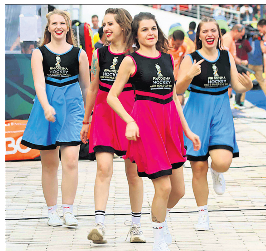
ବିର୍ସା ମୁଖ୍ୟ ସ୍ୱାଗତ୍ୟମରେ ଚିତ୍ତରଗଣ।

ମିନିଟ୍ରେ କୋଏନ ବିଜେନ ଆଉ ଏକ ଗୋଲ ଦେଇ ପ୍ରଥମାର୍ଦ୍ଧ ଶେଷବେଳକୁ ନେଦରଲାଣ୍ଡର ଅଗ୍ରଣୀ ବ୍ୟବଧାନକୁ ୩-୦ରେ ପହଞ୍ଚାଇଥିଲେ। ତୃତୀୟ କ୍ୱାର୍ଟରରେ ଲୁକ୍ସେମ୍ବର୍ଗ କଡ଼ା ଚ୍ୟାଲେଞ୍ଜ ଦେଇଥିଲେ ହେଁ ଗୋଲ ପରିଶୋଧ କରିପାରି ନ ଥିଲା। ୪୯ତମ ଅଧିକ କ୍ୱାର୍ଟର ଅର୍ଥାତ୍ ୫୫ତମ ମିନିଟ୍ରେ ନେଦରଲାଣ୍ଡର ୧୯ ନମ୍ବର ଖେଳାଳି ଜେମ୍ ହୋଏଡ଼େନେକର୍ ଏହି ଦଳ ପାଇଁ ଗୋଲ ଦେଇ ଦଳର ବିଜୟକୁ ନିଶ୍ଚିତ କରିଦେଇଥିଲେ। ପ୍ରକାଶଯୋଗ୍ୟ, ନେଦରଲାଣ୍ଡ ଗତ ସଂସ୍କରଣରେ ମଧ୍ୟ ତମକୁଳା ପ୍ରଦର୍ଶନ କରି ଫାଇନାଲ ଖେଳିଥିଲା। ମାତ୍ର ଗଲଟଳ ପୁଲିସ୍କାରେ ବେଲଜିୟମଠାରୁ ହାରି ରନରାପ୍ଟ ହୋଇଥିଲା। ଏହି ଦଳ ବିଶ୍ୱକପ ଇତିହାସରେ ଅନ୍ୟତମ ସଫଳ ଦଳ ଭାବେ ପରିଗଣିତ। ୧୯୭୩, ୧୯୦୦ ଓ ୧୯୯୮ରେ ୩ ଥର ଚାମ୍ପିୟନ ହୋଇଥିବାବେଳେ ୧୯୬୮, ୧୯୯୪, ୨୦୧୪ ଓ ୨୦୧୮ରେ ୪ଥର ରନରାପ୍ଟ ହୋଇଛି। ଏହା ବ୍ୟତୀତ ୨ ଥର ୨୦୦୨ ଓ ୨୦୧୦ରେ ବ୍ରୋଞ୍ଜ ପଦକ ମଧ୍ୟ ପାଇଛି।