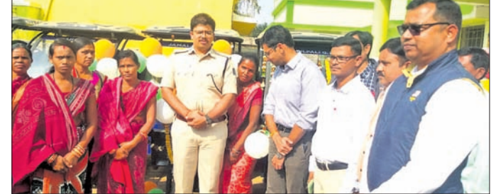
ବର୍ଷାବସ୍ତୁ ପରିଚାଳନା ଯାନକୁ ବରଗଡ଼ ପତି ଓ ଏମ୍ପି ଉଦ୍‌ଯାପନ କରୁଛନ୍ତି।