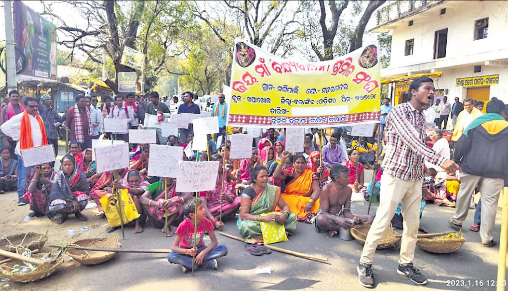
ଖପ୍ରାଖୋଳ କୁଳ କାର୍ଯ୍ୟାଳୟ ସମ୍ମୁଖରେ ଶ୍ରମିକମାନେ ଧାରଣାରେ ବସିଛନ୍ତି।