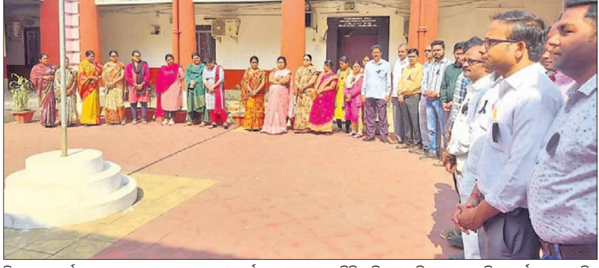
ଜିଲ୍ଲାପାଳ କାର୍ଯ୍ୟାଳୟରେ ସରକାରୀ ଅଧିକାରୀ ଓ କର୍ମଚାରୀ କଳାବ୍ୟାଜ ପିନ୍ଧି ପ୍ରତିବାଦ କରିବା ପରେ ଅଧିକାରୀଙ୍କୁ ଯାଇଛନ୍ତି।