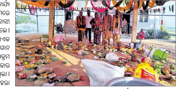
ରତ୍ନମୁଣ୍ଡ ସ୍ଥାପନ ଉପଲକ୍ଷେ ପୂଜାକାର୍ଯ୍ୟ।

ବାଞ୍ଛୁଣୀ, ୧୬୧୧(ଡି.ଏନ.ଏ.) ବୌଦ୍ଧ ଜିଲା ଅଁଳାପାଲି ଗ୍ରାମପଞ୍ଚାୟତ ହିଲୁଙ୍ଗ ଗ୍ରାମରେ ସୋମବାର ବାବା ଲିଙ୍ଗେଶ୍ୱର ମନ୍ଦିର ନିର୍ମାଣର ରତ୍ନମୁଣ୍ଡ ସ୍ଥାପନ ଉପଲକ୍ଷେ ସୁନ୍ଦରାକାଣ୍ଡ ପାରାୟଣ ଅନୁଷ୍ଠିତ ହୋଇଯାଇଛି।