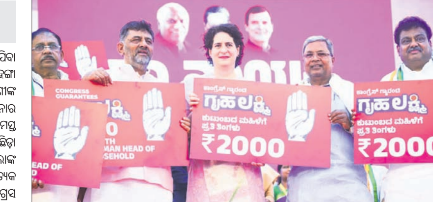
ବେଙ୍ଗାଳୁରୁରେ ଏକ ସଭାରେ କଂଗ୍ରେସ ସାଧାରଣ ସମାଜବାଦୀ ପ୍ରତିଯୋଗୀ ଗାନ୍ଧୀ ଭଦ୍ରା ଓ ଅନ୍ୟ ନେତୃବୃନ୍ଦ।

ବେଙ୍ଗାଳୁରୁ, ୧୬/୧୧ - ଆଗକୁ କର୍ମଚର ବିଧାନସଭା ନିର୍ବାଚନ ଥିବାବେଳେ କଂଗ୍ରେସ ସମାଜବାଦୀ ଆଦି ଗୋଟିଏ ପ୍ରତି ପରିବାରର ମହିଳା ମୁଖ୍ୟଙ୍କୁ ମାସିକ ୨ ହଜାର ଟଙ୍କା ଲେଖାଏ ସହାୟତା ଯୋଗାଇଦେବ ବୋଲି ଯୋଜନା କରାଯାଇଛି।