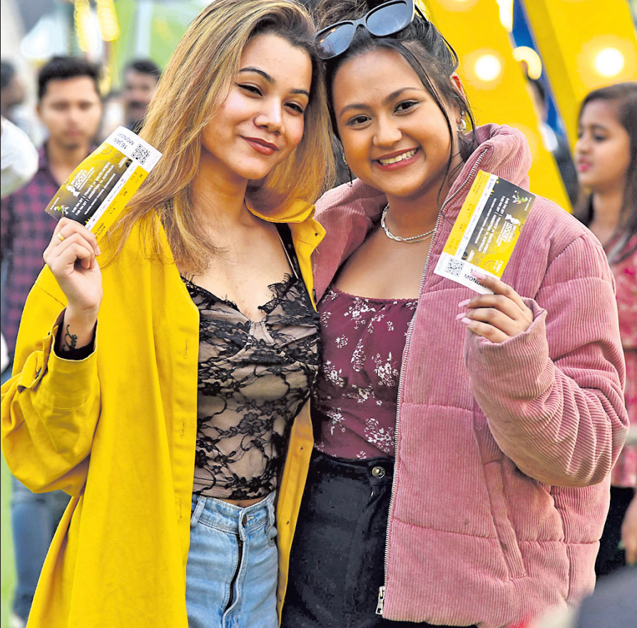
ପୁଲ୍ ହକିପ୍ରେମୀ ଚିକେଟ୍ ପ୍ରଦର୍ଶନ କରୁଛନ୍ତି।