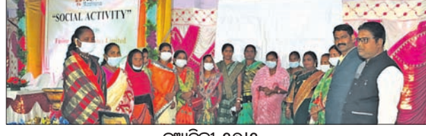
ନୂଆଦିଲ୍ଲୀ, ୧୭ତା: ଦେଶର ପ୍ରମୁଖ ଏମ୍‌ଏମ୍‌ଏମ୍‌ଆର ଯୁବକ ମାଲକ୍ତୋ ଫାଉଣ୍ଡେସନ୍ (ଏମ୍‌ଏମ୍‌ଏମ୍‌ଆର) ପକ୍ଷରୁ ଏକ ସ୍ଵତନ୍ତ୍ର ଆର୍ଥିକ ସାକ୍ଷରତା ଅଭିଯାନ ଆରମ୍ଭ କରାଯାଇଛି।