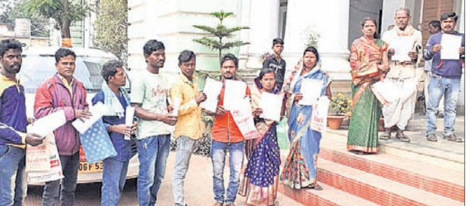
ପ୍ରଶାସନର ଦ୍ଵାରସ୍ଥ ହୋଇଥିବା ଗ୍ରାମବାସୀ।

ଦେଶାନ୍ତ ଅଧିକ, ୧୭୧୧ ପ୍ରଧାନମନ୍ତ୍ରୀ ଗ୍ରାମୀଣ ଆବାସ ଯୋଜନାରେ ତାଲିକାରୁ ହିତାଧିକାରୀ ବାଦ୍ ପଡ଼ିଥିବା ଅଭିଯୋଗ ହୋଇଛି।