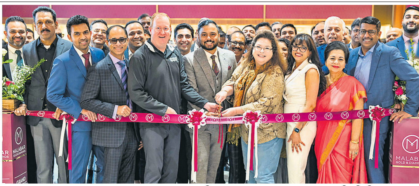
ଅନ୍ତରାଷ୍ଟ୍ରୀୟ ଅଲଙ୍କାର ବ୍ରାଣ୍ଡ ମାଲାର ବାର ଗୋଲ୍ଡ ଅଫ୍ ଡାଇମଣ୍ଡ ୩୦୦ଟି ଷ୍ଟୋର ନିକଟରେ ଯୁବମାନଙ୍କୁ ଡକାଇ ସହଯୋଗ କରାଯାଇଛି। ଏହି ପରିପ୍ରେକ୍ଷାରେ ବ୍ରାଣ୍ଡର ବରିଷ୍ଠ ଅଧିକାରୀଙ୍କ ସମେତ ଯୁବମାନଙ୍କୁ ଡକାଇ ତଥା ବହୁ ବିଶିଷ୍ଟ ବ୍ୟକ୍ତି ବିଶେଷ ଏହାର ଉଦ୍‌ଘାଟନ କରୁଛନ୍ତି।