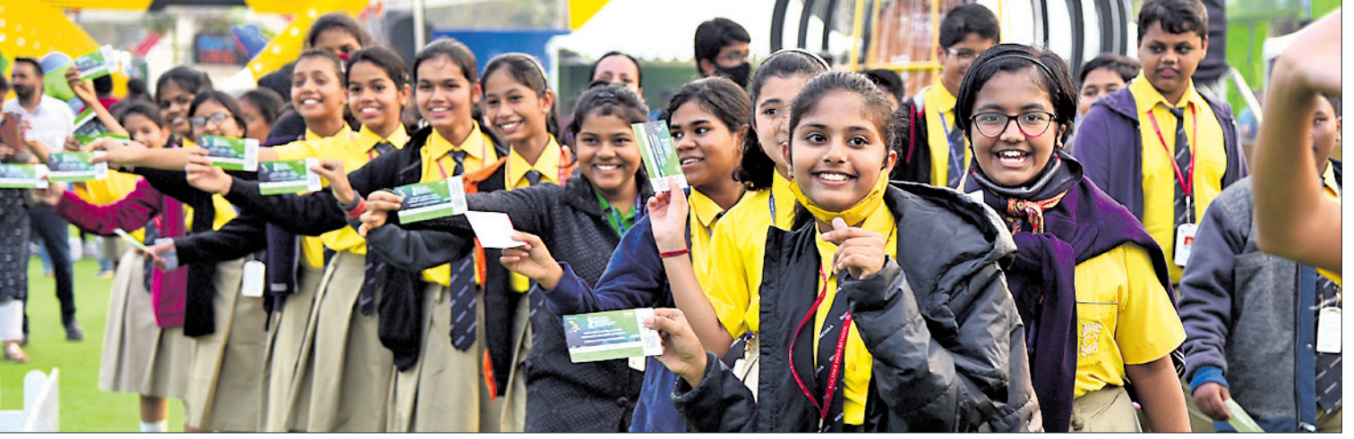
ହକି ବିଶ୍ୱକପ ମ୍ୟାଚ୍ ଦେଖିବାକୁ ଆସିଥିବା ଉଦାହାରୀ ସ୍କୁଲ ଛାତ୍ରାଛାତ୍ରୀ।