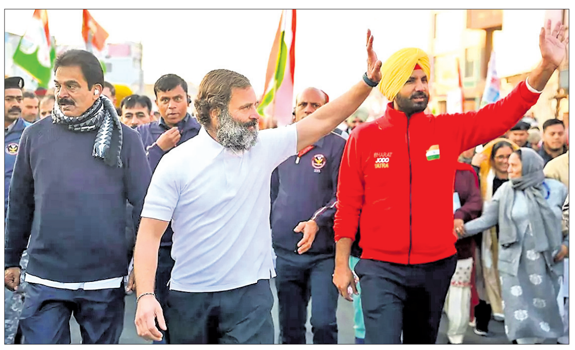
ଭାରତ ଯୋଡ଼ୋ ଯାତ୍ରା ଅବସରରେ ପଞ୍ଜାବର ହୋସିଆରପୁରଠାରେ କଂଗ୍ରେସ ନେତା ରାହୁଲ ଗାନ୍ଧୀ, କେ.ଏ. ବେଣୁଗୋପାଳ ଓ ଅନ୍ୟମାନେ ।