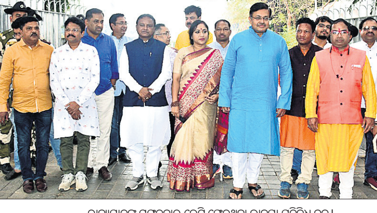
ରାଜ୍ୟପାଳଙ୍କ ମଙ୍ଗଳବାର ଭେଟି ଫେରୁଥିବା ଭାରତୀୟ ପ୍ରତିନିଧି ଦଳ ।

ଭାରତୀୟ ସରକାରଙ୍କୁ ନିର୍ଦ୍ଦେଶ ଦିଆଯାଏ । ଯୋଗ୍ୟ ହିତାଧିକାରୀ ବାଛିବା ପାଇଁ ସରକାରଙ୍କୁ ନିର୍ଦ୍ଦେଶ ଦିଆଯାଏ ।