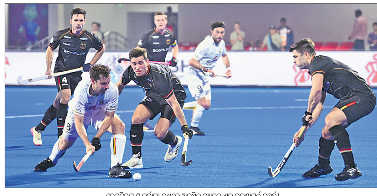
ବେଲ୍ଜିୟମ ଓ ଜର୍ମାନୀ ମଧ୍ୟରେ ଅନୁଷ୍ଠିତ ମ୍ୟାଚ୍ ଏକ ଉତ୍ତମସ୍ୱରୂପ ସୂଚୁଛି।

ଚଳିତ ହକି ବିଶ୍ୱକପରେ ମଙ୍ଗଳବାର କଳିଙ୍ଗ ଷ୍ଟାଡ଼ିୟମରେ ଅନୁଷ୍ଠିତ ବେଲ୍ଜିୟମ-ଜର୍ମାନୀ ପୁଲ୍ 'ବି' ମ୍ୟାଚ ୨-୨ ଗୋଲରେ ତ୍ରୁ ରହିଛି।