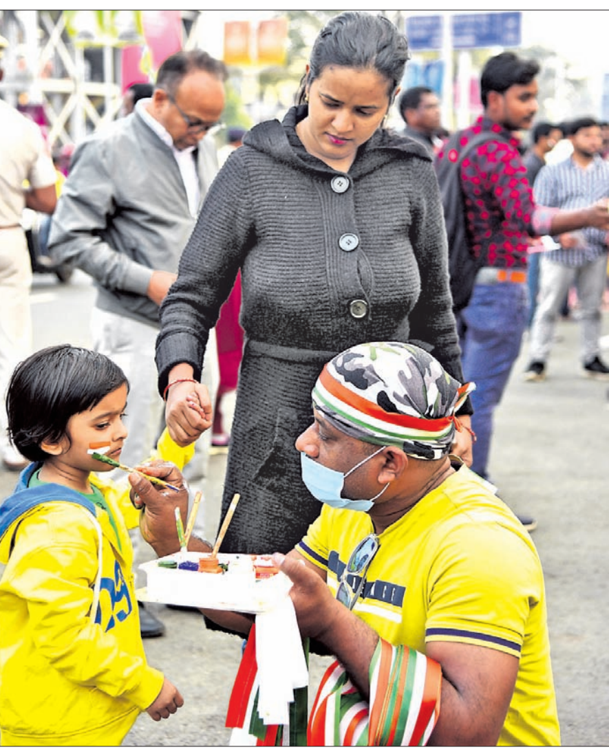
ମ୍ୟାଚ୍ ଦେଖିବାକୁ ଆସିଥିବା ଜଣେ କୁନିପିଲାଙ୍କ ଗାଳରେ ତ୍ରୁରଙ୍ଗା ଅଙ୍କାଯାଉଛି।