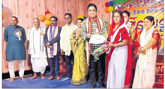
ମୁଖ୍ୟ ଅତିଥି କୁକୁଡ଼ା ସଂସ୍କାର କରୁଛନ୍ତି।

ଦେଶାନ୍ତ ଅଧିକ, ୧୭୧୧ ଦେଶାନ୍ତର ବିଭାଗ ପକ୍ଷରୁ ଗ୍ରାମ୍ୟ ଶିକ୍ଷା ପରିଷଦ ପ୍ରତିଷ୍ଠା କରିବା ପାଇଁ ଉଦ୍‌ଘାଟନା କରାଯାଇଛି।