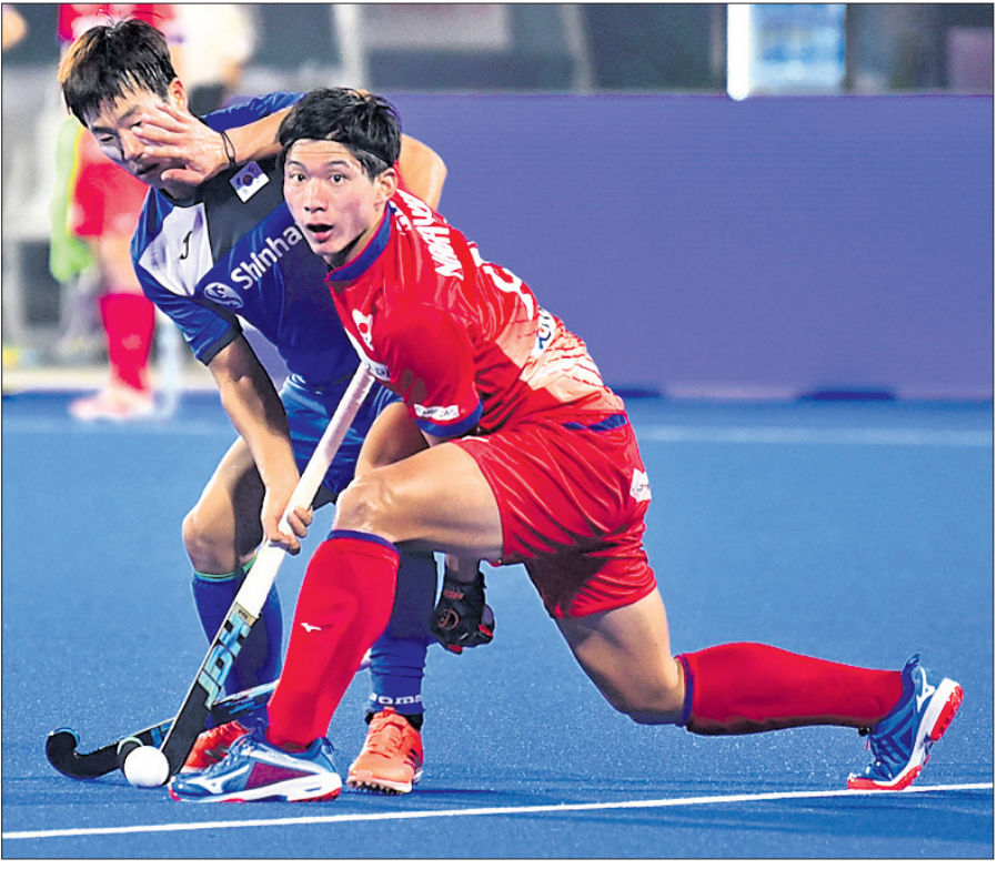
ବଲ୍ ପାଇଁ ସଂଘର୍ଷ କରୁଛନ୍ତି ଦକ୍ଷିଣ କୋରିଆ ଓ ଜାପାନ ଖେଳାଳି।

କଳିଙ୍ଗ ଷ୍ଟାଡ଼ିୟମରେ ଚାଲିଥିବା ହକି ବିଶ୍ୱକପର ମଙ୍ଗଳବାର ଅନୁଷ୍ଠିତ ଏସୀୟ ଲଢ଼େଇରେ ଦକ୍ଷିଣ କୋରିଆ ୨-୧ ଗୋଲରେ ଜାପାନକୁ ପରାସ୍ତ କରିଛି।