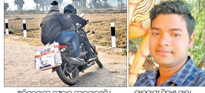
ଅଭିଯୁକ୍ତମାନେ ଫେରାର ହୋଇଯାଇଛନ୍ତି।

କାମାକ୍ଷାନଗର, ୧୭୧୧(ଡି.ଏନ୍.ଏ.) ବାଇକ୍ରେ ଆସିଲେ। ବନ୍ଧୁକ ମୁନରେ ଭୟଭୀତ କରାଇ ଆଖି ପିଛୁଳାକେ ଛଡ଼ାଇନେଲେ ୮୦,୦୦୦ ଟଙ୍କା।