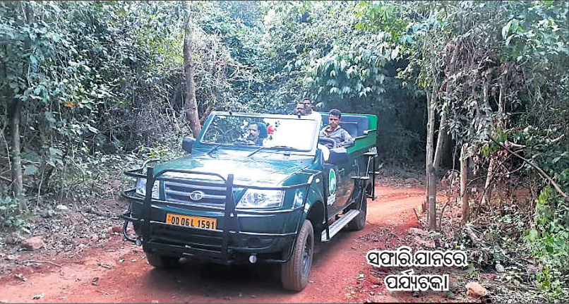
ସଫାରୀ ଯାନରେ ପର୍ଯ୍ୟଟକ