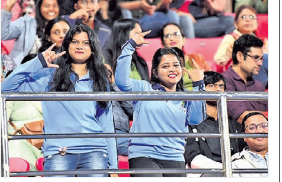
କଳିଙ୍ଗ ଷ୍ଟାଡ଼ିୟମରେ ହକି ବିଶ୍ୱକପ୍ ଖେଳର ମଜା ନେଉଛନ୍ତି ଦର୍ଶକ।

ଓଡ଼ିଶା ଦର୍ଶକ ପାଖାପାଖି ଏକ ଦଶନ୍ଧି ଧରି କଳିଙ୍ଗ ଷ୍ଟାଡ଼ିୟମରେ ହକିକୁ ସମର୍ଥନ ଜଣାଇ ଆସୁଛନ୍ତି। ଚାମ୍ପିୟନ୍ ଟ୍ରଫିଠାରୁ ଆରମ୍ଭ ହୋଇଥିବା ଏହି ପ୍ରକ୍ରିୟା ଏବେ ବିଚାର ଧର ପାଇଁ ଆୟୋଜିତ ହେଉଥିବା ହକି ବିଶ୍ୱକପରେ ମଧ୍ୟ ଅବ୍ୟାହତ ରହିଛି।