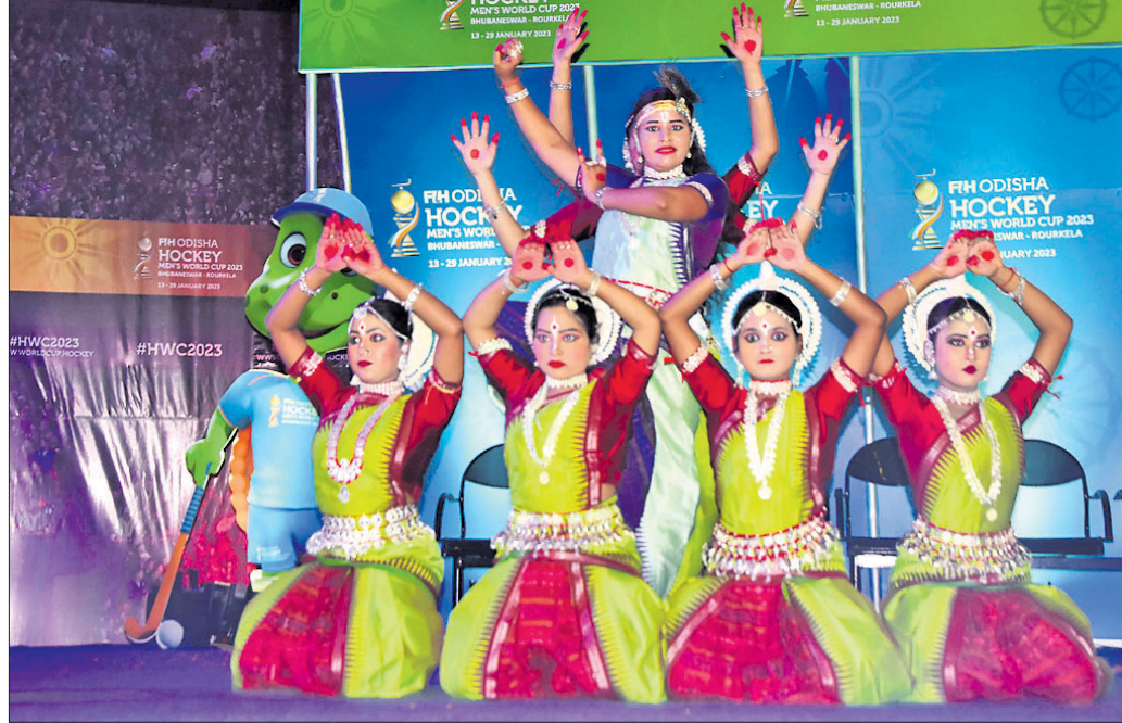
ଓଲି ଲ୍ୟାଣ୍ଡରେ ଲିଙ୍ଗରାଜ କଳା ନିକେତନ ପକ୍ଷରୁ ସାଂସ୍କୃତିକ କାର୍ଯ୍ୟକ୍ରମ ପରିବେଷଣ କରାଯାଇଛି