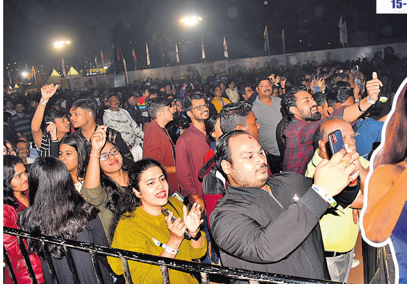
ବଲିଉଡ୍ ଗାୟିକା ନୀତି ମୋହନ