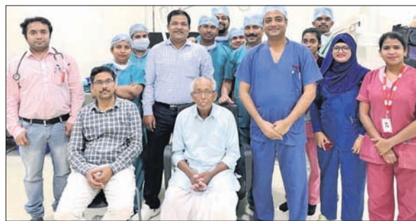
ଭୁବନେଶ୍ୱର, ୧୭ତମ: ରାଜ୍ୟର ପ୍ରମୁଖ ଘରୋଇ ଚିକିତ୍ସାଳୟ ଆତ୍ମ ହସ୍ତାନ୍ତର ଭୁବନେଶ୍ୱରରେ ଏକ ବିରଳ ରୋଗର ସଫଳ ଅସ୍ତ୍ରୋପଚାର କରାଯାଇଛି।