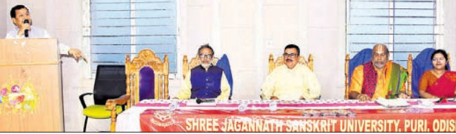
ଆଲୋଚନାଚକ୍ରରେ ମହାଧ୍ୟାୟ ଅତିଥି