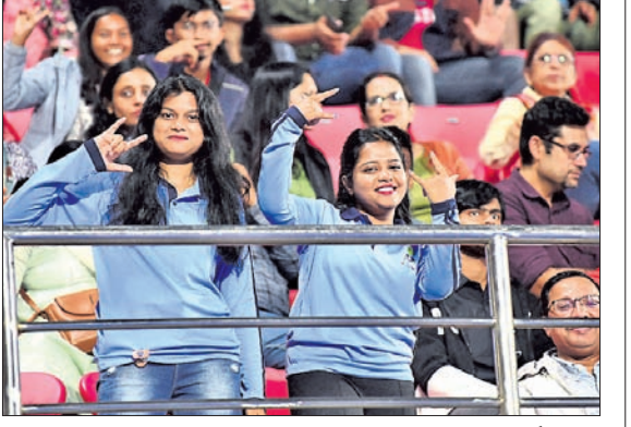
କଳିଙ୍ଗ ଷ୍ଟାଡ଼ିୟମରେ ହକି ବିଶ୍ୱକପ୍ ଖେଳର ମଜା ନେଉଛନ୍ତି ଦର୍ଶକ ।

ଓଡ଼ିଶା ଦର୍ଶକ ପାଖାପାଖି ଏକ ଦଶନ୍ଧି ଧରି କଳିଙ୍ଗ ଷ୍ଟାଡ଼ିୟମରେ ହକିକୁ ସମର୍ଥନ ଜଣାଇ ଆସୁଛନ୍ତି । ଚାମ୍ପିୟନ୍ ଟ୍ରଫିଠାରୁ ଆରମ୍ଭ ହୋଇଥିବା ଏହି ପ୍ରକ୍ରିୟା ଏବେ ବିତୀୟ ଥର ପାଇଁ ଆୟୋଜିତ ହେଉଥିବା ହକି ବିଶ୍ୱକପ୍ରେ ମଧ୍ୟ ଅବ୍ୟାହତ ରହିଛି । ଦର୍ଶକମାନେ ଭରପୂର ସଂଖ୍ୟାରେ ଷ୍ଟାଡ଼ିୟମକୁ ଆସି ସେମାନଙ୍କ ପ୍ରିୟ ଦଳ ଓ ଚାରିକାଳୁ ସମର୍ଥନ ଜଣାଉଛନ୍ତି । ସବୁଠାରୁ ବଡ଼କଥା ହେଲା ଚଳିତ ବିଶ୍ୱକପ୍ରେ କଳିଙ୍ଗ ଷ୍ଟାଡ଼ିୟମରେ ଭାରତ ଏ ପର୍ଯ୍ୟନ୍ତ ମ୍ୟାଚ ଖେଳି ନ ଥିଲେ ହେଁ ବହୁ ସଂଖ୍ୟାରେ ଦର୍ଶକ ଷ୍ଟାଡ଼ିୟମକୁ ଆସି ହକି ପ୍ରତି ସେମାନଙ୍କ ଭଲ ପାଇବାକୁ ଦର୍ଶାଇଛନ୍ତି । ଏଠାରେ ଭାରତୀୟ ଦଳ ଆସନ୍ତା ୧୯ ତାରିଖରେ ସ୍ୱେଡି ବିପକ୍ଷରେ ମ୍ୟାଚ ଖେଳିବ । ପ୍ରଥମ ୨ଟି ମ୍ୟାଚ ଘରୋଇ ଦଳ ରାଉନ୍ଦକେଲାର ବିଧିା ମୁଖ୍ୟ ଷ୍ଟାଡ଼ିୟମରେ ଖେଳିଥିଲା ।