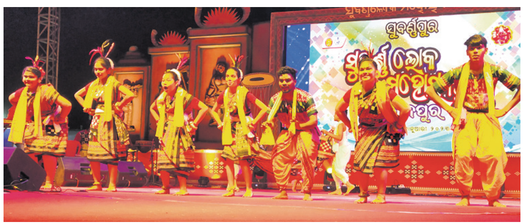
ସୋନପୁର ଗ୍ରେଣ୍ଡି ଏକାଡେମୀର କଳାକାରମାନେ ଭୁବନେଶ୍ୱର ନୃତ୍ୟ ପରିବେଷଣ କରୁଛନ୍ତି ।