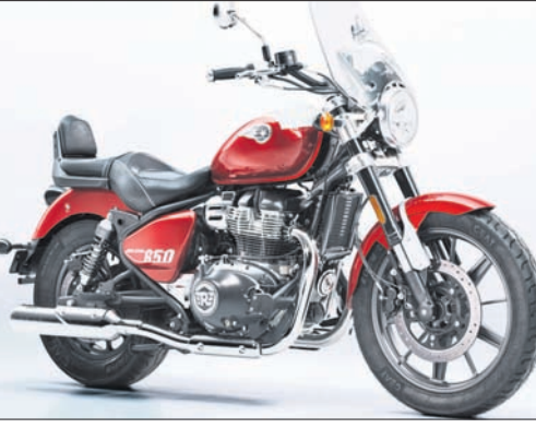
ବିକାର୍ଯ୍ୟ ଲାଭ କରୁଛି, ସୁପର ମିଟିଆର ୨୫୦ର ଉତ୍ପାଦନ ଆରମ୍ଭ ହୋଇଛି।

ନୂଆଦିଲ୍ଲୀ, ୧୭ତମ: ଦେଶର ପ୍ରମୁଖ ପ୍ରିମିୟମ ବାଇକ୍ ବ୍ରାଣ୍ଡ ରୟାଲ ଏନ୍‌ଫିଲ୍ଡର ନୂଆ ସୁପର ମିଟିଆର ୨୫୦ ନିକଟରେ ସର୍ବଭାରତୀୟ ଉନ୍ନତ ହୋଇଯାଇଛି।