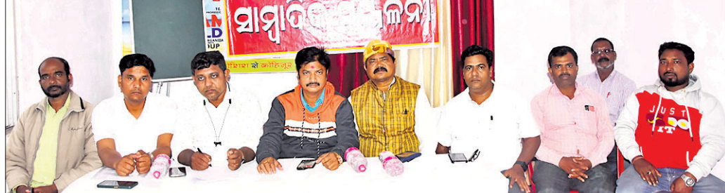
ଖବରଦାତା ସମ୍ମିଳନୀରେ ଉପସ୍ଥିତ ନିର୍ମାଣ ଶ୍ରମିକ ଯୁନିୟନ ସମନ୍ୱୟ କମିଟିର କର୍ମକର୍ତ୍ତାମାନେ

ନିର୍ମାଣ ଶ୍ରମିକ ଯୁନିୟନ ସମନ୍ୱୟ କମିଟି ପୁରୀ ଜିଲ୍ଲା ପକ୍ଷରୁ ଶ୍ରମିକଙ୍କ ବିଭିନ୍ନ ସମସ୍ୟା ଓ ଦାବି ନେଇ ମଙ୍ଗଳବାର ଶ୍ରମଧାବୀଲମ୍ବିତ୍ର ଏକ ଲଢ଼ରେ ଖବରଦାତା ସମ୍ମିଳନୀ ଅନୁଷ୍ଠିତ ହୋଇଥିଲା