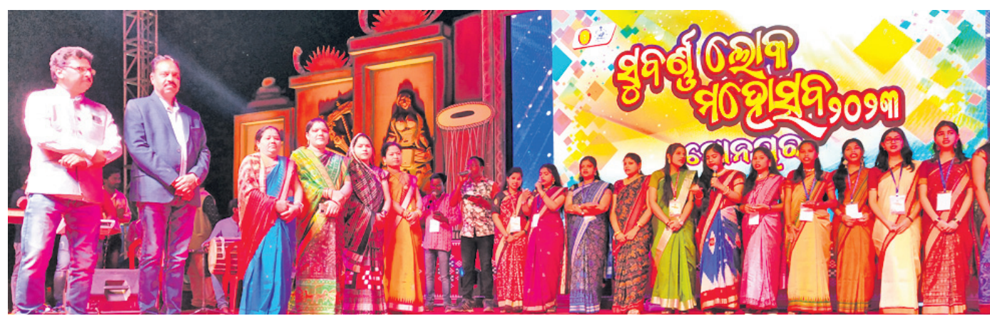
ସୁବର୍ଣ୍ଣ ଲୋକ ପତ୍ରିକା ପଢ଼ାକ୍ରମର ସାଂସ୍କୃତିକ ସମ୍ପାଦନାରେ ଉପସ୍ଥିତ ଅତିଥି ବୃନ୍ଦ ।