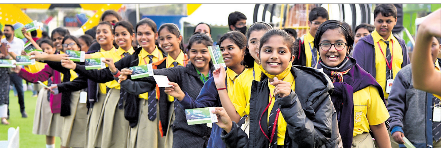
ହକି ବିଶ୍ୱକପ୍ ମ୍ୟାଚ ଦେଖିବାକୁ ଆସିଥିବା ଉଦାହାରୀ ସ୍କୁଲ ଛାତ୍ରାଛାତ୍ରୀ ।