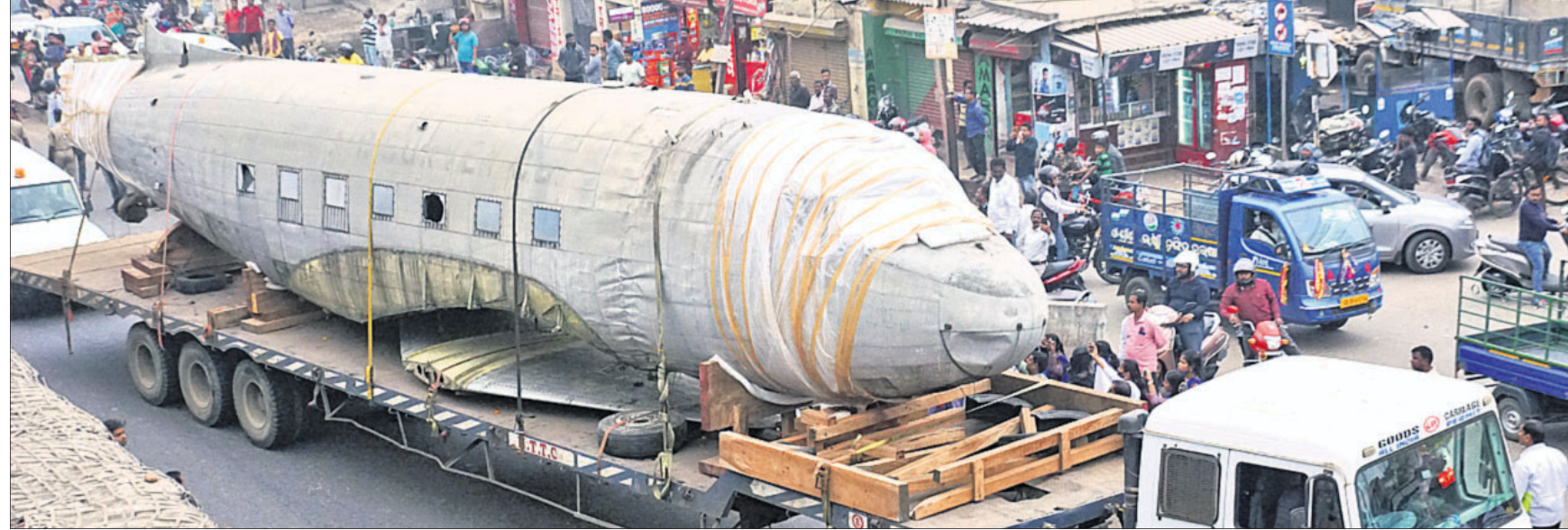
ବିଭୁ ପଟ୍ଟନାୟକଙ୍କ ପ୍ରିଣ୍ଟିଂ ବିମାନ 'ଡାକୋଟା' କୋଲକାତାରୁ ଚେଲର ଯୋଗେ ଭୁବନେଶ୍ୱର ବିମାନବନ୍ଦରକୁ ଅଣାଯାଇଥିବାବେଳେ କଟକଠାରେ ରୁଧିରୀ ଏହାକୁ ଦେଖିବା ପାଇଁ ଲୋକଙ୍କ ଭିଡ଼ । (ରିପୋର୍ଟ: ପୁଷ୍ପା-୫)