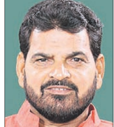
ଡିଏସ୍‌ଏଫ୍‌ଆଇ ଅଧ୍ୟକ୍ଷ ତଥା ଭାଜପା ଏମ୍ପି ବ୍ରଜକୁମାର ଶରଣ ସିଂ

ସର୍ବଭାରତୀୟ କୁସ୍ତି ଫେଡେରେଶନ (ଡିଏସ୍‌ଏଫ୍‌ଆଇ) ଅଧ୍ୟକ୍ଷ ତଥା ଭାଜପା ଏମ୍ପି ବ୍ରଜକୁମାର ଶରଣ ସିଂଘ ନାମରେ ଯୌନ ଶୋଷଣ ଓ ହତ୍ୟା ଧମକ ପରି ସଜିନ ଅଭିଯୋଗ ଆଣିଛନ୍ତି ଭିନେଶ ଫୋଗଟ୍‌। ବିଶ୍ୱ ଚାମ୍ପିୟନଶିପ୍ ପଦକ ବିଜେତା ତଥା ଅଲିମ୍ପିଆନ୍ ଭିନେଶ ରୁଧିରୀ କାହି କାହି ଏଭଳି ଅଭିଯୋଗ କରିବା ସହିତ ପ୍ରଧାନମନ୍ତ୍ରୀ ନରେନ୍ଦ୍ର ମୋଦିଙ୍କ ହସ୍ତକ୍ଷେପ ଏପ୍ରିଲ-୪