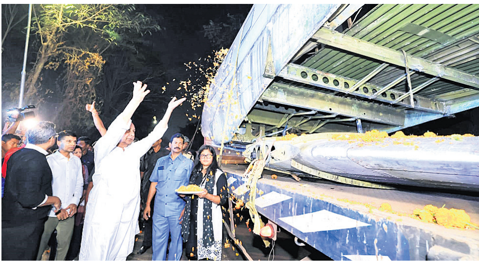
ଭୁବନେଶ୍ୱରରେ ରୁଧିରୀ ଡାକୋଟା ବିମାନ ପହଞ୍ଚିବା ପରେ ପୁଖ୍ୟମନ୍ତ୍ରୀ ନବୀନ ପଟ୍ଟନାୟକ ପୁଷ୍ପ ପକାଇ ସ୍ୱାଗତ କରୁଛନ୍ତି।

ଭୁବନେଶ୍ୱର, ୧୮।୧ (ବୁଧବାର) ବହୁ ପ୍ରତୀକ୍ଷାର ଅନ୍ତ ଘଟିଛି। ପ୍ରବାଦ ପୁରୁଷ ବିକ୍ର ପଟ୍ଟନାୟକଙ୍କ ପ୍ରିୟ 'ଡାକୋଟା' ବିମାନକୁ ରୁଧିରୀ ଭୁବନେଶ୍ୱର ଆଣାଯାଇଛି। ଦୀର୍ଘବର୍ଷ ଧରି କୋଲକାତାସ୍ଥିତ ନେତାଜୀ ସ୍ମାରକ ଚନ୍ଦ୍ର ବୋଷ ଆନ୍ତର୍ଜାତିକ ବିମାନ ବନ୍ଦରରେ ବିପର୍ଯ୍ୟୟ ଅବସ୍ଥାରେ ପଡ଼ି ରହିଥିବା ଏହି ଡାକୋଟା ଡିଏ-୩ ଭିଟି-ଏମୁଆଇ ବିମାନକୁ ଓଡ଼ିଶା ଆଣାଯିବା ପ୍ରକ୍ରିୟା ଶେଷ ହୋଇଛି। ୩ଟି ବଡ଼ ଟ୍ରେଲର ସହାୟତାରେ ଏହି ବିମାନର ଅଂଶବିଶେଷ ଅଲଗା ଅଲଗା ଭାବେ ଭୁବନେଶ୍ୱରରେ ପହଞ୍ଚାଯିବା ପରେ ଏହାକୁ ଲୋକେ ସ୍ୱାଗତ କରିଛନ୍ତି। ଅନେକ ଲୋକ ରାସ୍ତାରେ ଏହାକୁ ଦେଖି ଫଟୋ ଉଠାଇଥିବାର ଦେଖିବାକୁ ମିଳିଛି। ଡାକୋଟାକୁ ଗୁରୁବାର ବିକ୍ର ପଟ୍ଟନାୟକ ବିମାନ ବନ୍ଦରରେ ଅନୁଲୋଚ୍ କରିଥିବା। ଇଞ୍ଜିନିୟରମାନଙ୍କ ସହାୟତାରେ ପୁଣି ଥରେ ଯୋଡ଼ି ପୂର୍ଣ୍ଣାଙ୍ଗ ବିମାନ କରାଯିବ। ଏହି କାର୍ଯ୍ୟ ପାଇଁ ପ୍ରାୟ ୧୦ରୁ ୧୫ ଦିନ ଲାଗିବ। ବିକ୍ରପାଟ୍ଟନାୟକ ସ୍ମୃତି ସହ ଜଡ଼ିତ ଉଚ୍ଚ ଐତିହାସିକ ବିମାନକୁ ବିକ୍ର ପଟ୍ଟନାୟକ ଅନ୍ତର୍ଗତୀୟ ବିମାନ ବନ୍ଦରରେ ରଖାଯିବ। ଏଥିପାଇଁ ବିମାନ ବନ୍ଦର ପ୍ରାଧିକରଣ ପକ୍ଷରୁ ପ୍ରାୟ ୧.୧ ଏକର ଜମି ଦିଆଯାଇଛି। ସେଠାରେ ଏହି ବିମାନକୁ ସର୍ବସାଧାରଣଙ୍କ ନିମନ୍ତେ ପ୍ରଦର୍ଶନ କରାଯିବ। ୨୦୧୭ରେ ରାଜ୍ୟ ସରକାର ଡାକୋଟା ବିମାନକୁ ଓଡ଼ିଶା ଫେରାଇ ଆଣିବା ପାଇଁ ପ୍ରକ୍ରିୟା ଆରମ୍ଭ କରିଥିଲେ। କେନ୍ଦ୍ର ସରକାରଙ୍କ ସହଯୋଗରେ ଏହି ପ୍ରକ୍ରିୟା ସହଜ ହୋଇପାରିଲା। କୋଭିଡ଼ ମହାମାରୀ ଯୋଗୁଁ ଉଚ୍ଚ ବିମାନ ସ୍ଥାନାନ୍ତର ପ୍ରକ୍ରିୟା ସ୍ଥଗିତ ରହିଥିଲା। ଡାକୋଟା ବିମାନର ଲମ୍ବ ପ୍ରାୟ ୬୪.୮ ଫୁଟ ହୋଇଥିବାବେଳେ ଏହାର ଡେଶାକୁ ମିଶାଇଲେ ଏହା ପ୍ରାୟ ୯୫ ଫୁଟ ହେବ। ଦୀର୍ଘବର୍ଷ ଧରି କୋଲକାତା ବିମାନବନ୍ଦରରେ ଅବ୍ୟବହୃତ ଅବସ୍ଥାରେ ପଡ଼ି ରହିଥିବା ପ୍ରାୟ ୮ ଟନ ଓଜନର ଏହି ବିମାନକୁ ଓଡ଼ିଶା ଆଣିବା ପାଇଁ ରାଜ୍ୟ ସରକାର ପ୍ରୟାସ କରିଆସୁଥିଲେ। ଇଣ୍ଡୋନେସିଆ ସାଧାନତା ସଂଗ୍ରାମ ସମୟରେ ଏହି