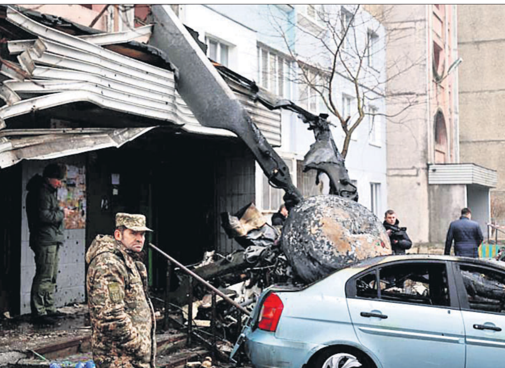
କିଭି ନିକଟସ୍ଥ ଟ୍ରୋଭାରି ସହରର ଏକ ସ୍କୁଲ ଉପରେ ହେଲିକପ୍ଟର ଖସିପଡ଼ିଛି ।

କିଭି, ୧୮।୧ ରାଜଧାନୀ କିଭିର ଟ୍ରୋଭାରିଠାରେ ବୁଧବାର ହେଲିକପ୍ଟର ଦୁର୍ଘଟଣାରେ ୧୮ ଜଣଙ୍କ ମୃତ୍ୟୁ ଘଟିଛି । ମୃତକଙ୍କ ମଧ୍ୟରେ ଯୁକ୍ତରାଷ୍ଟ୍ର ସରକାରୀ ମନ୍ତ୍ରୀ ତେନିସ୍ ମୋନାସ୍ଟିରସ୍କି, ଡେପୁଟି ମିନିଷ୍ଟର ଯେନାୟେନ ଯେନିନ, ସେକ୍ରେଟାରୀ ଯୁରି ଲବକୋଭିଚ୍ ସମେତ ୩ ଶିଶୁ ସାମିଲ ଅଛନ୍ତି । ଟ୍ରୋଭାରିର କିଷ୍ଟଗାର୍ଡେନ (ନର୍ସିଂ ସ୍କୁଲ) ଛାତରେ ପଡିଥିବା ଏହି ଦୁର୍ଘଟଣା ଘଟିଛି । ଘଟଣାରେ ୧୦ ଶିଶୁଙ୍କ ସମେତ ୨୫ ଗୁରୁତର ଭାବେ ଆହତ ହୋଇଥିବା