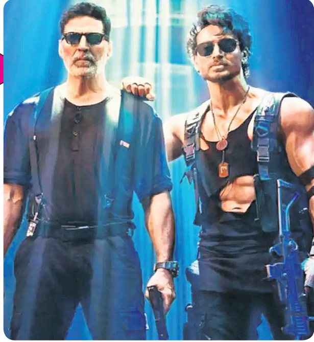
ଅକ୍ଷୟ କୁମାର - ଗାଇଗର ଶ୍ରୀଫ