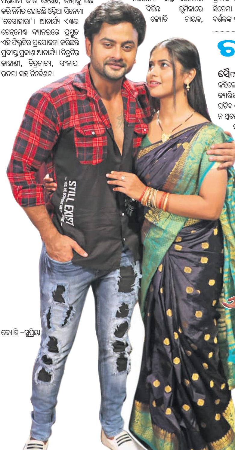
କ୍ୟୋତି - ସୁପ୍ରିୟା