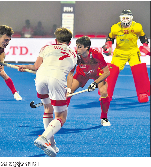
ଇଂଲଣ୍ଡ ଓ ସ୍ୱେନ ମଧ୍ୟରେ ଅନୁଷ୍ଠିତ ମ୍ୟାଚ୍।

ଭୁବନେଶ୍ୱର, ୧୯୧୧ (କ୍ରାନ୍ତୀ ପ୍ରତିନିଧି) କଳିଙ୍ଗ ଷ୍ଟାଡିୟମରେ ଚାଲିଥିବା ହକି ବିଶ୍ୱକପର ଗୁରୁବାର ଅନୁଷ୍ଠିତ ଏକ ପୁଲ୍ 'ଡି' ମ୍ୟାଚରେ ଇଂଲଣ୍ଡ ୪-୦ ଗୋଲରେ ସ୍ୱେନକୁ ପରାସ୍ତ କରିଛି। ଫଳରେ ଇଂଲଣ୍ଡ ଅପରାଜେୟ ରହି ୩ ମ୍ୟାଚରୁ ୬ ପଏଣ୍ଟ ପାଇଛି। ଦଳର ଗୋଲ ବ୍ୟବଧାନ ୯ ରହିଛି। ୩ ମ୍ୟାଚରେ ଦଳ ୨ଟି ବିଜୟ ହାସଲ କରିଥିବାବେଳେ ଗୋଟିଏ ମ୍ୟାଚ ଡ୍ର ରଖିଛି। ୯ ଗୋଲ ଦେଇଛି, ହେଲେ ଗୋଟିଏ ବି ଗୋଲ ବରଣ କରିନାହିଁ। ଅନ୍ୟପକ୍ଷରେ ସ୍ୱେନ ୩ ମ୍ୟାଚରୁ ୨ ପରାଜୟ ସହ ୩ ପଏଣ୍ଟରେ ରହି କ୍ରସ୍ ଓଭର ଖେଳିବାକୁ ଯୋଗ୍ୟ ବିବେଚିତ ହୋଇଛି। ଦଳ ୫ଟି ଗୋଲ ଦେଇଥିବାବେଳେ ୭ଟି ବରଣ କରିଛି। ଉନ୍ନତ ପ୍ରଦର୍ଶନ ପାଇଁ ଇଂଲଣ୍ଡର ଫିଲ୍ ରୋପର ସେୟର ଅଫ୍ ଦି ମ୍ୟାଚ ବିବେଚିତ ହୋଇଛନ୍ତି। ଏହି ମ୍ୟାଚରେ ଇଂଲଣ୍ଡର