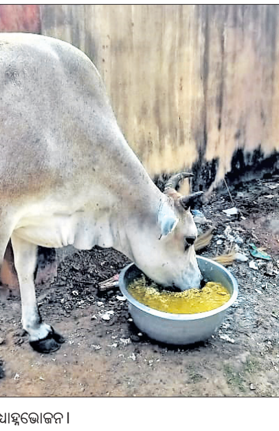
ବିଦ୍ୟାଳୟ ବାହାରେ ଗୋରୁ ଖାଇଥିବା ମଧ୍ୟାହ୍ନଭୋଜନ ।