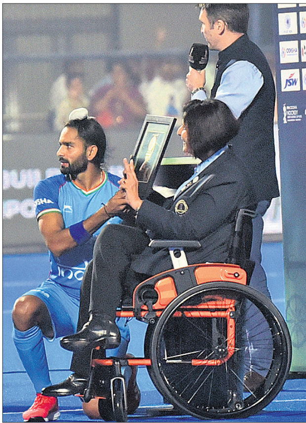
ଭାରତର ଆକାଶବାସୀ ସିଂଙ୍କୁ ପାରାଲିମ୍ପିୟାନ ଦୀପା ମଲିକ ସେୟର ଅଫ୍ ଦି ମ୍ୟାଚ ପୁରସ୍କାର ପ୍ରଦାନ କରୁଛନ୍ତି।