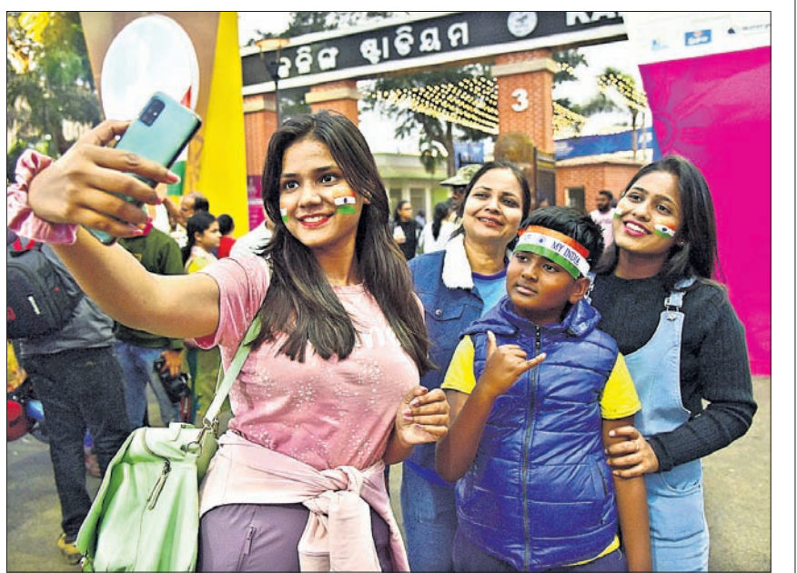
ସେଲଫି ନେବାରେ ବ୍ୟସ୍ତ ପ୍ରଶଂସକ।