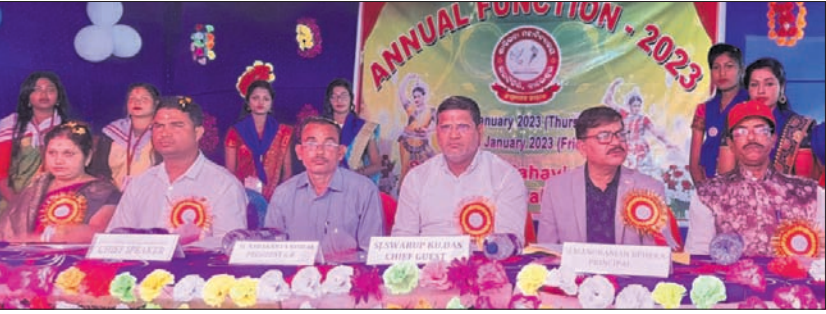
ବାର୍ଷିକ ଉତ୍ସବରେ ମଞ୍ଚାସନ ଅତିଥି ।