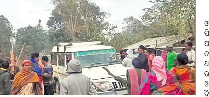
ଅବକାରୀ ବିଭାଗ ଗାଡ଼ିକୁ ଲୋକେ ଅଟକାଇଛନ୍ତି।

ମୟୂରଭଞ୍ଜ ଜିଲ୍ଲା ଝାରପୋଖରିଆ ଥାନା ଅଧୀନ ପାକଟିଆ ଗ୍ରାମ ଦିଗ କଲୋନୀ ସାହିରେ ମଦ ଜବତ କରିବାକୁ ଯାଇଥିବା ଅବକାରୀ କର୍ମଚାରୀ ଗ୍ରାମବାସୀଙ୍କ ଆକ୍ରମଣର ଶିକାର ହୋଇଛନ୍ତି।