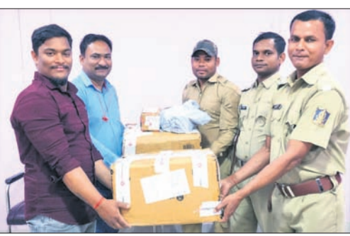
ଜବତ ମୋବାଇଲ ହସ୍ତାନ୍ତର କରୁଛି ପୋଲିସ ।