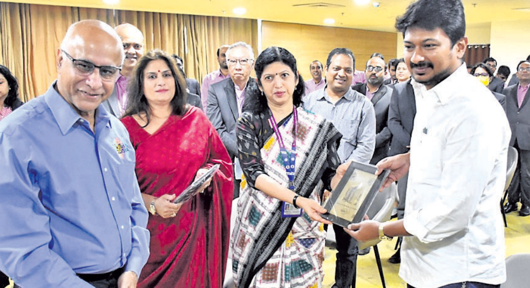
ଡବ୍‌ସ୍ ଯେଉଁ ପରିଦର୍ଶନ ଅବସରରେ ଗାମିଲ ନାଟୁଙ୍କ ମୁଖ୍ୟମନ୍ତ୍ରୀଙ୍କୁ ସମ୍ମାନିତ କରାଯାଇଛି।

ଭୁବନେଶ୍ୱର, ୧୯୧୧ (ଭୁବନେଶ୍ୱର) ଗାମିଲ ନାଟୁଙ୍କୁ ମୁଖ୍ୟମନ୍ତ୍ରୀ ଓ କ୍ରୀଡ଼ା ମନ୍ତ୍ରୀଙ୍କୁ ସମ୍ମାନିତ କରାଯାଇଛି। ଗାମିଲ ନାଟୁଙ୍କୁ ମୁଖ୍ୟମନ୍ତ୍ରୀଙ୍କୁ ସମ୍ମାନିତ କରାଯାଇଛି। ଗାମିଲ ନାଟୁଙ୍କୁ ମୁଖ୍ୟମନ୍ତ୍ରୀଙ୍କୁ ସମ୍ମାନିତ କରାଯାଇଛି।