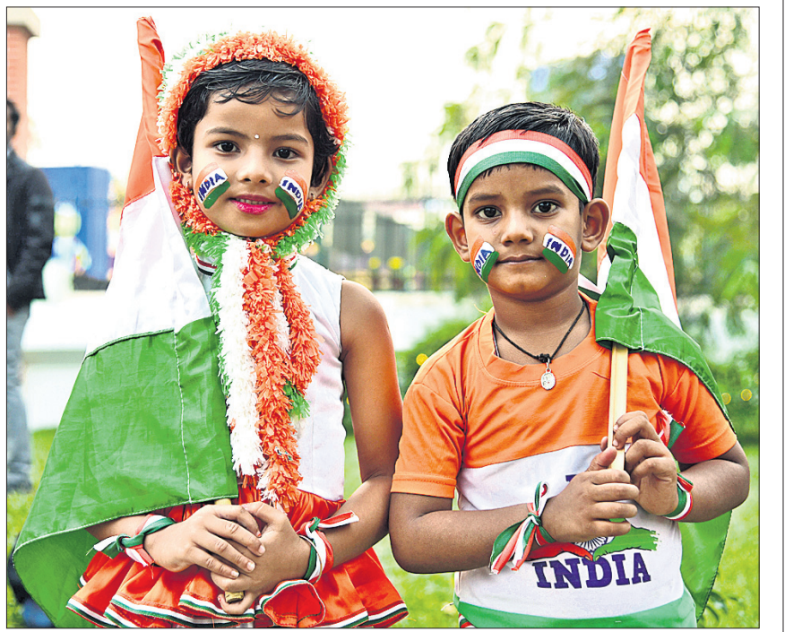
ଭୁବନେଶ୍ୱରରେ ସକଳ ହୋଇଛନ୍ତି କୁନି ସମର୍ଥକ।