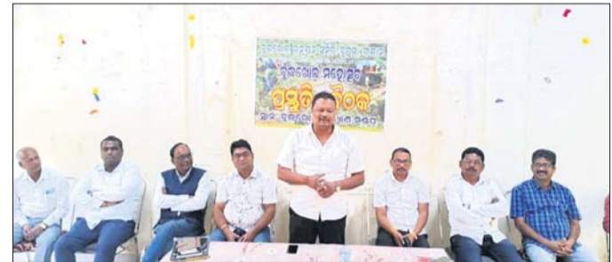
ଶେଷ ପ୍ରସ୍ତୁତି ବୈଠକରେ ଉପସ୍ଥିତ କର୍ମଚର ସଭାପତି ଓ ଅନ୍ୟମାନେ।