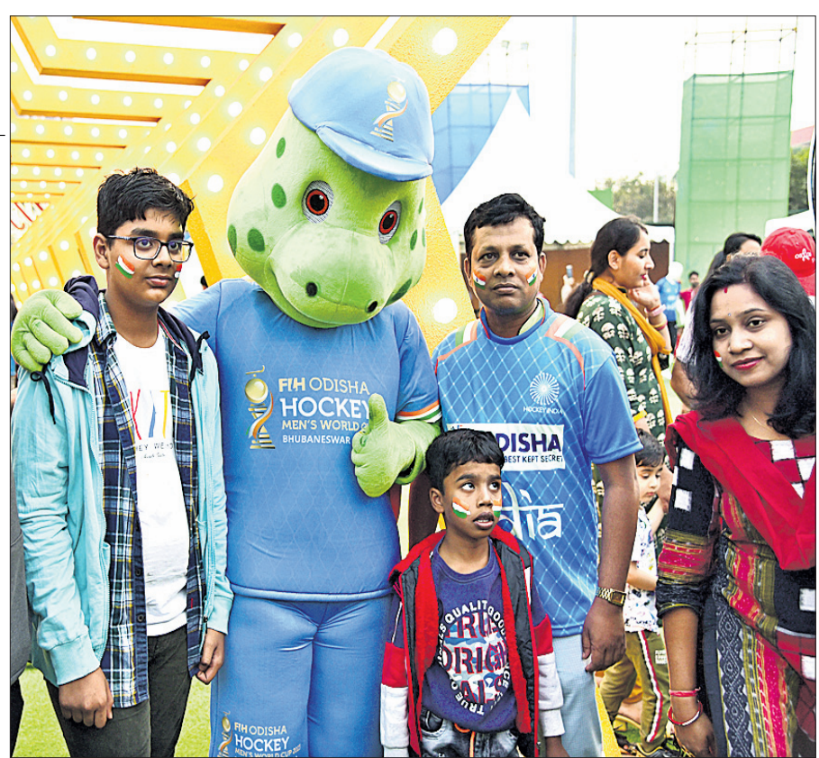
ଓଲି ସହ ପଟୋ ଉଠାଇଛନ୍ତି ଭାରତୀୟ ପ୍ରଶଂସକ।