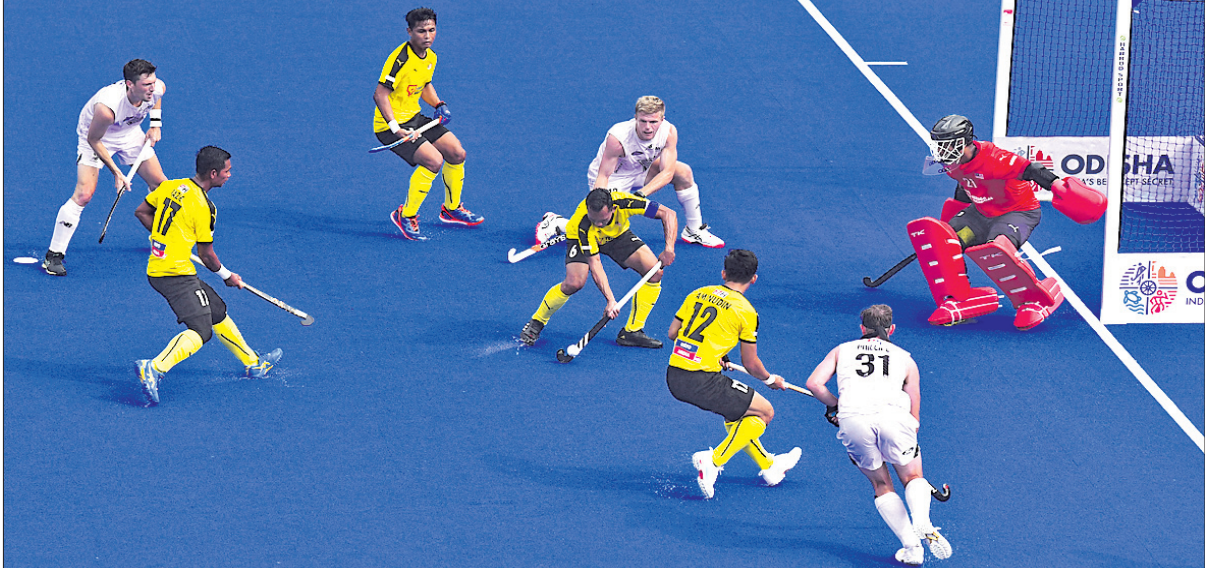
ନ୍ୟୁଜିଲାଣ୍ଡ ବିପକ୍ଷରେ ମାଲେସିଆ ଖେଳାଳିଙ୍କ ଗୋଲ ଘୋର ପ୍ରୟାସ।