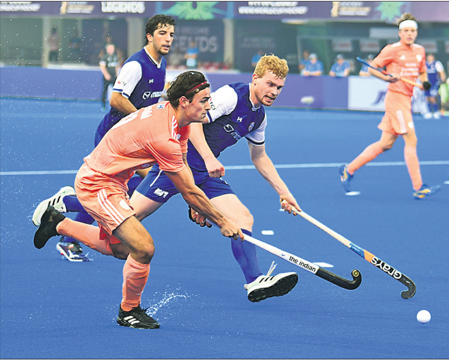
ନେଦରଲାଣ୍ଡ ଓ ଟିଲି ମଧ୍ୟରେ ଅନୁଷ୍ଠିତ ମ୍ୟାଚର ଏକ ସଂଘର୍ଷପୂର୍ଣ୍ଣ ମୁହୂର୍ତ୍ତ।