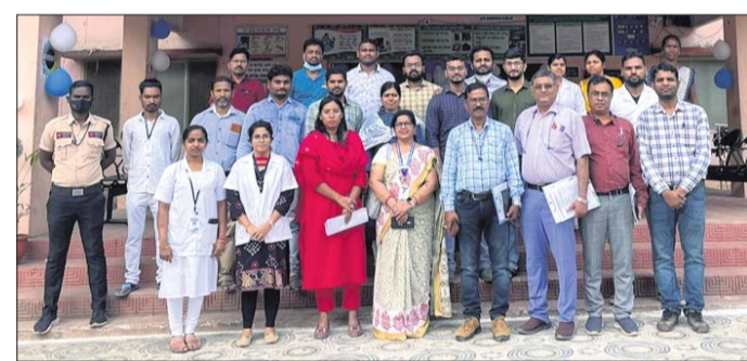
କାୟାକଳ୍ପ ଟିମ୍ ସହ ସ୍ୱାସ୍ଥ୍ୟକେନ୍ଦ୍ର ଅଧିକାରୀ ଓ କର୍ମଚାରୀ।

ଆର.ଉଦୟଗିରି, ୧୯୧୧ (ଡି.ଏନ.ଏ.) ରୂପବାର ଗଜପତି ଜିଲ୍ଲା ମୋହନା, ଚନ୍ଦ୍ରଗିରି ଏବଂ ମଙ୍ଗଳବାସର ଆର.ଉଦୟଗିରି ଓ ଖରୁଡ଼ିପଦାରେ କାୟାକଳ୍ପ ବିଭାଗର ଟିମ୍‌ଟିମ୍‌ଟିମ୍ ପହଞ୍ଚି ପରିଦର୍ଶନ କରିଥିଲେ।