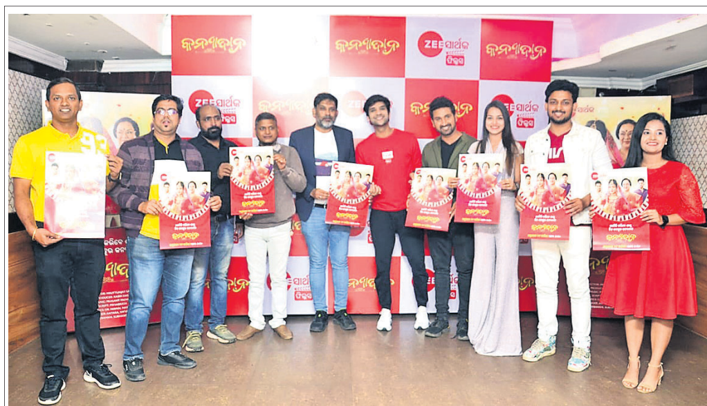
ରାଜ୍ୟର ପ୍ରମୁଖ ମନୋରଞ୍ଜନଭିତ୍ତିକ ଘରୋଇ ବ୍ୟାପକ କମ୍ପାନୀ ରିଲିଏନ୍ସ ଜିଓରୁ ଶୁଭାରମ୍ଭ ଆୟୋଜିତ ଏକ ସ୍ୱତନ୍ତ୍ର କାର୍ଯ୍ୟକ୍ରମରେ କମ୍ପାନୀର ଫିଲ୍ମର ଡ୍ରେମାଟିକ ଫିଲ୍ମ 'କନ୍ୟାବାନ'ର ଅତିଥି ଓ ପୋଷ୍ଟର ରିଲିଜ୍ ହୋଇଯାଇଛି। ଏହି ପରିପ୍ରେକ୍ଷାରେ ବ୍ୟାପକର ବିଭିନ୍ନ ଅଧିକାରୀଙ୍କ ସମେତ ଆମନ୍ତ୍ରିତ କଳାକାର ଓ ଅନ୍ୟମାନେ ଚଳଚ୍ଚିତ୍ରର ପୋଷ୍ଟର ରିଲିଜ୍ କରୁଛନ୍ତି।

ବୃଦ୍ଧି ପାଇ ୪୩.୨୯ କୋଟିର ପହଞ୍ଚିଥିବା ବେଳେ ଗ୍ରାହକ ପିଛା ପ୍ରତିମାସ ରାଜସ୍ୱ ୧୭୮.୨ ଟଙ୍କାକୁ ବୃଦ୍ଧି ପାଇଛି। ସେହିଭଳି ଏହି ଡ୍ରେମାଟିକ ଫିଲ୍ମ ନେଟ୍‌ୱାର୍କରେ ଉପା ଗ୍ରାହକ ୨୯ ବିଲିଅନ ଡିଜିଟାଲ ପାଇଥିବା ବେଳେ ଭଏସ୍ ଗ୍ରାହକ ୧.୨୭ ବିଲିଅନ ବିଲିଅନକୁ ବୃଦ୍ଧି ପାଇଥିବା କମ୍ପାନୀ ପକ୍ଷରୁ ପ୍ରକାଶ କରାଯାଇଛି। ଏ ସମ୍ପର୍କରେ ରିଲିଏନ୍ସ ଜିଓ ଇନଫୋକମ୍ ଲିମିଟେଡ୍‌ର ଅଧ୍ୟକ୍ଷ ଆକାଶ ଅମ୍ବାନୀ କହିଛନ୍ତି, ଭାରତ ଭଳି ବିଶାଳ ଦେଶରେ ଦ୍ରୁତ ୫ଟି ସମ୍ପ୍ରଦାୟ କାର୍ଯ୍ୟ କ୍ଷେତ୍ର ଲାଭି ରଖିଛି, ମାତ୍ର ୩ ମାସ ଅବଧି ମଧ୍ୟରେ କମ୍ପାନୀ ଦେଶର ୧୩୪ ତୃତୀୟ ଡ୍ରେମାଟିକ ଫିଲ୍ମରେ କମ୍ପାନୀର ମୋଟ ପରିଚାଳନାଗତ ରାଜସ୍ୱ ଆୟ ୨୨.୯୮୮ କୋଟି ଟଙ୍କାକୁ ବୃଦ୍ଧି ପାଇଛି। ଏପରିକି ଏହି ଡ୍ରେମାଟିକ ଫିଲ୍ମ ଉପଭୋକ୍ତାଙ୍କ ସଂଖ୍ୟା