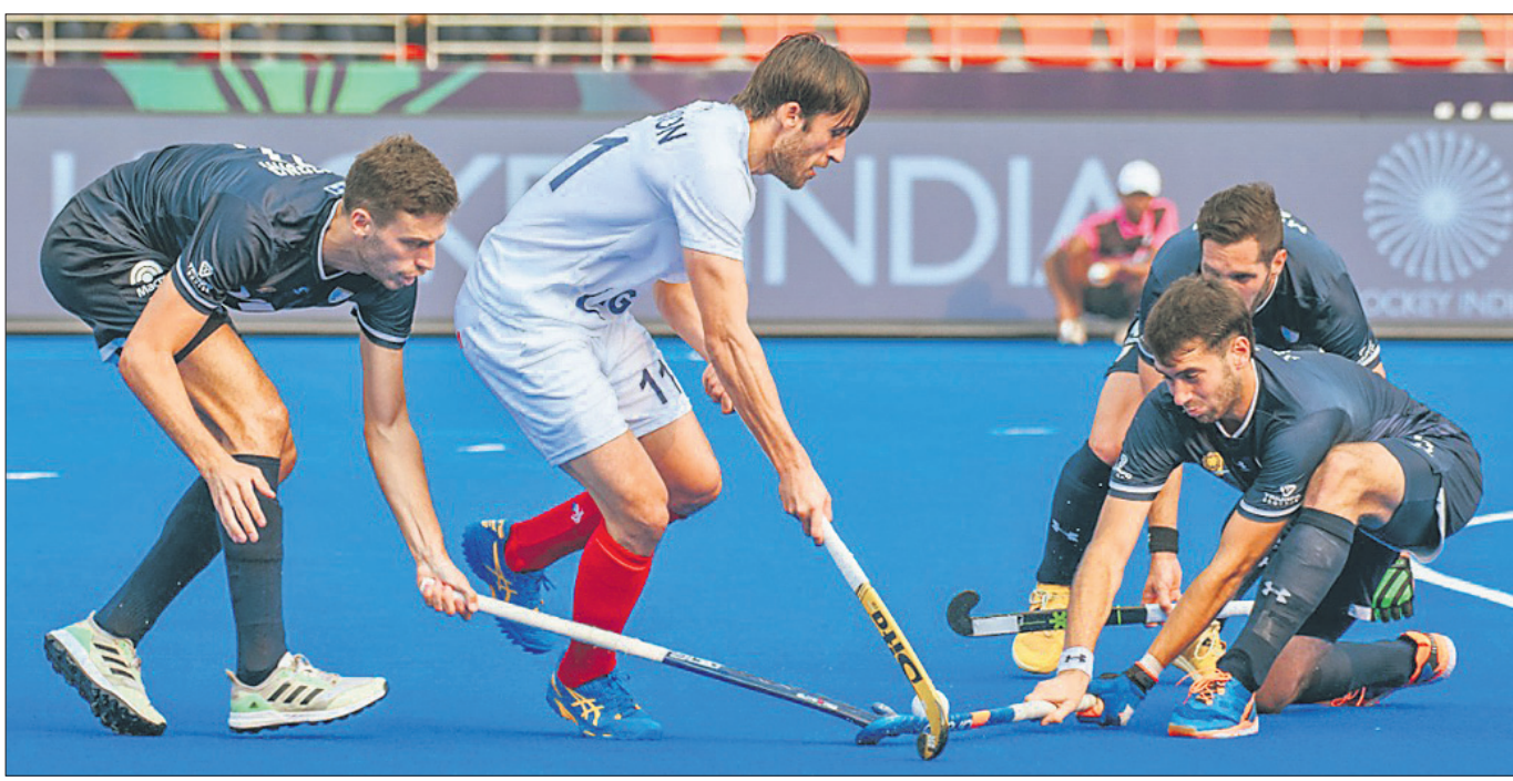
ଆଇଣ୍ଡିଆ-ପ୍ରାନ୍ତ ମ୍ୟାଚର ଏକ ସଂଘର୍ଷପୂର୍ଣ୍ଣ ମୁହୂର୍ତ୍ତ।