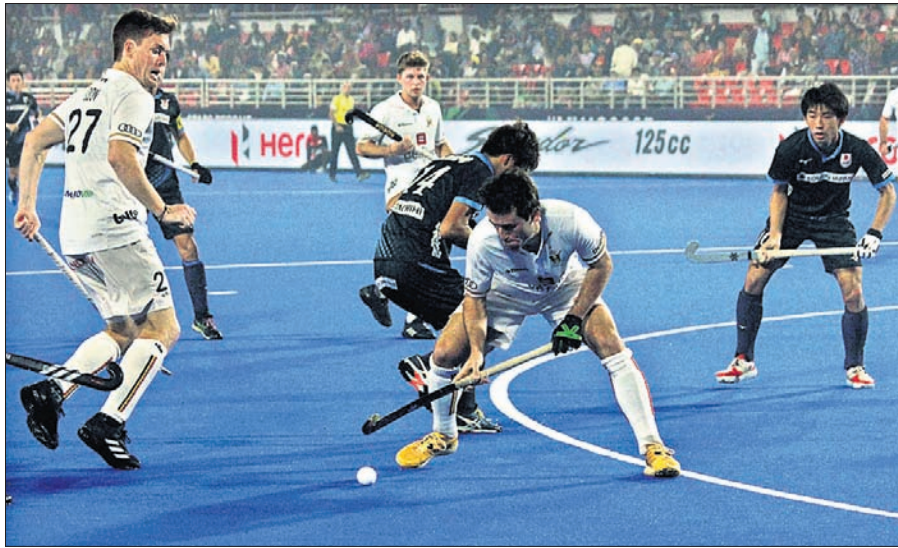
ଜାପାନ ବିପକ୍ଷ ମ୍ୟାଚ ଅବସରରେ ବେଲଜିୟମ ପକ୍ଷରୁ ୫ ଗୋଲ ଦେଇଥିବା ଚମ୍ ବୁନ୍ (ବାମ)।

ରାଉରକେଲା ଅଫିସ/ଭୁବନେଶ୍ୱର (କ୍ରୀଡ଼ା ପ୍ରତିନିଧି), ୨୦୧୧ ଗତଥର ରାମିୟନ ବେଲଜିୟମ ଏଥର ମଧ୍ୟ ପ୍ରଭାବୀ ପ୍ରଦର୍ଶନ ଜାରି ରଖି ହକି ବିଶ୍ୱକପର କ୍ୱାର୍ଟର ଫାଇନାଲରେ ପ୍ରବେଶ କରିଛି। ଶୁକ୍ରବାର ବିର୍ସା ପୁଣ୍ୟା ଷ୍ଟାଡ଼ିୟମରେ ଅନୁଷ୍ଠିତ ପୁଲ୍ 'ବି'ର ଏକ ମ୍ୟାଚରେ ଏହି ଦଳ ୭-୧ ଗୋଲରେ ଏସୀୟ ଦଳ ଜାପାନକୁ ପରାସ୍ତ କରିଛି। ତାରକା ଖେଳାଳି ଚମ୍ ବୁନ୍ ୨୧, ୨୬, ୨୭, ୫୦ ଓ ୫୫ତମ ମିନିଟରେ ଏକାକୀ ୫ଟି ଗୋଲ ଦେଇ ବେଲଜିୟମକୁ ବୃହତ୍ ବିଜୟ ଦେବାରେ ମୁଖ୍ୟ ଭୂମିକା ଗ୍ରହଣ କରିଥିଲେ। ସେ ୪ଟି ଫିଲ୍ଡ ଗୋଲ ଦେଇଥିବାବେଳେ ୫୫ତମ ମିନିଟରେ ଜାପାନ ଖେଳାଳିଙ୍କ ବିପକ୍ଷରେ +୧୧ ଥିବାବେଳେ ଜର୍ମାନୀ +୮