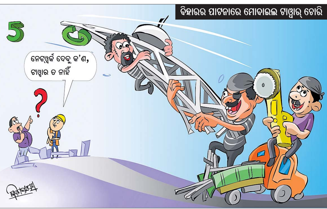
ବିହାରର ପାଟନାରେ ମୋବାଇଲ ଟାଉର ଗୋଟି