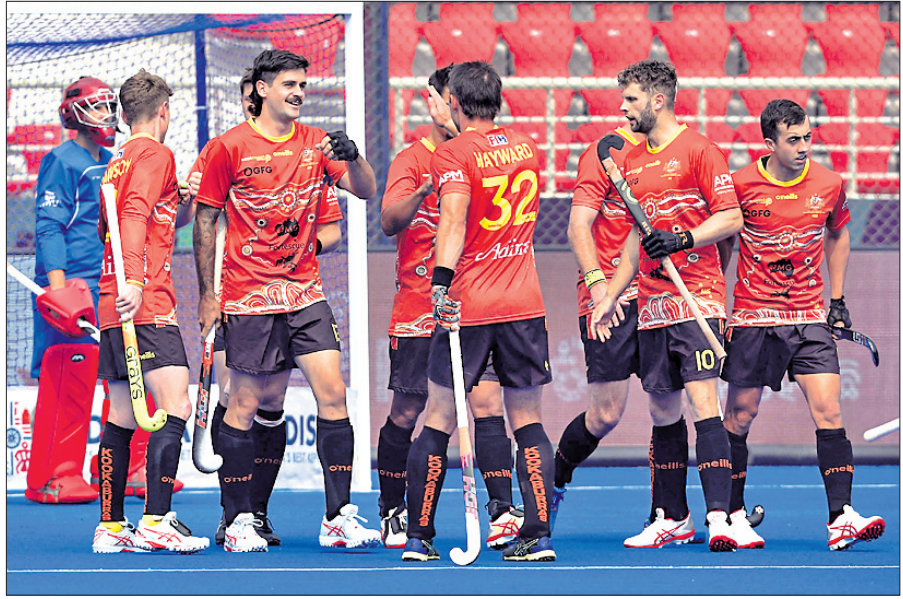
ମ୍ୟାଚ ଜିତିବା ପରେ ଉଲ୍ଲାସିତ ଅଷ୍ଟ୍ରେଲିଆ ଖେଳାଳି।

ଡିନିଥର ରାମିୟନ ଓ ଦୁଇଥର ରନରଥ୍ ଅଷ୍ଟ୍ରେଲିଆ ପ୍ରଭାବୀ ପ୍ରଦର୍ଶନ ବଜାୟ ରଖି ଚଳିତ ହକି ବିଶ୍ୱକପର କ୍ୱାର୍ଟର ଫାଇନାଲରେ ପ୍ରବେଶ କରିଛି। ରାଉରକେଲାରେ ବିର୍ସା ପୁଣ୍ୟା ଷ୍ଟାଡ଼ିୟମରେ ଶୁକ୍ରବାର ଅନୁଷ୍ଠିତ ପୁଲ୍ 'ଏ'ର ଏକ ମ୍ୟାଚରେ ଏହି ଦଳ ଦକ୍ଷିଣ ଆଫ୍ରିକାକୁ ବୃହତ୍ ବ୍ୟବଧାନ ୯-୨ ଗୋଲରେ ପରାସ୍ତ କରିଛି। କେନ୍ଦ୍ର ଗୋଲ୍ଡର୍ ୩,