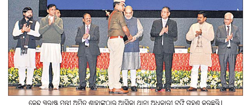
କେନ୍ଦ୍ର ସ୍ୱରାଷ୍ଟ୍ର ମନ୍ତ୍ରୀ ଅମିତ ଶାହାଙ୍କଠାରୁ ଆସିବା ଥାନା ଅଧିକାରୀ ଚୁଫି ଗ୍ରହଣ କରୁଛନ୍ତି।

ପରିବର୍ତ୍ତନ ଏବଂ ସମାପ୍ତତା ମଧ୍ୟରେ କାର୍ଯ୍ୟ ସମ୍ପାଦନ ଭଳି ୧୬୫ଟି ବିଷୟ ଆଧାରରେ ଉତ୍ତମ ପ୍ରଦର୍ଶନ କରି ଆସିବା ଥାନା ସମ୍ପର୍କୀୟ ହାସଲ କରିଥିଲା। ଯାହାକି ସର୍ବ ଭାରତୀୟ ସ୍ତରରେ ଓଡ଼ିଶା ପୋଲିସ ପାଇଁ ଏହା ପ୍ରଥମ ବୋଲି