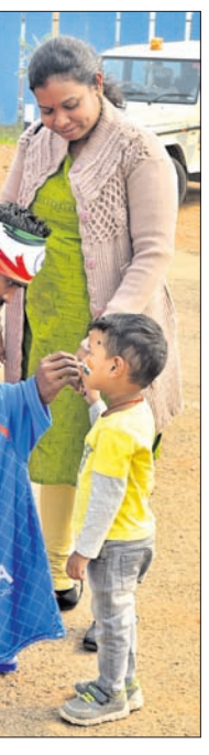
ଜଣେ ମହିଳା ତାଙ୍କ ସାନ ପୁଅକୁ ଚିତ୍ରିତ କରାଉଛନ୍ତି।