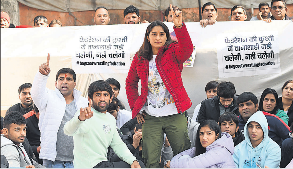
ମହିଳା କୁସ୍ତିବନ୍ଦୁକ ଯୌନ ଶୋଷଣ ଅଭିଯୋଗରେ ଡବ୍ଲ୍ୟୁଏଫଆଇ ମୁଖ୍ୟ ତ୍ରିକ୍ ଭୃକ୍ଷଣ ଶରଣ ସିଂଙ୍କୁ ପଦବୀରୁ ବହିଷ୍କାର ଦାବିରେ ଶୁକ୍ରବାର ନୂଆଦିଲ୍ଲୀର ଯତ୍ନରତନରେ ଧାରଣା ଦେଇଥିବା ବିଶିଷ୍ଟ ରେଭଲର ଓ ଅନ୍ୟମାନେ।