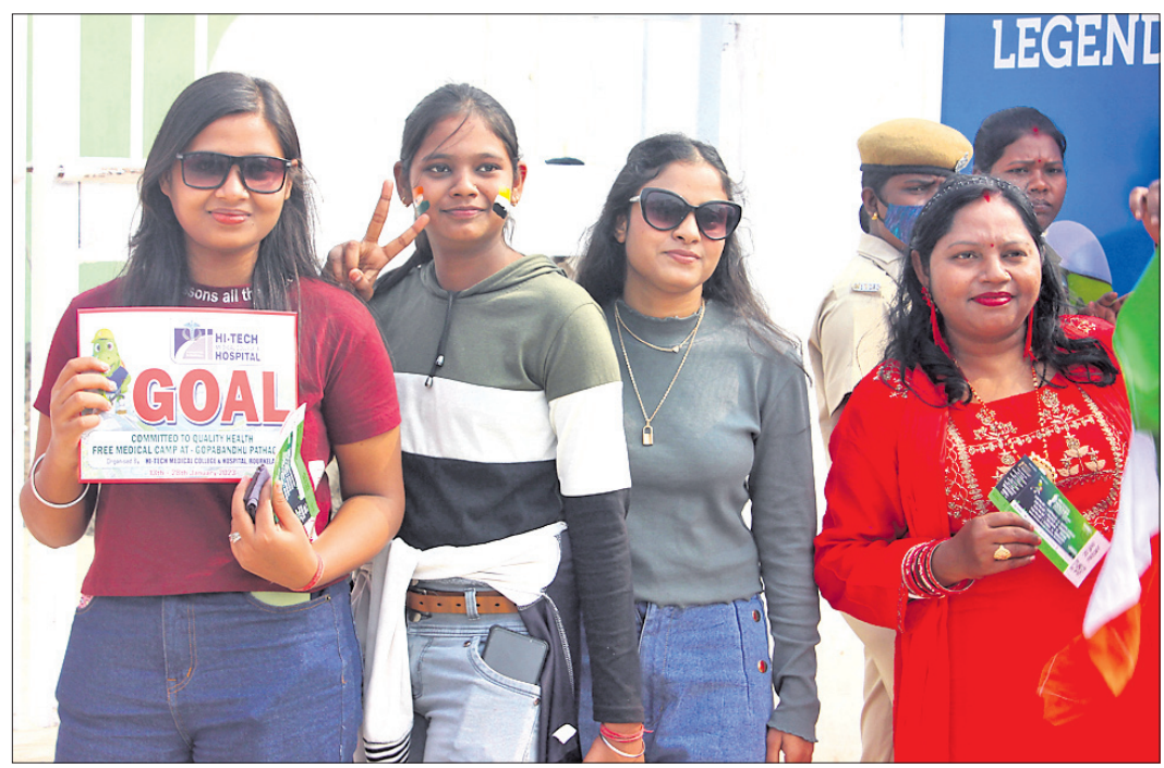
ବିର୍ସା ପୁଣ୍ୟା ଷ୍ଟାଡ଼ିୟମକୁ ଶୁକ୍ରବାର ମ୍ୟାଚ ଦେଖିବା ପାଇଁ ପ୍ରବେଶ ଅବସରରେ ମହିଳା ଦର୍ଶକ।

୩ଟି ଗୋଲ ଦେଇ ହ୍ୟାଟ୍ରିକ୍ ଅର୍ଜନ କରିଥିଲେ। ଅନ୍ୟମାନଙ୍କ ମଧ୍ୟରେ ଗୋଷ୍ଠୀଲୋ ପିଲାଟ ୪୨, କୁସ୍‌ରୁସ୍ ଫ୍ରେଗାଟ୍ ୫୦, ମ୍ୟାଟ୍ ଗ୍ରାମ୍‌ରୁସ୍ ୫୨ ଓ ମୋରିଜ୍ ଲୁଡ଼଼ୱିଗ୍ ୫୨ତମ ମିନିଟରେ ଗୋଟିଏ ଲେଖାଏ ଗୋଲ ଦେଇଥିଲେ।