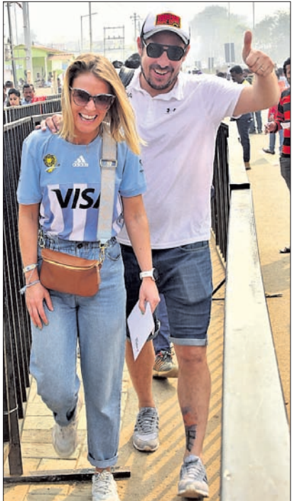
ସ୍ୱାସ୍ଥ୍ୟମନ୍ତ୍ରୀଙ୍କୁ ପ୍ରଦେଶ ଅବସରରେ ଦୁଇ ବିଦେଶୀ ଦର୍ଶକ।