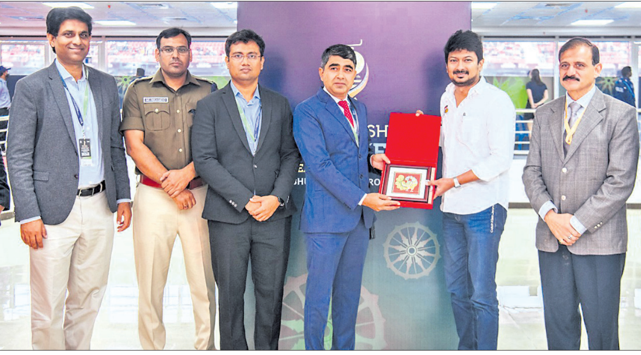
ବିର୍ଯ୍ୟା ମୁଖ୍ୟ ସ୍ୱାସ୍ଥ୍ୟମନ୍ତ୍ରୀଙ୍କୁ ଶୁଭକାମୀ ପତ୍ର ଗ୍ରହଣ କରିବା ପାଇଁ ଉପସ୍ଥିତ ଥିବା ବିଭିନ୍ନ ସଂସ୍ଥାର ଅଧିକାରୀମାନଙ୍କ ସହିତ ମୁଖ୍ୟ ସ୍ୱାସ୍ଥ୍ୟମନ୍ତ୍ରୀଙ୍କର ଗୋଟିଏ ଫଟୋ ଗ୍ରହଣ କରାଯାଇଛି।