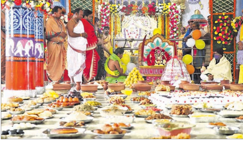
ମା' ବରଳାଦେବୀଙ୍କ ନିକଟରେ ୧୦୦୮ ପ୍ରକାର ପ୍ରସାଦ ଲାଗି କରାଯାଇଛି।

ବାଲେଶ୍ୱର ଅଧିକ, ୨୦୧୧ ପ୍ରସାଦ ଲାଗି କରାଯାଇଥିଲା। ଶ୍ରଦ୍ଧାଳୁମାନେ ପାଠ ପଢ଼ିବାର ଉପଯୁକ୍ତ ରହି ନିଷ୍କାର ସହ ସମସ୍ତ ପ୍ରସାଦ ପ୍ରସ୍ତୁତ କରିଥିଲେ।