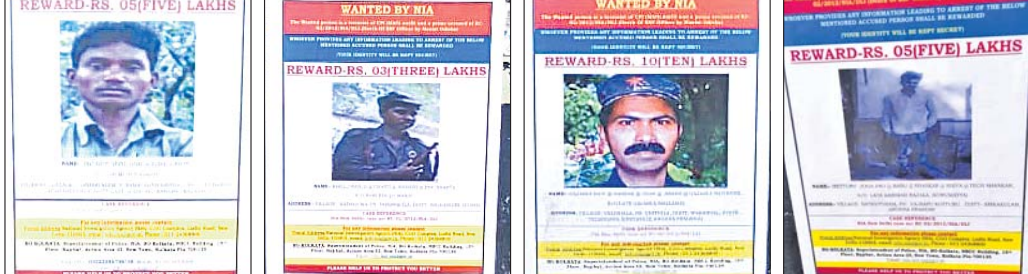
ଏନ୍‌ଆଇଏ ପକ୍ଷରୁ କୁହାଯାଇଛି କୋରାପୁଟ ଜିଲ୍ଲାରେ ମାଓବାଦୀଙ୍କ ସ୍ଥିତି ବର୍ତ୍ତମାନ ସେତେତା ନାହିଁ। ତେବେ କୋରାପୁଟ ବସ୍ତୁଗୁଣ୍ଡରେ ଗୁରୁବାର ରାତିରେ ଏହି ପୋଷ୍ଟର ବିକି ଦିଆଯାଇଛି। ସେ ନେଇ ପୋଲିସ୍ ବିଭାଗରେ କୌଣସି ସୂଚନା ନାହିଁ।