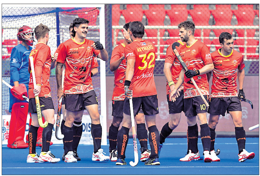
ମ୍ୟାଚ ଜିତିବା ପରେ ଉଲ୍ଲାସରେ ଅଷ୍ଟ୍ରେଲିଆ ଖେଳାଳି।

ତିନିଥର ଚାମ୍ପିୟନ ଓ ଦୁଇଥର ରନରଅପ୍ ଅଷ୍ଟ୍ରେଲିଆ ପ୍ରଭାବୀ ପ୍ରଦର୍ଶନ ବଜାୟ ରଖି ଚଳିତ ହକି ବିଶ୍ୱକପର କ୍ୱାର୍ଟର ଫାଇନାଲରେ ପ୍ରବେଶ କରିଛି। ରାଉରକେଲାରେ ବିର୍ସା ମୁଖ୍ୟ ସ୍ଥଳରେ ଶୁକ୍ରବାର ଅନୁଷ୍ଠିତ ପୁଲ୍ 'ଏ'ର ଏକ ମ୍ୟାଚରେ ଏହି ଦଳ ଦକ୍ଷିଣ ଆଫ୍ରିକାକୁ ବୁହର୍ ବ୍ୟବଧାନ ୯-୨ ଗୋଲରେ ପରାସ୍ତ କରିଛି। କେବଳ ଗୋଲ୍ସ୍କରୀ, ୨୦୧୧