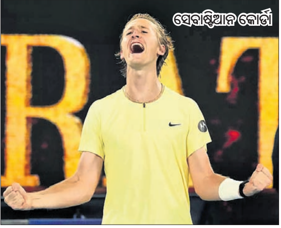
ସେବାସ୍ଥିଆନ କୋର୍ଡା କୋର୍ଡା ଗର୍ଭ ସେମାନଙ୍କ ତୃତୀୟ ରାଉଣ୍ଡ ମ୍ୟାଚରେ ସହଜ ବିଜୟ ହାସଲ କରିଛନ୍ତି। ମେଲବୋର୍ନ ପାର୍କରେ ଗତ ଦୁଇବର୍ଷର କ୍ୱାର୍ଟରଫାଇନାଲିଷ୍ଟ ତୃତୀୟ ସିଡିଏ

ଖେଳାଳିମାନେ ହେଲେ ସ୍ପୋର୍ଟସ୍ ସିଡିଏସ୍, ଜାନିକ ସିନର, ଫେଲିକ୍ସ ଅଗର-ଅଲିଆସିମ୍, ଜିରି ଲେହେକା, କାରେନ କାଟାବୋଲ ଓ ଯୋଶିହିତୋ ନିଶିଓକା। ମହିଳା ସିଙ୍ଗଲ୍ସରେ ଆମେରିକାର ଗାଲଗେଲ ଫେରାଲ୍ଡ କେସିକା ପେଗୁଲ୍ଲା ଓ ପେଗୁଲ୍ଲା ୬-୦-୬-୨ରେ ମାର୍ଗା କୋଷ୍ଟିକୋଙ୍କୁ ପରାସ୍ତ କରିଥିବା ବେଳେ ୬ମ ସିଡିଏ ୬-୩, ୬-୨ରେ ବନିତା ପେରାଲ୍ଡ ହରାଇ ପ୍ରି-କ୍ୱାର୍ଟରରେ ପ୍ରବେଶ କରିଛନ୍ତି। ଚତୁର୍ଥ ରାଉଣ୍ଡରେ ପ୍ରବେଶ କରିଥିବା ଅନ୍ୟ