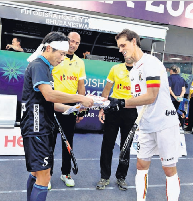
ଜାପାନ ଓ ବେଲ୍‌ଜିୟମ ମଧ୍ୟରେ ଖେଳିବା ପାଇଁ ଉପସ୍ଥିତ ଥିବା ଦୁଇ ଦଳର ଅଧିନାୟକ।