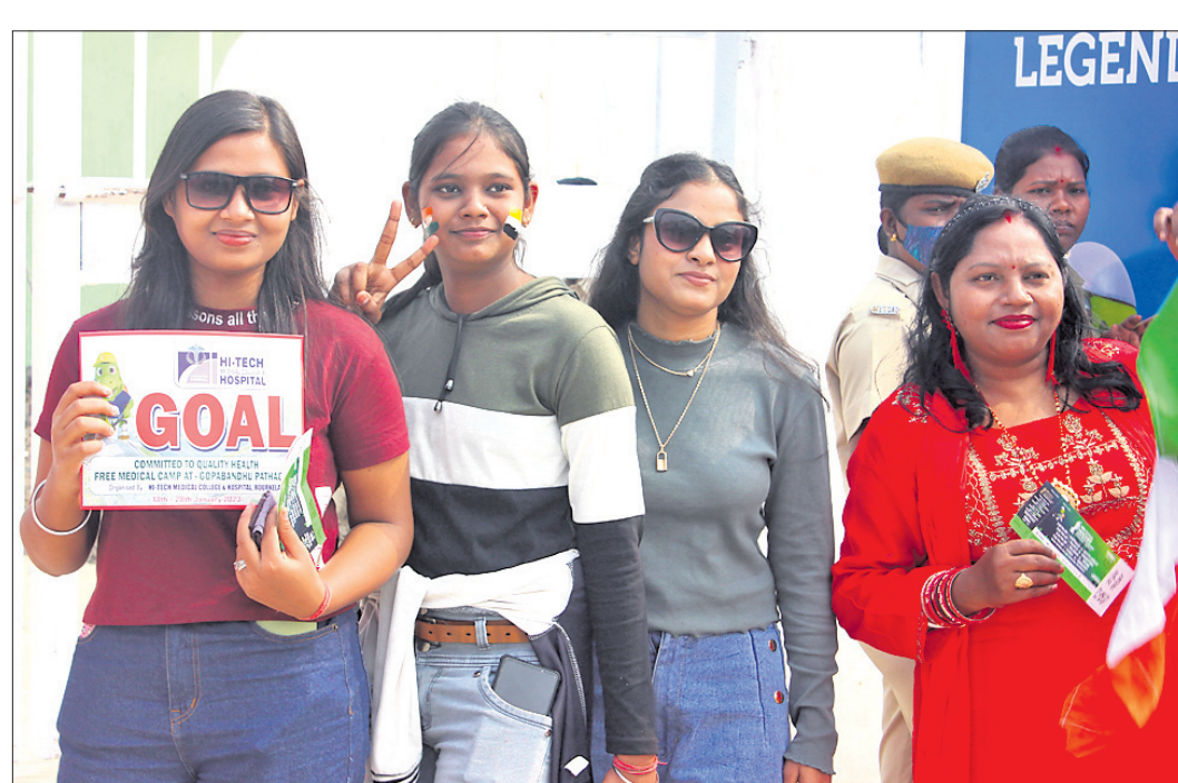
ବିର୍ସା ମୁଖ୍ୟ ସ୍ଥଳରେ ଶୁକ୍ରବାର ମ୍ୟାଚ୍ ଦେଖିବା ପାଇଁ ପ୍ରବେଶ ଅବସରରେ ମହିଳା ଦର୍ଶକ।

ଦକ୍ଷିଣ କୋରିଆ ପକ୍ଷରୁ କାଙ୍ଗ୍ ଗୋଙ୍ଗ୍ ୧୪ ଓ ୫୯ତମ ଦିନରେ ୨ଟି ଗୋଲ ପରିଶୋଧ କରିଥିଲେ। ୨୩ ତାରିଖରେ ଆର୍ଜେଣ୍ଟିନା ବିପକ୍ଷରେ କୋରିଆ ଏବଂ ଫ୍ରାନ୍ସ ବିପକ୍ଷରେ ଜର୍ମାନୀ କ୍ରମ୍ ଓଭର ମ୍ୟାଚ ଖେଳିବ।