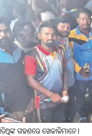
ଅତିଥିଙ୍କ ଗହଣରେ ଖେଳାଳିମାନେ।

ରୁପସା, ୨୦୧୯(ଡି.ଏନ.ଏ.)-ବାଲେଶ୍ୱର ଜିଲ୍ଲା ରୁପସା ଥାନା ଗଡ଼ପଦା ପଞ୍ଚାୟତ ଅଧୀନ ଲକ୍ଷ୍ମୀନଗୁଣ୍ଡା ବାବୁ ଭାଇଜନ ଆସୋସିଏସନ ଆନୁକୁଲ୍ୟରେ ଆୟୋଜିତ ଟୁରାନ୍ତ ବାର୍ଷିକ ପଞ୍ଚାୟତ ପ୍ରିମିୟର ଲିଗ୍ ଟି-୧୦ କ୍ରିକେଟ ଟୁର୍ଣ୍ଣାମେଣ୍ଟ ଉଦ୍ଘାଟିତ ହୋଇଯାଇଛି।