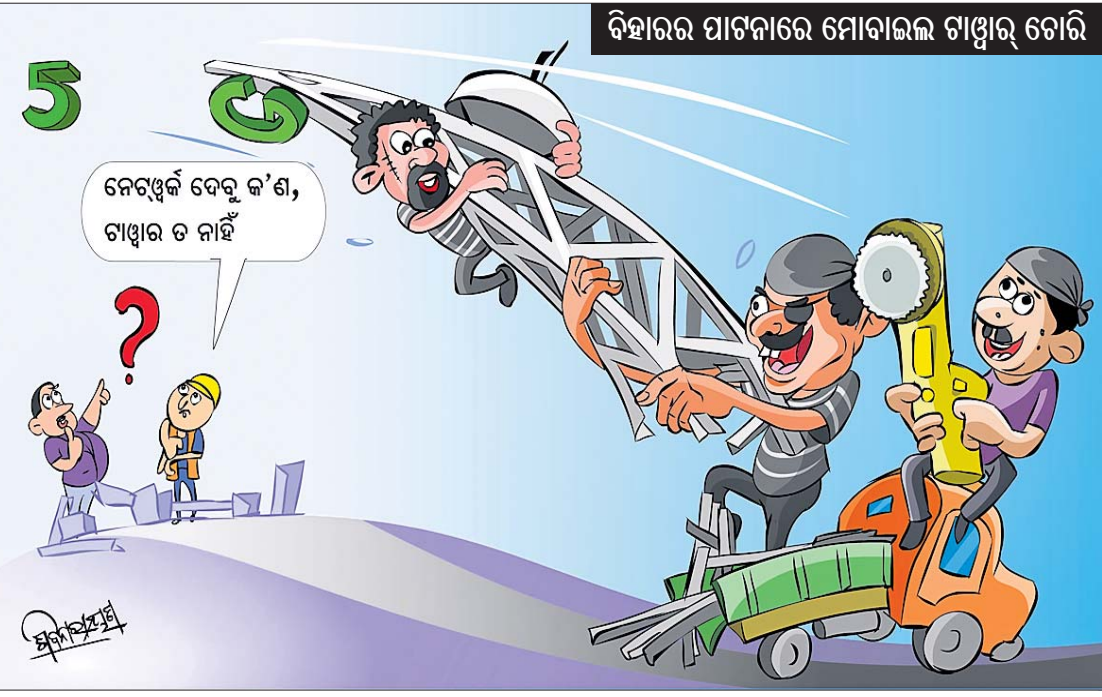
ବିହାରର ପାଟନାରେ ମୋବାଇଲ ଗାଡ଼ି ଗୋଡ଼ି