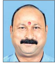
ବ୍ରଜ କିଶୋର ପ୍ରଧାନ

ତାଳଚେରର ବିଜେଡି ବିଧାୟକ ବ୍ରଜ କିଶୋର ପ୍ରଧାନ ଶୁକ୍ରବାର ପ୍ରବର୍ତ୍ତନ ନିର୍ଦ୍ଦେଶାଳୟ (ଇଡି) କାର୍ଯ୍ୟାଳୟରେ ହାଜର ହୋଇଥିଲେ।