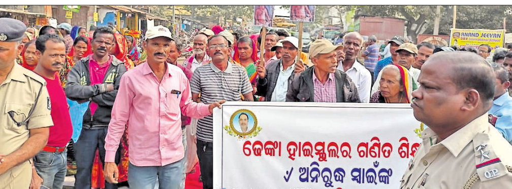
ଅନଶନରେ ସାମିଲ ପରିବାର ସଦସ୍ୟ ଓ ଅଞ୍ଚଳବାସୀ ।