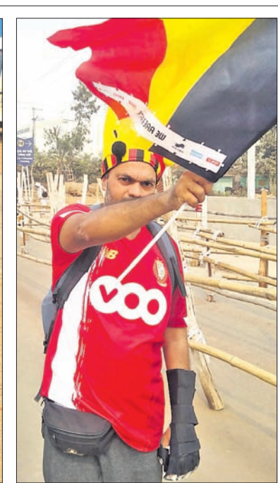
ବେଲଜିୟମ ଦଳର ନିଆରା ସମର୍ଥକ କ୍ରମ୍।