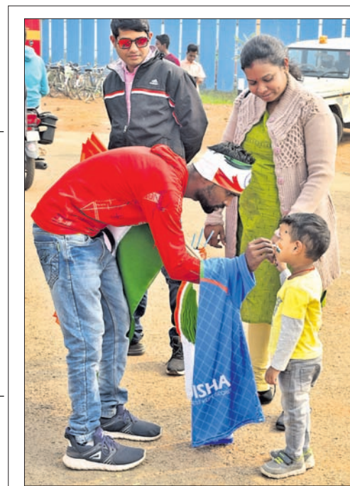
ଜଣେ ମହିଳା ତାଙ୍କ ସାନ ପୁଅକୁ ଚିତ୍ରିତ କରାଉଛନ୍ତି।