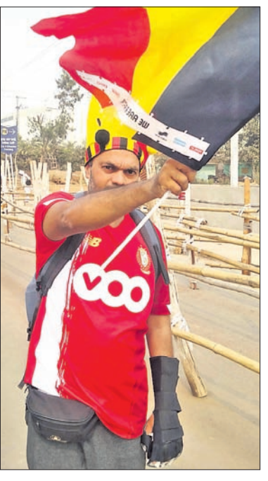
ବେଲଜିୟମ ଦଳର ନିଆରା ସମର୍ଥକ କ୍ରମ୍।