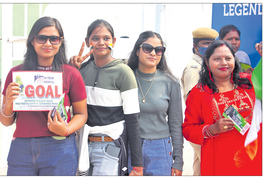
ବିର୍ସା ମୁକ୍ତା ସ୍ମୃତିକାମୀ ଶୁକ୍ରବାର ମ୍ୟାଚ ଦେଖିବା ପାଇଁ ପ୍ରବେଶ ଅବସରରେ ମହିଳା ଦର୍ଶକ।

ପଏଣ୍ଟ ପାଇଥିଲେ ହେଁ ଏହି ଗ୍ରୁପ୍ରୁ ବେଲଜିୟମ ଗୋଲ ବ୍ୟବଧାନରେ ଆଗରେ ରହି କ୍ୱାର୍ଟର ଫାଇନାଲରେ ପ୍ରବେଶ କରିଛି।