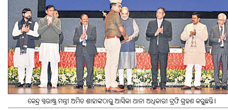
କେନ୍ଦ୍ର ସ୍ୱରାଷ୍ଟ୍ର ମନ୍ତ୍ରୀ ଅମିତ ଶାହାଙ୍କଠାରୁ ଆସିବା ଥାନା ଅଧିକାରୀ ଚୁଫି ଗ୍ରହଣ କରୁଛନ୍ତି।

ପରିବର୍ତ୍ତନ ଏବଂ ସମାପନା ମଧ୍ୟରେ କାର୍ଯ୍ୟ ସମ୍ପାଦନ ଭଳି ୧୬୫ଟି ବିଷୟ ଆଧାରରେ ଉତ୍ତମ ପ୍ରଦର୍ଶନ କରି ଆସିବା ଥାନା ସମ୍ପର୍କୀୟ ହାସଲ କରିଥିଲା। ଯାହାକି ସର୍ବ ଭାରତୀୟ ସ୍ତରରେ ଓଡ଼ିଶା ପୋଲିସ ପାଇଁ ଏହା ପ୍ରଥମ ବୋଲି ଜଣାପଡ଼ିଛି। ସୂଚନାଯୋଗ୍ୟ, କିଛିଦିନ ପୂର୍ବେ ଓଡ଼ିଶା ଅପରାଧ ନିୟନ୍ତ୍ରଣ ବୋର୍ଡ ପକ୍ଷରୁ ପ୍ରଥମ କରି ରାଜ୍ୟର ୬୪୩ ଥାନାର ବିଭିନ୍ନ କାର୍ଯ୍ୟର ସମାକ୍ଷା ଲାଗି କରାଯାଇଥିବା ପ୍ରତି ତଥ୍ୟ ବୋର୍ଡରେ ଆସିବା ଥାନା ପ୍ରଥମ ସ୍ଥାନ ହାସଲ କରିଥିଲା।