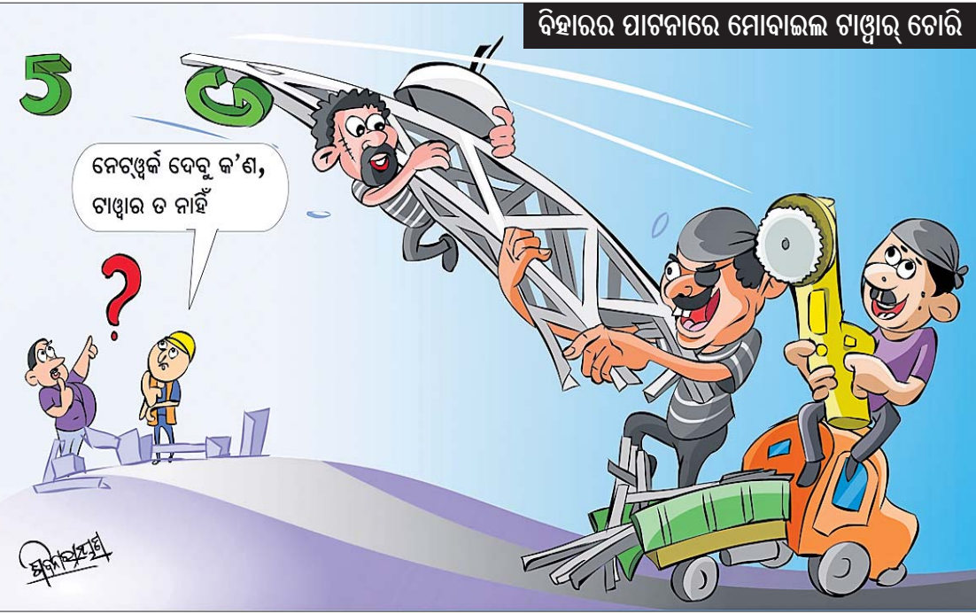
ବିହାରର ପାଟନାରେ ମୋବାଇଲ ଗାଡ଼ି ଗୋଟି