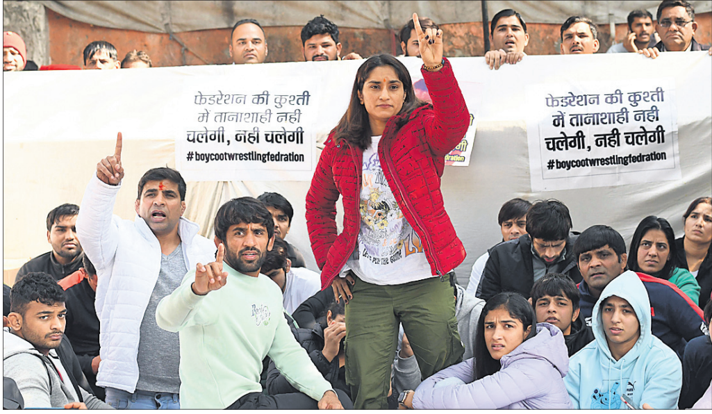
ମହିଳା କୁସ୍ତିବନ୍ଦୁକ ଯୌନ ଶୋଷଣ ଅଭିଯୋଗରେ ତତ୍ତ୍ୱାବଧିତା ମୁଖ୍ୟ ତ୍ରିକ୍ ଭୃକ୍ଷଣ ଶରଣ ସିଂଙ୍କୁ ପଦବୀରୁ ବହିଷ୍କାର ଦାବିରେ ଶୁକ୍ରବାର ନୂଆଦିଲ୍ଲୀର ମହରମଚକରେ ଧାରଣା ଦେଇଥିବା ବିଶିଷ୍ଟ ରେଭଲର ଓ ଅନ୍ୟମାନେ।