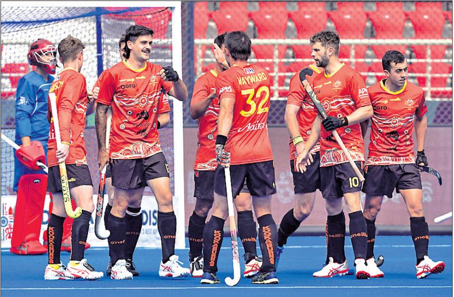
ମ୍ୟାଚ ଜିତିବା ପରେ ରଜସ୍ୱତ ଅଷ୍ଟ୍ରେଲିଆ ଖେଳାଳି

ରାଉରକେଲା ଅଫିସ/ଭୁବନେଶ୍ୱର (ଜାତୀୟ ପ୍ରତିନିଧି), ୨୦୧୧