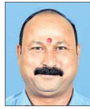
ବ୍ରଜ କିଶୋର ପ୍ରଧାନ

ତାଳଚେରର ବିଜେଡି ବିଧାୟକ ବ୍ରଜ କିଶୋର ପ୍ରଧାନ ଶୁକ୍ରବାର ପ୍ରବର୍ତନ ନିର୍ଦ୍ଦେଶାଳୟ (ଇଡି) କାର୍ଯ୍ୟାଳୟରେ ହାଜର ହୋଇଥିଲେ।