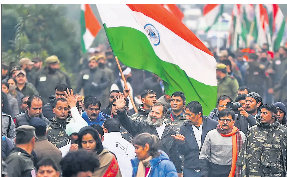
ଜମ୍ମୁ-କଶ୍ମୀରର କଠୁଆ ଜିଲ୍ଲାରେ ଶୁକ୍ରବାର ଭାରତ ଯୋଡ଼ୋ ଯାତ୍ରା ପ୍ରବେଶ ଅବସରରେ କଂଗ୍ରେସ ନେତା ରାହୁଲ ଗାନ୍ଧୀ, ଶିବସେନା (ୟୁ.ଡି.ଏ) ନେତା ସଞ୍ଜୟ ରାଉତ ଓ ଅନ୍ୟମାନେ।

ଆରମ୍ଭ ହୋଇଥିଲା ବେଳେ ଏଥିରେ ଶିବସେନା (ୟୁ.ଡି.ଏ)ର ସଞ୍ଜୟ ରାଉତଙ୍କ ସମେତ ଅନେକ ନେତା ସାମିଲ ହୋଇଛନ୍ତି। ଦଳ ତରଫରୁ ସେ ଯାତ୍ରାରେ ଯୋଗଦେଇଥିବା କହିଛନ୍ତି। ଦେଶର ରାଜନୈତିକ ବାତାବରଣ ଦୁର୍ଦ୍ଦିନରେ ବଦଳୁଛି। ବାସ୍ତବ ପ୍ରସଙ୍ଗ ଉପରେ କଂଗ୍ରେସ ନେତା ରାହୁଲ ହିସର ଉଠାଇଥିବା ସେ ସ୍ପଷ୍ଟ କରିଛନ୍ତି। କଶ୍ମୀରରେ ପ୍ରବେଶ କରୁଥିବା କଶ୍ମୀରୀ ଲୋକଙ୍କୁ ସୁଖରେ କରୁଥିବା ଦେଖିବା ପାଇଁ ଆରମ୍ଭ ହୋଇଥିଲା। ଗତବର୍ଷ