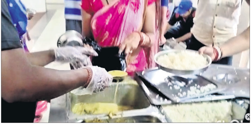
ତାଲୁକାସ୍ତରରେ ବନ୍ଧନ ହେଉଥିବା ଖାଦ୍ୟ ।

ନୟାଗଡ଼ ଜିଲ୍ଲା ମୁଖ୍ୟ ଚିକିତ୍ସାଳୟରେ ରୋଗୀଙ୍କୁ ଦିଆଯାଉଥିବା ଖାଦ୍ୟର ଖାଦ୍ୟ ନ ଥିବାରୁ ଅଭିଯୋଗ ହେଉଛି । ରୋଗୀ ନିମ୍ନମାନର ଖାଦ୍ୟ ଖାଉଥିଲେହେଁ ଏହାର ପରୀକ୍ଷା କରାଯାଇନାହିଁ । ପୃଷ୍ଠକର ଖାଦ୍ୟ ନାଁରେ ରୋଗୀ ରୋଗ କିଣୁଛନ୍ତି । ଶୁକ୍ରବାର ତାଲିକା ସ୍ଥାନରେ ତାଲି ଦିଆଯାଇଥିଲା, ତାହା ପାଣିଟିଆ ଓ ଅତୁଟିକର ଥିଲା । ଅନ୍ୟପକ୍ଷେ ଖାଦ୍ୟ ସାରଣୀରେ ଦହି ଦେବାକୁ ଥିଲେ ହେଁ ଦିଆଯାଇ ନ ଥିଲା । ପ୍ରତିବାଦ କଲେ ଉତ୍ତର ମିଳୁଥିଲା କାମ ଚଳାଇ ନିଅନ୍ତୁ । ଯାହାସବୁ ଖାଦ୍ୟ ସାରଣୀରେ ଅଛି ତାହା ଦେବା ସମ୍ଭବ ନୁହେଁ । ରୋଗୀମାନଙ୍କୁ ଦିଆଯାଉଥିବା ଖାଦ୍ୟ ଠିକ୍ ଅଛି ନାହିଁ ପରୀକ୍ଷା କରାଯାଇ ନାହିଁ । ସେହିପରି ଖାଦ୍ୟ ସାରଣୀ ଅନୁସାରେ ଖାଦ୍ୟ ଦିଆଯାଉଛି କି ନାହିଁ ତାହା ପରୀକ୍ଷା କରାଯାଇନାହିଁ । ଉପରେ ଉଲ୍ଲେଖ କରାଯାଇଛି । ଏହାକୁ ନିର୍ଦ୍ଦେଶ ଦେବାକୁ ପଡ଼ିବ । ଏହାକୁ ନିର୍ଦ୍ଦେଶ ଦେବାକୁ ପଡ଼ିବ । ଏହାକୁ ନିର୍ଦ୍ଦେଶ ଦେବାକୁ ପଡ଼ିବ ।