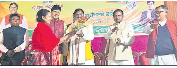
ଭାଜପା କର୍ମୀ କେନ୍ଦ୍ରମନ୍ତ୍ରୀ ଅର୍ଜୁନ ମୁଖାର୍ଜୀଙ୍କୁ ପୁଷ୍କରୀରେ ଦେଇ ସ୍ନାନ କରୁଛନ୍ତି।

ପାଟଣା, ୨୦୧୧ (ବ୍ୟୁ.ପ୍ର.): କେନ୍ଦ୍ରରେ ଜିଲ୍ଲା ସାହାରପତ୍ରା ରୁଲ୍ ମଲାରପଦା ପଞ୍ଚାୟତର ଖୁସୀପିଲୁଠାରେ ଭାଜପାର ରୁପସ୍ତ୍ରାୟ କର୍ମକର୍ମୀ ସମିଳନୀ ଅନୁଷ୍ଠିତ ହୋଇଯାଇଛି। ଏଥିରେ ୬ ରୁପାର ଏକ ହଜାରରୁ ଊର୍ଦ୍ଧ୍ୱ ଭାଜପା କର୍ମୀ ଉପସ୍ଥିତ ଥିଲେ। ମୁଖ୍ୟ ଅତିଥି ଭାବେ କେନ୍ଦ୍ର ଆଦିବାସୀ କଲ୍ୟାଣ ମନ୍ତ୍ରୀ ଅର୍ଜୁନ ମୁଖା ଯୋଗଦେଇ ୨୦୨୪ରେ ପ୍ରଧାନମନ୍ତ୍ରୀ ନରେନ୍ଦ୍ର ମୋଦିଙ୍କୁ ପୁଣି ଥରେ କ୍ଷମାପାଦନ କରିବାକୁ ଗୁରୁମନ୍ତ୍ର ଦେଇଥିଲେ। ଏଥିସହ ଉଭୟ ପାର୍ଟି ନିର୍ବାଚନ ମଣ୍ଡଳୀ ଓ କେନ୍ଦ୍ରରେ ଏମ୍ପି ସିଟ୍ରେ ଭାଜପା ପ୍ରାର୍ଥୀଙ୍କୁ ଜିତାଇବାକୁ କର୍ମୀମାନଙ୍କୁ ଆହ୍ୱାନ କରିଥିଲେ। ସମ୍ମାନିତ ଅତିଥି ଭାବେ ସରକାର ବିଧାୟକ ତଥା