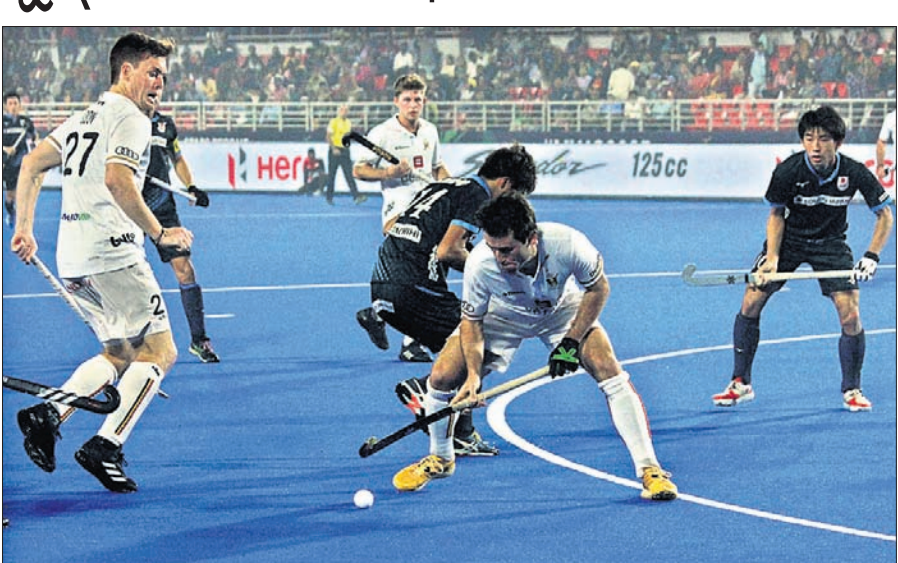
ଜାପାନ ବିପକ୍ଷ ମ୍ୟାଚ ଅବସରରେ ବେଲଜିୟମ ପକ୍ଷରୁ ୫ ଗୋଲ ଦେଇଥିବା ଚମ୍ପ ବୁନ୍ (ବାମ)।

ରାଉରକେଲା ଅଫିସ/ଭୁବନେଶ୍ୱର (କ୍ରୀଡ଼ା ପ୍ରତିନିଧି), ୨୦୧୧ ଗତଥର ଚାମ୍ପିୟନ ବେଲଜିୟମ ଏଥର ମଧ୍ୟ ପ୍ରଭାବୀ ପ୍ରଦର୍ଶନ ଜାରି ରଖି ହକି ବିଶ୍ୱକପର କ୍ୱାର୍ଟର ଫାଇନାଲରେ ପ୍ରବେଶ କରିଛି। ଶୁକ୍ରବାର ବିର୍ସା ମୁଖ୍ୟ ସ୍ଥଳରେ ଅନୁଷ୍ଠିତ ପୁଲ୍ 'ବି'ର ଏକ ମ୍ୟାଚରେ ଏହି ଦଳ ୭-୧ ଗୋଲରେ ଏସାୟ ଦଳ ଜାପାନକୁ ପରାସ୍ତ କରିଛି। ତାରକା ଖେଳାଳି ଚମ୍ପ ବୁନ୍ ୨୧, ୨୬, ୨୭, ୫୦ ଓ ୫୫ତମ ମିନିଟରେ ଏକାକୀ ଶତ ଗୋଲ ଦେଇ ବେଲଜିୟମକୁ ବୁହର୍ ବିଜୟ ଦେବାରେ ମୁଖ୍ୟ ଭୂମିକା ଭୂମିକା ଗ୍ରହଣ କରିଥିଲେ। ସେ ୪ଟି ଫିଲ୍ଡ ଗୋଲ ଦେଇଥିବାବେଳେ ୫୫ତମ ମିନିଟରେ ଜାପାନ ଖେଳାଳିଙ୍କ ବିପଜ୍ଜନକ ପ୍ରଦର୍ଶନ ଯୋଗୁ ବେଲଜିୟମକୁ ୧-୦ ଗୋଲରେ ହରାଇଥିଲେ।