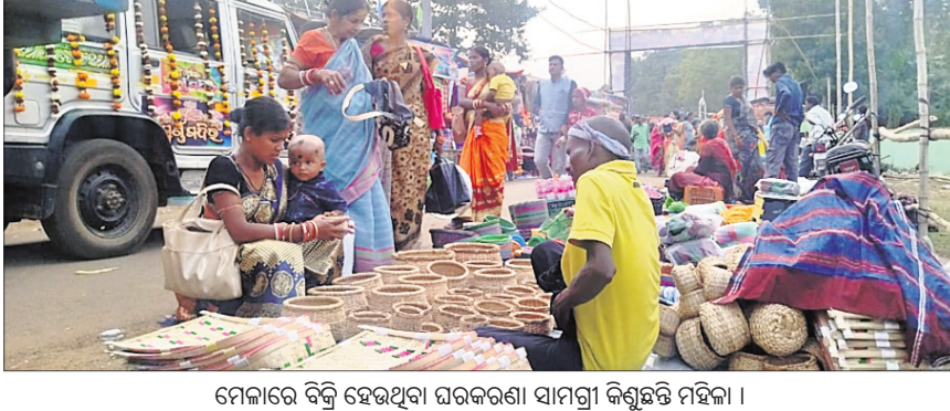
ମେଳାରେ ବିକ୍ରି ହେଉଥିବା ଘରକରଣା ସାମଗ୍ରୀ ବିକ୍ରି ହେଉଛି ।

ବିଜ୍ଞାନପୁର, ୨୦୧୧ (ଡି.ଏନ.ଏ.): ପ୍ରସିଦ୍ଧ ବରୁଣେଶ୍ୱର ମେଳା ଶୁକ୍ରବାର ସପ୍ତମ ଦିନରେ ପହଞ୍ଚିଛି । ମେଳା ଦିନ ସରି ଆସୁଥିବା ବେଳେ ଦର୍ଶକଙ୍କ ସଂଖ୍ୟା ବେଳକୁ ବେଳ ବଢ଼ିବାରେ ଲାଗିଛି । ଉଦ୍ଦେଶ୍ୟରେ ପ୍ରାୟ ୬୦ ହଜାର ଦର୍ଶକ ମେଳା ପଡ଼ିଆରେ ସମାଗମ ହୋଇଥିଲେ । ମେଳାରେ ଏବେ ଅପେରା ଦଳ ନାଚକ ପରିବେଷଣ କରୁଥିବାରୁ ପଡ଼ିଆରେ ଯାତ୍ରାପ୍ରେମୀ ଦର୍ଶକ ସଂଖ୍ୟାରେ ଭିଡ଼ ଜମାଉଥିବା ଦେଖିବାକୁ ମିଳିଛି । ମେଳା ପଡ଼ିଆରେ ଓଲଟ ଓ କଳିଏତ ନାଚକର କଳାକାର ଆସୁଥିବାରୁ ଯାତ୍ରାପ୍ରେମୀଙ୍କ ମଧ୍ୟରେ ଉତ୍ସାହ ବୃଦ୍ଧି ପାଇଛି । ଅନ୍ୟପକ୍ଷରେ ଉକ୍ତ ଦିନ ଲୋକଙ୍କ ସମାଗମ ବ୍ୟବସାୟୀଙ୍କୁ ବେଶ ଉତ୍ସାହ ଦେଇଥିଲା । ଗୃହିଣୀମାନେ ଘର କରଣା ସାମଗ୍ରୀ କିଣାକିଣିରେ ବ୍ୟସ୍ତ ଥିବା ଦେଖିବାକୁ ମିଳିଥିଲା । ହାତ