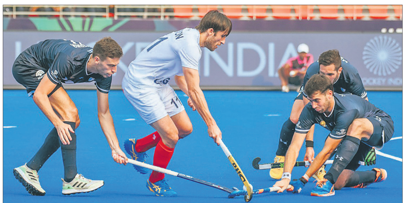
ଆର୍ଜେଣ୍ଟିନା-ଫ୍ରାନ୍ସ ମ୍ୟାଚର ଏକ ସଂଘର୍ଷପୂର୍ଣ୍ଣ ମୁହୂର୍ତ୍ତ।