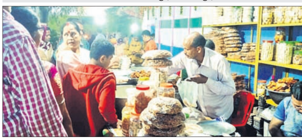
ଓଳାଶୁଣୀ ମେଳାରେ ବିକ୍ରି ହେଉଥିବା ଯୋଡ଼ିପିଠା ।