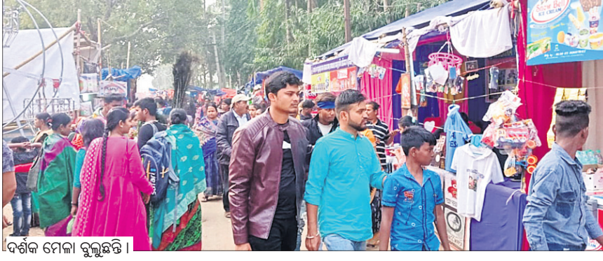
ଦର୍ଶକ ମେଳା ବୁଲୁଛନ୍ତି ।

ବିଜ୍ଞାନପୁର, ୨୦୧୧ (ଡି.ଏନ.ଏ.): ପ୍ରସିଦ୍ଧ ବରୁଣେଶ୍ୱର ମେଳା ଶୁକ୍ରବାର ସପ୍ତମ ଦିନରେ ପହଞ୍ଚିଛି । ମେଳା ଦିନ ସରି ଆସୁଥିବା ବେଳେ ଦର୍ଶକଙ୍କ ସଂଖ୍ୟା ବେଳକୁ ବେଳ ବଢ଼ିବାରେ ଲାଗିଛି । ଉଦ୍ଦେଶ୍ୟରେ ପ୍ରାୟ ୬୦ ହଜାର ଦର୍ଶକ ମେଳା ପଡ଼ିଆରେ ସମାଗମ ହୋଇଥିଲେ । ମେଳାରେ ଏବେ ଅପେରା ଦଳ ନାଚକ ପରିବେଷଣ କରୁଥିବାରୁ ପଡ଼ିଆରେ ଯାତ୍ରାପ୍ରେମୀ ଦର୍ଶକ ସଂଖ୍ୟାରେ ଭିଡ଼ ଜମାଉଥିବା ଦେଖିବାକୁ ମିଳିଛି । ମେଳା ପଡ଼ିଆରେ ଓଲଟ ଓ କଳିଏତ ନାଚକର କଳାକାର ଆସୁଥିବାରୁ ଯାତ୍ରାପ୍ରେମୀଙ୍କ ମଧ୍ୟରେ ଉତ୍ସାହ ବୃଦ୍ଧି ପାଇଛି । ଅନ୍ୟପକ୍ଷରେ ଉକ୍ତ ଦିନ ଲୋକଙ୍କ ସମାଗମ ବ୍ୟବସାୟୀଙ୍କୁ ବେଶ ଉତ୍ସାହ ଦେଇଥିଲା । ଗୃହିଣୀମାନେ ଘର କରଣା ସାମଗ୍ରୀ କିଣାକିଣିରେ ବ୍ୟସ୍ତ ଥିବା ଦେଖିବାକୁ ମିଳିଥିଲା । ହାତ