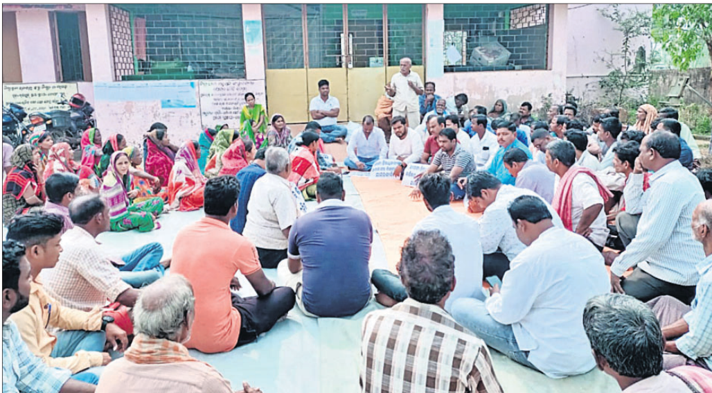
ତାଲାକୁ ବାଦ୍ ପଡ଼ିଥିବା ଲୋକମାନେ ଧାରଣାରେ ବସିଛନ୍ତି ।

ନୟାଗଡ଼ ଜିଲ୍ଲା ରଣପୁର ବ୍ଲକ୍ ଗୋପାଳପୁର ପଞ୍ଚାୟତରେ ଶୁକ୍ରବାର ପକାଇ ଧାରଣା ଦେଇଥିଲେ । ଏହାକୁ ପ୍ରଧାନମନ୍ତ୍ରୀ ଆବାସ ଯୋଜନାରେ ଯୋଗ୍ୟ ହିତାଧିକାରୀଙ୍କ ନାମ ନ