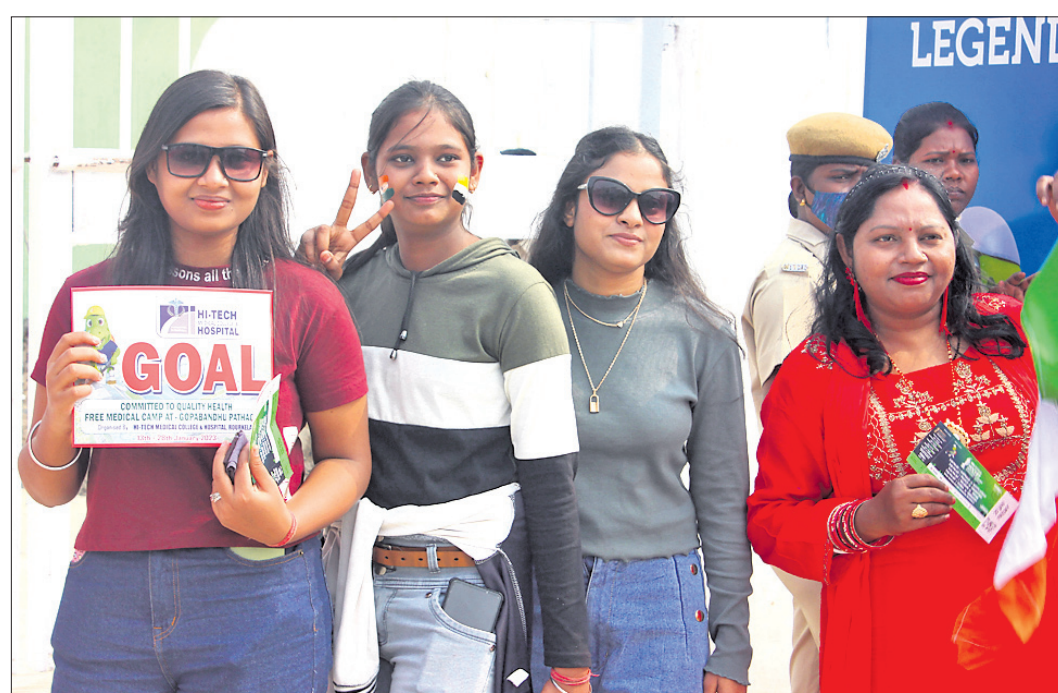
ବିର୍ସା ମୁଖ୍ୟ ସ୍ଥଳରେ ଶୁକ୍ରବାର ମ୍ୟାଚ୍ ଦେଖିବା ପାଇଁ ପ୍ରବେଶ ଅବସରରେ ମହିଳା ଦର୍ଶକ।

ଦକ୍ଷିଣ କୋରିଆ ପକ୍ଷରୁ କାଙ୍ଗ୍ ଗୋଙ୍ଗ୍ ୧୪ ଓ ୫୯ତମ ମିନିଟରେ ୨ଟି ଗୋଲ ପରିଶୋଧ କରିଥିଲେ। ୨୩ ତାରିଖରେ ଆର୍ଜେଣ୍ଟିନା ବିପକ୍ଷରେ କୋରିଆ ଏବଂ ଫ୍ରାନ୍ସ ବିପକ୍ଷରେ ଜର୍ମାନୀ କ୍ରମ୍ ଓଭର ମ୍ୟାଚ ଖେଳିବ।