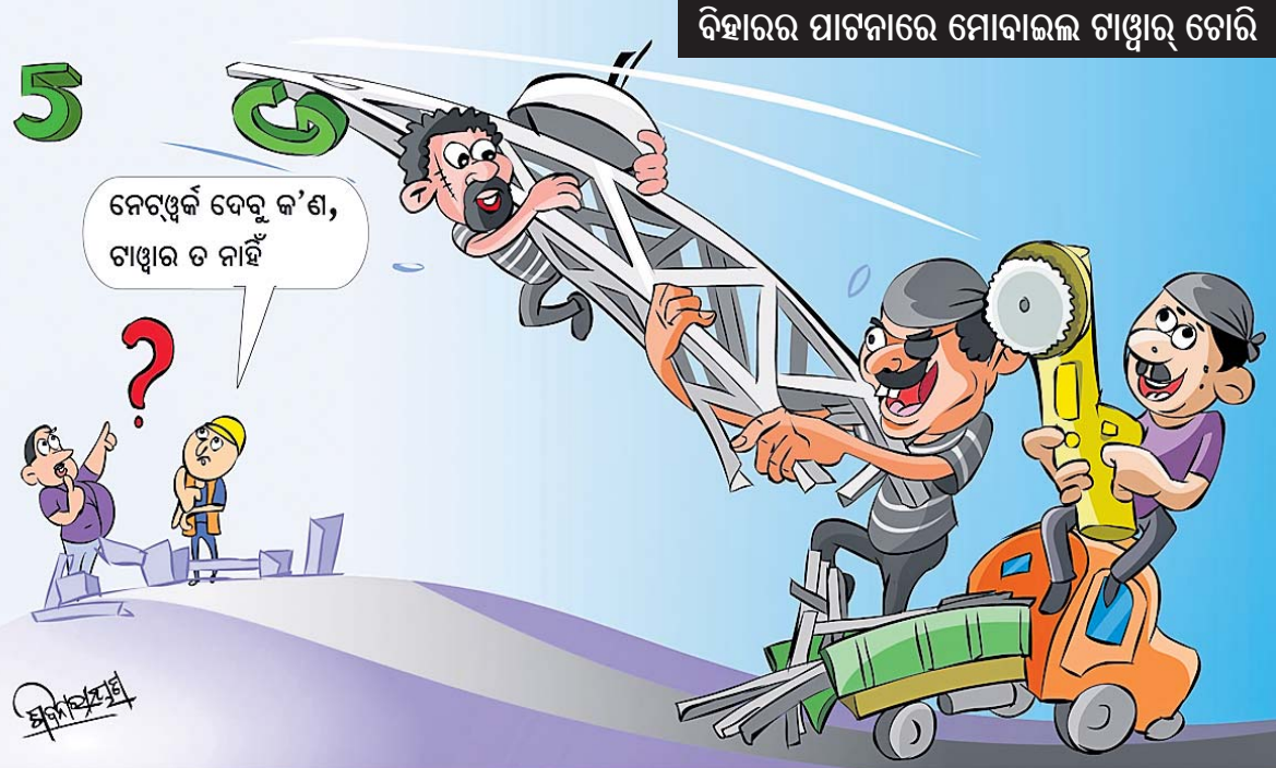
ବିହାରର ପାଟନାରେ ମୋବାଇଲ ଟାଣୁର ଚୋରି