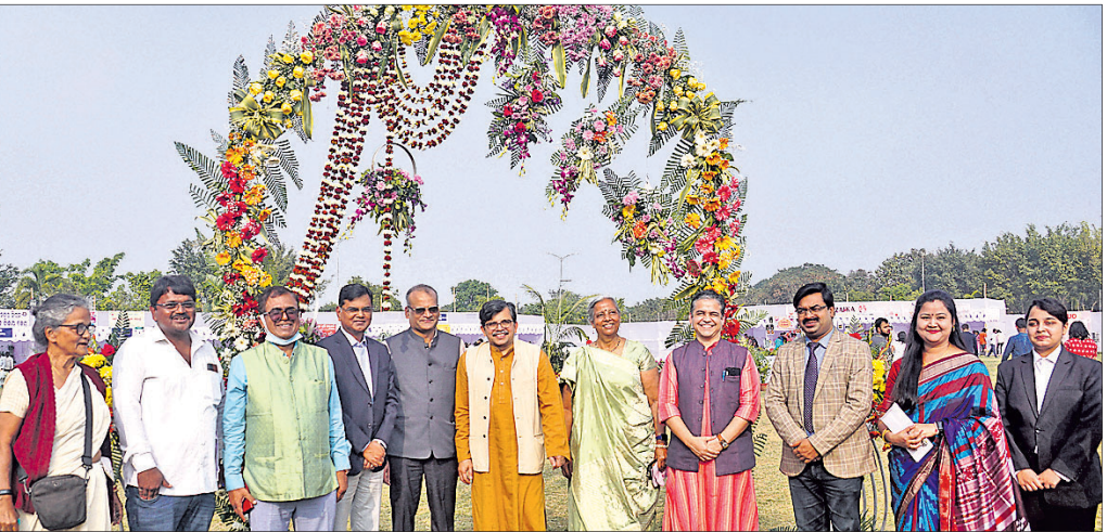
କଟକ ଅଧିକ, ୨୧।୧