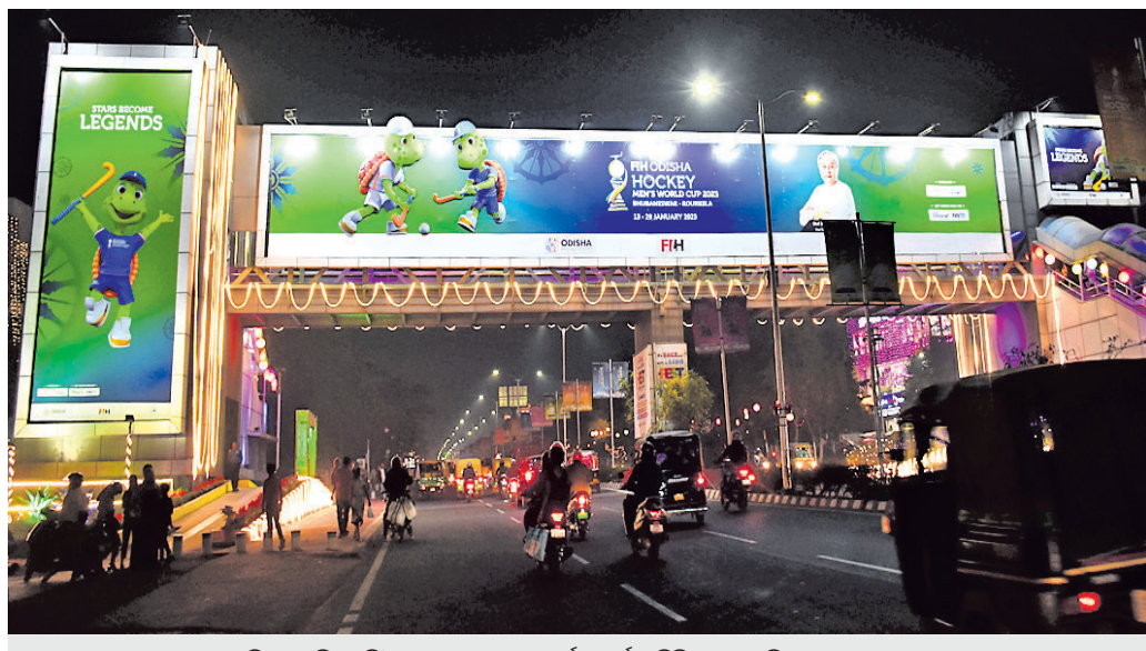
ଭୁବନେଶ୍ୱର ମହାନଗର ନିଗମ (ବିଏମ୍‌ସି) ଏବଂ ଅଜନ୍ତା ଆଡ଼ଭର୍ଟାଇଜର୍ମିନିଟି ସହଭାଗିତାରେ ଭୁବନେଶ୍ୱର ଉତ୍ତର ପ୍ରଦେଶ ପଥ କୁହାଯାଇଥିବା କରମଦେବ ବିହାର ନିକଟସ୍ଥ ପାଲ ହାଇଡ଼ ପୁର୍ ଓଭର ବ୍ରିକ୍ ଆକର୍ଷଣୀୟ ସାଧନା ସହ ଉତ୍ତର ପ୍ରଦେଶ ଯୌବନୀକରଣ ବେଶ୍ ଆକର୍ଷଣୀୟ ଏବଂ ମନୋହର ହୋଇଛି। ଏପରିକି ହିଁ ମହାକୁସ୍ ଅବସରରେ ଉଚ୍ଚ ପଥ ବର୍ତ୍ତମାନ ଏକ ସ୍ୱତନ୍ତ୍ର ସେକ୍ଟର୍ କୋର୍ଡ ପାଲଟିଯାଇଛି।