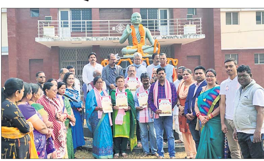
ଭୁବନେଶ୍ୱର, ୨୧୧୧ (ବୁଧବେଳା)