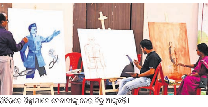
ଶିବିରରେ ଶିଳ୍ପୀମାନେ ନେତାଜୀଙ୍କୁ ନେଇ ଚିତ୍ର ଆଙ୍କୁଛନ୍ତି।