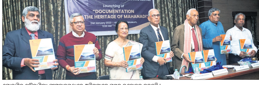
ଯୋଗାଢ଼ିତ ନୌବାଣିଜ୍ୟ ସଂଗ୍ରହାଳୟଠାରେ ଅତିଥିମାନେ ପୁସ୍ତକ ଉନ୍ମୋଚନ କରୁଛନ୍ତି।