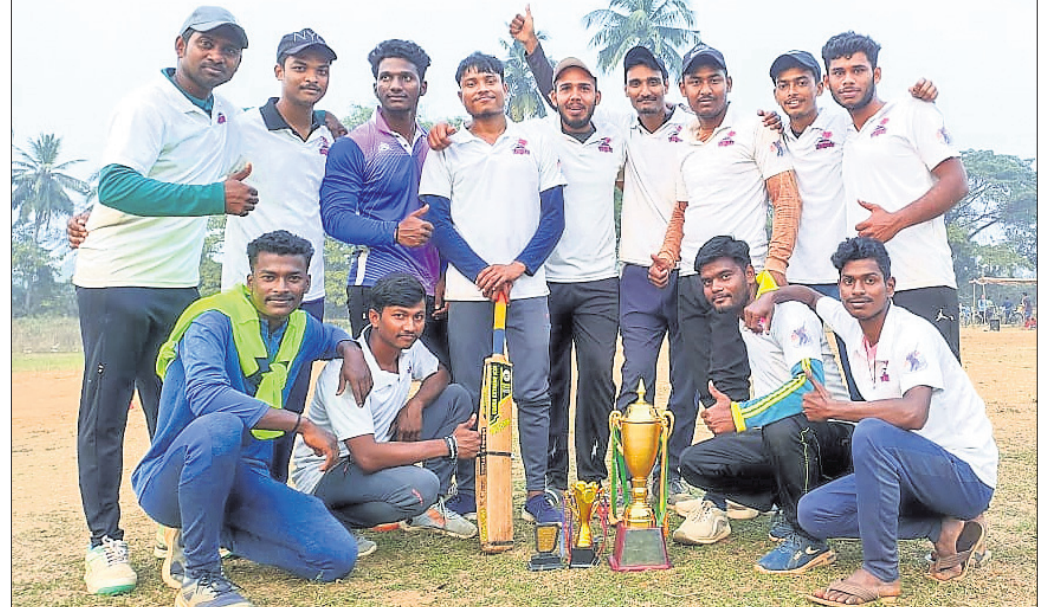
ଟ୍ରଫି ସହ ସେଭେନ୍ ସମୁଦାୟ ଦଳ।

ଦେବା ଆବଶ୍ୟକ ବୋଲି ଡକ୍ୟୁମେଣ୍ଟାସନ୍ ପକ୍ଷରୁ କୁହାଯାଇଛି। ସେହିପରି ଦେଶର ଅନ୍ୟ କୌଣସି ରାଜ୍ୟର ରେସ୍‌ଲର ଏହି ଆନ୍ଦୋଳନରେ ସାମିଲ ନ ଥିବା ବେଳେ କେବଳ ହରିୟାଣାର ରେସ୍‌ଲର କାହିଁକି ସାମିଲ ବୋଲି ମଧ୍ୟ ଡକ୍ୟୁମେଣ୍ଟାସନ୍ ପ୍ରଶ୍ନ ଉଠାଇଛି। ୨୦୨୨ରେ ଅନୁଷ୍ଠିତ ୨୩ଟି ଯାକ ରେସ୍‌ଲିଂ ଚାମ୍ପିୟନଶିପ୍‌ର ଫଳାଫଳ ସହିତ ଡକ୍ୟୁମେଣ୍ଟାସନ୍ ପ୍ରଶ୍ନ ଆନ୍ଦୋଳନରେ ସାମିଲ ନ ଥିବା ବେଳେ ନିର୍ବାଚନ ରହିଥିବା ବେଳେ ସାହିତ୍ୟିକ ସାହିତ୍ୟିକ ଆନ୍ଦୋଳନ କରାଯାଇଛି।