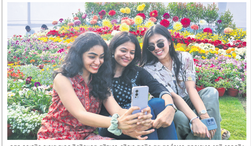
କଟକ ନରାଜସ୍ଥିତ ଜାତୀୟ ଆଇନ ବିଶ୍ୱବିଦ୍ୟାଳୟ ପଡ଼ିଆରେ ଶିବିରର ଅନୁଷ୍ଠିତ ପୁଷ୍ପ ପ୍ରଦର୍ଶନୀରେ ଯୁବତୀମାନେ ସେଣ୍ଡି ନେଉଛନ୍ତି।

ଚୌମ୍ବାର, ୨୧୧୧(ଡି.ଏନ.ଏ.): ୫୫ନଂ ଜାତୀୟ ରାଜପଥର ଧୁମାବତୀ ଛକ ନିକଟ ଏକ ଫ୍ରେଜରେ ଶିବିରର ସକାଳ ପ୍ରାୟ ୮ଟାରେ ପଥର ବୋହେଇ ଟ୍ରକ ଗଳିପଡ଼ିଛି। ଟ୍ରକ୍ ପଛ ବକ ଫ୍ରେଜ ଭିତରେ ଫସି ରହିଥିଲା। ଚୌମ୍ବାର ପୋଲିସ୍ ପହଞ୍ଚି ପଥରକୁ ଅନ୍ୟ ଏକ ଟ୍ରକ୍‌କୁ ଅନୁଲୋଚ୍ କରିଥିଲା। ଖବରପାଇ ଫ୍ରେଜ ନିର୍ମାଣକାରୀ ଠିକା ସଂସ୍ଥା କର୍ମଚାରୀ ପହଞ୍ଚି ଟ୍ରକ୍ ଏକ ନୂତନ ସ୍ୱାୟତ୍ତ ସେଠାରେ ପକାଇ ନିଜ ଦୁର୍ଭିକ୍ତା ଲୁଚାଇ ଦେଇଥିବା ସାଧାରଣରେ ଅଭିଯୋଗ ହୋଇଛି। ସୂଚନାଯୋଗ୍ୟ, ମଞ୍ଜୁଳି ଛକଠାରୁ କଟକକଣ୍ଠା ପର୍ଯ୍ୟନ୍ତ ଜାତୀୟ ରାଜପଥ ସମ୍ପ୍ରସାରଣ କାର୍ଯ୍ୟ ଚଳି ରହିଛି। ରାସ୍ତାର ଉଭୟ ପାର୍ଶ୍ୱରେ ଫ୍ରେଜ ନିର୍ମାଣ କାର୍ଯ୍ୟ ମଧ୍ୟ ଠିକା ସଂସ୍ଥା କରୁଛି। ହେଲେ ଖୁବ୍‌କମ୍ ଦିନ ତଳେ ନିର୍ମାଣ କରାଯାଇଥିବା ଏହି ଫ୍ରେଜ ଉପରେ ଭାରିଯାମ ଯିବା ଫଳରେ ଭୁସ୍ଥିତି ପଡ଼ିଛି। ଫଳରେ ଏହାର ସ୍ଥାୟିତ୍ୱକୁ ନେଇ ପ୍ରଶ୍ନବାଚୀ ସୃଷ୍ଟି ହୋଇଛି।