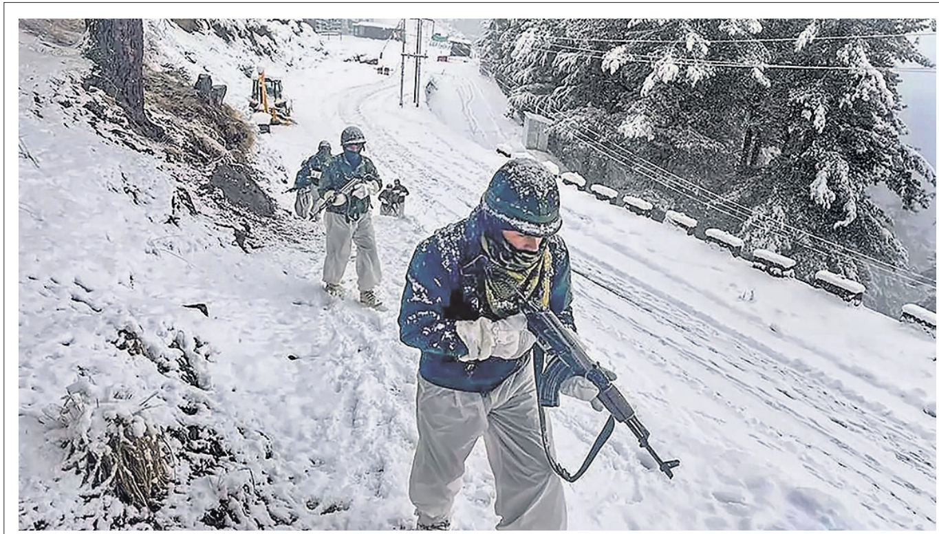
ସାଧାରଣତନ୍ତ୍ର ଦିବସ ପୂର୍ବରୁ ଜଣ୍ଡକାନ୍ଧାର କିସ୍ତିଫାଲା ଜିଲାର ବରଫାବୃତ୍ତ ରାସ୍ତା ଅଞ୍ଚଳରେ ସଦାନମାନେ ଶନିବାର ପାଟ୍ରୋଲିଂ କରୁଛନ୍ତି।

କେସି ପ୍ରାର୍ଥୀ ହୋଇ ନ ଥିବାରୁ ଲେବର ପାର୍ଟି ସଦସ୍ୟମାନେ ହିପ୍‌କିନ୍ସଙ୍କୁ ସମର୍ଥନ ଦେବା ସୂଚନା ମିଳୁଛି। ଦେଶରେ ସାଧାରଣ ନିର୍ବାଚନ ପୂର୍ବରୁ ହିପ୍‌କିନ୍ସ ପ୍ରଧାନମନ୍ତ୍ରୀ ପଦରେ ୮ ମାସରୁ କମ୍ ସମୟ ରହିବେ। ଲେବର ପାର୍ଟି ପୁଷ୍ପ ବିରୋଧୀ ଦଳ ନ୍ୟାଶନାଲ ପାର୍ଟିକୁ ପରାସ୍ତ କରିବ ବୋଲି ଜନମତ ସର୍ବେକ୍ଷଣ ସୂଚନା ମିଳିଛି।