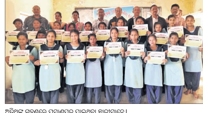
ଅତିଥି ଗହଣରେ ପ୍ରମାଣପତ୍ର ପାଇଥିବା ଛାତ୍ରୀମାନେ।