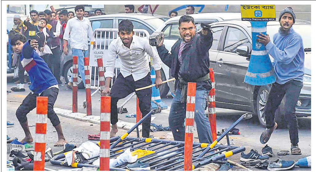
କୋଲକାତାର ଏସ୍‌ସ୍‌ଏସ୍‌ଏଫ୍‌ରେ ପୋଲିସ୍ ଉପରକୁ ଆଇସ୍‌ସ୍‌ଏସ୍‌ଏଫ୍ କର୍ମୀ ଚେକା ପିକ୍‌ଉପ୍ କରିଛନ୍ତି।

ଚାଇନା ଜନସଂଖ୍ୟାର ୮୦% କୋଭିଡ୍ ସଂକ୍ରମିତ ବେଳ, ୨୧।୧ (ପି.ଟି.)