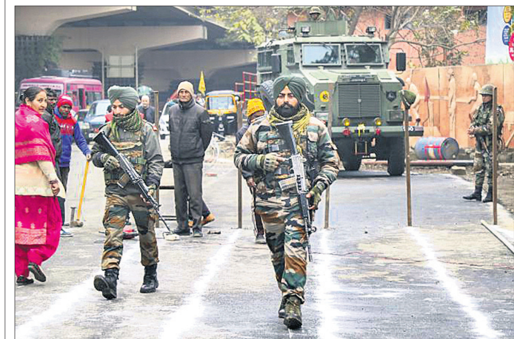
୨୪ତମ ସାଧାରଣତନ୍ତ୍ର ଦିବସରେ ଆତଙ୍କବାଦୀ ଆକ୍ରମଣ ଆଶଙ୍କା ଥିବାରୁ ଜଣ୍ଡର ଏମ୍ବୁସ୍ ମୁକାବିଲରେ ପରେ ପୂର୍ବରୁ ମୁକାବିଲ ହୋଇଥିବା ଯତନ।