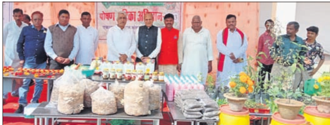
କର୍ମକର୍ତ୍ତା , ସୁନ୍ଦରଗଡ଼, ରାଉରକେଲା, ଆମ୍ବୁଗୁଡ଼ା

ଗ୍ରାମୋତ୍ତାନ ଯୋଜନା ଦେଖିବାରେ କୃଷକଙ୍କ ଉତ୍ତାନ ପାଇଁ କାର୍ଯ୍ୟ କରୁଛି ।