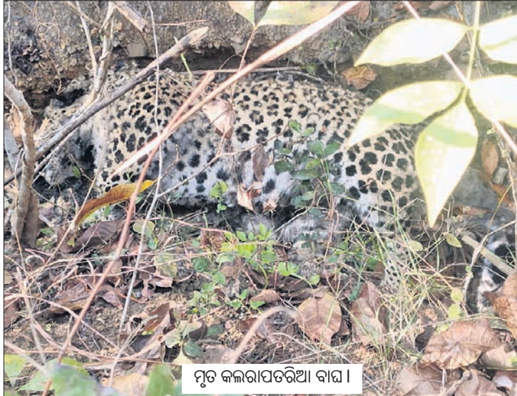
ମୃତ କଲରାପତରିଆ ବାଘ।

ଜେବ ବିଧିପତାରେ ଭରପୁର ଢେଙ୍କାନାଳ ଜିଲ୍ଲା କେବେଠାରୁ ଲୋପ ପାଇଯାଇଛନ୍ତି ମହାବଳ ବାଘ। ସଂରକ୍ଷିତ ଜଙ୍ଗଲରେ କଲରାପତରିଆ ବଂଶବୃଦ୍ଧି ଏହି ଅଭାବବୋଧକୁ ସାମାନ୍ୟ ପୂରଣ କରିବ ବୋଲି ଆଶା କରାଯାଉଥିଲା। ହେଲେ ଏବେ ଏହି ପ୍ରକାରି ମଧ୍ୟ ପୁରୁଣିତ ହୁଅନ୍ତି, ତାହା ଧୀରେ ଧୀରେ ସ୍ୱଳ୍ପ ହେବାରେ ଲାଗିଛି। ହିନ୍ଦୋଳ ରେଞ୍ଜ ଖଜୁରିଆକଟା ସେକ୍ଟର ବାରିହାରଗଡ଼ି ଗ୍ରାମ ନିକଟ ନାଳକୁ ରୁଧିରୀର ସକାଳେ ଏକ କଲରାପତରିଆ ବାଘ ମୃତଦେହକୁ ବନ ବିଭାଗ ଠାବ କରିଛି। ବ୍ୟବହୃତ ସମୟରେ ଏହାର ଚର୍ଚ୍ଚିରେ କ୍ଷତ ହିନ୍ଦୁ ରହିଥିବା ଜଣାପଡ଼ିଛି। ବାଘମୃତ୍ୟୁକୁ ନେଇ କଳ୍ପନାଜଗ୍ଜ୍ଞନା ଲାଗି ରହିଥିବାବେଳେ ଶିକାରୀଙ୍କ ଫାଶରେ ପଡ଼ି ଏହାର ମୃତ୍ୟୁ ଘଟିଥିବା ସନ୍ଦେହ କରାଯାଉଛି।