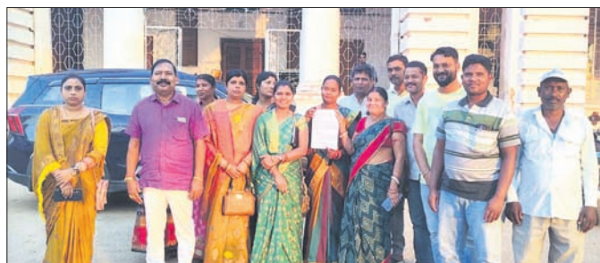
ଜିଲ୍ଲାପାଳଙ୍କ ଦ୍ୱାରସ୍ଥ ହେଲା ସରପଞ୍ଚ ସଂଘ