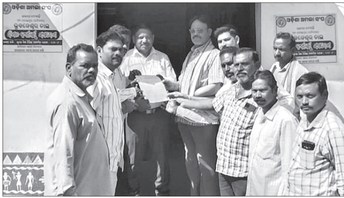
ବିଡିଓଙ୍କୁ ଦାବିପତ୍ର ପ୍ରଦାନ କରାଯାଇଛି ।

ଭାଜପା ପ୍ରଭୃତି, ତେବେ ଭାଜପା ଆନ୍ଦୋଳନ କରିବାକୁ ବାଧ୍ୟ ହେବ ବୋଲି ଦାବିପତ୍ରରେ ଦର୍ଶାଯାଇଛି । ଏହି ଦାବିପତ୍ରରେ ଅଯୋଗ୍ୟ ହିତାଧିକାରୀଙ୍କୁ ପ୍ରଧାନମନ୍ତ୍ରୀ ଆବାସ ଯୋଜନାରେ ଅନ୍ତର୍ଭୁକ୍ତ କରିବାକୁ ଏଥିରେ ଦାବି କରାଯାଇଛି । ଆଗାମୀ ୭ ଦିନ