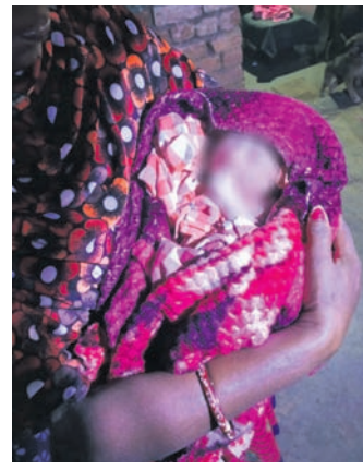
ଉଦ୍ଧାର ହୋଇଥିବା ନବଜାତ ଶିଶୁକନ୍ୟା ।

ରାଉରକେଲା ସେକ୍ଟର-୨୦ ସ୍ଥିତ ମିଶ୍ରଖଟାଲ ବସ୍ତିର ରାଷ୍ଟ୍ରାକତରୁ ଏକ ନବଜାତ ଶିଶୁକନ୍ୟାକୁ