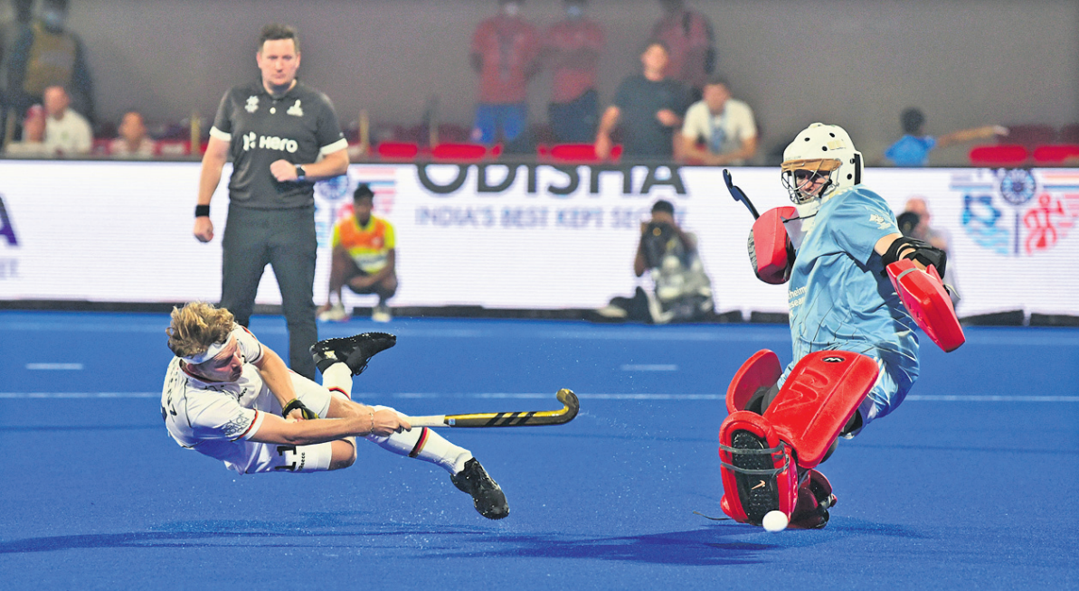
କଳିଙ୍ଗ ଷ୍ଟାଡ଼ିୟମରେ ରୁଧିର ଅନୁଷ୍ଠିତ ହକି ବିଶ୍ୱକପ୍ ଏକ କ୍ୱାର୍ଟରଫାଇନାଲ ମ୍ୟାଚରେ ପେନାଲ୍ଟି ଶୁଟାଉଟ ବେଳେ ଜର୍ମାନୀ ଖେଳାଳିଙ୍କ ଶର୍କୁ ଅଟକାଇବା ଲାଗି କଳିଙ୍ଗ ଷ୍ଟାଡ଼ିୟମରେ ପ୍ରୟାସ। ଶୁଭାଭିଷେକ ଜର୍ମାନୀ ଦଳ ଧର୍ମୀ ଗୋଲରେ ବିଜୟ ଲାଭ କରିଛି।

ଆମେରିକାର ପୂର୍ବତନ ପରରାଷ୍ଟ୍ର ସଚିବ ମାଲକ୍ ପିଣ୍ଡିଃ ତାଙ୍କ ଭାରତୀୟ ପ୍ରତିପକ୍ଷ ସୁସମା ସ୍ୱରାଜକୁ ଗୁରୁତ୍ୱପୂର୍ଣ୍ଣ ରାଜନୈତିକ ବ୍ୟକ୍ତିତ୍ୱ ଭାବେ କେବେ ଦେଖି ନ ଥିଲେ।