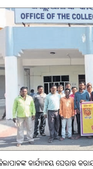
ଜିଲ୍ଲାପାଳଙ୍କ କାର୍ଯ୍ୟାଳୟ ଘେରାଉ କରାଯାଇଛି ।