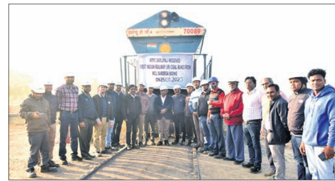
ସରଦେଶା ରେଳଘାଟ ସାଇଡ୍‌ରେ କୋଇଲା ପରିବହନ ଆରମ୍ଭ ସମୟରେ ଉପସ୍ଥିତ ଅଧିକାରୀ ।