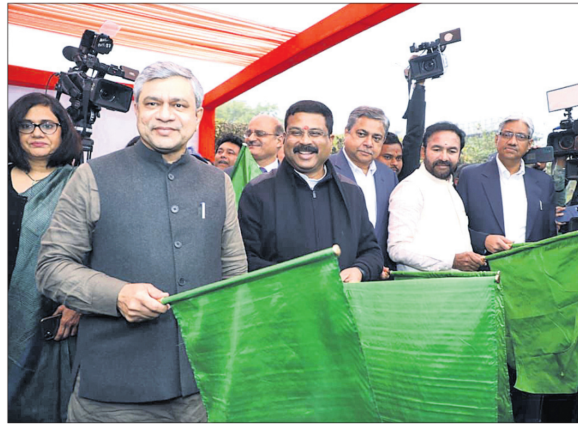
ଶ୍ରୀଜଗନ୍ନାଥ ଯାତ୍ରା ଟ୍ରେନ୍ର ଶୁଭାରମ୍ଭ କରୁଛନ୍ତି ଏ କେନ୍ଦ୍ରମନ୍ତ୍ରୀ ।

ଡାଏନାମିକ୍ ଅତିଥି ସଭାର କର୍ମକାରୀ ଦାୟିତ୍ୱ ନିଅନ୍ତୁ । ମହାପ୍ରଭୁଙ୍କ ଆଶୀର୍ବାଦରେ ଏହି ଟ୍ରେନ୍ର ଶୁଭାରମ୍ଭ ହୋଇଛି । ମହାପ୍ରଭୁଙ୍କ ଇଚ୍ଛା ବିନା କୌଣସି କାମ ସମ୍ପନ୍ନ ହୁଏନାହିଁ । ତାଙ୍କ ଅନୁମତି ବିନା ଉଚ୍ଚମାନେ ତାଙ୍କୁ ପ୍ରତ୍ୟକ୍ଷ ଦର୍ଶନ ପାଇପାରନ୍ତି ନାହିଁ ବୋଲି ଆମର ବିଶ୍ୱାସ ରହିଛି । ଡାଏନାମିକ୍ ଟ୍ରେନ୍ର ପର୍ଯ୍ୟଟନ ଓ ଐତିହ୍ୟ ସ୍ଥଳୀ ଭ୍ରମଣ କରିବା ସମୟରେ ସାଙ୍ଗରେ ମହାପ୍ରଭୁଙ୍କ ମହାପ୍ରସାଦ ଆଣିବା ସହ ରତ୍ନରାଜପୁରର ପବ୍ଲିକ୍ ଓ ସ୍ଥାନୀୟ ସାମଗ୍ରୀକୁ କିଣିବେ ବୋଲି ସେ ଆଶାବ୍ୟକ୍ତ କରିଛନ୍ତି ।