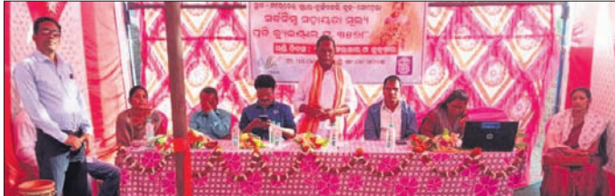
ମାଣିଆ ମଣି ଉଦ୍‌ଘାଟନା ସମାରୋହରେ ଅତିଥିବୃନ୍ଦ ।

ବରଗଡ଼ ଜିଲ୍ଲା ସୋହେଲା ବ୍ଲକରେ ମଙ୍ଗଳବାର ମାଣିଆ ମଣି ଉଦ୍‌ଘାଟିତ ହୋଇଛି । ଆତ୍ମା, ବରଗଡ଼ ଓ ଓଡ଼ିଶା ମିଳେଇ ମିଶନ ଖାସନର ମିଳିତ ସହାୟତା ତଥା ସ୍ୱେଚ୍ଛାସେବୀ ଅନୁଷ୍ଠାନ ମହାଶକ୍ତି ଫାଉଣ୍ଡେଶନ ସହଯୋଗରେ ତିରସବୁଜ କୃଷକ ଉତ୍ପାଦକ କମ୍ପାନୀ ମାଣିଆ ମଣି ପରିଚାଳନା ଦାୟିତ୍ୱ ବହନ କରିଛି । ଖରିଫ୍ ୨୦୨୨-୨୦୨୩ ବର୍ଷ ପାଇଁ ବ୍ଲକ ଅଧୀନ ୧୦ ପଞ୍ଚାୟତ ୨୪ ଗ୍ରାମର ୩୪୪ଜଣ ଚାଷୀଙ୍କଠାରୁ ମାଣିଆ ମଣି କ୍ରୟ କରି ଚିତ୍ତିସିଦ୍ଧି ଜରିଆରେ ରାଜ୍ୟ ସରକାରଙ୍କୁ ପ୍ରଦାନ କରିବାକୁ କମ୍ପାନୀର କାର୍ଯ୍ୟକ୍ରମ ରହିଛି । ୨୦୨୨-୨୦୨୩ ବର୍ଷରେ ୩୪୪ଜଣ ଚାଷୀଙ୍କ ୨୧୨.୯ ହେକ୍ଟର ଚାଷଜମିରେ ମାଣିଆ ଚାଷ ହୋଇଛି ।