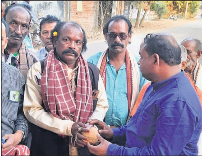
କଂସ କଳାକାରଙ୍କୁ ବରଣ କରାଯାଇଛି ।