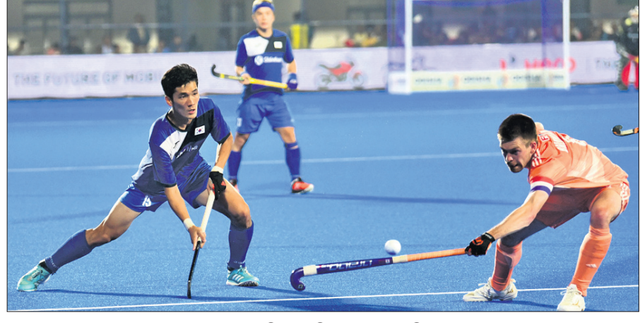
ନେଦରଲାଣ୍ଡ ଓ ଦକ୍ଷିଣ କୋରିଆ ମଧ୍ୟରେ ଅନୁଷ୍ଠିତ ମ୍ୟାଚ ।

ବରାବର ରଖିଥିଲା । ଫଳାଫଳ ନିର୍ଣ୍ଣୟ ପାଇଁ ଶୁଭାଭିତ ପର୍ଯ୍ୟାୟରେ ୩-୨ ଗୋଲରେ ବିଜୟୀ ହୋଇଥିଲା । ପ୍ରତିଯୋଗିତାରେ ଏହିଆର ୪ ବକ ଆୟୋଜକ ଭାବେ, ମାଲେସିଆ, ଜାପାନ ଓ ଦକ୍ଷିଣ କୋରିଆ ଭାଗ ନେଇଥିଲେ । ଏହା ମଧ୍ୟରୁ ଜାପାନର ଅଭିଯାନ ଗୁପ୍ତ ପର୍ଯ୍ୟାୟରୁ ହିଁ ଶେଷ ହୋଇଥିଲା । ଗୁପ୍ତ 'ବି'ରେ ଏହି ବକ ଜର୍ମାନୀ, କୋରିଆ ଓ ବେଲ୍‌ଜିୟମଠାରୁ ହାରିଥିଲା । ଅର୍ଥାତ୍ ଗୋଟିଏ ହେଲେ ମ୍ୟାଚ ଜିତି ନ ପାରି ବକ ବିବାୟ ନେଇଥିଲା । ଗୁପ୍ତ 'ଡି'ରେ ଭାରତ ଗୁପ୍ତ ପର୍ଯ୍ୟାୟରେ ଅପରାଜିତ ରହିଥିଲେ ହେଁ କ୍ରମ୍ ଓଭର ମ୍ୟାଚରେ ଶୁଭାଭିତ/ସତନ୍‌ଡେଥିରେ ଘୁଞ୍ଚିଲାଠାରୁ ହାରି ଯାଇଥିଲା । ସେହିପରି ମାଲେସିଆ ପୁଲ୍ 'ସି'ରେ ୩ ମ୍ୟାଚରୁ ୨ ବିଜୟ ସହ ଦ୍ୱିତୀୟ ସ୍ଥାନ ଅଧିକାର କରିଥିଲା । ଫଳରେ କ୍ରମ୍ ଓଭରରେ ସ୍ନେନ୍‌କୁ ଭେଟିଥିଲା । ଏହି ପର୍ଯ୍ୟାୟରେ କଡ଼ା ଚ୍ୟାଲେଞ୍ଜ ଦେଇଥିଲେ ହେଁ ଶୁଭାଭିତ/ସତନ୍‌ଡେଥିରେ ସ୍ନେନ୍‌କୁ ହାରି ବିବାୟ ନେଇଥିଲା ।