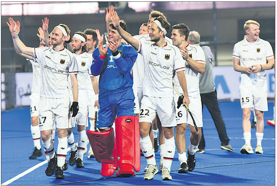
ବିଜୟୀ ଜର୍ମାନୀ ଦଳ ।