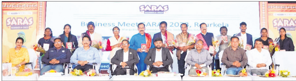
ସମ୍ମାନୀତମାନଙ୍କୁ ସମ୍ମାନୀତ କରିବା ଉଦ୍ଦେଶ୍ୟରେ ମୁଖ୍ୟମନ୍ତ୍ରୀଙ୍କୁ

ରାଉରକେଲା ସେକ୍ଟର-୫ ଲକ୍ଷ ଉଦ୍ଦେଶ୍ୟରେ ପ୍ରଦର୍ଶନୀ ପଦ୍ଧତି ପରିସରରେ ୧୧ଦିନ ହେଲାଣି ବାବୁଜି ସମସ୍ତ ଫେଲୋ।