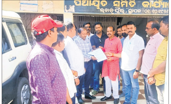
ଭାରତୀୟ ଦାରିଦ୍ର୍ୟ ବିଚାରଣା ସମିତିର ସଭ୍ୟମାନଙ୍କୁ

ପ୍ରଧାନମନ୍ତ୍ରୀ ଆବାସ ଯୋଜନାରେ ହୋଇଥିବା ଅନୁସମିତତା ଓ ଅଯୋଗ୍ୟ ହିତାଧିକାରୀଙ୍କୁ