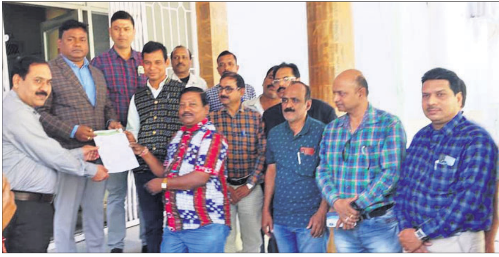
ଅତିରିକ୍ତ ଜିଲ୍ଲାପାଳ ସଂଘ ପ୍ରତିନିଧିଙ୍କଠାରୁ ସ୍ୱାଗତପତ୍ର ଗ୍ରହଣ କରୁଛନ୍ତି ।

ରାଜ୍ୟ ସରକାର ବେସରକାରୀ କଲେଜ କର୍ମଚାରୀଙ୍କ ଦରମା କୁଟି କରିଛନ୍ତି । ମାତ୍ର ସମାନ କାମ କରୁଥିବା କେତେକ ଅଧ୍ୟାପକ କର୍ମଚାରୀ ଏଥିରେ ଉପକୃତ ହେଉଥିବାବେଳେ ଅନେକ ଏଥିରୁ ବାଦ୍ ପଡ଼ିଛନ୍ତି । ସମାନ ଦରମା ପାଉଥିବା ବୁଲ୍ ଗୋଷ୍ଠୀକୁ ଏହି ନିଷ୍ପତ୍ତି ଆଧାରରେ ସରକାର ବୁଲ୍ ଭାଗ କରି ଭାଙ୍ଗିଦେଇଛନ୍ତି । ତେଣୁ ନିଖୁଳ ଓଡ଼ିଶା ୨୬୨ (ଯୁକ୍ତ ୨, ଯୁକ୍ତ ୩) ବେସରକାରୀ ଅଧ୍ୟାପକ କର୍ମଚାରୀ ସଂଘ ସରକାରଙ୍କ ଏଭଳି ନିଷ୍ପତ୍ତିକୁ ବିରୋଧ କରି ଆନ୍ଦୋଳନମୂଳକ ପଦ୍ଧତି ଆପଣେଇଛି । ଏହି ନିଷ୍ପତ୍ତିରେ କ୍ୟାମ୍ପେନଟ ମୋହର ମାରିବା ପରଠାରୁ ୨୬୨ବର୍ଗ ଅଧ୍ୟାପକ, ଅଧ୍ୟାପକମାନେ କଳାବ୍ୟାଜ୍ ପିନ୍ଧି ପ୍ରତିବାଦ କରୁଛନ୍ତି । ଏହି କ୍ରମରେ ରୁଧିରୀ ବରଗଡ଼ ଜିଲ୍ଲା ୨୬୨ବର୍ଗ ଧ୍ୟାପକକର୍ମଚାରୀ ସଂଘ ତରଫରୁ ନିଷ୍ପତ୍ତିର ପୁନଃଚିନ୍ତା କରିବା ପାଇଁ ପୁଞ୍ଜୀମନ୍ତ୍ରୀଙ୍କ