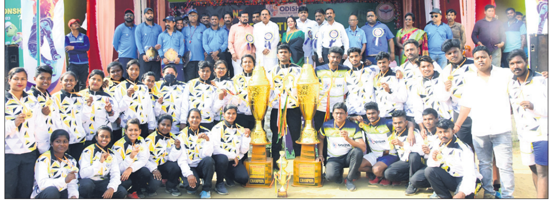
୩୨ତମ ଜାତୀୟ ଫେଡେରେଶନ ଥ୍ରୋ ବଲ୍ ଚାମ୍ପିୟନଶିପରେ ଚାମ୍ପିୟନ ହୋଇଥିବା ପୁରୁଷ ଓ ମହିଳା ଦଳର ଖେଳାଳିମାନେ।