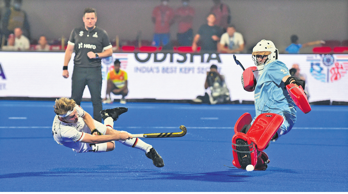
କଳିଙ୍ଗ ଷ୍ଟାଡ଼ିୟମରେ ରୁଧିରୀ ଅନୁଷ୍ଠିତ ହକି ବିଶ୍ୱକପ୍‌ର ଏକ କ୍ୱାର୍ଟରଫାଇନାଲ ମ୍ୟାଚର ପେନାଲ୍ଟି ଶୁଟାଉଟ ବେଳେ ଜର୍ମାନୀ ଖେଳାଳିକ ଶର୍ବୁ ଅଟକାଇବା ଲାଗି ଇଂଲଣ୍ଡ ଗୋଲକିପରଙ୍କ ପ୍ରୟାସ। ଶୁଭାଭିଷେକ ଜର୍ମାନୀ ଦଳ ଧ-୩ ଗୋଲରେ ବିଜୟ ଲାଭ କରିଛି।