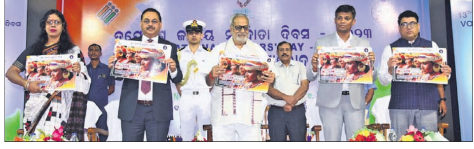
ଭୋଟର ସଚେତନତା ଉଦ୍ଦେଶ୍ୟରେ ପ୍ରସ୍ତୁତ ସୂଚନା, ଶିକ୍ଷା ଓ ଯୋଗାଯୋଗ ପୁସ୍ତିକା ଉନ୍ମୋଚନ କରାଯାଇଛି।