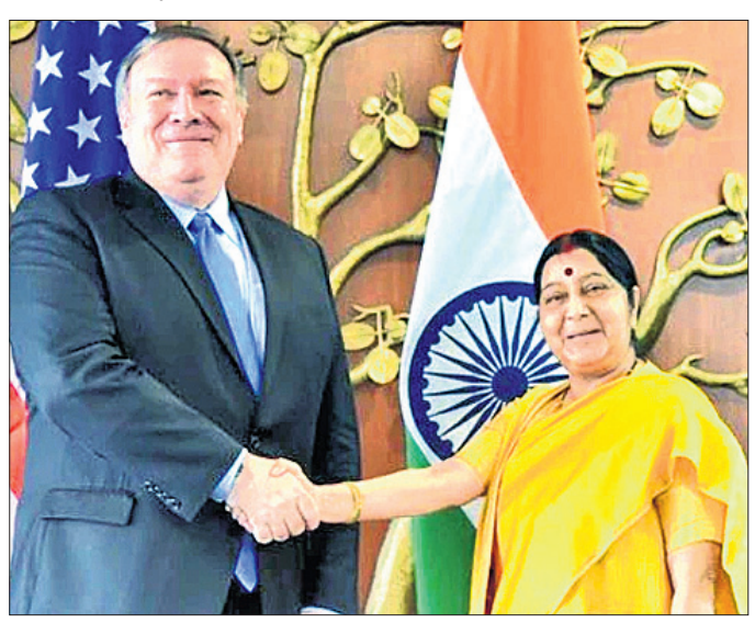
ମୋଦି ସରକାରଙ୍କ ପ୍ରଥମ ପାଳିରେ ବହିର୍ଦ୍ଦେଶୀୟ ମନ୍ତ୍ରୀ ଥିବା ସ୍ୱର୍ଗତ ସୁଷମା ସ୍ୱରାଜଙ୍କ ସହ ଆମେରିକୀୟ ପୂର୍ବତନ ପରାମର୍ଶ ଦାୟକ ମାଲକ ପକ୍ଷିଓ।