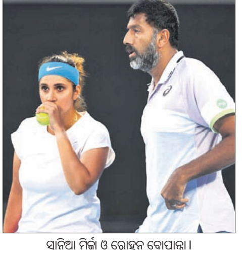
ସାନିଆ ମିର୍ଲା ଓ ରୋହନ ବୋପାନ୍ନା ।

ଅନ୍ତରାଳ ଗ୍ରାଣ୍ଡସ୍ଲାମ ଖେଳୁଥିବା ଭାରତୀୟ ଟେନିସ୍ ଚାରଣା ସାନିଆ ମିର୍ଲା ଅଷ୍ଟ୍ରେଲିଆନ ଓପନ୍ ଟେନିସ୍ ଟୁର୍ନାମେଣ୍ଟ ମିଳିତ ଡବଲ୍ ବିଭାଗ ଫାଇନାଲରେ ପ୍ରବେଶ କରିଛନ୍ତି। କ୍ୟାରିୟରର ସପ୍ତମ ମେଜର ଚାଲେଞ୍ଜର ଲକ୍ଷ୍ୟରେ ରହିଥିବା ସାନିଆ ଅନ୍ୟତମ ଭାରତୀୟ ରୋହନ ବୋପାନ୍ନାଙ୍କ ସହିତ ଖେଳୁଛନ୍ତି। ସେମିରେ ଏହି ଭାରତୀୟ ଯୋଡି ବିଶ୍ୱ ମାନ୍ୟତାରେ ୩ ନମ୍ବର ସ୍ଥାନରେ ଥିବା ନିଲ୍ ସ୍କୁପ୍ସି ଓ ଡିଜେୟାର କ୍ରାଫ୍ଟିକଙ୍କ ଯୋଡିକୁ ୬-୬(୫), ୬-୬(୫) ଓ ୧୦-୬ ସେଟ୍ରେ ପରାସ୍ତ କରିଥିଲେ। ବୁଧବାର ୩ଟି ଯାକ ସେଟ୍ ଚାଲିଥିବା ସତ୍ତ୍ୱେ ଯାଇଥିଲା। ପ୍ରଥମ ସେଟ୍ ସାନିଆ-ବୋପାନ୍ନା ଜିତିଥିବା ବେଳେ ସ୍କୁପ୍ସି-ଡିଜେୟାର ଦ୍ୱିତୀୟ ସେଟ୍ରେ ପ୍ରତ୍ୟାବର୍ତ୍ତନ କରିଥିଲେ। ନିର୍ଣ୍ଣାୟକ ସେଟ୍ ପ୍ରଥମ ଚାଲିଥିବା ସତ୍ତ୍ୱେ ଯାଇଥିବା ବେଳେ ସାନିଆଙ୍କ ବ୍ୟାକହାଣ୍ଡ ଶବ୍ଦରେ ବିଜୟ ହୋଇଥିଲେ ଭାରତୀୟ ଯୋଡି। ନିଜ କ୍ୟାରିୟର ଅନ୍ତିମ ଗ୍ରାଣ୍ଡସ୍ଲାମ ଟୁର୍ନାମେଣ୍ଟର ଫାଇନାଲରେ ପ୍ରବେଶ କରିବା ମୋ ପାଇଁ ସ୍ୱତନ୍ତ୍ର। ମାତ୍ର ୧୪ ବର୍ଷ ବୟସରେ ରୋହନଙ୍କ ସହିତ ପ୍ରଥମ ଥର ପାର୍ଟନର ହୋଇ ଖେଳିଥିଲି। କ୍ୟାରିୟରର ଶେଷ ଗ୍ରାଣ୍ଡସ୍ଲାମ ଚାଲି ସହିତ ଖେଳିବା ମୋତେ ବେଶ୍ ଖୁସି ଦେଉଛି ବୋଲି ପ୍ରକାଶ କରିଥିଲେ ସାନିଆ।