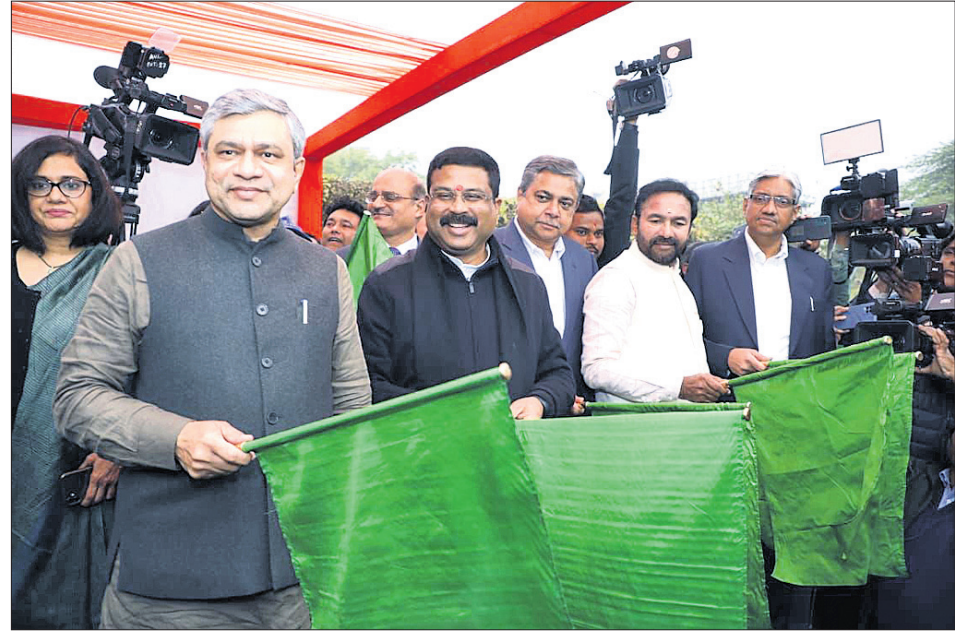
ଶ୍ରୀଜଗନ୍ନାଥ ଯାତ୍ରା ଟ୍ରେନ୍ର ଶୁଭାରମ୍ଭ କରୁଛନ୍ତି ୩ କେନ୍ଦ୍ରମନ୍ତ୍ରୀ।

ଭୁବନେଶ୍ୱର, ୨୫।୧ (ଭୁବନେ) ଓଡ଼ିଶାକୁ ଆସୁଥିବା ଚାର୍ଯ୍ୟାତ୍ରାଙ୍କ ଅତିଥି ସକ୍ୱାର କରିବାର ଦାୟିତ୍ୱ ନେବା ପାଇଁ ବୁଧବାର ନୂଆଦିଲ୍ଲୀରୁ ଯାତ୍ରା ଟ୍ରେନ୍ର ଲୋକାର୍ପଣ କରାଯାଇଛି। ଜାତୀୟ ପର୍ଯ୍ୟଟନ ବିବସରେ କେନ୍ଦ୍ରମନ୍ତ୍ରୀ ଧର୍ମେନ୍ଦ୍ର ପ୍ରଧାନ ଏବଂ ରେଳମନ୍ତ୍ରୀ ଅଶ୍ୱିନୀ ବୈଷ୍ଣବ ଏହି ଟ୍ରେନ୍ର