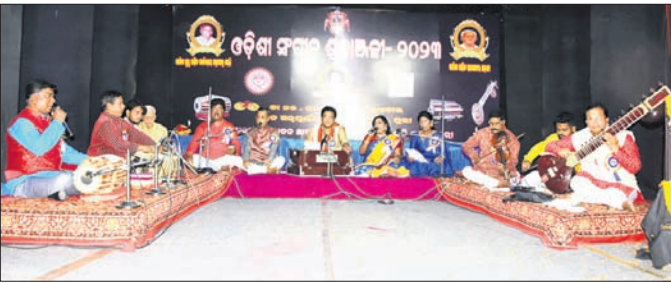
ଶ୍ରଦ୍ଧାଞ୍ଜଳି କାର୍ଯ୍ୟକ୍ରମରେ ଓଡ଼ିଶୀ ସଙ୍ଗୀତ ପରିବେଷଣ କରାଯାଇଛି।

ଓଡ଼ିଶୀ ସଙ୍ଗୀତର ପ୍ରବାଦ ପୁରୁଷ ଗୁରୁ ମାର୍ଚ୍ଚଣ୍ଡେୟ ମହାପାତ୍ର ଶର୍ମାଙ୍କ ଉଦ୍ଦେଶ୍ୟରେ ରୁଧିରା ପଦ୍ମଶ୍ରୀ ପୁରସ୍କାର ଅନୁଷ୍ଠିତ ହୋଇଥିଲା। ପରେ ଅତିଥି ଭାବେ ବିଧାୟକ ଜୟନ୍ତ କୁମାର ସିଂହଙ୍କୁ ଯୋଗଦେଇ କାର୍ଯ୍ୟକ୍ରମକୁ ଉଦ୍ଘାଟନ କରିଥିଲେ। ଏହି ଅବସରରେ ଗୁରୁ ମାର୍ଚ୍ଚଣ୍ଡେୟ ମହାପାତ୍ର ଶର୍ମାଙ୍କୁ ଶ୍ରଦ୍ଧାଞ୍ଜଳି ଅନୁଷ୍ଠିତ ହୋଇଥିଲା। ପରେ ଅତିଥି ଭାବେ ବିଧାୟକ ଜୟନ୍ତ କୁମାର ସିଂହଙ୍କୁ ଯୋଗଦେଇ କାର୍ଯ୍ୟକ୍ରମକୁ ଉଦ୍ଘାଟନ କରିଥିଲେ। ଏହି ଅବସରରେ ଗୁରୁ ମାର୍ଚ୍ଚଣ୍ଡେୟ ମହାପାତ୍ର ଶର୍ମାଙ୍କୁ ଶ୍ରଦ୍ଧାଞ୍ଜଳି ଅନୁଷ୍ଠିତ ହୋଇଥିଲା। ପରେ ଅତିଥି ଭାବେ ବିଧାୟକ ଜୟନ୍ତ କୁମାର ସିଂହଙ୍କୁ ଯୋଗଦେଇ କାର୍ଯ୍ୟକ୍ରମକୁ ଉଦ୍ଘାଟନ କରିଥିଲେ। ଏହି ଅବସରରେ ଗୁରୁ ମାର୍ଚ୍ଚଣ୍ଡେୟ ମହାପାତ୍ର ଶର୍ମାଙ୍କୁ ଶ୍ରଦ୍ଧାଞ୍ଜଳି ଅନୁଷ୍ଠିତ ହୋଇଥିଲା।