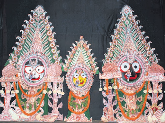
ପୁରୀ ଅର୍ପିତ, ୨୫।୧

ଶ୍ରୀମନ୍ଦିରରେ ରୁଧିରା ମହାପ୍ରଭୁଙ୍କ ପଦ୍ମବେଶ ଅବୃତ୍ତି ହୋଇଛି। ଶ୍ରୀକାଳୀମାନେ ଏହି ଦୁର୍ଲଭ ବେଶ ଦର୍ଶନ କରି ନିଜକୁ ଧନ୍ୟ ମଣିଛନ୍ତି। ପରମ୍ପରା ଅନୁଯାୟୀ ମାଘ ମାସ ଅମାବାସ୍ୟାଠାରୁ ବସନ୍ତ ପଞ୍ଚମୀ ମଧ୍ୟରେ ପଦ୍ମପୁଷ୍ପା ରୁଧିରା କିମ୍ବା ଶନିବାର ଏହି ବେଶ କରାଯାଇଥାଏ। ଗୁରୁବାର ବସନ୍ତ ପଞ୍ଚମୀ ପଦ୍ମପୁଷ୍ପା ରୁଧିରା ଶ୍ରୀବିଗ୍ରହଙ୍କୁ ପଦ୍ମବେଶରେ ସୁସଜ୍ଜିତ କରାଯାଇଛି। ବଡ଼ସିଂହାର ବେଶରେ ପଦ୍ମବେଶ ହୋଇଥିଲା। ଏହି ବେଶରେ ଠାକୁର ଯୋଗରେ ନିର୍ମିତ ଶ୍ରୀପୁଷ୍ପ ପଦ୍ମ, କରମଲବ କଢ଼ି, ହଂସ, ବୁଲ, ମରଗରୁକ୍ତକ, ପଦ୍ମପୁଲ, କଦମ୍ବପୁଲ ଆଦି ଧାରଣ କରିଛନ୍ତି। ସୋଲ, ଜରି, କଦମ୍ବାପଟ, କନା, କଳଥ ଥିଆ, ରଙ୍ଗ ସାହାଯ୍ୟରେ ଏ ସବୁକୁ ପାରମ୍ପରିକ କାରିଗରଙ୍କ ଦ୍ୱାରା ନିର୍ମିତ କରାଯାଇଛି। ପରମ୍ପରା ଅନୁଯାୟୀ, ବଡ଼ଛତା ମଠ ଏହି ବେଶ ପ୍ରସ୍ତୁତ କରି ଯୋଗାଇଥାନ୍ତି। ବେଶ ପରେ ମହାପ୍ରଭୁଙ୍କୁ ଖୁଣ୍ଟି ଓ ଅମାଲୁ ଅମାବାସ୍ୟାଠାରୁ ବସନ୍ତ ପଞ୍ଚମୀ ମଧ୍ୟରେ ପଦ୍ମପୁଷ୍ପା ରୁଧିରା କିମ୍ବା ଶନିବାର ଏହି ବେଶ କରାଯାଇଥାଏ। ଗୁରୁବାର ବସନ୍ତ ପଞ୍ଚମୀ ପଦ୍ମପୁଷ୍ପା ରୁଧିରା ଶ୍ରୀବିଗ୍ରହଙ୍କୁ ପଦ୍ମବେଶରେ ସୁସଜ୍ଜିତ କରାଯାଇଛି। ବଡ଼ସିଂହାର ବେଶରେ ପଦ୍ମବେଶ ହୋଇଥିଲା। ଏହି ବେଶରେ ଠାକୁର ଯୋଗରେ ନିର୍ମିତ ଶ୍ରୀପୁଷ୍ପ ପଦ୍ମ, କରମଲବ କଢ଼ି, ହଂସ, ବୁଲ, ମରଗରୁକ୍ତକ, ପଦ୍ମପୁଲ, କଦମ୍ବପୁଲ