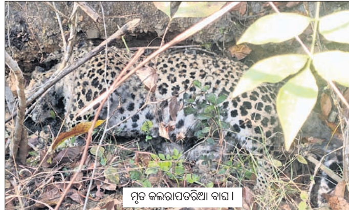
ମୃତ କଲରାପତରିଆ ବାଘ।