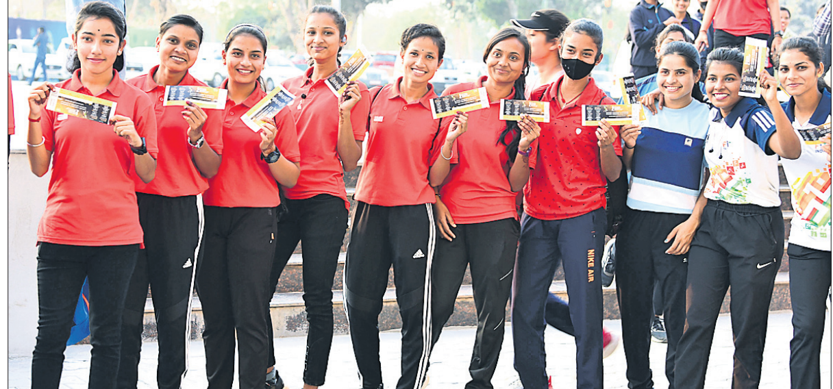
ବିବେକ ପ୍ରଦର୍ଶନ କରୁଥିବା ଛାତ୍ରୀମାନଙ୍କ ।

ଗୋଆଲୋ ପିଲାର୍‌ଙ୍କ ବିରଳ ରେକର୍ଡ ଗୋଆଲୋ ପିଲାର୍‌ଙ୍କ ବିରଳ ରେକର୍ଡ ଗୋଆଲୋ ପିଲାର୍‌ଙ୍କ ବିରଳ ରେକର୍ଡ ଗୋଆଲୋ ପିଲାର୍‌ଙ୍କ ବିରଳ ରେକର୍ଡ ଗୋଆଲୋ ପିଲାର୍‌ଙ୍କ ବିରଳ ରେକର୍ଡ