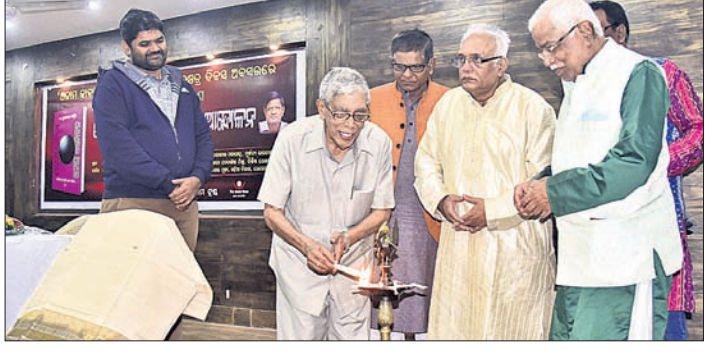
ଅନାମ କାବ୍ୟ ଆନ୍ଦୋଳନର ସ୍ମରଣସ୍ତ୍ର ଦିବସକୁ ଅତିଥିମାନେ ଭବ୍ୟାବଦନ କରୁଛନ୍ତି।

ଭୁବନେଶ୍ୱର, ୨୭-୧ (ବୁଧ) ଅନାମ କାବ୍ୟ ଆନ୍ଦୋଳନର ୫୫ତମ ସ୍ମରଣସ୍ତ୍ର ଦିବସ ଗୁରୁବାର ଲୋହିଆ ଏକାଡେମୀରେ ପାଳିତ ହୋଇଯାଇଛି।