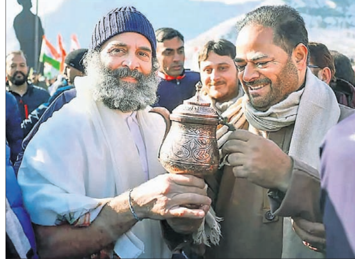
ଭାରତ ଯୋଡ଼ା ଯାତ୍ରା ଅବସରରେ କଣ୍ଠ-କଣ୍ଠୀର ବନିହାଲଠାରେ ଗଣେ ସମର୍ଥକଙ୍କ ସହ କଂଗ୍ରେସ ନେତା ରାହୁଲ ଗାନ୍ଧୀ।

ରାହୁଲ ଅନନ୍ତନାଗଠାରେ କହିଛନ୍ତି। ରାହୁଲ ଶୁକ୍ରବାର କାଜିଗୁଣ୍ଡାରେ ପହଞ୍ଚିବା ପରେ ଦକ୍ଷିଣ କଣ୍ଠାର ଭେସୁ ଅଭିଯୁକ୍ତ ଯାତ୍ରା ଆରମ୍ଭ କରିଥିଲେ।