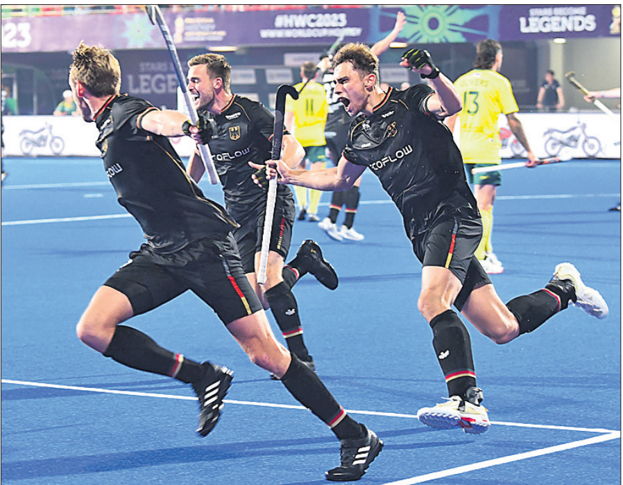
ଅଷ୍ଟ୍ରେଲିଆ ବିପକ୍ଷ ସେମିଫାଇନାଲ ମ୍ୟାଚ ଜିତିବା ପରେ ସ୍ତୁତିରେ ଆତ୍ମହରା ଜର୍ମାନୀ ଖେଳାଳି ।

ବିଶ୍ୱ ନୟନେଶ୍ୱର ଦଳ ଅଷ୍ଟ୍ରେଲିଆର ବିଶ୍ୱକପ ଚାଉଟଳ ଅଭିଯାନ ସେମିଫାଇନାଲରେ ଶେଷ ହୋଇଛି । ଶୁକ୍ରବାର କଳିଙ୍ଗ ଷ୍ଟାଡ଼ିୟମରେ ଅନୁଷ୍ଠିତ ପ୍ରଥମ ସେମିଫାଇନାଲରେ ଜର୍ମାନୀ ୪-୩ ଗୋଲରେ ବିଜୟ ହୋଇ ଅଷ୍ଟ୍ରେଲିଆକୁ ବିଦାୟ ପତ୍ର ଦେଖାଇଛି । ଫଳରେ ୧୯୮୬, ୨୦୧୦ ଓ ୨୦୧୪ରେ ଚାମ୍ପିୟନ ଅଷ୍ଟ୍ରେଲିଆର ଚାଉଟଳ ବିଜୟ ସ୍ୱପ୍ନ ଧୂଳିଘାତ ହୋଇଛି । ୨୦୧୮ରେ ଅନୁଷ୍ଠିତ ସଂଘର ୧୨ଶ ଉପକ ବିବେଚନା ଅଷ୍ଟ୍ରେଲିଆ ଏଥର ମଧ୍ୟ ଗ୍ରୋଉଥ ପଦକ ପାଇଁ ଲଢ଼ିବ । ଅନ୍ୟପକ୍ଷରେ ୨୦୦୨ ଓ ୨୦୦୬ରେ ଚାମ୍ପିୟନ ଏବଂ ୧୯୮୭ ଓ ୨୦୧୦ରେ ରନରାଜ୍‌ସ୍ୱରା ଜର୍ମାନୀ ଦୀର୍ଘ ୧୩ ବର୍ଷ ବ୍ୟବଧାନରେ ଫାଇନାଲରେ ପ୍ରବେଶ କରିଛି ।