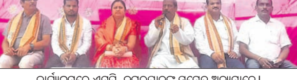
କାର୍ଯ୍ୟକ୍ରମରେ ଏମ୍ପି, ନଗରପାଳଙ୍କ ସମେତ ଅନ୍ୟମାନେ।