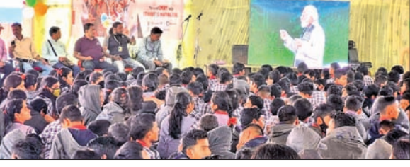
କାର୍ଯ୍ୟକ୍ରମରେ ଅଂଶଗ୍ରହଣ କରିଥିବା ଛାତ୍ରାଛାତ୍ରୀମାନେ।

ଦେଶାନ୍ତର କେନ୍ଦ୍ରୀୟ ବିଦ୍ୟାଳୟରେ ପ୍ରଧାନମନ୍ତ୍ରୀ ନରେନ୍ଦ୍ର ମୋଦିଙ୍କ ପରୀକ୍ଷା ପେ' ଚର୍ଚ୍ଚା-୨୦୨୩ କାର୍ଯ୍ୟକ୍ରମ ପ୍ରସାରଣ ପ୍ରସାରଣ ଶୁକ୍ରବାର ଅନୁଷ୍ଠିତ ହୋଇଯାଇଛି। ପରୀକ୍ଷା ସମୟରେ ମନରୁ ଭୟ ଦୂର କରିବା, ଆଗ୍ରାଧିପତ୍ତି, ସାଧାରଣତା, ଶିକ୍ଷଣ ଉପସ୍ଥିତ ଥିଲେ।