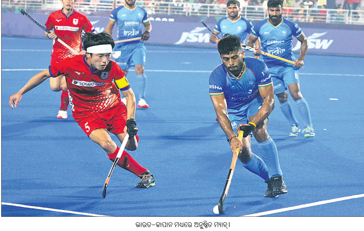
ଭାରତ-ଜାପାନ ମଧ୍ୟରେ ଅନୁଷ୍ଠିତ ମ୍ୟାଚ ।

ଦକ୍ଷିଣ ଆଫ୍ରିକା, ଖେଲୁ, ଆର୍ଜେଣ୍ଟିନା ବିଜୟୀ ଦକ୍ଷିଣ ଆଫ୍ରିକା, ଖେଲୁ, ଆର୍ଜେଣ୍ଟିନା ବିଜୟୀ ଦକ୍ଷିଣ ଆଫ୍ରିକା, ଖେଲୁ, ଆର୍ଜେଣ୍ଟିନା ବିଜୟୀ ଦକ୍ଷିଣ ଆଫ୍ରିକା, ଖେଲୁ, ଆର୍ଜେଣ୍ଟିନା ବିଜୟୀ ଦକ୍ଷିଣ ଆଫ୍ରିକା, ଖେଲୁ, ଆର୍ଜେଣ୍ଟିନା ବିଜୟୀ