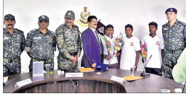
ଆତ୍ମସମର୍ପଣ କରିଥିବା ୩ ମାଓବାଦୀ।