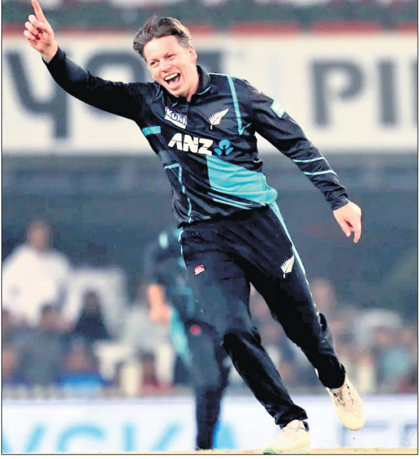
ଉଇକେଟ ନେବାପରେ ଉଲ୍ଲସିତ ମାଇକେଲ ବ୍ରେସ୍‌ଫିଲ୍ଡ।