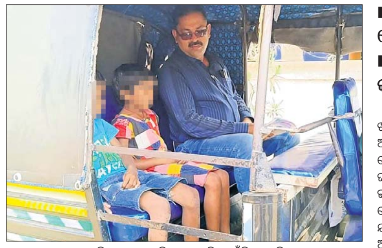
ଦୁଇ ଶିଶୁଙ୍କୁ ଉଦ୍ଧାର କରି କାରନ୍‌ସେଲିଂ ପାଇଁ ନିଆଯାଉଛି।