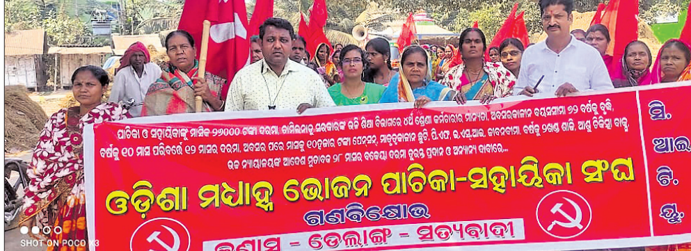
ବିଭିନ୍ନ ଦାବି ନେଇ ତେଲଙ୍ଗ ଲୁକ କାର୍ଯ୍ୟାଳୟ ସମ୍ମୁଖରେ ବିକ୍ଷୋଭ ପ୍ରଦର୍ଶନ କରାଯାଇଛି।