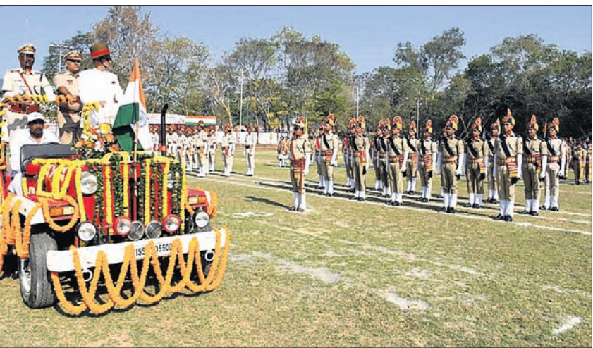
ମହାନଦୀ କୋଲିପଲ୍ଲୀ ଲିମିଟେଡ୍ (ଏମ୍‌ସିଏଲ)ର କର୍ମଚାରୀଙ୍କୁ ସମେତ ଅପରେଟିଭ୍ କୁମାର ଏରିଆଲ୍‌ସ୍‌ପୋର୍ଟ୍‌ସ୍‌ ଗୁରୁବାର ସାଧାରଣତନ୍ତ୍ର ଦିବସ ପାଳିତ ହୋଇଯାଇଛି। ଏହି ପରିପ୍ରେକ୍ଷାରେ ସହକର୍ମୀଗୁଡ଼ିକ ଆନନ୍ଦ ବିହାର ଗ୍ରାଉଣ୍ଡରେ ଏମ୍‌ସିଏଲ୍‌ସ୍‌ ବିଏମ୍‌ସି ଓ ସିଏସ୍‌ ଗଣତନ୍ତ୍ର ଦିବସ ପରେ ଉପକ୍ରମରେ ଗ୍ରହଣ କରୁଛନ୍ତି।