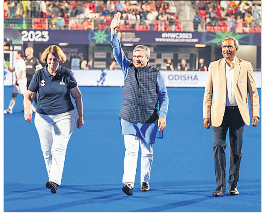
ବେଲଜିୟମ-ନେଦରଲାଣ୍ଡ ମ୍ୟାଚର ଅତିଥି ରେକମାନ୍ଦ୍ରୀ ଅଶ୍ୱିନୀ ଦେବିଙ୍କ ଓ ଅନ୍ୟମାନେ।