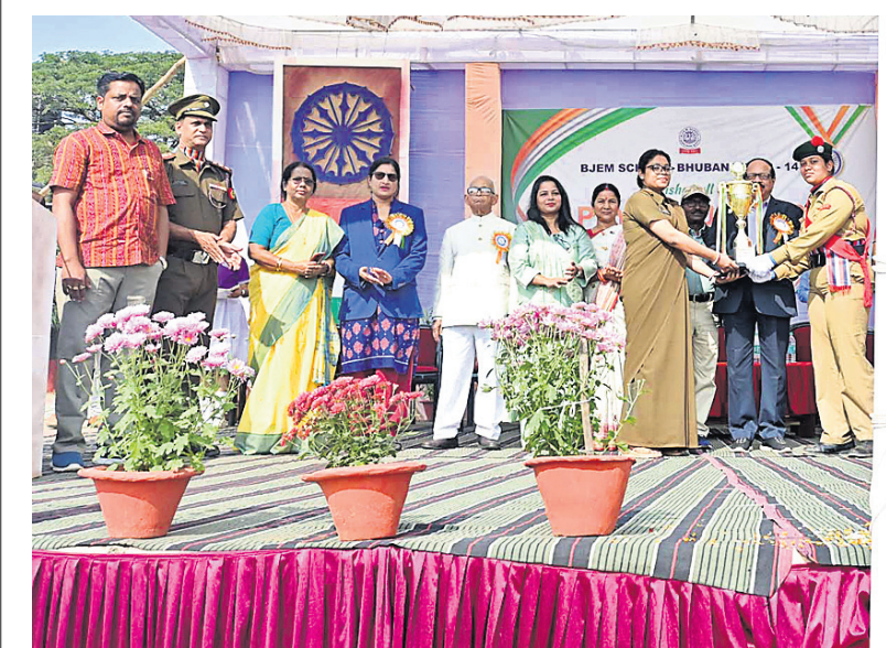
ବିଜେଇଏମ୍ ସ୍କୁଲରେ ୭୪ତମ ସାଧାରଣତନ୍ତ୍ର ଦିବସ ପାଳନ ଅବସରରେ ଅତିଥିମାନେ ଜଣେ କ୍ୟାଡେଟଙ୍କୁ ପୁରସ୍କୃତ କରୁଛନ୍ତି।