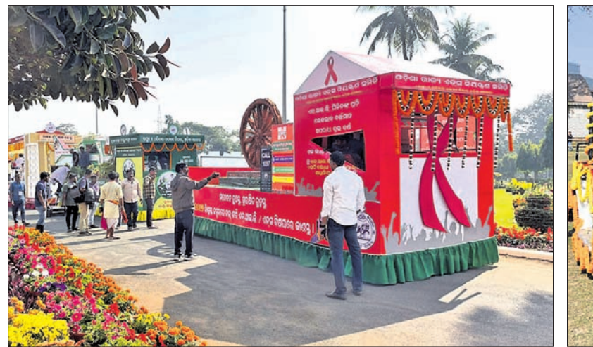
ସ୍ୱାସ୍ଥ୍ୟ ଓ ପରିବାର କଲ୍ୟାଣ ବିଭାଗର ସହଯୋଗୀ ସଂସ୍ଥା ଓଡ଼ିଶା ରାଜ୍ୟ ଏଡ୍‌ସ୍ ନିୟନ୍ତ୍ରଣ ସମିତି (ଓଏସ୍‌ଏସ୍) ପକ୍ଷରୁ ଏକ ଆକର୍ଷଣୀୟ ପ୍ରସ୍ତାପନ ମେଡ୍ ଡ୍ରାମା ରାଜ୍ୟ ସରକାରଙ୍କ ବିଭିନ୍ନ ପଦକ୍ଷେପ ଓ ସମ୍ବେଦନା ବାଣୀ ସାଧାରଣତନ୍ତ୍ର ଦିବସ ରାଜ୍ୟସ୍ତରୀୟ ପରେ ଉତ୍ତୋଳନ ପ୍ରଦର୍ଶିତ କରାଯାଇଥିଲା।