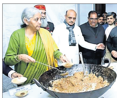
କାରଗରେ ଉପସ୍ଥାପିତ ହେବ। ବିଶେଷକରି ୨୦୨୩-୨୪ କେନ୍ଦ୍ର ବଜେଟ୍ ଚଳିତ ବର୍ଷ ଫେବୃୟାରୀ ୧ରେ ହେବ। ଏହା ସହ ଏକ ଆକର୍ଷଣୀୟ ପ୍ରସ୍ତାପନ ମେଡ୍ ଡ୍ରାମା ରାଜ୍ୟ ସରକାରଙ୍କ ବିଭିନ୍ନ ପଦକ୍ଷେପ ଓ ସମ୍ବେଦନା ବାଣୀ ସାଧାରଣତନ୍ତ୍ର ଦିବସ ରାଜ୍ୟସ୍ତରୀୟ ପରେ ଉତ୍ତୋଳନ ପ୍ରଦର୍ଶିତ କରାଯାଇଥିଲା।