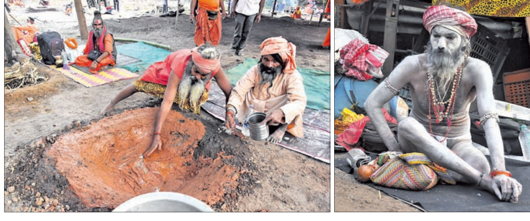
ଭୁବନେଶ୍ୱର, ୨୭।୧ (କୁମ୍ଭମେଳା)

ସାଧୁସନ୍ଥଙ୍କ ଉପସାଧା, ଯଜ୍ଞ ଓ ମନ୍ତ୍ରଧ୍ୱନିରେ ଗୁଞ୍ଜରିତ ହେବ ଉପୋତ୍ସବ