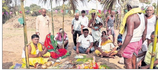
ଭୂଲକ୍ଷ୍ମୀକ୍ଷେତ୍ର ପ୍ରତିଷ୍ଠା ଅବସରରେ ପୂଜାର୍ଚ୍ଚନା କରାଯାଇଛି ।