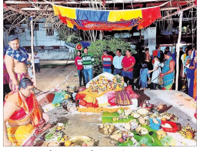
ରଥକାଠ ଅନୁକୂଳ ପୂର୍ବରୁ ଠାକୁରଙ୍କୁ ପୂଜାର୍ଚ୍ଚନା କରାଯାଇଛି।