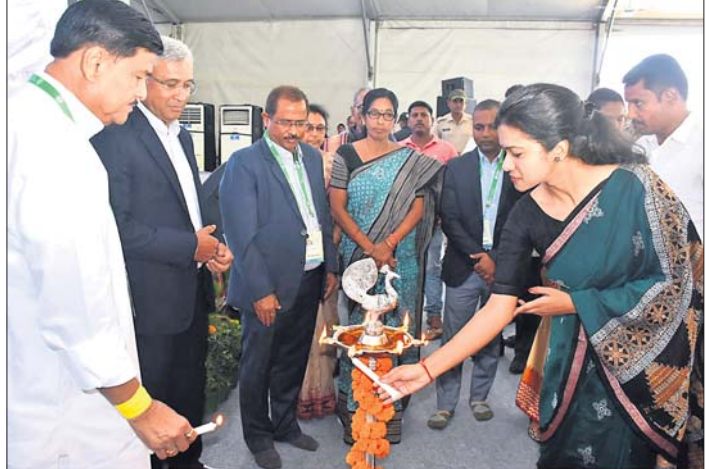
ସମଲପୁରରେ ପଶ୍ଚିମ ଓଡ଼ିଶା କୃଷିମେଳା ଉଦ୍‌ଘାଟନ ହେଉଛି।

କୃଷି କ୍ଷେତ୍ରରେ ଯାନ୍ତ୍ରିକୀକରଣ ହେଉଛି ବର୍ଦ୍ଧମାନର ଆବଶ୍ୟକତା। କୃଷି ସମୁଦାୟର ସାମଗ୍ରିକ ବିକାଶ ପାଇଁ ଆମ ସରକାର ପ୍ରତିବଦ୍ଧ। କୃଷି ଓ କୃଷକର ଉନ୍ନତି ମୁଖ୍ୟ ପ୍ରାଥମିକତା। ତେଣୁ କାଳିଆ, ବଳରାମ, ମିଲେଡ଼ ମିଶନ ଭଳି ଯୋଜନା ଲାଗୁ ହୋଇଛି। ଆଗକୁମୁଖ ଯୋଜନା କାର୍ଯ୍ୟକାରୀ କରାଯିବ। ଓଡ଼ିଶାର ଗଞ୍ଜାମ ପାଇଁ ରାଜ୍ୟକୁ ନିୟମିତ ବ୍ୟବଧାନରେ ଜାତୀୟସ୍ତରରେ ସମ୍ମାନ ମିଳୁଛି ବୋଲି ଭିଜିଓ ବାର୍ଷିକରେ ମୁଖ୍ୟମନ୍ତ୍ରୀ ନବୀନ ପଟ୍ଟନାୟକ କହିଥିଲେ। ସମଲପୁର ପିଏସ୍‌ଟି ପଡ଼ିଆରେ ପଶ୍ଚିମ ଓଡ଼ିଶା ବିକାଶ ପରିଷଦ (ବିକ୍ସିଓଡ଼ିଏ) ଏବଂ ଓଡ଼ିଶା ସରକାରଙ୍କ କୃଷି ଓ କୃଷକ ସଶକ୍ତୀକରଣ ବିଭାଗ ପଞ୍ଚୁ ମିଳିତ ଭାବେ ଫେଡେରେଶନ ଅଫ୍ ଇଣ୍ଡିଆନ ଗାୟର ଅଫ୍ କର୍ମୀ ଆଣ୍ଡ ଇଣ୍ଡଷ୍ଟ୍ରି (ଫିକା) ସହଭାଗିତାରେ ପଶ୍ଚିମ ଓଡ଼ିଶା କୃଷିମେଳା ଉଦ୍‌ଘାଟନା ଉତ୍ସବରେ ମୁଖ୍ୟମନ୍ତ୍ରୀ ଏହା କହିଥିଲେ।