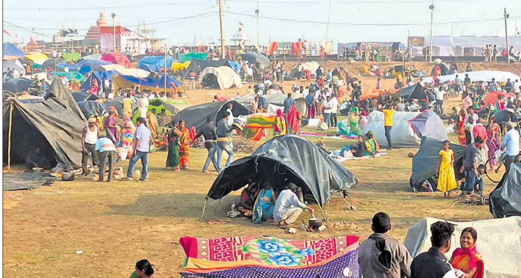
ରୁଦ୍ର ପକାଇବା ପାଇଁ ଚନ୍ଦ୍ରଭାଗା ବେଳାଭୂମିରେ ଶ୍ରଦ୍ଧାଳୁମାନେ ଅପେକ୍ଷା କରିଛନ୍ତି ।

ଚନ୍ଦ୍ରଭାଗା ଚାପି ପୁଷ୍କରିଣୀରେ ମାଘ ସପ୍ତମୀ ରୁଦ୍ର ପକାଇବା ପାଇଁ ଶୁକ୍ରବାର ଅପରାହ୍ଣରେ ମେଳା ପଡ଼ିଆରେ ଲକ୍ଷ୍ମୀଙ୍କୁ ଶ୍ରଦ୍ଧାଳୁଙ୍କ ସମାଗମ ହୋଇଛି । ଶ୍ରଦ୍ଧାଳୁମାନେ ବାଉଁଶ କଣିରେ କୁଡ଼ିଆ ତିଆରି କରି ବିଶ୍ରାମ ନେଇଛନ୍ତି । ସେମାନେ ମାଟିହାଣ୍ଡିରେ ରୋଷେଇ ସାରି କୁଡ଼ିଆରେ ପୁସ୍କରିଣୀ ଅପେକ୍ଷା କରିଛନ୍ତି । ନିଷ୍ପତ୍ତି ଅନୁଯାୟୀ ଶ୍ରୀ ଶ୍ରୀ ତ୍ରିବେଣୀଶ୍ୱର, ଲକ୍ଷ୍ମୀଶେଖର, ଦକ୍ଷିଣେଶ୍ୱର ଦେବଙ୍କ ଚଳନ୍ତି ପ୍ରତିମା ରାତି ୮ଟା ପରେ ନିଜ ଆସ୍ଥାନରୁ