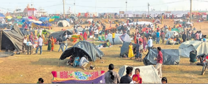
ଚନ୍ଦ୍ରଭାଗାରେ ଶ୍ରଦ୍ଧାଳୁଙ୍କ ଭିଡ଼।

ଚନ୍ଦ୍ରଭାଗା ଚାପି ପୁଷ୍କରିଣୀରେ ମାଘ ସପ୍ତମୀ ବୁଡ଼ ପକାଇବା ପାଇଁ ଶୁକ୍ରବାର ଅପରାହ୍ନରୁ ମେଳା ପଡ଼ିଆରେ ଲକ୍ଷାଧିକ ଶ୍ରଦ୍ଧାଳୁଙ୍କ ସମାଗମ ହୋଇଛି। ଶ୍ରଦ୍ଧାଳୁମାନେ ବାଉଁଶ କରିରେ କୁଡ଼ିଆ ତିଆରି କରି ବିଗ୍ରହ ନେଇଛନ୍ତି। ସେମାନେ ମାଟିହାଣ୍ଡିରେ ରୋଷେଇ ସାରି କୁଡ଼ିଆରେ ପୂଜାର୍ଚ୍ଚନା ଅପେକ୍ଷା କରିଛନ୍ତି। ନିଷ୍ପତ୍ତି ଅନୁଯାୟୀ ଶ୍ରୀ ଗ୍ରୀ ଗୁଣେଶ୍ୱର, ଦକ୍ଷିଣେଶ୍ୱର ବେବକ ଚଳନ୍ତି ପ୍ରତିମା ରାତି ୮ଟା ପରେ ନିଜ ଆସ୍ଥାନରୁ ବାହାରି ବିନାମ ବିଜେ କରିଥିଲେ। ବର୍ଣ୍ଣାକ୍ରମ ଶୋଭାଯାତ୍ରାରେ ବାହାରି ବିଚାର ପରିକ୍ରମା ସହ କୋଣାର୍କ ଏନ୍‌ଏସ୍ ମଞ୍ଚ, ତହସିଲ କାର୍ଯ୍ୟାଳୟ, ପୂର୍ବ ଉତ୍ତର ଡାକ ବଜାର ପରିସରରେ ପୂଜାର୍ଚ୍ଚନା କରାଯାଇଥିଲା। ପୂଜା ପରେ ରାତି ୩ ବୁଝା ଚନ୍ଦ୍ରଭାଗା