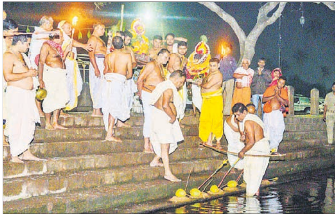
କରନାଥ ବଲ୍ଲଭ ପରିସରରେ ପ୍ରଥମ ବେଶ୍ୱନୀତି ସମ୍ପନ୍ନ କରାଯାଇଛି ।

ବସନ୍ତ ପଞ୍ଚମୀରେ ଗୁରୁବାର ଶ୍ରୀବିଗ୍ରହଙ୍କ ଚାଚେରୀ ବେଶ ଅନୁଷ୍ଠିତ ହୋଇଥିଲା । ମଧ୍ୟାହ୍ନ ଧୂପ, ମଇଲମ ପରେ ଶ୍ରୀବିଗ୍ରହମାନଙ୍କୁ ଚନ୍ଦନ ଲାଗି କରାଯାଇଥିଲା । ଦକ୍ଷିଣାପାର୍ଶ୍ୱରେ ଖଟରେ ଶ୍ରୀଦେବୀ ଓ ଭୃଦେବୀ ଏବଂ ଦୋଳଗୋବିନ୍ଦଙ୍କୁ ବିଜେ କରାଯାଇଥିଲା । ତିନି ଠାକୁର ଚାଚେରୀ ବେଶ ହୋଇଥିଲେ । ଉକ୍ତ ବେଶରେ ତିନିଠାକୁର ପୂଜା ପହରଣ, ଶିରିକପଡ଼ା, ମୁଖବଳା, ଗୋପର, ଚନ୍ଦିକା, ନଳାଭୁଜ, ଆଡ଼କାନୀ, ତିଳକ, ଓଡ଼ିଆଣୀ, ପୂର୍ଯ୍ୟଚନ୍ଦ୍ର, ଘାଘଡ଼ାମାଳା ଲାଗିହୋଇଥିଲେ । ମହାପ୍ରଭୁ ଏବଂ ବଡ଼ଠାକୁର ବୁଦ୍ଧତି ଲେଖାଏ ମକର କୁଞ୍ଜଳ, ଦେବୀ ଭୃଦେବୀ ୨ଟି ଚତୁରା ଲାଗିହୋଇଥିଲେ । ରୋଷପରକୁ ଚାଚେରୀ ଭୋଗ ତାକରା ଯାଇଥିଲା । ଭୋଗ ଛାପୁଆଦିବା ପରେ ଶ୍ରୀଦେବୀ ଓ ଦୋଳଗୋବିନ୍ଦ ଭିତରେ ସିଂହାସନକୁ ବିଜେ କରିଥିଲେ । ପୁଦିରସ୍ତ