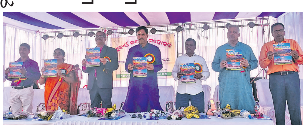
ଉତ୍ତମରେ ଅତିଥିମାନେ ସ୍ମରଣିକା ଉନ୍ମୋଚନ କରୁଛନ୍ତି ।

ବିଦ୍ୟାଳୟ ଏକ ପବିତ୍ର ମଣିଷ ତିଆରି କାରଖାନା, କାରଖାନାକୁ ଚଳାଇଥିବା ଶିଳ୍ପୀମାନେ ହେଲେ ପ୍ରଶିକ୍ଷଣ ବିଦ୍ୟାଳୟର ଶିକ୍ଷୟିତ୍ରୀ, ଶିକ୍ଷକ ଓ ଛାତ୍ରାଛାତ୍ରୀ । ଆଜିର ଦିନରେ ଶିକ୍ଷୟିତ୍ରୀ ଶିକ୍ଷକମାନେ ଠିକ୍ ଭାବେ ପାଠ ପଢ଼ି ବୁଝିଥିଲେ ଛାତ୍ରାଛାତ୍ରୀଙ୍କୁ ଉତ୍ତମ ଶିକ୍ଷା ଦେଇପାରିବେ ବୋଲି ଗଣଶିକ୍ଷା ମନ୍ତ୍ରୀ ସମୀର ରଞ୍ଜନ ଦାଶ ଶୁକ୍ରବାର ନିମାପଡ଼ା ସରକାରୀ ପ୍ରାଥମିକ ଶିକ୍ଷକ ଶିକ୍ଷା ପ୍ରତିଷ୍ଠାନ ସୁବର୍ଣ୍ଣ ଜୟନ୍ତୀ ସମାରୋହରେ ମୁଖ୍ୟ ଅତିଥି ଭାବେ ଯୋଗଦେଇ କହିଛନ୍ତି । ଆମ ଦେଶ, ରାଜ୍ୟ ନୈତିକ ମୂଲ୍ୟବୋଧ ଶିକ୍ଷା ଉପରେ ପର୍ଯ୍ୟବସିତ ବୋଲି ମନ୍ତ୍ରୀ ଦାଶ କହିଛନ୍ତି । ସମାରୋହର ଉଦ୍ଘାଟନ ସମ୍ବନ୍ଧରେ ସମ୍ମାନିତ ଅତିଥି ଶିକ୍ଷକ