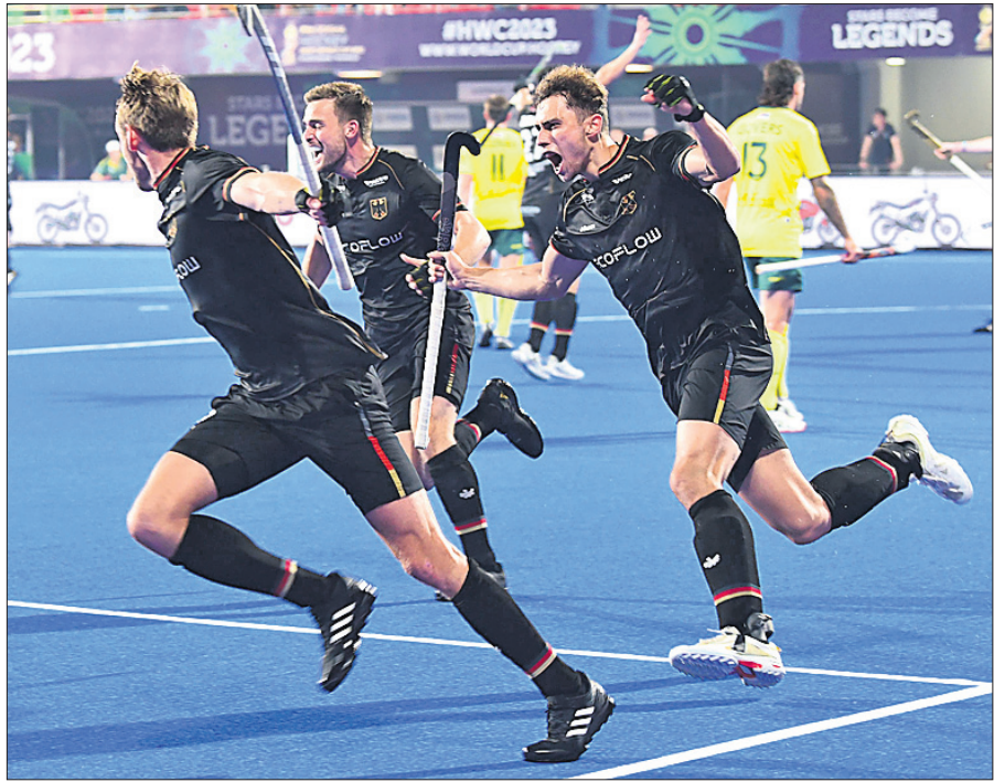
ଅଷ୍ଟ୍ରେଲିଆ ବିପକ୍ଷ ସେମିଫାଇନାଲ ମ୍ୟାଚ ଜିତିବା ପରେ ଖୁସିରେ ଆମ୍ବୁହରା ଜର୍ମାନୀ ଖେଳାଳି।

ବିଶ୍ୱ ନୟନରାଜ୍ୟ ଦଳ ଅଷ୍ଟ୍ରେଲିଆର ବିଶ୍ୱକପ ଚାଉଟଳ ଅଭିଯାନ ସେମିଫାଇନାଲରେ ଶେଷ ହୋଇଛି। ଶୁକ୍ରବାର କଲିକତା ଷ୍ଟାଡିୟମରେ ଅନୁଷ୍ଠିତ ପ୍ରଥମ ସେମିଫାଇନାଲରେ ଜର୍ମାନୀ ୪-୩ ଗୋଲରେ ବିଜୟ ହୋଇ ଅଷ୍ଟ୍ରେଲିଆକୁ ବିଦାୟ ପତ୍ର ଦେଖାଇଛି। ଫଳରେ ୧୯୮୬, ୨୦୧୦ ଓ ୨୦୧୪ରେ ଚାମ୍ପିୟନ ଅଷ୍ଟ୍ରେଲିଆର ଚାଉଟଳ ବିଜୟ ସ୍ୱପ୍ନ ଧୂଳିସାତ ହୋଇଛି। ୨୦୧୮ରେ ଅନୁଷ୍ଠିତ ସଂସ୍କରଣର ଟ୍ରୋଫି ପଦକ ବିଜେତା ଅଷ୍ଟ୍ରେଲିଆ ଏଥର ମଧ୍ୟ ଟ୍ରୋଫି ପଦକ ପାଇଁ ଲଢ଼ିବ। ଅନ୍ୟପକ୍ଷରେ ୨୦୦୨ ଓ ୨୦୦୬ରେ ଚାମ୍ପିୟନ ଏବଂ ୧୯୮୨ ଓ ୨୦୧୦ରେ ରନରଅପ୍ ଜର୍ମାନୀ ଦୀର୍ଘ ୧୩ ବର୍ଷ ବ୍ୟବଧାନରେ ଫାଇନାଲରେ ପ୍ରବେଶ କରିଛି।