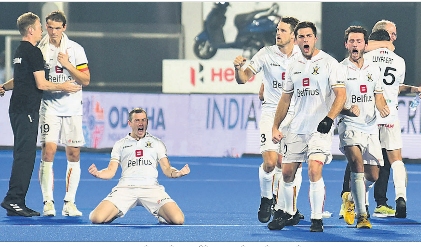
ନେଦରଲାଣ୍ଡ ବିପକ୍ଷ ସେମିଫାଇନାଲ ଜିତିବା ପରେ ଉଲ୍ଲସିତ ବେଲ୍‌ଜିୟମ ଖେଳାଳି।