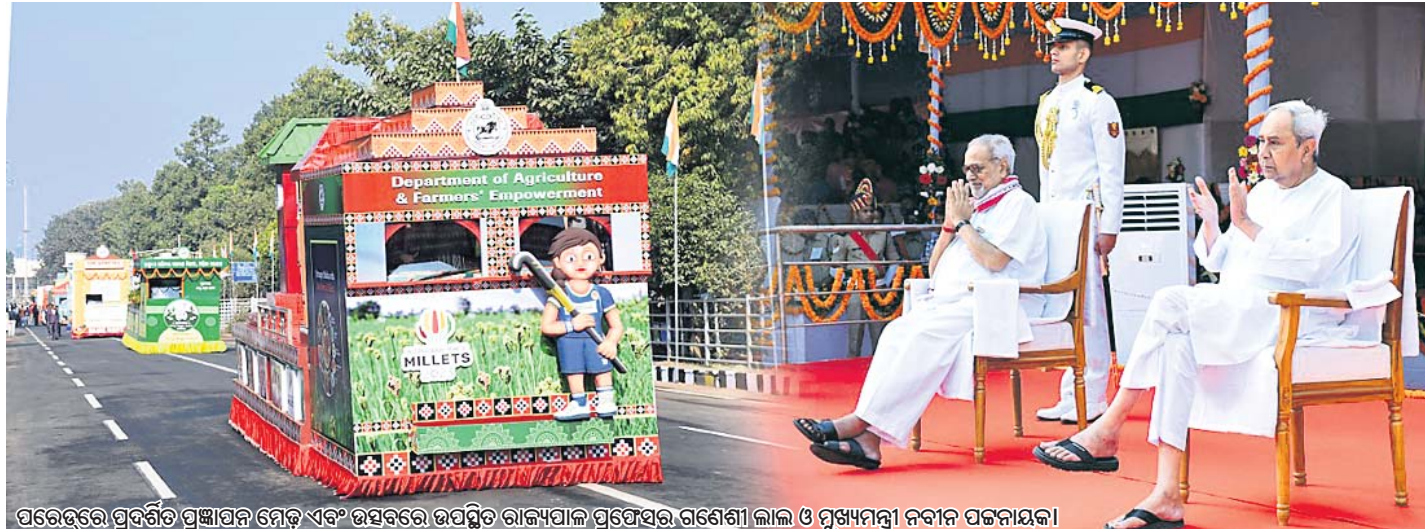
ପରେଡ଼ରେ ପ୍ରଦର୍ଶିତ ପ୍ରଜ୍ଞାପନ ମେଡ଼ ଏବଂ ଉତ୍ସବରେ ଉପସ୍ଥିତ ରାଜ୍ୟପାଳ ପ୍ରଫେସର ଗଣେଶୀ ଲାଲ ଓ ମୁଖ୍ୟମନ୍ତ୍ରୀ ନବୀନ ପଟ୍ଟନାୟକ।