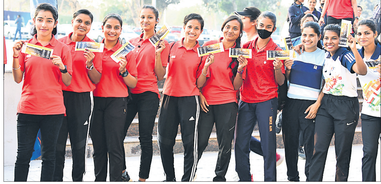
ବିଜେତ ପ୍ରଦର୍ଶନ କରୁଛନ୍ତି ହକିପ୍ରେମୀ।