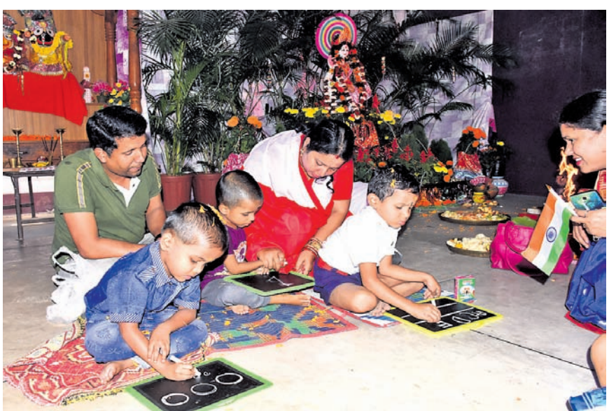
ସ୍ମରଣ - ୩ ସରସ୍ୱତୀ ଶିଶୁ ବିଦ୍ୟାଳୟରେ ସରସ୍ୱତୀ ପୂଜାରେ ଶିକ୍ଷକମାନେ ପିଲାଙ୍କୁ ଖିଟି କୁଟାଇ ବିଦ୍ୟାଳୟର କରୁଛନ୍ତି।