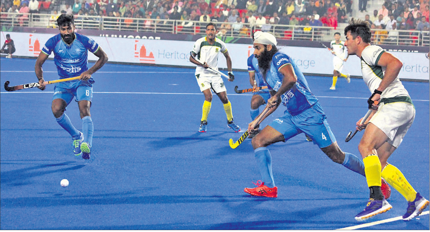
ଭାରତ-ଦକ୍ଷିଣ ଆଫ୍ରିକା ମ୍ୟାଚର ଏକ ସଂଘର୍ଷପୂର୍ଣ୍ଣ ପୂର୍ଣ୍ଣା।