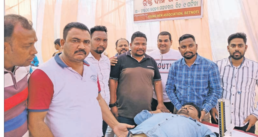
ଓଲ୍‌ଏମ୍‌ଏ ପକ୍ଷରୁ ରକ୍ତଦାନ ଶିବିର।

କି, ସଂସ୍କୃତି ଓ ପରମ୍ପରାରେ ପରିପୁର୍ଣ୍ଣ ମୟୁରଭଞ୍ଜ ଜିଲା। ଏଠାରେ ରହିଛନ୍ତି ଅନେକ ଲୁକ୍ଷାୟିତ ପ୍ରତିଭା; ଯାହାକୁ ଲୋକଲୋଚନକୁ ଆଣିବାକୁ ଅଣ୍ଟା ଭିଡ଼ି ଯଜ୍ଞ ମାସ୍ ଆସୋସିଏସନ(ଓଲ୍‌ଏମ୍‌ଏ)। ଦୀର୍ଘ ୨୮ବର୍ଷ ଧରି ସ୍ଥାନୀୟ ଅଞ୍ଚଳର ଯୁବକମାନଙ୍କୁ ନେଇ ଗଢ଼ି ଉଠିଥିବା ଏହି ସଙ୍ଗଠନ କୁଟି କୁଟି ଶିଶୁ କଳାକାରଠାରୁ ଆରମ୍ଭ କରି ଯୁବ କଳାକାରମାନଙ୍କୁ ଆଗକୁ ବଢ଼ିବାର ସୁବେଶ୍ୟା ବେଳେ ଗଲିଛି। ଆଉ ଜିଲା ତଥା ରାଜ୍ୟରେ ପ୍ରଶଂସା ଲାଭ କରିଛି। ବରିପୁ ଓ ଅସହାୟ