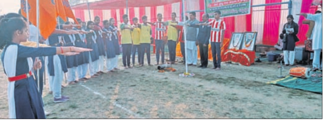
କ୍ରୀଡ଼ା ଉଦ୍ଘାଟନେ ଭାଗ ନେଇଥିବା ସାଥୀ ।