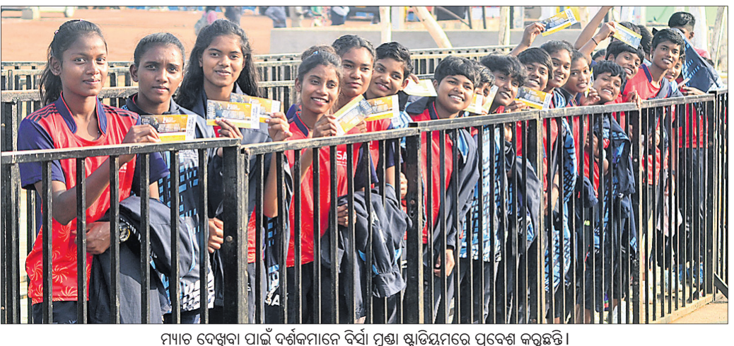
ମ୍ୟାଚ ଦେଖିବା ପାଇଁ ଦର୍ଶକମାନେ ବିଦ୍ୟା ପୁଷ୍ପା ଷ୍ଟାଡ଼ିୟମର ପ୍ରବେଶ କରୁଛନ୍ତି।