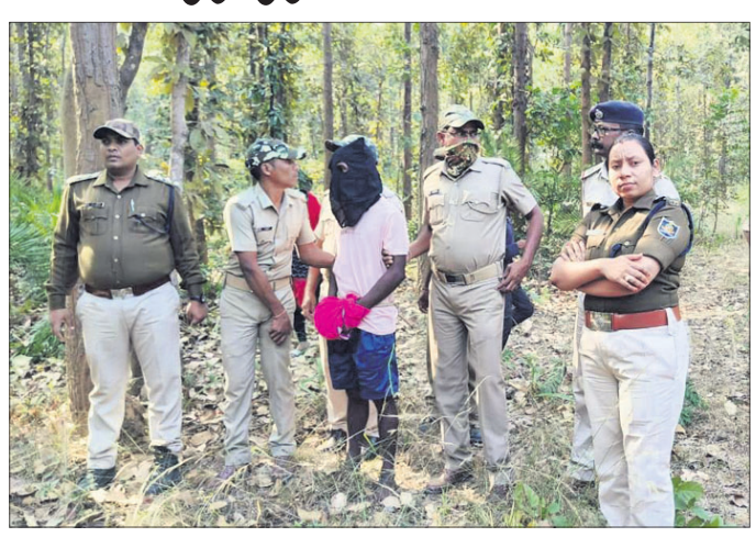
ଅଭିଯୁକ୍ତ ଦେମୋ ଦେଖାଉଛନ୍ତି ।