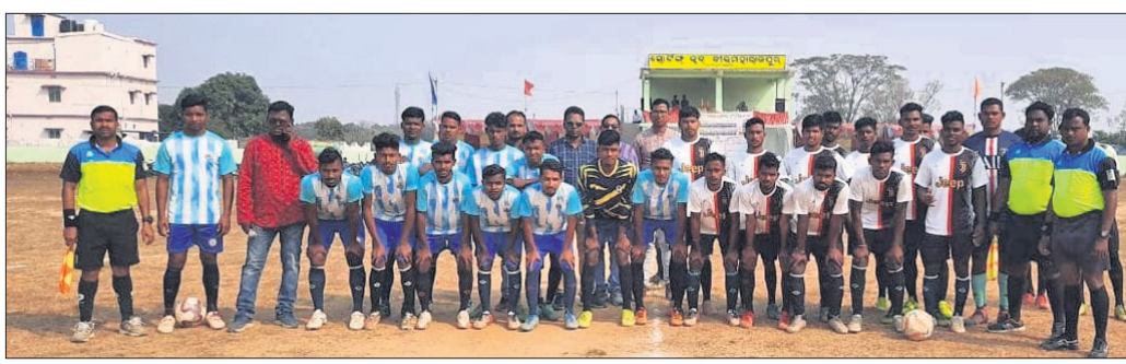
ଉଦ୍‌ଘାଟନୀ ମ୍ୟାଚର ଅତିଥି ଓ ଉଭୟ ଦଳର ଖେଳାଳି ।