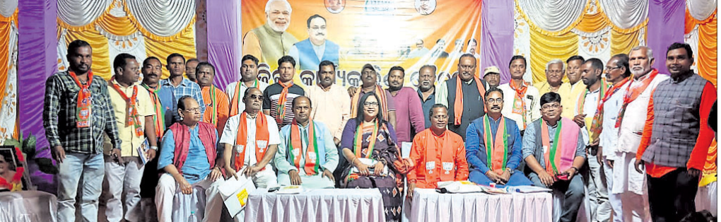
କାର୍ଯ୍ୟକାରୀଣୀ ବୈଠକରେ ମହାସାଧନ ଭାଜପା ନେତୃତ୍ୱ ।