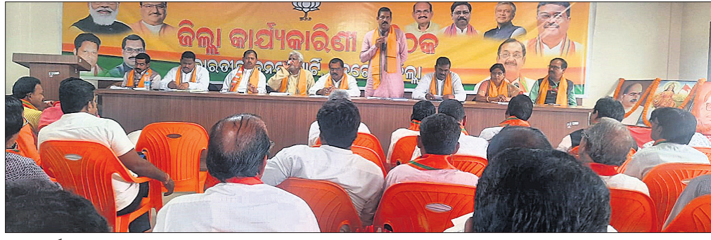
ଜିଲା କାର୍ଯ୍ୟକାରୀତାରେ ମହାସଭା ଉଦ୍ଘାଟନା କରୁଥିବା ଅନୁଗୋଳ ଅଧିକାରୀମାନେ।