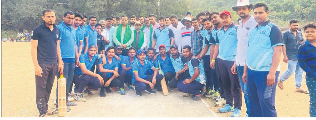
ମା' ମଙ୍ଗଳା କ୍ରିକେଟ କର୍ମର ଫାଇନାଲ ମ୍ୟାଚ ପୂର୍ବରୁ ଅତିଥିଙ୍କ ସହ ଖେଳାଳିମାନେ।