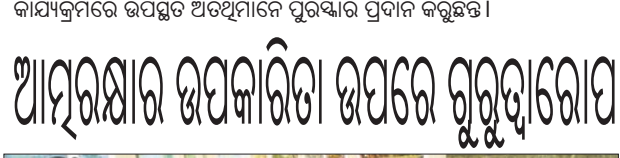
କାର୍ଯ୍ୟକ୍ରମରେ ଉପସ୍ଥିତ ଅତିଥିମାନେ ପୁରସ୍କାର ପ୍ରଦାନ କରୁଛନ୍ତି।

କଟିହାଁ, ୨୮୧ (ଡି.ଏନ.ଏ.) ଖୁଶୀସମ ସାହୁ ପ୍ରମୁଖ ଯୋଗଦାନ କରିଥିଲେ। ପ୍ରତିଯୋଗିତାର କ୍ରୀଡ଼ା ପ୍ରତିଯୋଗୀଙ୍କୁ ପୁରସ୍କାର ଭାବେ ଖେଳ ଉପକରଣ, ଖାଦ୍ୟ ସାମଗ୍ରୀ ସହିତ ଗଭା, ମାଟିଆ, ଆଦି ଘରେ ବ୍ୟବହାର ହେଉଥିବା ସାମଗ୍ରୀ ପ୍ରଦାନ କରାଯାଇଥିଲା।