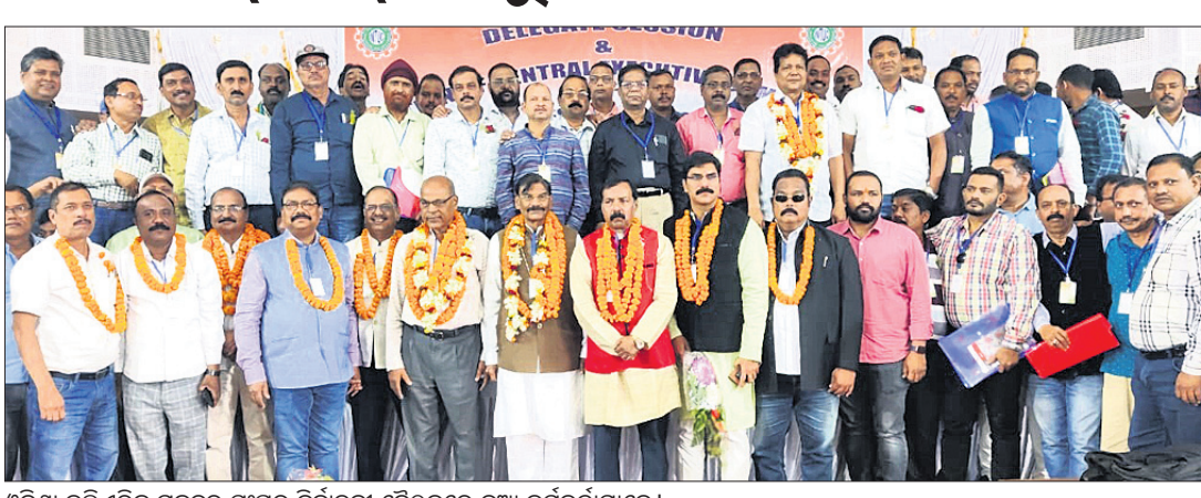
ଓଡ଼ିଶା କଲିଫର୍ଣ୍ଣିକ ମଜଦୁର ସଂଘର ନିର୍ବାଚନୀ ବୈଠକରେ ନୂଆ କର୍ମକର୍ତ୍ତାମାନେ।