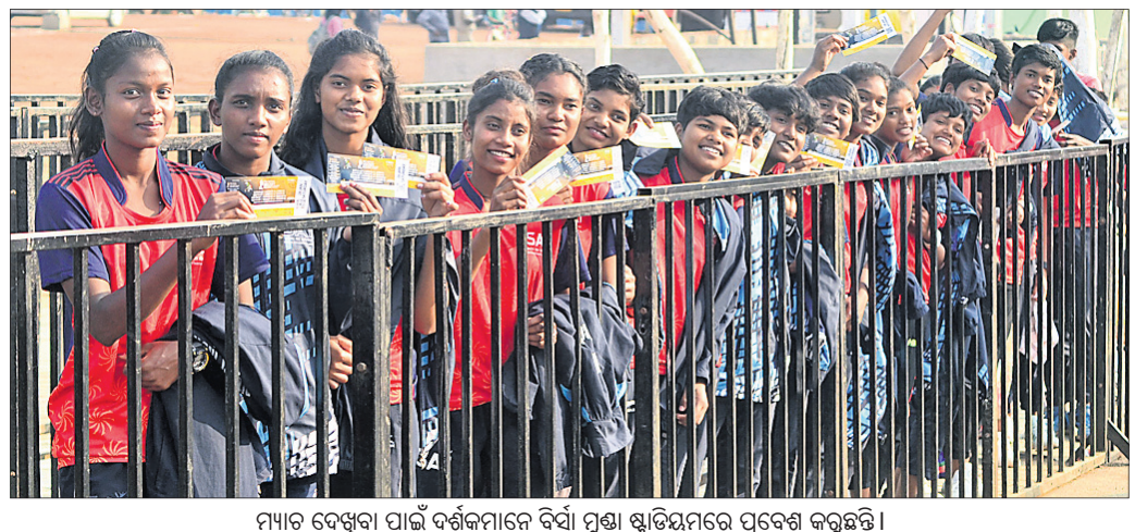
ମ୍ୟାଚ ଦେଖିବା ପାଇଁ ଦର୍ଶକମାନେ ବିଦ୍ୟାପୁଷ୍ପା ଷ୍ଟାଡିୟମରେ ପ୍ରବେଶ କରୁଛନ୍ତି।