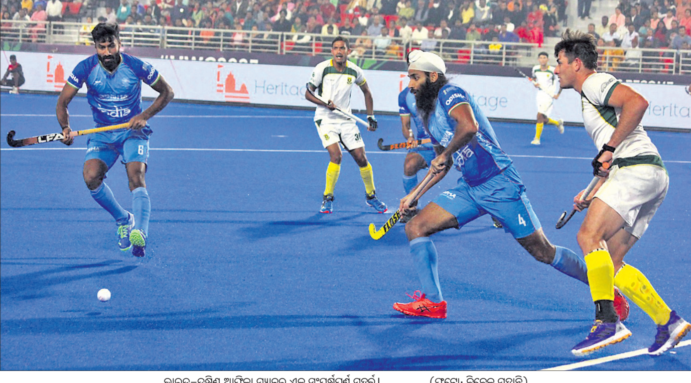
ଭାରତ-ଦକ୍ଷିଣ ଆଫ୍ରିକା ମ୍ୟାଚର ଏକ ସଂଘର୍ଷପୂର୍ଣ୍ଣ ପୂର୍ଣ୍ଣା

ଏହା ପୂର୍ବରୁ ଭଉଁମ ପରିବେଶ ସୁରକ୍ଷା, ସଡକ ସୁରକ୍ଷା ସଚେତନତା ଉପରେ ଅମାର ଶାନ୍ତକ ପି.କେ ବେଶରେ ବିଜିନି ଜନହୃତ ଦିଗରେ ଅବଗତ କରାଇଥିଲେ।