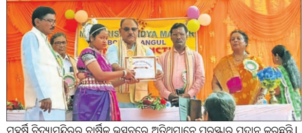
ମହର୍ଷି ବିଦ୍ୟାମନ୍ଦିରର ବାର୍ଷିକ ଉତ୍ସବରେ ଅତିଥିମାନେ ପୁରସ୍କାର ପ୍ରଦାନ କରୁଛନ୍ତି।

ବଲାଙ୍ଗୀ, ୨୮୧ (ଡି.ଏନ.ଏ.) ପ୍ରାଥମିକ ପ୍ରଭୁ ଭଲ ଶିକ୍ଷା ଗ୍ରହଣ କଲେ ଭବିଷ୍ୟତରେ ସଫଳତାର ଖାଣ୍ଡରେ ପହଞ୍ଚିବେ। କିଶୋରନଗର ରୁକ୍ମିଣୀ ଶିକ୍ଷକପଡାରେ ୧୬ ତମ ବାର୍ଷିକ ଉତ୍ସବରେ ଯୋଗଦେଇଥିବା ଅତିଥିମାନେ ଏହି ମତପ୍ରକାଶ କରିଛନ୍ତି।