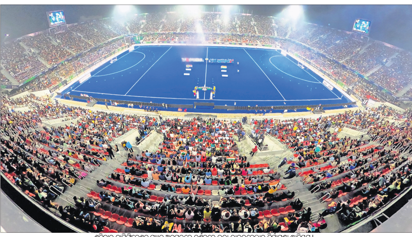
ଶନିବାର କ୍ୱାରିଫିକେଶନ ମ୍ୟାଚ ଅବସରରେ ଦର୍ଶକରେ ଭରା ରାଉରକେଲାର ବିଦ୍ୟାପୁଷ୍ପା ଷ୍ଟାଡିୟମ।

୪-୩ ଗୋଲରେ ଅଷ୍ଟ୍ରେଲିଆକୁ ହରାଇଥିଲା। ସେହିପରି ନେଦରଲାଣ୍ଡ ବିପକ୍ଷ ମ୍ୟାଚକୁ ନିର୍ଦ୍ଧାରିତ ସମୟରେ ୨-୨ ଗୋଲରେ ଡ୍ର ରଖିବାପରେ ବେଲଜିୟମ ଶୁଭୋଫତରେ ୩-୨ ଗୋଲରେ ବିଜୟ ହୋଇଥିଲା।