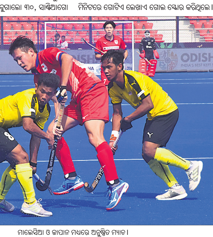
ମାଲେସିଆ ଓ ଜାପାନ ମଧ୍ୟରେ ଅନୁଷ୍ଠିତ ମ୍ୟାଚ।

ରାଉରକେଲା ଅଧିକାଂଶ ଭୁବନେଶ୍ୱର (ଗ୍ରୀଫା ପ୍ରତିବନ୍ଧି), ୨୮୧ ରାଉରକେଲାର ବିଦ୍ୟାପୁଷ୍ପା ଷ୍ଟାଡିୟମରେ ଶନିବାର ଅନୁଷ୍ଠିତ ହକି ବିଶ୍ୱକପର କ୍ୱାରିଫିକେଶନ ମ୍ୟାଚରେ ମାଲେସିଆ, ପ୍ରାନ୍ତ ଓ ଆର୍ଜେଣ୍ଟିନା ବିଜୟ ସହ ଅଭିଯାନ ଶେଷ କରିଛନ୍ତି।