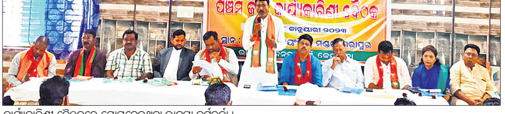
କାର୍ଯ୍ୟକାରୀତା ବୈଠକରେ ଯୋଗଦେଉଥିବା ଭାଙ୍ଗିପା କର୍ମକର୍ତ୍ତା।