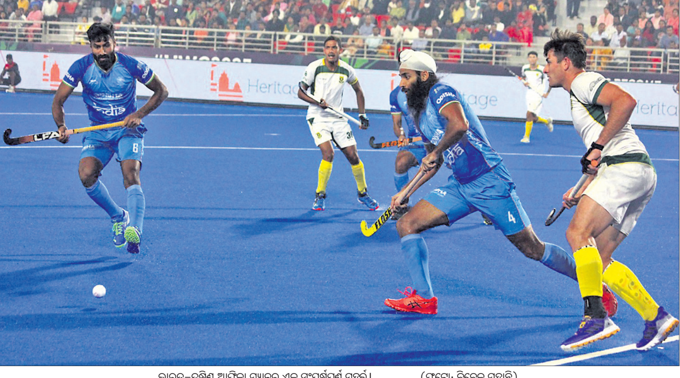
ଭାରତ-ଦକ୍ଷିଣ ଆଫ୍ରିକା ମ୍ୟାଚର ଏକ ସଂଘର୍ଷପୂର୍ଣ୍ଣ ପୂର୍ଣ୍ଣା

ଏହା ପୂର୍ବରୁ ଉତ୍ତମ ପରିବେଶ ସୁରକ୍ଷା, ସତକ ସୁରକ୍ଷା ସଚେତନତା ଉପରେ ଅମାର ଶାନ୍ତକ ପି.କେ ବେଶରେ ବିଭିନ୍ନ ଜନହିତ ଦିଗରେ ଅବଗତ କରାଇଥିଲେ । ଭାରତ ଅଭ୍ୟାସ ମ୍ୟାଚ ଖେଳିଲେ ଦି ଦର୍ଶକ ଭିଡ଼ ହେବେ ରାଉରକେଲା ବିଦ୍ୟାଳୟ ଷ୍ଟାଡିୟମରେ ଶନିବାର ୪ଟି ମ୍ୟାଚ ଖେଳା ଯାଇଥିଲା । ଉତ୍ତମ ସମ୍ପନ୍ନ ଶେଷ ମ୍ୟାଚ ଭାରତ ଦକ୍ଷିଣ ଆଫ୍ରିକା ମଧ୍ୟରେ ଅନୁଷ୍ଠିତ ହୋଇଥିଲା । ଭାରତୀୟ ଦଳ ବିଦ୍ୟାଳୟ ହକି ଷ୍ଟାଡିୟମରେ ଦୁଇଟି ମ୍ୟାଚ ଜିତିଥିବାବେଳେ ଇଂଲଣ୍ଡ ବିପକ୍ଷ ମ୍ୟାଚ ଡ୍ର ରଖିଥିଲା । ବିଦ୍ୟାଳୟ ଷ୍ଟାଡିୟମରେ ଯେଉଁ ଦିନ ଭାରତର ମ୍ୟାଚ ଖେଳା ଯାଇଥିଲା ଉକ୍ତ ଦିନ ଆମର ବ୍ୟବସାୟରେ ଦୁଇଗୁଣା ଲାଭ ହୋଇଥିବା ତିନିଗୁଣା ସୌରଭ ବାଟ ମତ ପ୍ରକାଶ କରିଥିଲେ । ସୌରଭ ଜଣେ ତିନିଗୁଣା ହୋଇଥିବାବେଳେ ସେ ରାଉରକେଲା ବିଦ୍ୟାଳୟ ହକି ଷ୍ଟାଡିୟମର ୫ ଓ ୬ ନମ୍ବର ଗେଟରେ ରହି ବିଭିନ୍ନ ଦର୍ଶକଙ୍କ ଗାଲରେ ତ୍ରିରଙ୍ଗା ଚିତ୍ର ଆଙ୍କୁଥିଲେ । ଏଥିସହ ବିଶ୍ୱକପ ସମ୍ପନ୍ନାୟ ବିଭିନ୍ନ ତଥ୍ୟର ଚିତ୍ର ଷ୍ଟାଡିୟମକୁ ଆସୁଥିବା ଅନେକ ଦର୍ଶକଙ୍କ ଶରୀରରେ ଚିତ୍ରଣ କରି ଭାରତୀୟ ଦଳକୁ ଉତ୍ସାହିତ କରୁଥିଲେ । ଏନେଇ ସୌରଭଙ୍କୁ ପଚାରିବାରୁ ସେ କହିଥିଲେ, ଯଦି ଏଫଆଇଏଚ୍‌ଏ ହକି ଇଣ୍ଡିଆ ଭାରତର କୌଣସି ଅଭ୍ୟାସ ମ୍ୟାଚ ବିଦ୍ୟାଳୟ ଷ୍ଟାଡିୟମରେ ଆୟୋଜନ କରେ ତେବେ ଜିଲ୍ଲାରେ ହକିର ଏତେ କ୍ରେକ ଅଛି ଯେ ନିଶ୍ଚିତ ଷ୍ଟାଡିୟମ ଆଖିପାଖରେ ବ୍ୟବସାୟ କରୁଥିବା ବହୁ ବ୍ୟବସାୟୀ ଲାଭବାନ ହେବ । - ବିପାକ: ଦୀନେଶ ମିଶ୍ର