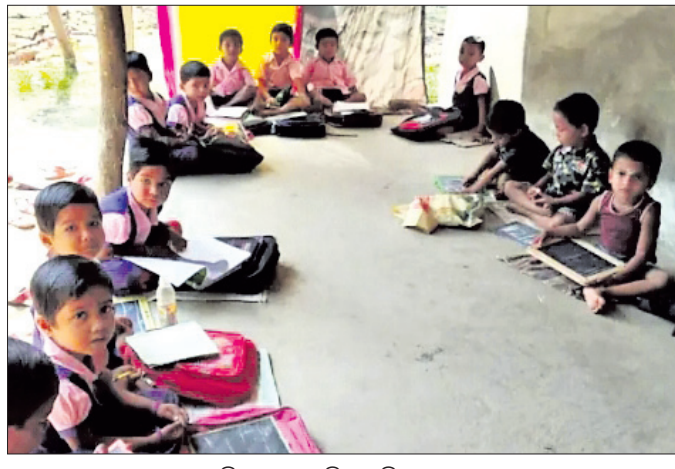
ପଟ୍ଟାମୁଣ୍ଡାରେ ଏକ ଅଜ୍ଞାନତା କେନ୍ଦ୍ର ଆସିଥିବା ପିଲାମାନେ।

ପଟ୍ଟାମୁଣ୍ଡା ଶିଶୁ ଓ ମହିଳାଙ୍କ ବିକାଶ ପାଇଁ ସମନ୍ୱିତ ଶିଶୁ ବିକାଶ ଯୋଜନା କାର୍ଯ୍ୟକାରୀ ହେଉଛି। ଯୋଜନାକୁ କାର୍ଯ୍ୟକାରୀ କରିବା ପାଇଁ ପ୍ରତି ଗାଁରେ ଅଜ୍ଞାନତା କେନ୍ଦ୍ର ଖୋଲା ଯାଇଥିବା ବେଳେ ଜଣେ ଅଜ୍ଞାନତା କର୍ମୀ ଓ ଜଣେ ସହାୟକାଳୁ ନିଯୁକ୍ତି ଦିଆଯାଇଛି। ଏଥିସହ କୁଳସ୍ତରରେ ଜଣେ ଲେଖାଏ ବିଦିପିଓ (ଶିଶୁ ବିକାଶ ପ୍ରକଳ୍ପ ଅଧିକାରୀ)କୁ ନିଯୁକ୍ତି ଦିଆଯାଇଛି। ତେବେ ପଟ୍ଟାମୁଣ୍ଡା ବ୍ଲକ ଅଞ୍ଚଳରେ ଏହି ଯୋଜନାରେ ଅନୁଷ୍ଠିତ ହେଉଥିବା ପରିଲକ୍ଷିତ ହେଉଛି। କେତେକ ଘାନରେ ଅଜ୍ଞାନତା କର୍ମୀ ନ ଥିବାରୁ ପିଲାମାନେ ଘାଣ୍ଟା ଗୋଷ୍ଠୀରେ ବସି ପଢୁଛନ୍ତି। କେତେଗୋଟି କେନ୍ଦ୍ର ପିଲାଙ୍କ ପାଇଁ ଆସୁଥିବା ପୁସ୍ତକର ଖାଦ୍ୟ ହ୍ରାସ କରାଯାଉଥିବା ଭଳି ଅଭିଯୋଗ ମଧ୍ୟ ହେଉଛି। ପଟ୍ଟାମୁଣ୍ଡା ପୌରାଞ୍ଚଳ ୨୦ଟି ଖଣ୍ଡ ଓ ବ୍ଲକ ଅଧୀନରେ ଥିବା ୩୧ ପଞ୍ଚାୟତରେ ମୋଟ ୨୨୮ ଅଜ୍ଞାନତା