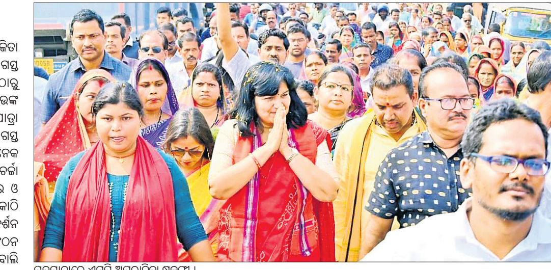
ପଦଯାତ୍ରାରେ ଏମ୍ପି ଅପରାଜିତା ଷଡ଼ଙ୍ଗା।

ଭୁବନେଶ୍ୱର ଏମ୍ପି ଅପରାଜିତା ଷଡ଼ଙ୍ଗା ଶନିବାର କେନ୍ଦ୍ରାପଡ଼ା ଜିଲ୍ଲା ଗସ୍ତ କରିଥିଲେ। ସହରର ତିନିମୁହାଣୀଠାରୁ ଲକ୍ଷ୍ମୀପୁରସ୍ଥିତ ଶ୍ରୀବଳଦେବୀଉଚ୍ଚ ମନ୍ଦିର ପର୍ଯ୍ୟନ୍ତ ସେ ପଦଯାତ୍ରା କରିଥିଲେ। ତାଙ୍କର ଏହି ଗସ୍ତ କାର୍ଯ୍ୟକ୍ରମରେ ଜିଲ୍ଲା ଭାଙ୍ଗିପାର ଅନେକ ନେତାଙ୍କ ଅନୁପସ୍ଥିତିକୁ ନେଇ ଚର୍ଚ୍ଚା ଆରମ୍ଭ ହୋଇଛି। ତେବେ ସହର ଓ ଆଖପାଖ ଅଞ୍ଚଳର କର୍ମକର୍ତ୍ତାଙ୍କୁ ଏକାଠି କରି ଅପରାଜିତା ନିଜର ଶକ୍ତି ପ୍ରଦର୍ଶନ କରିଛନ୍ତି। ଏବେ ଜିଲ୍ଲା ଭାଙ୍ଗିପାର ଅନେକ ନେତାଙ୍କୁ ଆଡ଼କୁ ଯାଉଛି ବୋଲି ଆଲୋଚନା ଆରମ୍ଭ ହୋଇଯାଇଛି।