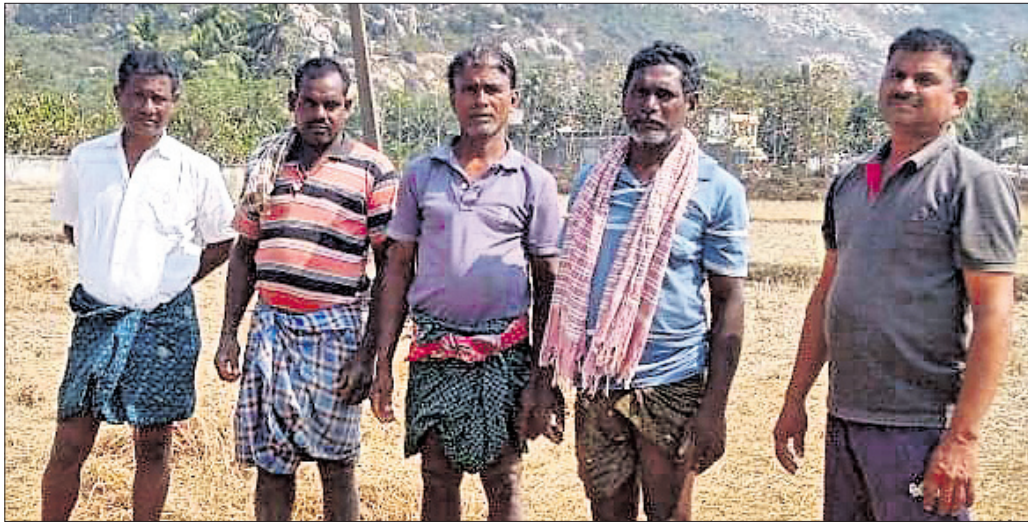
ବାରୁହା ଉପଦ୍ରବରେ ଅମଳ ଧାନ ନଷ୍ଟ ହୋଇଥିବା ଚାଷୀମାନେ ଚିନ୍ତାରେ।

ଗଞ୍ଜାମ ଜିଲ୍ଲା କୋଦଳା ଏନ୍‌ଏସିରେ ତେଜୁଛି ରାଜନୈତିକ ବିବାଦ ହୋଇଥିଲା। ଏଥିରେ ବିବାଦକୁ ନେଇ ପୂର୍ବ ବୈଠକ ବନ୍ଦ ହୋଇଯାଇଥିବା ବେଳେ ଶନିବାର ପୁଣିଥରେ ବୈଠକରେ ରାଜନୈତିକ ବିବାଦ ଉପୁଜିଛି। ଉକ୍ତ ଏନ୍‌ଏସିରେ ଭାଜପାର ଅଧକ୍ଷକ ସମେତ ୮ କାଉନସିଲର ନିର୍ବାଚିତ ହୋଇଥିବା ବେଳେ ବିଜେଡିର ୪ ଓ ଜଣେ ସ୍ୱାଧୀନ ଭାବେ ନିର୍ବାଚିତ ହୋଇଥିଲେ। ତେବେ ଉକ୍ତ ନିର୍ବାଚନ ପରଠାରୁ ଜଣେ ବିଧାୟକଙ୍କ ଇଚ୍ଚିତରେ ପ୍ରଶାସନ କାର୍ଯ୍ୟ କରୁଥିବା ଅଭିଯୋଗ କରିଛନ୍ତି ଭାଜପାର ଅଧକ୍ଷ ଓ କାଉନସିଲରମାନେ। ପୂର୍ବ ନିର୍ଦ୍ଧାରିତ ଅନୁସାରେ ବୈଠକ ପାଇଁ ସ୍ଥିର ହୋଇଥିଲା। ଏଥିରେ ବିଧାୟକଙ୍କୁ ଅତିଥି ଭାବେ ଡକାଯାଇଥିବା ବେଳେ ଅଧକ୍ଷ, ଉପାଧକ୍ଷ,