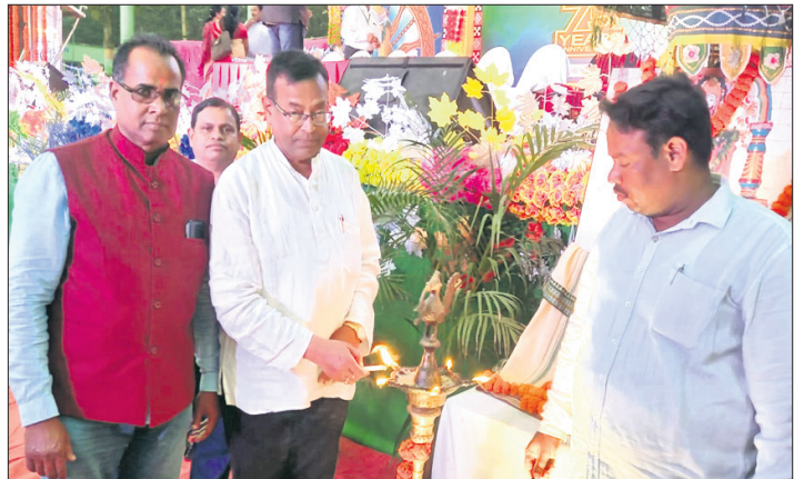
ବିଧାନସଭା ସତ୍ୟନାରାୟଣ ପ୍ରଧାନ ପ୍ଲାଟିନମ୍ ଜୁବିଲି ଉତ୍ସବକୁ ଉଦ୍‌ଘାଟନ କରୁଛନ୍ତି।

ନାରାୟଣ ଉଚ୍ଚ ବିଦ୍ୟାଳୟର ପ୍ଲାଟିନମ୍ ଜୁବିଲି ବିଦ୍ୟାଳୟ ପ୍ରାଙ୍ଗଣରେ ଶିଳିକାର ଉଦ୍‌ଘାଟିତ ହୋଇଯାଇଛି। ଏହି ଉତ୍ସବରେ ରଣପୁର ବିଧାନସଭା ତଥା ଜିଲ୍ଲା ଯୋଜନା ବୋର୍ଡ ଅଧ୍ୟକ୍ଷ ସତ୍ୟନାରାୟଣ ପ୍ରଧାନ ପୁଣ୍ୟଅତିଥି ରୂପେ ଯୋଗ ଦେଇ ଏହି ଉତ୍ସବକୁ ଉଦ୍‌ଘାଟନ କରିଥିଲେ।