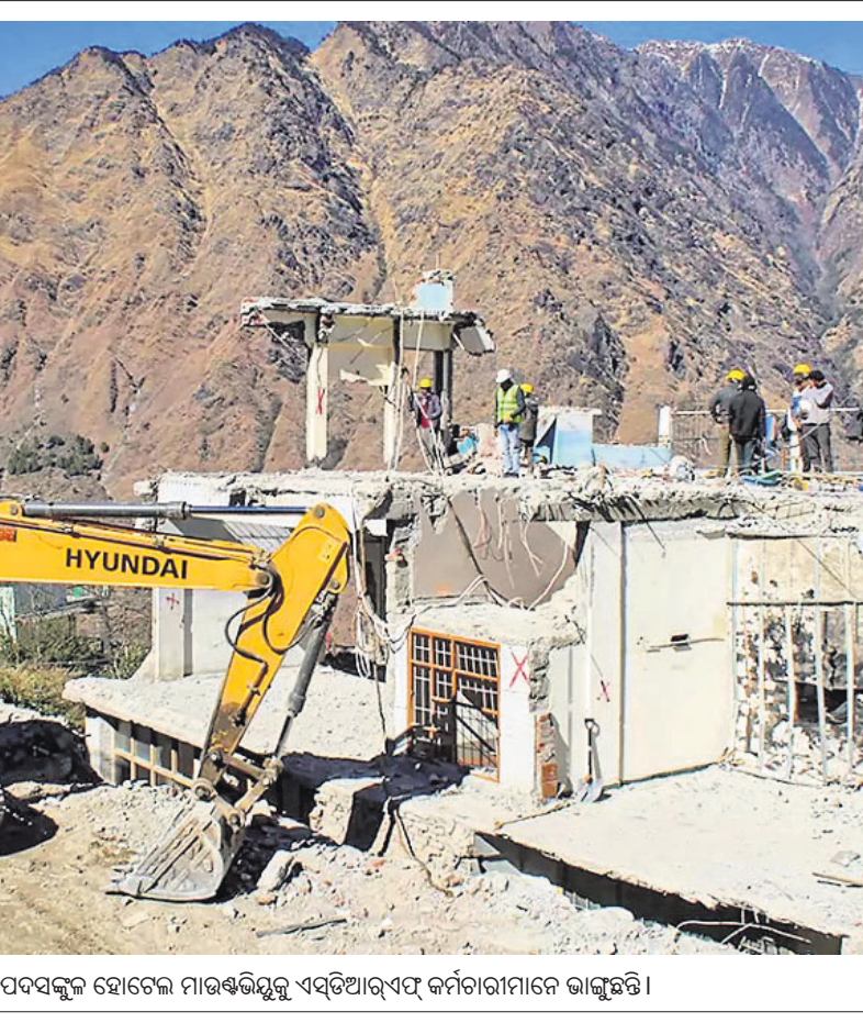
କୋଷୀମଠା ସହରରେ ବିପଦସଙ୍କୁଳ ହୋଇଥିବା ମାଉସିଭିଲ୍‌ସ୍ଟୁ ଏକ୍ସ୍‌ପ୍ରେସ୍ କର୍ମଚାରୀମାନେ ଭାଙ୍ଗିଛନ୍ତି।

ପାର୍ଲିମେଣ୍ଟରେ ପିଟିଶନ ଦାଖଲ କରି ନାଗରିକଙ୍କୁ କ୍ଷମତା ମିଳିବା ଆବଶ୍ୟକ। ଏଥିପାଇଁ ଉପଯୁକ୍ତ ବ୍ୟବସ୍ଥା ସୃଷ୍ଟି କରିବା ନିମନ୍ତେ କେନ୍ଦ୍ର ସରକାର ଓ ଅନ୍ୟ ପକ୍ଷମାନଙ୍କୁ ନିର୍ଦ୍ଦେଶ ଦେବା ଲାଗି ସୁପ୍ରିମକୋର୍ଟରେ ଆବେଦନ କରାଯାଇଛି। ଶୁକ୍ରବାର କର୍ଣ୍ଣାଟକ କେ.ଏମ୍.ଜେ.ଏସ୍.ଏ.ଏ. ବି.ଭି. ନାଗରଘାଟ୍ ଖଣ୍ଡପାଠରେ ଏହାର ଶୁଣାଣି ହୋଇଥିଲା। ଆବେଦନର ଏକ କପି ସରକାରଙ୍କ ଓଲଟେରେ ପ୍ରଦାନ କରିବା ଲାଗି ଖଣ୍ଡପାଠ ଆବେଦନକାରୀ କରନ ଗର୍ଭଙ୍କୁ ନିର୍ଦ୍ଦେଶ ଦେବା ସହ ପରବର୍ତ୍ତୀ ଶୁଣାଣି ଫେସ୍‌ଡାଉରାକୁ ଧାର୍ଯ୍ୟ କରିଛନ୍ତି। ପାର୍ଲିମେଣ୍ଟରେ ବିଭିନ୍ନ ପ୍ରସଙ୍ଗ ଉପରେ ବିତର୍କ, ଆଲୋଚନା ନିମନ୍ତେ ଜନସାଧାରଣ ସିଧାସଳଖ ପାର୍ଲିମେଣ୍ଟରେ ଆବେଦନ କରିବା ପାଇଁ ସମ୍ବିଧାନ ଅନୁଚ୍ଛେଦ ୧୪, ୧୯(୧)(ଏ) ଏବଂ ୨୧ରେ ଏହାକୁ ନୌକିକ ଅଧିକାର ଘୋଷଣା କରିବାକୁ ପିଟିଶନରେ ନିର୍ଦ୍ଦେଶ କରାଯାଇଛି।