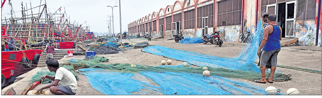
ମାଛଧରା ବନ୍ଦ ପରିସରରେ ମହାଜଳାବାମାନେ ଜାଳ ସଂରକ୍ଷଣ।