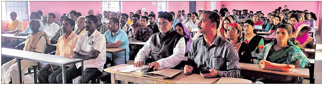
କର୍ଷିଲୋ ନାମନାଥ ମହାବିଦ୍ୟାଳୟରେ ଅନୁଷ୍ଠିତ ସମ୍ମିଳନୀରେ ଯୋଗଦେଇଥିବା ଅଭିଭାବକ ।