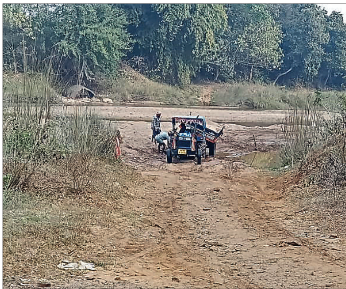
ଦୁର୍ଭରା ବାଲିଘାଟ ।

ନୟାଗଡ଼ ତହସିଲ ମହିପୁର ଆରମ୍ଭ ଆଦି ଅତିଥି ଅନ୍ତର୍ଗତ ଡାହାଣ ନଦୀର ଦୁର୍ଭରା ଓ ତିମିରିଝରି ବାଲିଘାଟ ବେଆଇନ ଭାବେ ଚାଲୁ ରହିଛି । ଏହି ଦୁଇ ବାଲିଘାଟକୁ ନିଲାମ କରାଯାଉନି । ତେବେ ବାଲି ଚୋରମାନେ ସରକାରୀ ବାବୁକୁ ଧରାଧରା କରି ବେଆଇନ ଭାବେ ବାଲିଘାଟକୁ ଚଳାଇ ଆସୁଥିବା ଅଭିଯୋଗ ହୋଇଆସୁଛି । ପ୍ରଶାସନିକସ୍ତରରେ ଏହାକୁ ସରକାର ନ ଯିବାକୁ ସରକାର ରାଜସ୍ୱ ହରାଇଥିବାବେଳେ ମାଳବନ୍ଧ ଦୁର୍ଭରା ହୋଇ ଚାଲିଛି । ବେଆଇନ ଖଣି ଖନନ ଓ ବାଲି ଚୋରିକୁ ସହଯୋଗ କରି ଓଡ଼ିଶା, ଖଣ୍ଡପଡ଼ା, ଭାପୁର ଓ ରଣପୁର ତହସିଲଦାରଙ୍କ ବଦଳି ଏବଂ କୋମଣ୍ଡ ଆରମ୍ଭକାର ନିଲମ୍ବନ ପରେ ନୂଆଗାଁ ତହସିଲଦାର ପଦବେସଦ ନ ନେବା ସାଧାରଣରେ ଅପରାଧ ସୃଷ୍ଟି କରିଛି । ଜିଲାପାଳ ଏହି ଦୁଇ ବେଆଇନ ବାଲିଘାଟ ଉପରେ ନଜର ଦେବାକୁ ଦାବି ହେଉଛି । ଦୁର୍ଭରା ଓ ତିମିରିଝରିବାଲିଘାଟକୁ ବାଲି ମହିପୁର ଓ ଆଖପାଖ ଅଞ୍ଚଳକୁ ଚାଲାଇ