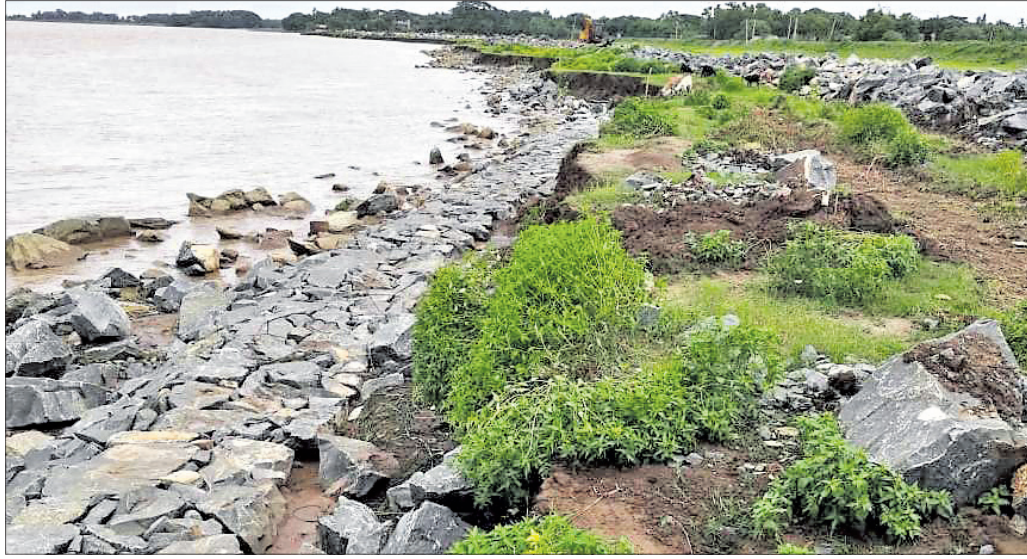
ଲୁଗାନଦୀର ପଥରପ୍ୟାକିଂ ଖସିଛି ।

କେନ୍ଦ୍ରାପଡ଼ା ଜିଲା ଆଜି ରୁକ୍ ଅଞ୍ଚଳର ଗୋବିନ୍ଦପୁର, ଡିମିରିପାଳ, ପେଟପଡ଼ା, ସଂସିଆ, ଏରତଙ୍ଗ, ଦେସାହି, ପାଳମା, କେରୁଆପାଳ ଆଦି ୧୦ ପଞ୍ଚାୟତକୁ କାଶୀ, ଖରସ୍ରୋତା, ବ୍ରାହ୍ମଣୀ ନଦୀ ଘେରି ରହିଛି । ବାଲକାଟି, କୋଳଡିହ ଓ ମହୁ ଗ୍ରାମକୁ ଖରସ୍ରୋତା ଚିଲି ଚାଲିଛି । ବୃନ୍ଦବନ୍ଧଠାରୁ ସାନଆଙ୍କୋ, ପତ୍ରପୁରଠାରୁ ଗୋପାଳପୁର, ଗୁଙ୍ଗାଠାରୁ ବଜଲଯୋଡ଼ି ନଦୀବନ୍ଧ ପଥରପ୍ୟାକିଂ ହୋଇଥିଲେ ମଧ୍ୟ ଶୋଚନୀୟ ଅବସ୍ଥାରେ ଅଛି । କେବଳ ଆଜି ରୁକ୍ ଅଞ୍ଚଳରେ ଏହି ନଦୀବନ୍ଧ ସମସ୍ୟା ଦେଖାଯାଇନାହିଁ । ଜିଲାର ୭ ନଦୀ ଓ ୨୭ ଶାଖା କେନାଲ ବନ୍ଧର ଦୁର୍ବଳତା ଗୁଣାୟ ଗ୍ରାମବାସୀଙ୍କୁ ଆତଙ୍କିତ କରିଥିବା ବେଳେ ତାହା ନଷ୍ଟ କରୁଛି । ନଦୀତଟରେ ପ୍ରତିବର୍ଷ ବନ୍ୟାକଳ ଆସି ଜିଲାର ଉପତଟ ଅଞ୍ଚଳରେ ଥିବା ୫୫ଟି ପଞ୍ଚାୟତବାସୀଙ୍କ ଜୀବନଯାତ୍ରାରେ ବାଧା ସୃଷ୍ଟି କରୁଛି । ପ୍ରଶାସନ ପକ୍ଷରୁ ଏହି ନଦୀବନ୍ଧକୁ