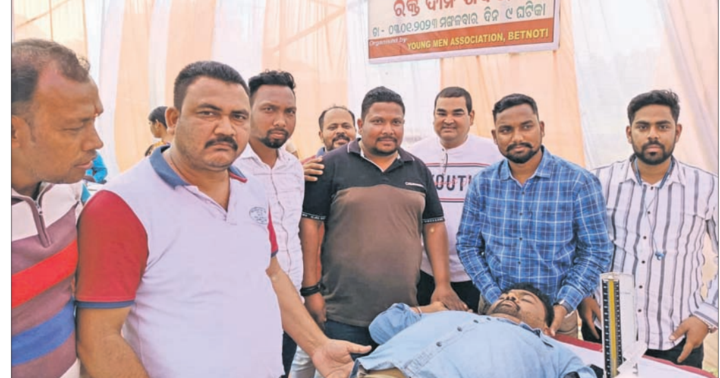
ଓଲ୍‌ଏମ୍‌ଏସ୍ ପକ୍ଷରୁ ରକ୍ତଦାନ ଶିବିର।

ଲୋକଙ୍କୁ ସହାୟତାର ହାତ ବଢ଼ାଇ ଗାଳିଥିବା ବେଳେ ରକ୍ତଦାନ ଭଳି ମହତ୍ତ୍ୱ ଦାନ କାର୍ଯ୍ୟକ୍ରମକୁ ବଜାୟ ରଖୁଛି। ଜିଲ୍ଲାର ବେତନଟା ବ୍ଲକ୍ ମୁଖ୍ୟାଳୟରେ ଥିବା ଓଲ୍‌ଏମ୍‌ଏସ୍ ସଙ୍ଗଠନ ୧୯୯୩ ଡିସେମ୍ବର ୩୧ରେ ୨୫ଜଣ ସଦସ୍ୟଙ୍କୁ ନେଇ ଆରମ୍ଭ କରାଯାଇଥିଲା, ଯାହାର ବର୍ତ୍ତମାନ ସଦସ୍ୟ ସଂଖ୍ୟା ୫୦୦। ସେବେଠୁ ସଂଗଠନ ପକ୍ଷରୁ ବୃକ୍ଷରୋପଣଠାରୁ ଆରମ୍ଭ କରି ସ୍ୱଚ୍ଛତା, ମାଗଣା ସ୍ୱାସ୍ଥ୍ୟ ପରୀକ୍ଷା, ଶିକ୍ଷା ବ୍ୟବସ୍ଥା ଓ ଜଳସାମ୍ପଦ ଭଳି ବିଭିନ୍ନ କାର୍ଯ୍ୟକ୍ରମ କରିଆସି ଅଞ୍ଚଳବାସୀଙ୍କ ସହାୟତା ଭଳି କାର୍ଯ୍ୟକ୍ରମ କରାଯାଇଆସୁଛି। ବର୍ଷ ଶେଷରେ ଅର୍ଥାତ୍