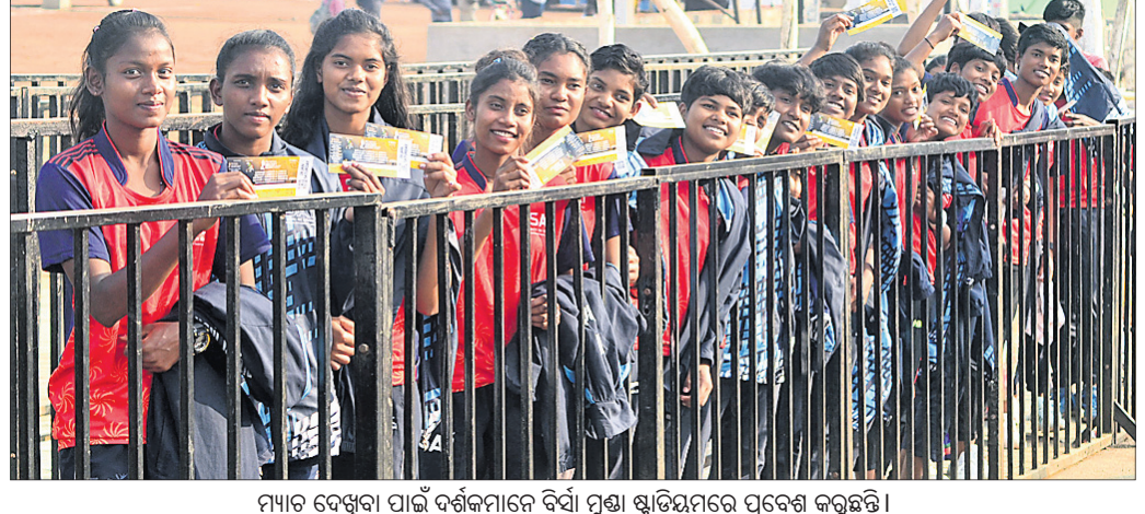
ମ୍ୟାଚ ଦେଖିବା ପାଇଁ ଦର୍ଶକମାନେ ବିଦ୍ୟାଳୟ ଷ୍ଟାଡିୟମର ପ୍ରବେଶ କରୁଛନ୍ତି ।