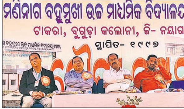
ରୌପ୍ୟ ଜୟନ୍ତୀ ଉତ୍ସବରେ ମହାସଭା ଅତିଥି।

ଦଶପଲ୍ଲୀ, ୨୮.୧ (ଡି.ଏନ୍.ଏ.) ପୁଣ୍ୟଅତିଥି ଭାବେ ଉପ କିଲ୍ପାପାଳ ଦଶପଲ୍ଲୀ କୁଳର ବୁଦ୍ଧିଜୀବୀ କଲୋନୀଠାରେ ଆଜକ୍ରମେ ୫୫ ବର୍ଷ ତଳେ ଉଚ୍ଚଶିକ୍ଷାକୁ ବହୁତ ଆଦିବାସୀ ଛାତ୍ରଛାତ୍ରୀମାନଙ୍କ ଉଚ୍ଚଶିକ୍ଷା ନିମନ୍ତେ ମଣିମାଗ ବହୁମୁଖୀ ଉଚ୍ଚ ମାଧ୍ୟମିକ ବିଦ୍ୟାଳୟ ପ୍ରତିଷ୍ଠା ହୋଇଥିଲା।