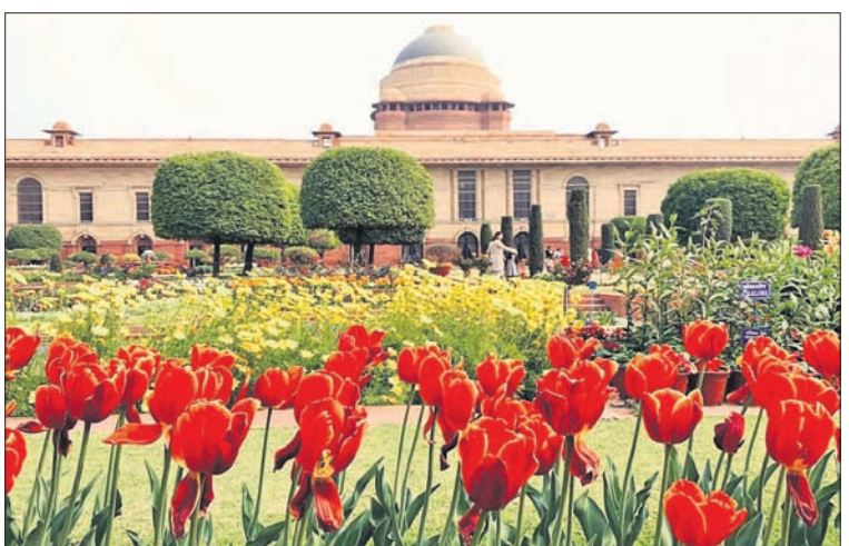
ମାର୍ଚ୍ଚ ପର୍ଯ୍ୟନ୍ତ ସର୍ବସାଧାରଣକ ଦର୍ଶନ ନିମନ୍ତେ ଅଗଷ୍ଟରୁ ମାର୍ଚ୍ଚ ଖୋଲା ରହିବ ବୋଲି ରାଷ୍ଟ୍ରପତି ଖୋଲା ରହିଥିଲା। ଏବେ ଅମୃତ ଉଦ୍ୟାନ ଭବନ ଡ୍ରେସିଂସାଲରୁରେ କୁହାଯାଇଛି।