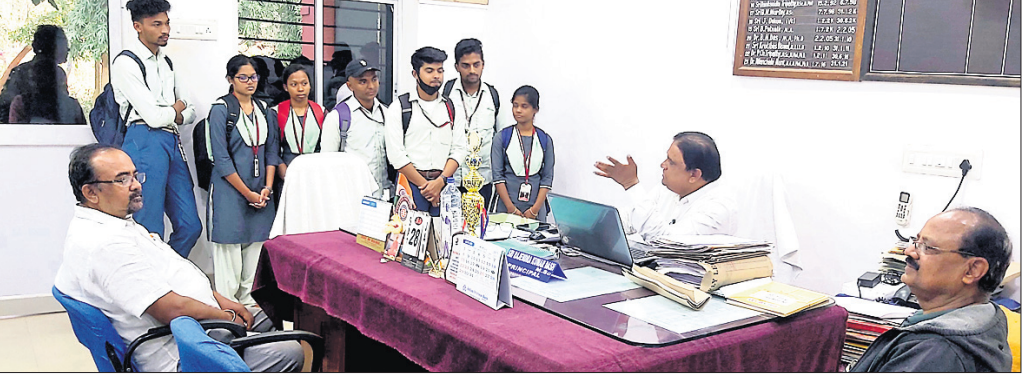
ଛାତ୍ରଛାତ୍ରୀମାନେ ଅଧକ୍ଷଙ୍କୁ ସମସ୍ୟା ଅବଗତ କରାଇଛନ୍ତି।

ଦୃଷ୍ଟିଦେଇ ଆବଶ୍ୟକ ପଦକ୍ଷେପ ନେବା ପାଇଁ ଛାତ୍ରଛାତ୍ରୀମାନେ ଦାବି କରିଛନ୍ତି। ସେହିଭଳି ବାଣିଜ୍ୟ ଏବଂ କଳା ବିଭାଗ ଛାତ୍ରଛାତ୍ରୀମାନେ ମଧ୍ୟ ମିଳିଥିବା ମାର୍କକୁ ନେଇ ଅସନ୍ତୋଷ ବ୍ୟକ୍ତ କରିଛନ୍ତି। ବାଣିଜ୍ୟ କୋର ପେପରରେ ଅଧିକାଂଶ ଛାତ୍ରଛାତ୍ରୀଙ୍କ ବ୍ୟାକ୍ ଅଛି। କଳାର ଅଧିକାଂଶ ଛାତ୍ରଛାତ୍ରୀଙ୍କ କମ୍ ମାର୍କ ଦେଖି ଲାଗି ପେପରରେ ବ୍ୟାକ୍ ଅଛି। ଚଳିତବର୍ଷର ତୃତୀୟ ସେମିଷ୍ଟର ପରୀକ୍ଷା ପାଇଁ ଫର୍ମ ପୂରଣ ବାଲିଛି। ଏହାପୂର୍ବରୁ