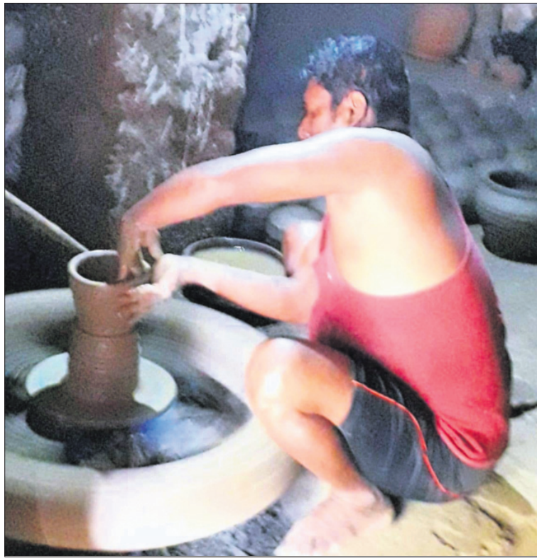
କୁସାରକ କଳାକୃତି ଆଦି ବି ଆକର୍ଷଣୀୟ।

ପୂର୍ବରୁ ଆମେ ନାନାଦି ବିଶ୍ୱବିଦ୍ୟାଳୟର କୁଳପତି ପଦ ମଞ୍ଜନ କରିବା ପ୍ରସଙ୍ଗ ସୂଚନା ଦେଇଥିଲୁ। ଏହି ବିଶ୍ୱବିଦ୍ୟାଳୟ ବିହାରର ପାଟନାଠାରୁ ୯୫ କି.ମି. ଦୂରରେ ବୃତ୍ତୀୟ ଶତାବ୍ଦୀରେ ମନୁ ଶାସନ ସମୟରେ ପ୍ରତିଷ୍ଠା ହୋଇଥିଲା ବୋଲି କେତେକ ମତ ଦେଇଛନ୍ତି। ଅନ୍ୟମତରେ ହିନ୍ଦୁ ସମାଜର ଗୁପ୍ତ ଆରମ୍ଭ କରିଥିଲେ ମତ ଦେଇଛନ୍ତି। ବିକାଶ ହୋଇଥିଲା ସମ୍ରାଟ୍ ହର୍ଷବର୍ଦ୍ଧନଙ୍କ ସମୟରେ। ହୁଏନ୍ସାଙ୍ଗ ୬୩୧ରୁ ୬୩୭ ମସିହା ପର୍ଯ୍ୟନ୍ତ ଏଠାରେ ଅଧ୍ୟୟନ କରିଥିଲେ।