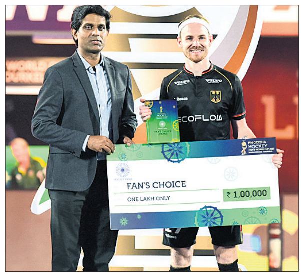
ଫ୍ୟାନ୍ସ ଟପ୍ ପୁରସ୍କାର ।