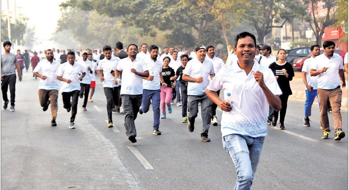
କିର ୨୪ ବର୍ଷ ପୂର୍ଣ୍ଣ ଅବସରରେ କିର ଓ କିଏ ପସରୁ ରବିବାର ଭୁବନେଶ୍ୱର ସାହିତ୍ୟ ପର୍ବ ଉଦଘାଟନାରେ ଭାଗ ନେଇଥିବା ମିନି ମାରାଥନ ।