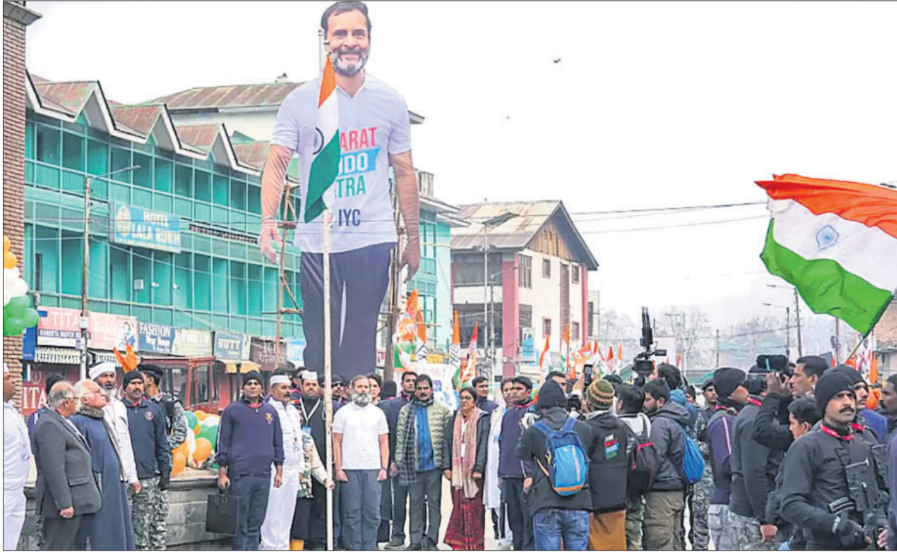
ଶ୍ରୀମନ୍ଦିର ଲାଲ୍‌ଚୌକରେ ରବିବାର ଜାତୀୟ ପତାକା ଉଡ଼ାଇବା ପରେ କର୍ମୀଙ୍କ ସହ କଂଗ୍ରେସ ନେତା ରାହୁଲ ଗାନ୍ଧୀ।

■ ଆଜି ଶେଷ ହେବ ଭାରତ ଯୋଡ଼ୋ ଯାତ୍ରା ■ ଯୋଗଦେବେ ୧୨ ବିରୋଧୀ ଦଳର ନେତା