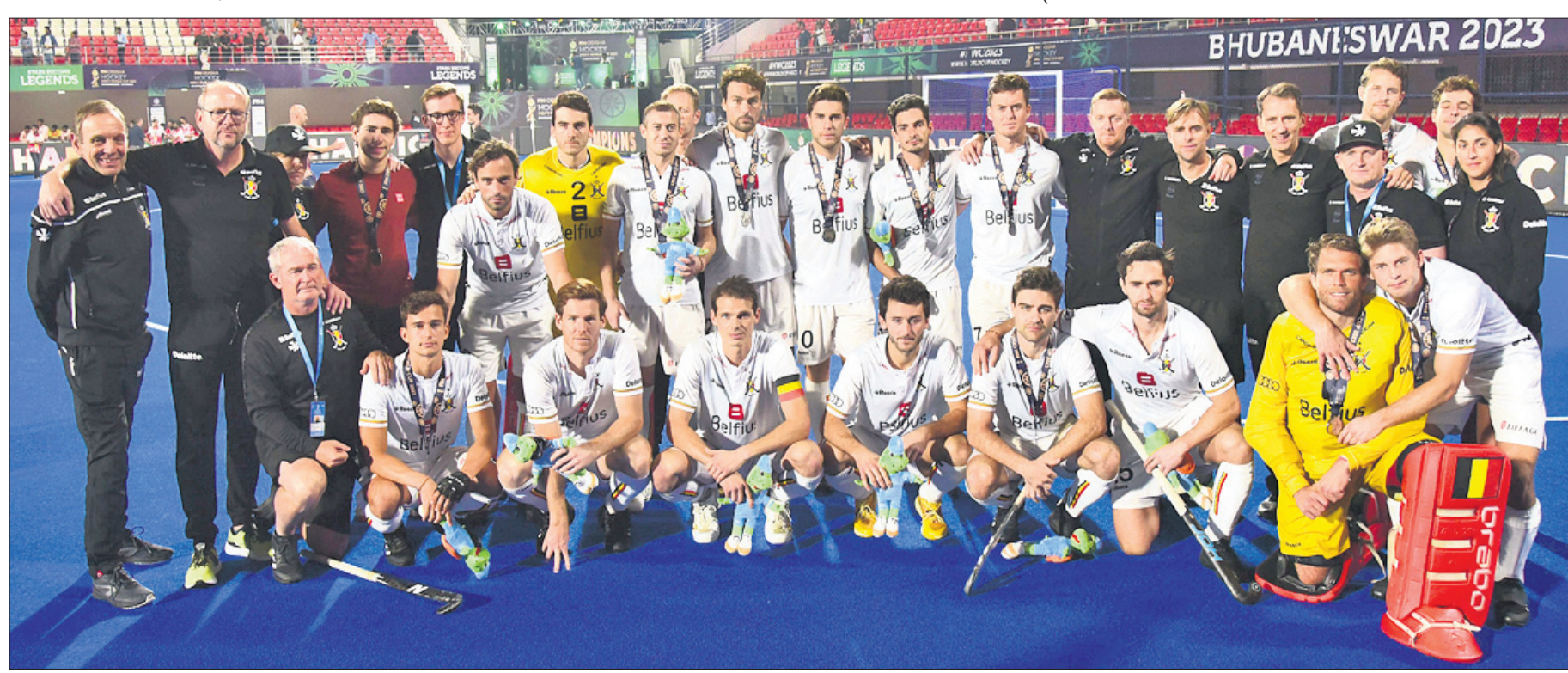
ରୌପ୍ୟ ପଦକ ସହ ବେଲଜିୟମ ଦଳ ।