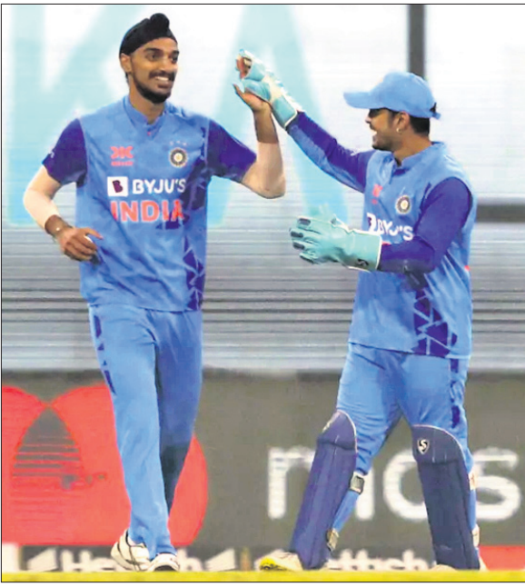
ଉଇକେଟ ନେବା ପରେ ଅର୍ଦ୍ଧଦୀପ ସିଂଙ୍କୁ ବଧେଇ ଜଣାଇଛନ୍ତି ଇଶାନ କିଶନ୍।

୪ ଉଇକେଟ ହରାଇ ମ୍ୟାଚକୁ ଜିତି ନେଇଥିଲା। ସୁଦ୍ଧାକୃଷ୍ଣ ଚନ୍ଦ୍ର କିତି ପ୍ରଥମେ ବ୍ୟାଟି ନିଷ୍ପତ୍ତି ନେଇଥିଲା। ତେବେ ଭାରତୀୟ ସିନର କମ୍ପ୍ୟୁ ବୋଲି କରିବା ସହିତ ସୁଦ୍ଧାକୃଷ୍ଣ ଚାପରେ ରଖିଥିଲେ। ଭାରତୀୟ ସିନର ୧୩ ଓଭର ବୋଲି କରି ମାତ୍ର ୬୪ ରନ୍ ଦେଇ ୪ ଉଇକେଟ ନେଇଥିଲେ। ଅର୍ଦ୍ଧଦୀପ ସିଂ ୨ ଉଇକେଟ ନେଇଥିବା ବେଳେ ହାର୍ଦ୍ଦିକ ପାଣ୍ଡ୍ୟା,