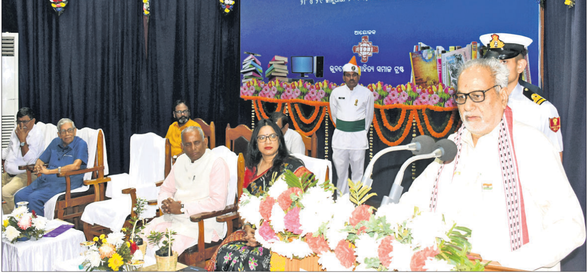
ଭୁବନେଶ୍ୱର ସାହିତ୍ୟ ପର୍ବ ରବିବାର ଉଦଘାଟନା ଅଧିବେଶନରେ ରାଜ୍ୟପାଳ ପ୍ରତ୍ୟେକର ଗଣେଶ ଲାଲ ଓ ଅନ୍ୟ ଅତିଥିମାନେ ।