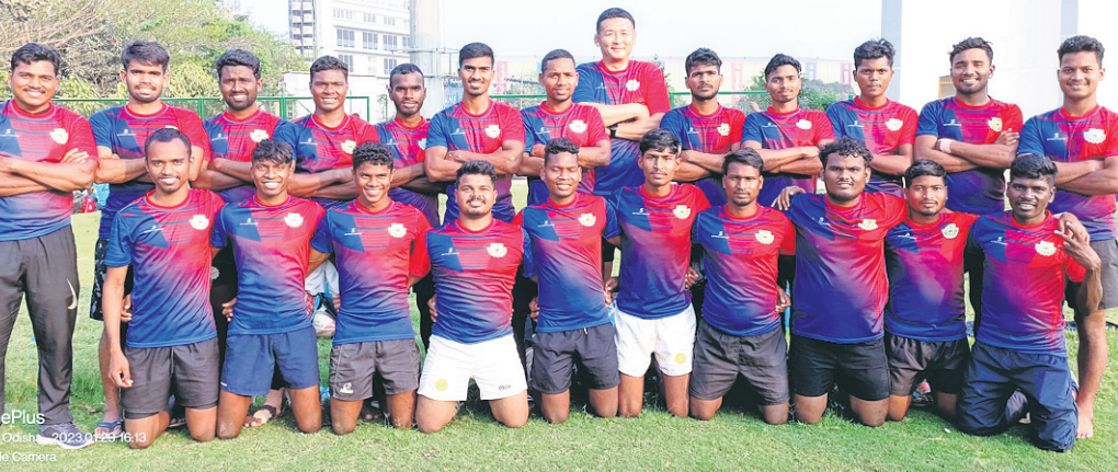
କିସ୍ ରଗ୍‌ଗା ଦଳ।

ଜିତି ନେଇଥିଲେ। ପରବର୍ତ୍ତୀ ସ୍ଥଳ ସେଟ୍ ବେଶ୍ ସଂଘର୍ଷପୂର୍ଣ୍ଣ ରହିବା ସହିତ ଟାଇଟ୍‌ରେକ୍‌ରେ ମ୍ୟାଚ୍ ଫାଇନାଲ ବାହାରିଥିଲା। ଦ୍ୱିତୀୟ ଟାଇଟ୍‌ରେ ୬-୬ରେ ରହିଥିବା ବେଳେ ଟାଇଟ୍‌ରେକ୍‌ରେ ୬-୪ରେ ବିଜୟୀ ହୋଇଥିଲେ। ସମାନ ଭାବେ ନିଷ୍ଠାଧିକ ସେଟ୍ ମଧ୍ୟ ଟାଇଟ୍‌ରେକ୍‌ରୁ ଯାଇଥିଲା। ଟାଇଟ୍‌ରେକ୍‌ରୁ ୬-୪ରେ ଜିତିବା ସହ ଜୋକୋଭିଚ୍ ୧୦ମ ଅଷ୍ଟ୍ରେଲିଆନ୍ ଓପନ୍ ବିଜୟୀ ହୋଇଥିଲେ।