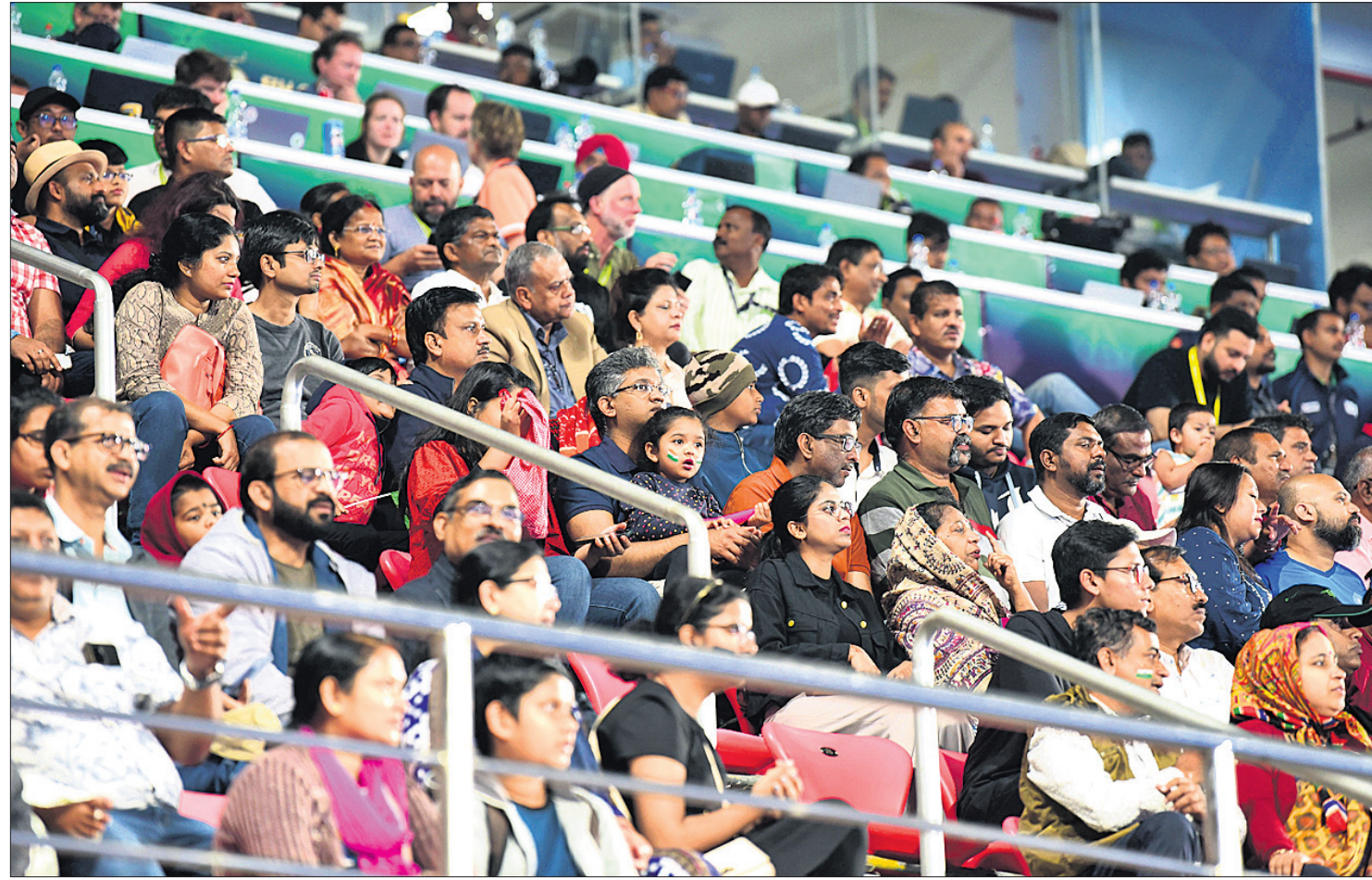
କଳିଙ୍ଗ ଷ୍ଟାଡ଼ିୟମରେ ହକି ବିଶ୍ୱକପ ମ୍ୟାଚ ଉପଭୋଗ କରୁଛନ୍ତି ଦର୍ଶକ ।