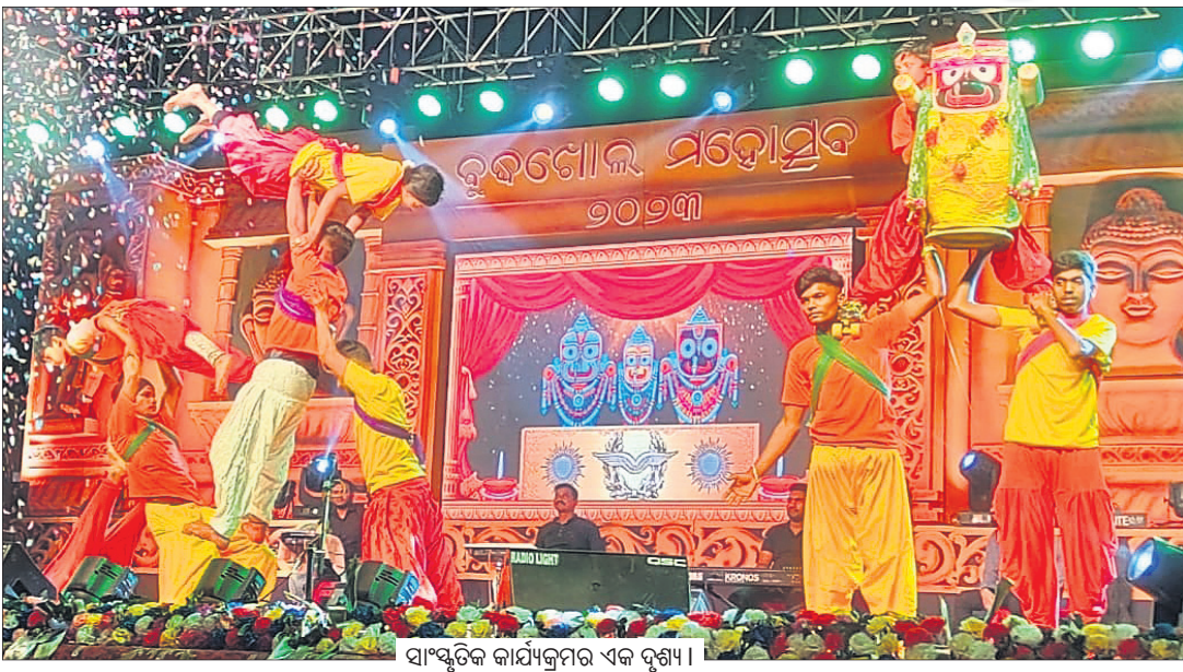
ସାଂସ୍କୃତିକ କାର୍ଯ୍ୟକ୍ରମର ଏକ ଦୃଶ୍ୟ।