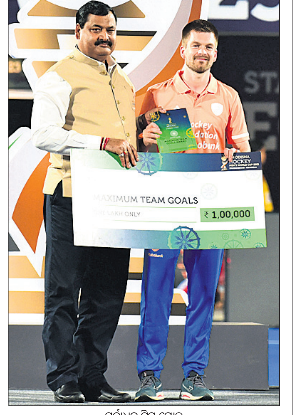
ସର୍ବାଧିକ ଟିମ୍ ଗୋଲ