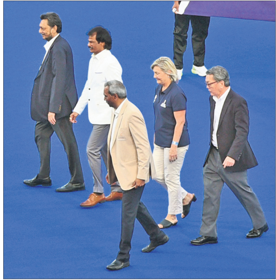
ଅଷ୍ଟ୍ରେଲିଆ ବନାମ ନେଦରଲାଣ୍ଡ ମ୍ୟାଚର ଅତିଥି ।