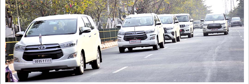
ଆପୋଲୋ ହସ୍ପିଟାଲ ଅଭିଯୁକ୍ତ ଯାଉଥିବା ନେତା ଓ ମନ୍ତ୍ରୀଙ୍କ ଗାଡ଼ି।