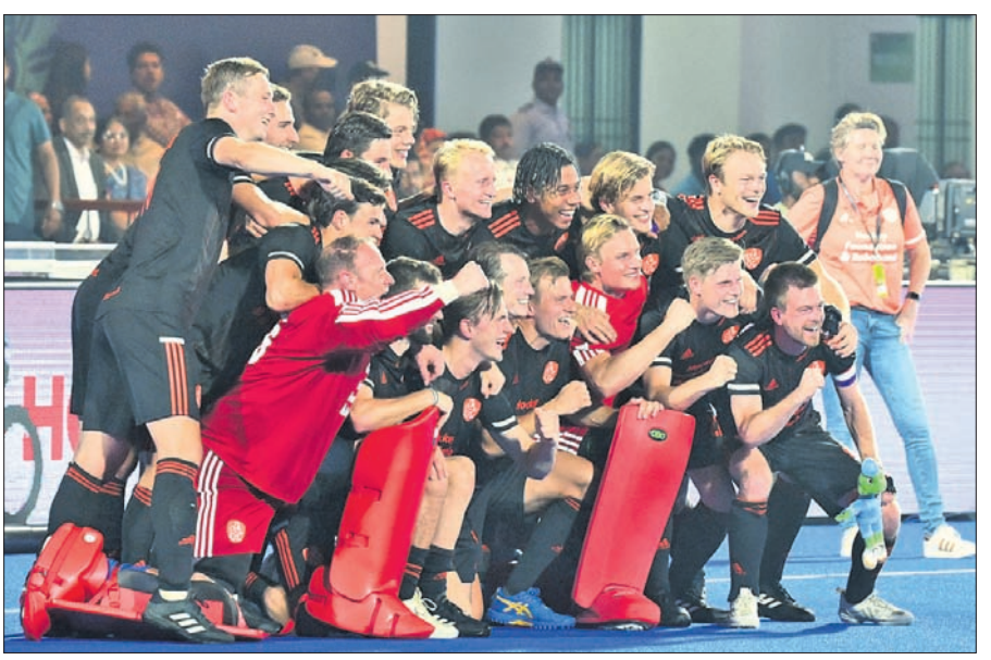
ଡ୍ରୋଝ୍ ବିଜୟ ନେଦରଲାଣ୍ଡ ଦଳ ।