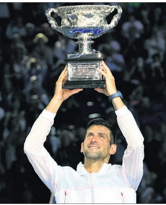
ଚାମ୍ପିୟନ ଗ୍ରୀସ ସହ ନୋଭାକ ଜୋକୋଭିଚ୍।

ମେଲବୋର୍ନ, ୨୯ (ପି.ଟି.) ଅଷ୍ଟ୍ରେଲିଆନ୍ ଓପନ୍ ପୁରୁଷ ସିଙ୍ଗଲ୍ସ ଚାମ୍ପିୟନ ଆଖ୍ୟା ଅର୍ଜନ କରିଛନ୍ତି ସର୍ବିୟାର ନୋଭାକ ଜୋକୋଭିଚ୍। ଉଦ୍‌ବାର ଅନୁଷ୍ଠିତ ଫାଇନାଲରେ ଗ୍ରୀସର ଷ୍ଟେଫାନସ୍ ସିଦିପାୟଙ୍କୁ ୬-୩, ୬-୬(୪) ଓ ୬-୬(୫)ରେ ପରାସ୍ତ କରିବା ସହିତ କ୍ୟାରିୟରର ୨୨ତମ ଗ୍ରାଣ୍ଡସ୍ଲାମ ହାସଲ କରିଛନ୍ତି। କ୍ୟାରିୟର ଗ୍ରାଣ୍ଡସ୍ଲାମରେ ସେ ରାଫେଲ ନାଡାଲଙ୍କ ସମକକ୍ଷ ହୋଇଛନ୍ତି। ଏହାମଧ୍ୟରେ ୧୦ଥର ଅଷ୍ଟ୍ରେଲିଆନ୍ ଓପନ୍ ସାମିଲ ଥିବାବେଳେ ୬ଥର ଫ୍ରେମ୍‌ଲଣ୍ଡର, ୩ଥର ଯୁଏସ୍ ଓପନ୍ ଏବଂ ୨ଥର ଫ୍ରେଞ୍ଚ୍ ଓପନ୍ ବିଜୟୀ ହୋଇଛନ୍ତି। ରତ୍ ଲାଭେଇ ଆରେନାରେ ଖେଳାଯାଇଥିବା ମ୍ୟାଚ ଜିତିବା ସହିତ କ୍ୟାରିୟରର ୬୩ତମ ଅଷ୍ଟ୍ରେଲିଆନ୍ ଓପନ୍ ବିଜୟୀ ହୋଇଛନ୍ତି। ଏହି ବିଜୟ ସହ ଯୁନିଟିଏ ଏସିଏ ମାନ୍ୟତାରେ ଏକ ନମ୍ବରକୁ ଫେରିଛନ୍ତି ଜୋକୋଭିଚ୍। ୩୫ ବର୍ଷୀୟ ଜୋକୋଭିଚ୍‌ଙ୍କୁ କୋଭିଡ୍ ରିକା କାରଣରୁ ଗତବର୍ଷ ଅଷ୍ଟ୍ରେଲିଆକୁ ପ୍ରତ୍ୟର୍ପଣ କରାଯାଇଥିଲା ଏବଂ ଗୁର୍ମାମୋଶରେ ଅଂଶଗ୍ରହଣ କରିବାର ସୁଯୋଗ ମିଳି ନ ଥିଲା। ସିଦିପାୟ ନିଜ କ୍ୟାରିୟରର ଦ୍ୱିତୀୟ ଗ୍ରାଣ୍ଡସ୍ଲାମ ଫାଇନାଲରେ ପ୍ରବେଶ କରିଥିବା ବେଳେ ଉଭୟ ଧରଣର ଉଦ୍‌ବାର ଗ୍ରାଣ୍ଡସ୍ଲାମରେ ଖେଳିଛନ୍ତି। ପୂର୍ବରୁ ୨୦୧୧ ଫ୍ରେଞ୍ଚ୍ ଓପନ୍ ଫାଇନାଲରେ ମଧ୍ୟ ସେ ଜୋକୋଭିଚ୍‌ଙ୍କ ନିକଟରୁ ହାରିଥିଲେ। ଉଦ୍‌ବାରର ଫାଇନାଲ ମୁକାବିଲା ବେଶ୍ ସଂଘର୍ଷପୂର୍ଣ୍ଣ ରହିଥିଲା। ପ୍ରଥମ ସେଟ୍‌କୁ ଜୋକୋଭିଚ୍ ୬-୩ରେ