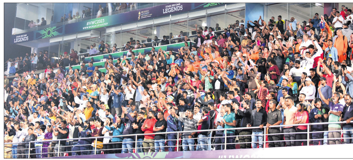
ଫାଇନାଲ ମ୍ୟାଚ୍‌ର ଉତ୍ସାହୀ ଦର୍ଶକ ।