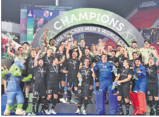
ହରି ବିଶ୍ୱକପ ଟ୍ରଫି ସହ ଚାମ୍ପିୟନ ଜର୍ମାନୀ ଦଳ ।

ଭୁବନେଶ୍ୱର(ସ୍ପେଶାଲ)/ ଝାରସୁଗୁଡ଼ା ଅଫିସ୍/ବ୍ରହ୍ମଚାରୀଗଣ, ୨୯।୧