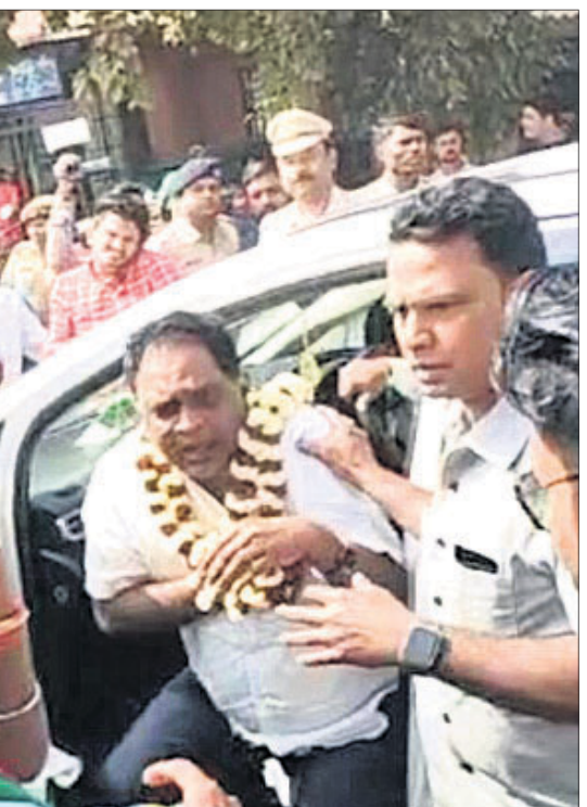
ମନ୍ତ୍ରୀ ନବ ଦାସଙ୍କଠାରେ ଗୁଳି ବାଜିବା ସମୟର ଦୃଶ୍ୟ ।

■ ମନ୍ତ୍ରୀଙ୍କ ପୂର୍ବଦଳ ପିଏସ୍ଓ ଥିଲେ ଅଭିଯୁକ୍ତ ■ ଆକ୍ରମଣକୁ ନିନ୍ଦା ସହ ଘଟଣାର କ୍ରାଇମ୍‌ସ୍ତ୍ରୀ ତଦନ୍ତ ନିର୍ଦ୍ଦେଶ ଦେଲେ ପୁଖ୍ୟମନ୍ତ୍ରୀ