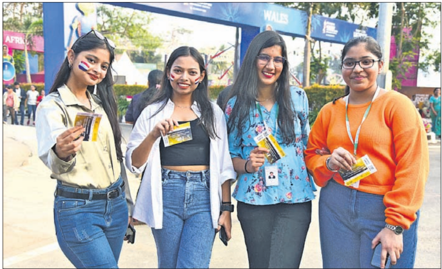
ଚିକେଟ୍ ପ୍ରଦର୍ଶନ କରୁଛନ୍ତି ହକି ପ୍ରେମୀ ।