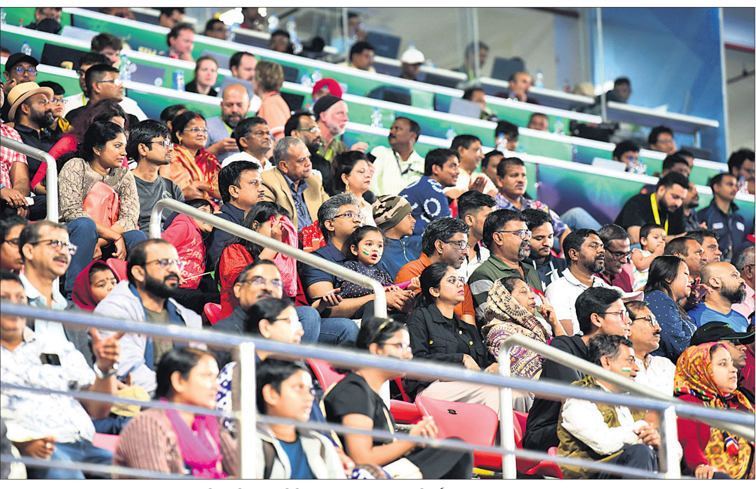
କଳିଙ୍ଗ ଷ୍ଟାଡ଼ିୟମରେ ହକି ବିଶ୍ୱକପ ମ୍ୟାଚ ଉପଭୋଗ କରୁଛନ୍ତି ଦର୍ଶକ ।