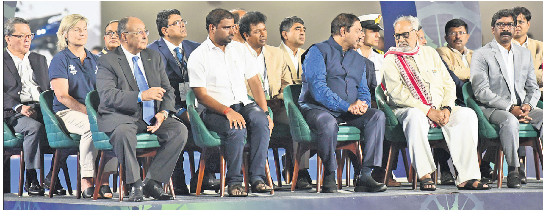
ହକି ବିଶ୍ୱକପ ଉଦ୍‌ଘାଟନା ଉତ୍ସବରେ ଉପସ୍ଥିତ ଅତିଥି ଓ କର୍ମକର୍ତ୍ତା ।