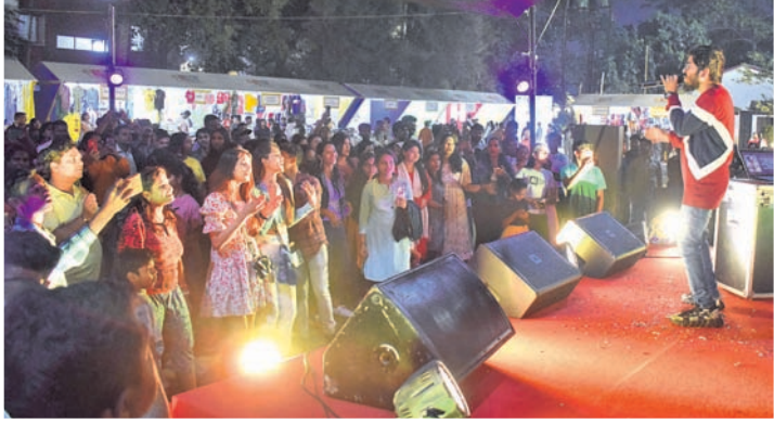
ଡର୍ଡ଼େସ୍ତର ଶେଷ ଦିନରେ ଅନ୍ତର୍ଜାତୀୟ ଫୁଡ୍ ଫେଷ୍ଟିଭାଲରେ ଲୋକଙ୍କ ଭିଡ଼। ପ୍ରଥମ ନାଲଟ୍ ଫୁଡ୍ ମାର୍କେଟରେ ଲୋକେ କିଣାକିଣି ସହ ସାଂସ୍କୃତିକ କାର୍ଯ୍ୟକ୍ରମକୁ ଉପଭୋଗ କରୁଛନ୍ତି।