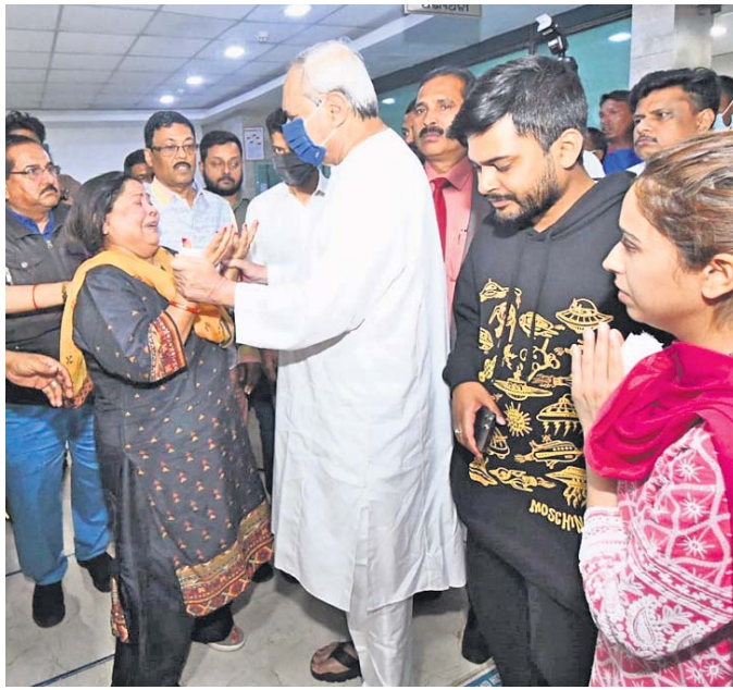
ଭୁବନେଶ୍ୱର ଆପୋଲୋ ହସ୍ତିଶାଳାରେ ସାମ୍ବଲମନ୍ତ୍ରୀ ନବ ଦାସଙ୍କ ପରଲୋକ ପରେ ତାଙ୍କ ସ୍ତ୍ରୀ ମିନତି ଦାସଙ୍କୁ ଆଶ୍ୱାସନା ଦେଉଛନ୍ତି ମୁଖ୍ୟମନ୍ତ୍ରୀ ନବୀନ ପଟ୍ଟନାୟକ ।