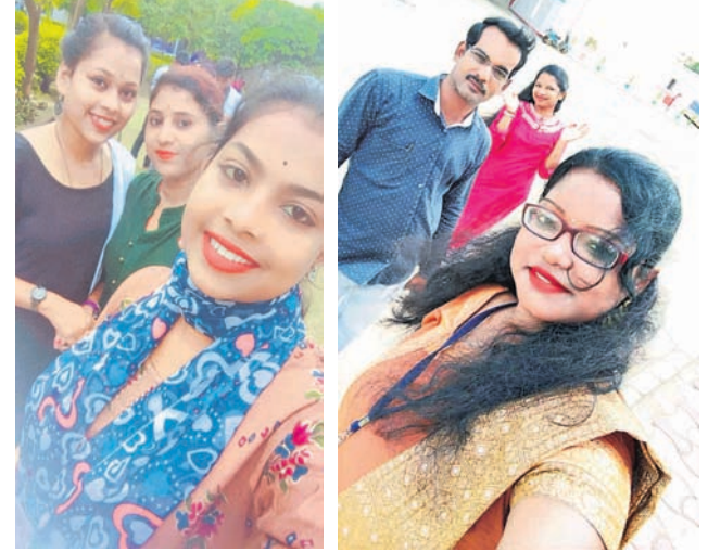
@ ସାଗରିକା @ ଜ୍ୟୋତି