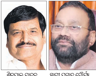
ଶିବପାଲ ଯାଦବ ସ୍ୱାମୀ ପ୍ରସାଦ ମୌର୍ଯ୍ୟ

ସମାଜବାଦୀ ପାର୍ଟି (ଏସ୍‌ପି)ର ୬୨ ଜଣିଆ ଜାତୀୟ କାର୍ଯ୍ୟକାରୀତା ରବିବାର ପ୍ରକାଶ ପାଇଛି। ଏଥିରେ ଅଧିକାଂଶ ସଭ୍ୟଙ୍କର ନାମ ଉଲ୍ଲେଖ କରାଯାଇଛି। ସାଧାରଣ ସମାବେଶ କରାଯାଇଛି। ରାମଚରଣ ମାନ୍ୟ ଉପରେ ବିବାହାୟ ମନ୍ତବ୍ୟ ଦେଇଥିବା ବରିଷ୍ଠ ନେତା ସ୍ୱାମୀ ପ୍ରସାଦ ମୌର୍ଯ୍ୟ ଏବଂ ଆଜମ ଖାନ୍ଙ୍କ ସମେତ ୧୪ ଜଣଙ୍କୁ ସାଧାରଣ ସମାବେଶ କରାଯାଇଛି। ବାବା-ପୁରୁଣା ଶିବପାଲ ଏବଂ ଅଧିକାଂଶ ୨୦୧୬ରେ ପରମ୍ପରାଠାରୁ