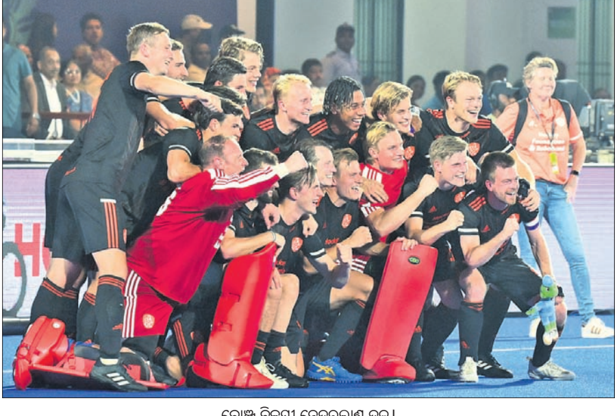
ଡଚ୍‌ସ୍ ବିଜୟୀ ନେଦରଲାଣ୍ଡ୍ ଦଳ ।