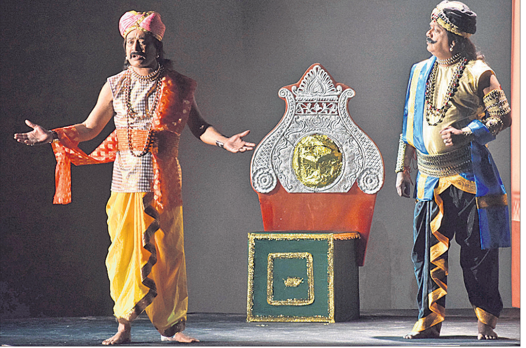
ବାଗ୍‌ଦେବୀ ନାଟକ ଉତ୍ସବର ପ୍ରଥମ ସନ୍ଧ୍ୟାରେ ପରିବେଷିତ ନାଟକ 'ଅପେକ୍ଷାରେ ରାମଚନ୍ଦ୍ର'ର ଏକ ଦୃଶ୍ୟ।

ଭୁବନେଶ୍ୱର, ୨୯।୧ (ବୁଧବେଳା) ଯୁଦ୍ଧ କଥା ଆସିଲେ ମୁହଁ ଡରରେ ସମସ୍ତେ ଭୟଭୀତ ହୋଇଯାନ୍ତି। ମହାଯୁଦ୍ଧର ପୁଷ୍ପକୁମ୍ଭରେ ଜୀବନକୁ ସଫଳ କରୁଛି ମୁହଁର ବିଭୀଷିକା। ବିପର୍ଯ୍ୟୟ ହେଉଛି ମାନବର ନିରାପତ୍ତ। ହେଲେ ସମଗ୍ର ବିଶ୍ୱରେ ଆଧିପତ୍ୟ ବିସ୍ତାର କରିବା ଲାଗି ଏକଜୁଟିବାଟ ଚାହେଁ ଯୁଦ୍ଧ। ଏକଜୁଟିବାଟର ପ୍ରତୀକ ଲଙ୍କାଧିପତି ରାବଣ ଜାଣନ୍ତି, ଜୀବନର ଶେଷ ରାମଚନ୍ଦ୍ରଙ୍କ ପାଖରେ। ତେଣୁ ସାତାଳୁ ହରଣ କରିବା ପରେ ଘେ ବଡ଼ ଆନନ୍ଦର ସହ ରାମଚନ୍ଦ୍ରଙ୍କୁ ଅପେକ୍ଷା କରିଛନ୍ତି। ସେ ଜାଣିଛନ୍ତି ଯେ