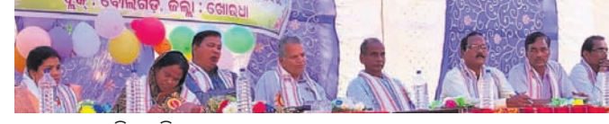
ଉତ୍ସବରେ ଉପସ୍ଥିତ ଅତିଥିମାନେ।