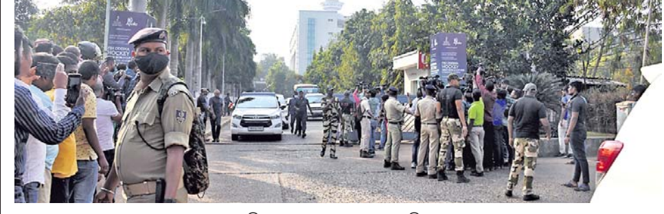
ହସ୍ତିଶାଳା ମେଡିକାଲ ସମ୍ବନ୍ଧରେ ଭିଡ଼ ।