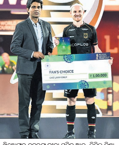
ଶ୍ରେଷ୍ଠ ଫାନ ଚୟନ ପୁରସ୍କାର ପ୍ରଦାନ କରୁଛନ୍ତି।