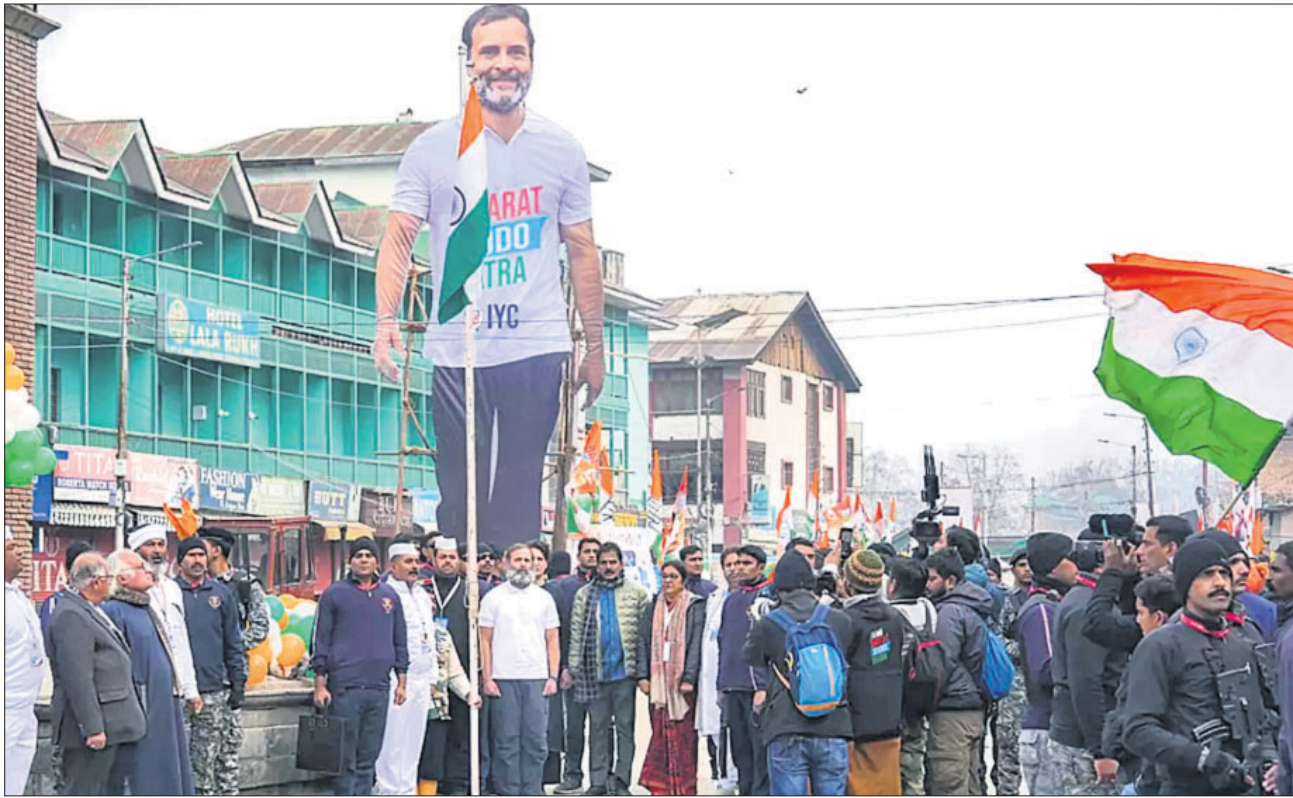
ଶ୍ରୀନଗରର ଐତିହାସିକ ଲାଲଚୌକଠାରେ ରବିବାର ଜାତୀୟ ପତାକା ଉତ୍ତୋଳନ କରିବା ପରେ କର୍ମୀଙ୍କ ସହ କଂଗ୍ରେସ ନେତା ରାହୁଲ ଗାନ୍ଧୀ।

ଭାରତ ଯୋଡ଼ୋ ଯାତ୍ରା ଅବସରରେ କଂଗ୍ରେସ ନେତା ରାହୁଲ ଗାନ୍ଧୀ ଶ୍ରୀନଗରର ଐତିହାସିକ ଲାଲଚୌକଠାରେ ରବିବାର ଜାତୀୟ ପତାକା ଉତ୍ତୋଳନ କରିଛନ୍ତି। ଏଥିପାଇଁ ରାଜ୍ୟ ପ୍ରଶାସନ ପକ୍ଷରୁ କଡ଼ା ସୁରକ୍ଷା ବ୍ୟବସ୍ଥା ଗ୍ରହଣ କରାଯାଇଥିଲା। କନ୍ୟାକୁମାରୀରୁ କଶ୍ମୀର ପଦଯାତ୍ରାର ଶେଷ ଭାଗରେ ରାହୁଲ ୩୦ ମିନିଟ ସମୟ ବାହାର କରି ମୌଲାନା ଆଜାଦ ରୋଡ଼ସ୍ଥିତ କଷ୍ଟ-କଶ୍ମୀର ପ୍ରଦେଶ କଂଗ୍ରେସ ପୁଞ୍ଜାମୟକୁ ଯାଇଥିଲେ। ଏହା ପରେ ସେ ଲାଲ୍ ଚୌକର ଘଣ୍ଟାଘର ଯାଇ ସେଠାରେ ତ୍ରିରଙ୍ଗା ଉଡ଼ାଇଥିଲେ। ଏହି ସମୟରେ ରାହୁଲଙ୍କ ସହ କଂଗ୍ରେସ ସାଧାରଣ ସମାବେଶ ପ୍ରୟତ୍ନ ଗାନ୍ଧୀ ଭଦ୍ରା ଓ ସ୍ଥାନୀୟ କଂଗ୍ରେସ ନେତାମାନେ ଉପସ୍ଥିତ ଥିଲେ। ସୋମବାର ଭାରତ ଯୋଡ଼ୋ ଯାତ୍ରାର ଶେଷ ଦିନରେ ତ୍ରିରଙ୍ଗା ଉଡ଼ାଇବାର ଯୋଜନା ଥିଲେ ମଧ୍ୟ ରୋଟିଏ ଦିନ ପୂର୍ବରୁ କରିବାକୁ ପଡ଼ିଲା ବୋଲି ଦଳର ସାଧାରଣ ସମାବେଶ ଜୟରାମ ରମେଶ ରୁଜ୍ଜୁ କରୁଛନ୍ତି। ଲାଲ୍ ଚୌକରେ ରବିବାର ଜାତୀୟ ପତାକା ଉତ୍ତୋଳନ ଲାଗି ରାଜ୍ୟ ପ୍ରଶାସନ ଶନିବାର ସନ୍ଧ୍ୟାରେ ଅନୁମତି ଦେଇଥିଲା। ଏହି କାର୍ଯ୍ୟକ୍ରମ ପାଇଁ ବ୍ୟାପକ ସୁରକ୍ଷା ବ୍ୟବସ୍ଥା ଗ୍ରହଣ କରାଯାଇଥିଲା। ବହୁସଂଖ୍ୟାରେ ସୁରକ୍ଷା କର୍ମୀ ଲାଲଚୌକର ୧ କିଲୋମିଟର ଅଞ୍ଚଳ ମଧ୍ୟରେ ନିୟୋଜିତ ହୋଇଥିଲେ। ବୋକାନ ବଜାର ସବୁକୁ ବନ୍ଦ କରିଦିଆଯାଇଥିଲା। ଲାଲଚୌକରେ ତ୍ରିରଙ୍ଗା ଉଡ଼ାଇବା ଦ୍ୱାରା ଭାରତକୁ ଦିଆଯାଇଥିବା ପ୍ରତିଶ୍ରୁତି ଆଜି ପୂରଣ ହୋଇଛି। ଶୁଣାର ପରାକ୍ରମ ଏବଂ ପ୍ରେମର ସବୁବେଳେ ଜୟ ହୋଇଥାଏ। ଭାରତରେ ଆଶାର ନୂଆ ସକାଳ ଆସିବାରୁ ଯାଉଛି ବୋଲି ରାହୁଲ ରୁଜ୍ଜୁ କରୁଛନ୍ତି। ଗତବର୍ଷ ସେପ୍ଟେମ୍ବର