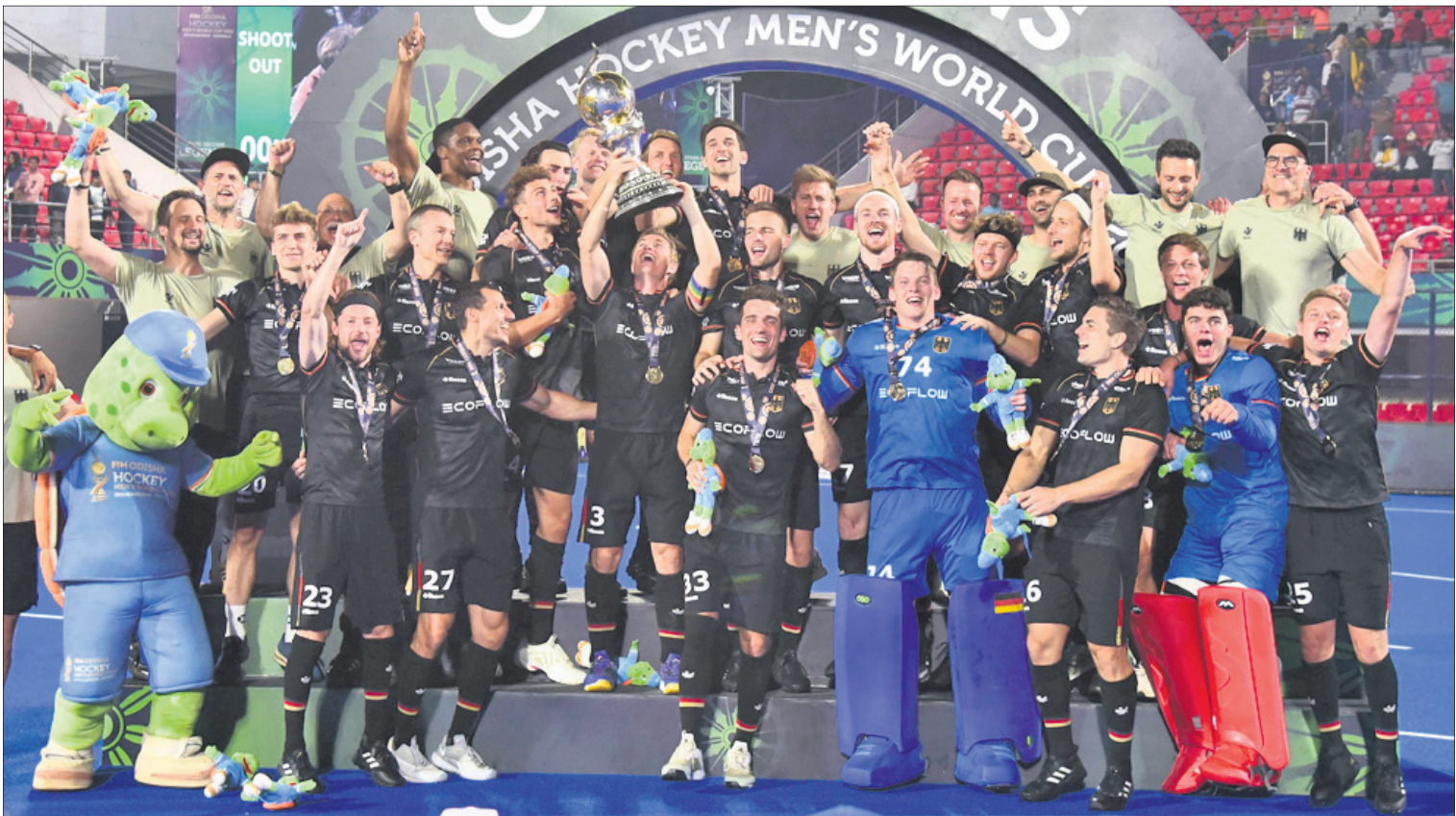
ଚାମ୍ପିୟନ ହେବା ପରେ କଳିଙ୍ଗ ଷ୍ଟାଡ଼ିୟମରେ ଉଲ୍ଲାସିତ ଜର୍ମାନୀ ଦଳ ।

ସରକାର ବାହାରୁ ଆସିଥିବା ଅତିଥିମାନଙ୍କୁ ଆତିଥେୟତାରେ କୌଣସି ହେଳା କରି ନ ଥିଲେ । ଫଳରେ ଖେଳାଳିମାନଙ୍କୁ ଆରମ୍ଭ କରି ଦେଶ ବିଦେଶରୁ ଆସିଥିବା ଦର୍ଶକମାନେ ଓଡ଼ିଶା ସରକାରଙ୍କ ପ୍ରଶଂସାରେ ଶତପୁଞ୍ଜ ହୋଇଛନ୍ତି । ବିଶ୍ୱକପର ପରବର୍ତ୍ତୀ ସଂସ୍କରଣ ବେଲଜିୟମର ଖାଣ୍ଡେ ଓ ନେଦରଲାଣ୍ଡର ଆମଷ୍ଟେଲଜିନ୍‌ରେ ଅନୁଷ୍ଠିତ ହେବ । ଏହା ୨୦୨୬ ରୁଇ-କ୍ଲାଇରେ ଆୟୋଜନ ହେବା କାର୍ଯ୍ୟକ୍ରମ ରହିଛି ।