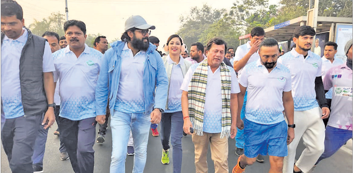
କିଏ ଓ କିଏ ପକ୍ଷରୁ ରବିବାର ଭୁବନେଶ୍ଵର ସାକ୍ଷି ଶାନ୍ତିରେ ହୋଇଥିବା ମାରାଥନ ଆରମ୍ଭ ହୋଇଥିଲା ।