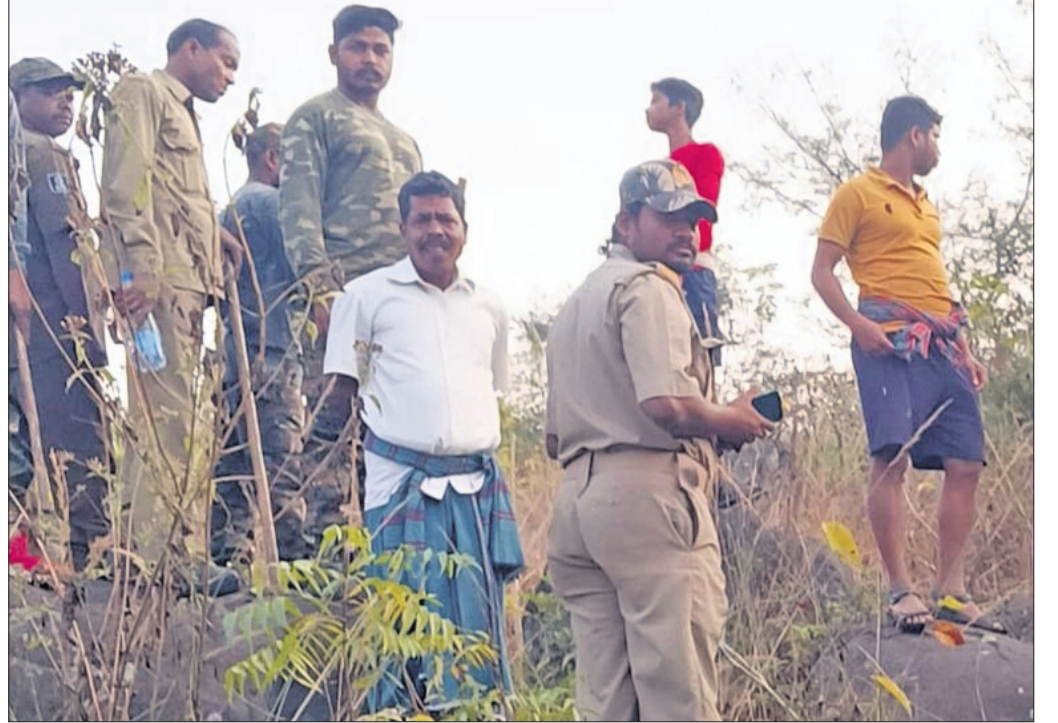
ବିଷାଗିରି ପାହାଡ଼ ତଳ ଅଞ୍ଚଳରେ ବନ ବିଭାଗ କର୍ମଚାରୀମାନେ ଅନୁସନ୍ଧାନ କରୁଛନ୍ତି।

ବାଲିକା, ୨୯୧୧ (ଡି.ଏନ୍.ଏ.): ବୋଲଗଡ଼ ରୁକ୍ଷ ସାମ୍ବଲପୁର ଗ୍ରାମସମିତି ଉଦ୍ଦେଶ୍ୟରେ ଏକ ସମାବେଶ ଅନୁଷ୍ଠିତ ହୋଇଥିଲା। ଏହାରେ ଉପସ୍ଥିତ ଥିଲେ ବିଭିନ୍ନ ସ୍ତରର ଅଧିକାରୀଙ୍କ ସମେତ ପ୍ରାୟ ୨୫୦ରୁ ଅଧିକ ଲୋକ। ଏହାଛଡ଼ା ଉପସ୍ଥିତ ଥିଲେ ବିଭିନ୍ନ ସ୍ତରର ଅଧିକାରୀଙ୍କ ସମେତ ପ୍ରାୟ ୨୫୦ରୁ ଅଧିକ ଲୋକ।