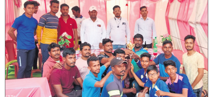
ଅତିଥିଙ୍କ ଗହଣରେ ଟ୍ରଫି ସହ ଖେଳାଳିମାନେ।