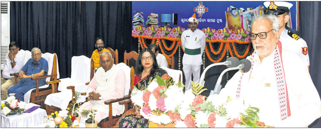
ଭୁବନେଶ୍ୱର ସାହିତ୍ୟ ପର୍ବର ରବିବାର ଉଦ୍‌ଘାଟନା ଅଧିବେଶନରେ ରାଜ୍ୟପାଳ ପ୍ରଫେସର ଗଣେଶୀ ଲାଲ୍ ଓ ଅନ୍ୟ ଅତିଥିମାନେ।