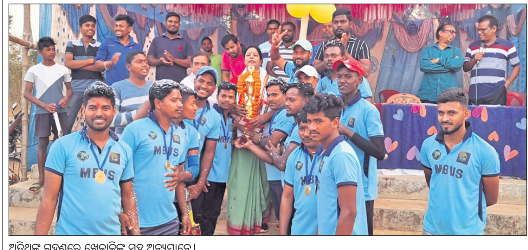
ଅତିଥିଙ୍କ ଗହଣରେ ଖେଳାଳିଙ୍କ ସହ ଅନ୍ୟମାନେ।

ଖୋର୍ଦ୍ଧା ଅଫିସ/ନିରାକାରପୁର, ୨୯୧୧ (ଡି.ଏନ୍.ଏ.)