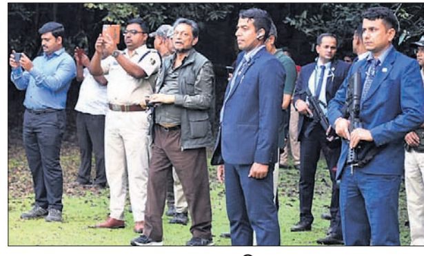
ରାଜନଗର, ୨୯ (ଡି.ଏମ.ଏ.)