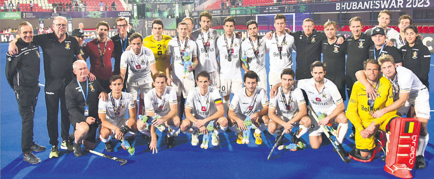
ଗୌପ୍ୟ ପଦକ ସହ ବେଲଜିୟମ ଦଳ ।