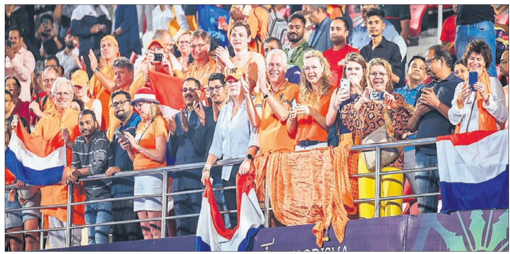
ଖେଷ୍ଟ ଷ୍ଟାଣ୍ଡରେ ଖୁସି ପୁହୁଡ଼ିରେ ନେଦରଲାଣ୍ଡସ ଦର୍ଶକ ।

ପ୍ରଦର୍ଶନ କରିପାରି ନ ଥିବାରୁ ଏହାର ସମର୍ଥକ ମାନେ ନିରାଶ ମନରେ ଷ୍ଟାଣ୍ଡ ଛାଡ଼ିଥିଲେ । ନେଦରଲାଣ୍ଡସରୁ ଆସିଥିବା ଦର୍ଶକମାନେ କିଛି ଜର୍ମାନୀ ଓ ବେଲଜିୟମ ମଧ୍ୟରେ ଅନୁଷ୍ଠିତ ଫାଇନାଲକୁ ଉପଭୋଗ କରିଥିଲେ ।