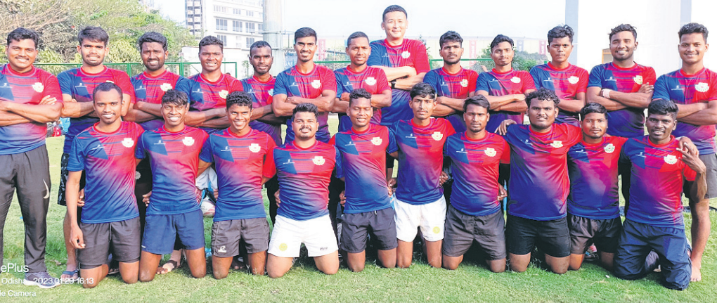
କିସ୍ ରଗ୍ଗା ଦଳ।

ଜିତି ନେଇଥିଲେ। ପରବର୍ତ୍ତୀ ସ୍ଥଳ ସେଟ୍ ବେଶ୍ ସଂଘର୍ଷପୂର୍ଣ୍ଣ ରହିବା ସହିତ ଟାଇଟ୍ରେକରରେ ମ୍ୟାଚ୍ ଫଳାଫଳ ବାହାରିଥିଲା। ଦ୍ୱିତୀୟ ଟାଇଟ୍ରେକରକୁ ୬-୪ରେ ଜିତିବା ସହ ସେଟ୍ଟ୍ ୬-୬ରେ ରହିଥିବା ବେଳେ ଟାଇଟ୍ରେକରରେ ୬-୪ରେ ଓପନ୍ ବିଜୟୀ ହୋଇଥିଲେ। ସମାନ ଭାବେ ନିର୍ଣ୍ଣାୟକ ସେଟ୍ଟ୍ ମଧ୍ୟ ଟାଇଟ୍ରେକରକୁ ଯାଇଥିଲା। ଟାଇଟ୍ରେକରକୁ ୬-୪ରେ ଜିତିବା ସହ ଜୋକୋଭିଚ୍ ୧୦ମ ଅଷ୍ଟ୍ରେଲିଆନ୍ ଓପନ୍ ବିଜୟୀ ହୋଇଥିଲେ।