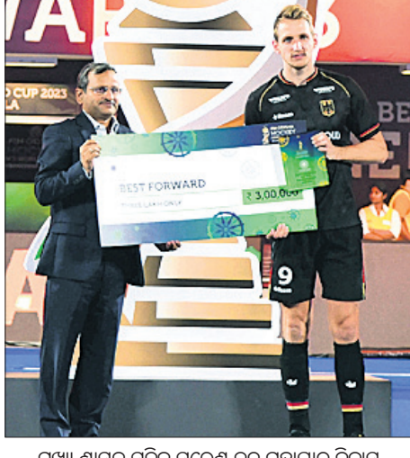
ପୁଣ୍ୟ ଶାସନ ସର୍ବୋଚ୍ଚ ପୁରସ୍କାର ପ୍ରଦାନ କରୁଛନ୍ତି।