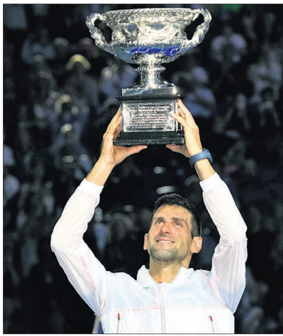
ଚାମ୍ପିୟନ ଟ୍ରଫି ସହ ନୋଭାକ ଜୋକୋଭିଚ୍।

ମେଲବୋର୍ନ, ୨୯ (ପି.ଟି.) ଅଷ୍ଟ୍ରେଲିଆନ୍ ଓପନ୍ ପୁରୁଷ ସିଙ୍ଗଲ୍ସ ଚାମ୍ପିୟନ ଆଖ୍ୟା ଅର୍ଜନ କରିଛନ୍ତି ସର୍ବିୟାର ନୋଭାକ ଜୋକୋଭିଚ୍। ରବିବାର ଅଷ୍ଟ୍ରେଲିଆ ଫାଇନାଲରେ ଗ୍ରୀସର ଷ୍ଟିଫାନସ୍ ସିଡିପାସ୍କୁ ୬-୩, ୬-୬(୪) ଓ ୬-୬(୫)ରେ ପରାସ୍ତ କରିବା ସହିତ କ୍ୟାରିୟରର ୨୨ତମ ଗ୍ରାଣ୍ଡସ୍ଲାମ ହାସଲ କରିଛନ୍ତି। କ୍ୟାରିୟର ଗ୍ରାଣ୍ଡସ୍ଲାମରେ ସେ ରାଫେଲ ନାଡାଲଙ୍କ ସମକକ୍ଷ ହୋଇଛନ୍ତି। ଏହାମଧ୍ୟରେ ୧୦ଥର ଅଷ୍ଟ୍ରେଲିଆନ୍ ଓପନ୍ ସାମିଲ ଥିବାବେଳେ ୬ଥର ଫ୍ରେମଲଟନ୍, ୩ଥର ଓପନ୍ ଏବଂ ୨ଥର ଫ୍ରେଜ୍ ଓପନ୍ ବିଜୟୀ ହୋଇଛନ୍ତି। ରଫ୍ ଲାଭେର ଆରେନାରେ ଖେଳାଯାଇଥିବା ମ୍ୟାଚ ଜିତିବା ସହିତ କ୍ୟାରିୟରର ୬୩ମ ଅଷ୍ଟ୍ରେଲିଆନ୍ ଓପନ୍ ବିଜୟୀ ହୋଇଛନ୍ତି। ଏହି ବିଜୟ ସହ ପୁନର୍ବାର ଏପିଏ ମାନ୍ୟତାରେ ଏକ ନମ୍ବରକୁ ଫେରିଛନ୍ତି ଜୋକୋଭିଚ୍। ୩୫ ବର୍ଷୀୟ ଜୋକୋଭିଚ୍‌ଙ୍କୁ କୋଭିଡ୍ ରିକା କାରଣରୁ ଗତବର୍ଷ ଅଷ୍ଟ୍ରେଲିଆକୁ ପ୍ରତ୍ୟର୍ପଣ କରାଯାଇଥିଲା ଏବଂ ଚୁର୍ନାମୋହରେ ଅଂଶଗ୍ରହଣ କରିବାର ସୁଯୋଗ ମିଳି ନ ଥିଲା। ସିଡିପାସ୍କୁ ନିଜ କ୍ୟାରିୟରର ଦ୍ୱିତୀୟ ଗ୍ରାଣ୍ଡସ୍ଲାମ ଫାଇନାଲରେ ପ୍ରବେଶ କରିଥିବା ବେଳେ ଉଭୟ ଚାମ୍ପିୟନ ରନରଥକୁ ଭାବରେ ଶେଷ କରିଛନ୍ତି। ପୂର୍ବରୁ ୨୦୧୧ ଫ୍ରେଜ୍ ଓପନ୍ ଫାଇନାଲରେ ମଧ୍ୟ ସେ ଜୋକୋଭିଚ୍‌ଙ୍କ ନିକଟରୁ ହାରିଥିଲେ। ରବିବାର ଫାଇନାଲ ମୁକାବିଲା ବେଶ୍ ସଂଘର୍ଷପୂର୍ଣ୍ଣ ରହିଥିଲା। ପ୍ରଥମ ସେଟ୍ଟ୍ ଜୋକୋଭିଚ୍ ୬-୩ରେ