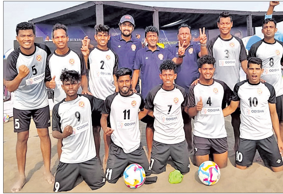
ଓଡ଼ିଶା ବିଏସ୍ ସୁପରଲିଗ୍ ଦଳ।

ଭୁବନେଶ୍ୱର, ୩୦/୧ (ସୋର୍ସ୍ କ୍ୟୁରୋ) ଓଡ଼ିଶା ହିରୋ ଜାତୀୟ ବିଏସ୍ ସୁପରଲିଗ୍ ଚାମ୍ପିୟନସିପ୍‌ରେ କ୍ୱାର୍ଟରଫାଇନାଲରେ ପ୍ରବେଶ କରିଛି। ଦଳ ଯୋଗବାର ପ୍ରତିଯୋଗିତାରେ ଚତୁର୍ଥ ମ୍ୟାଚରେ ଦଳ ୭-୩ ଗୋଲରେ କର୍ମାଚକକୁ