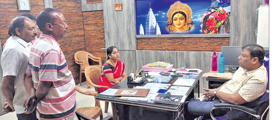
ସିଏସ୍ଓକୁ ଫେରାବ ହେଉଛି ଜିଲା ପରିଷଦ ଉପାଧ୍ୟକ୍ଷ ।