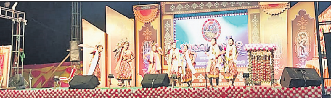
ମହୋତ୍ସବରେ ସ୍ଥାନୀୟ କଳାକାରଙ୍କ ସମ୍ବଲପୁରୀ ନୃତ୍ୟ ପରିବେଷଣ।