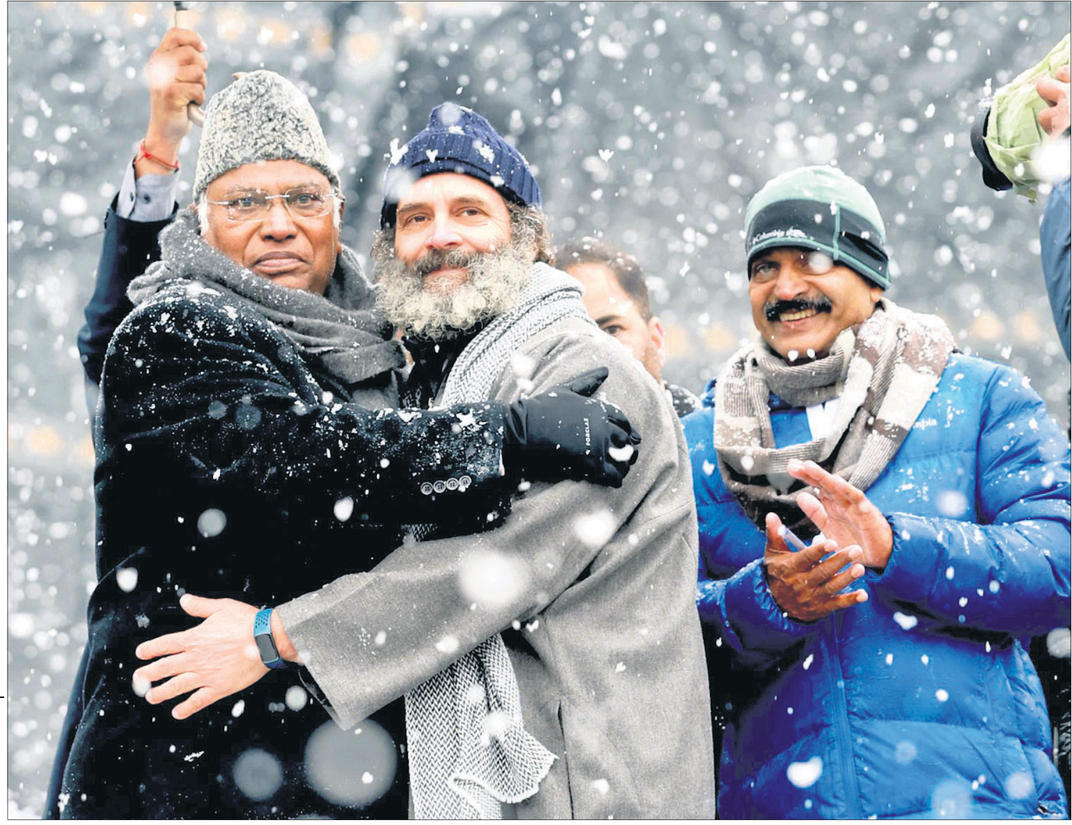
ଭାରତ ଯୋଡ଼ା ଯାତ୍ରାର ଶେଷ ଦିନ ଯୋମବାର ଶ୍ରୀନଗରରେ ଏଆଇସିସି ଅଧ୍ୟକ୍ଷ ମଲ୍ଲିକାର୍ଜୁନ ଖାର୍ଜେଙ୍କ ସହ କଂଗ୍ରେସ ନେତା ରାହୁଲ ଗାନ୍ଧୀ।