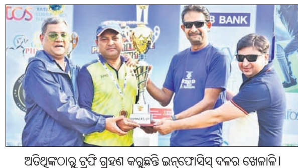
ଅତିଥିକଠାରୁ ଟ୍ରଫି ଗ୍ରହଣ କରୁଛନ୍ତି ଇନଫୋର୍ମେସିଭ୍ ଦଳର ଖେଳାଳି।

ରଥ ପ୍ରମୁଖ ଯୋଗ ଦେଇଥିଲେ। ଫାଇନାଲ ମ୍ୟାଚ ଆଇଟି କମ୍ପାନୀ ଇନଫୋର୍ମେସିଭ୍ ଏବଂ ତ୍ରୈବି ବ୍ୟାଙ୍କ ମଧ୍ୟରେ ଅନୁଷ୍ଠିତ ହୋଇଥିଲା। ତ୍ରୈବି ବ୍ୟାଙ୍କ ଦଳ ୨୦୦୬ରରେ ୫ ଉଲ୍ଲେଖନୀୟ ହରାଇ ମୋଟ ୧୩୪ ରନ୍ ସଂଗ୍ରହ କରିଥିବା ବେଳେ ବିପକ୍ଷ ଇନଫୋର୍ମେସିଭ୍ ଦଳ ୧୯.୩ ଓଭରରେ ୬ ଉଲ୍ଲେଖନୀୟ ହରାଇ ୧୩୫ରନ୍ ଚାମ୍ପିୟନ୍ ହୋଇଥିଲା। ଇନଫୋର୍ମେସିଭ୍ ପାର୍ଟି ସାମାଜ ମ୍ୟାନ ଅଫ ଦି ମ୍ୟାଚ ହୋଇଥିବା ବେଳେ ତ୍ରୈବିର ଦେବ କଲ୍ୟାଣୀ ମ୍ୟାନ୍ ଅଫ ଦି ଦିନିକି ସହ ଶ୍ରେଷ୍ଠ ବୋଲର ଭାବେ ପୁରସ୍କୃତ ହୋଇଥିଲେ।