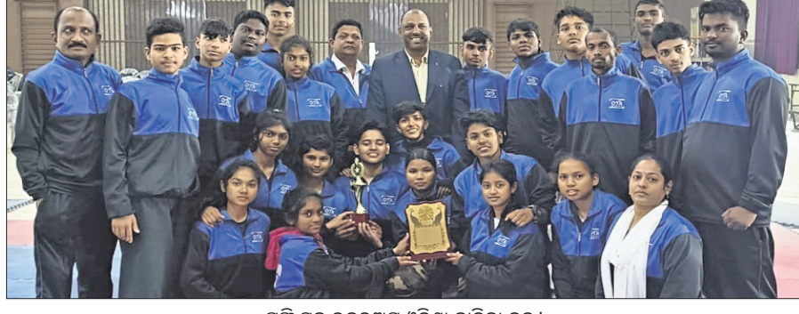
ଟ୍ରଫି ସହ ରନରଅପ୍ ଓଡ଼ିଶା ବାଲିକା ଦଳ।