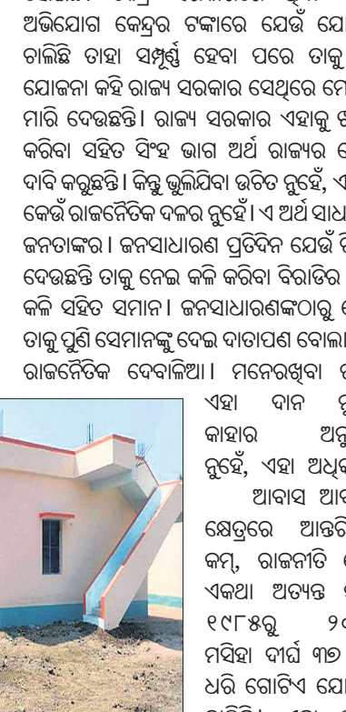
ଦେଖାଯାଉଛି ଲକ୍ଷ ଲକ୍ଷ ଲୋକଙ୍କର ଆବେଦି ଘର ନାହିଁ । ବସନ୍ତ, ଷ୍ଟେଶନ, ରାସ୍ତାକଡ଼ର ଖୋଲା ଆକାଶ ତଳେ ଅତି ଦୟନୀୟ ଅବସ୍ଥାରେ ଏମାନେ ଜୀବନ ବିତାଉଛନ୍ତି । ପ୍ରଶ୍ନ ଆସେ ଆଉ କେତେ ବର୍ଷ ଲାଗିବ ବାସଗୃହ ଭଳି ମୌଳିକ ଅଧିକାରଟି ସମସ୍ତଙ୍କ ନିକଟରେ ପହଞ୍ଚାଇବାକୁ ? ଯିଏ ଯାହାକୁ ଯେତେ ଦୋଷାରୋପ କରୁନା କାହିଁକି ସେତେଦିନ ଯାଏ ଏହି ସମସ୍ୟା ଅସମାହିତ ହୋଇ ରହିଥିବ, ଯେ ପର୍ଯ୍ୟନ୍ତ ଆମେ ନିଜକୁ ରାଜନୈତିକ ଫାଇଦାଠାରୁ ଦୂରେଇ ରଖି ନ ପାରିବା । ଦଳମତ ନିର୍ଦ୍ଦେଶରେ ଯଦି ସମସ୍ତଙ୍କୁ

ଆପଣେଇ ନେଇପାରିବା ନାହିଁ ତେବେ କାହାର ପୁଷ୍ଟ ମାତ୍ର ତ କାହା ପାଇଁ ସର୍ବନାଶ ହେବା ସାର ହେବ । ମୃତ୍ୟୁ ହିତାଧିକାରୀ ଚୟନ କ୍ଷେତ୍ରରେ ଥିବା ତୁଟିଗୁଡ଼ିକୁ ସଂଶୋଧନ ନ କରିବା ଯାଏ ଯୋଜନା ବାଟବଣା ହେବ ହିଁ ହେବ । ଆବାସ ଯୋଜନାରେ ଯୋଗ୍ୟ ହିତାଧିକାରୀ ଚୟନ ପାଇଁ ଯେଉଁ ସବୁ ପ୍ରାବଧାନ ଅଛି ସେଗୁଡ଼ିକୁ ଦେଖିଲେ ମନେହୁଏ ସୂର୍ଯ୍ୟ ଚନ୍ଦ୍ର ଥିବା ଯାଏ ବୋଧହୁଏ ଦେଶରେ କିଛି ଲୋକଙ୍କର କତା ଘର ଥିବ । ଯଦି ମାଛ ଧରା ତଳା, ତିନି ଚକିଆ ଯାନ, ମୋଟର ସାଇକେଲ, ଗାରି ଚକିଆ ଗାଡ଼ି ଏପରି ଚି କୃଷି ମନ୍ତ୍ରାଂଶ, ଫୁଲ, ପାଞ୍ଚ ଏକର ଜଳସେଚିତ ଜମି ଥିଲେ, ପରିବାରର ମାସିକ ଆୟ ଦଶ ହଜାର ଟଙ୍କା ହୋଇଥିଲେ, ପରିବାରର କେହି ପ୍ରଫେଶନାଲ ଚିକିତ୍ସା ଦେଉଥିଲେ ଆବାସ ମିଳିବ ନାହିଁ, ଖୁସ୍ତୁତି ଘରେ ରହୁଥିଲେ ମଧ୍ୟ । ଗୋଟିଏ ପଟେ ଏହି ସବୁ ସର୍ତ୍ତ ଅନ୍ୟ ପଟେ କେହି କତା ଘରେ ରହିବେ ନାହିଁ ବୋଲି ଯୋଷଣା ପ୍ରସ୍ତାବନା ନା ରାଜନୈତିକ ହତଚମତ ରୁଡ଼ିବା କଷ୍ଟସାଧ୍ୟ । ଇଟା, ଲୁହାଛଡ଼, ସିମେଣ୍ଟର ମୂଲ୍ୟ ବୃଦ୍ଧି ପାଉଥିବା ବେଳେ ଆବାସ ଯୋଜନାରେ ଏକ ଲକ୍ଷ କୋଟିଏ ହଜାର ଟଙ୍କାରେ କେତେ ବଡ଼ ପଙ୍କା ଘର ନିର୍ମାଣ ହୋଇପାରିବ ତାହା କାହାକୁ ଅଜଣା ? ଏ ପର୍ଯ୍ୟନ୍ତ କେହି ଭାବିଲେ ନାହିଁ ଏକ ବଖରା ଘରେ ପିଲାମାନେ ପଢ଼ିବେ କେଉଁଠି, ଅନ୍ୟମାନେ ରହିବେ କେଉଁଠି ? ଘରର ଆବାସପତ୍ର ରହିବ କେଉଁଠି ? ତଥାପି ଆବାସ ଯୋଜନାର ତାଲିକାରେ ନିଜ ନାଆଁଟିକୁ ସ୍ଥାନିତ କରିବା ପାଇଁ ଯେଉଁ ଲକ୍ଷ ଲାଜନ ଲାଗିଛି ତାହା ଆମ ଲୋକଙ୍କ ଅର୍ଥନୈତିକ ଅବସ୍ଥାର ଅସଲ ଚିତ୍ରକୁ ଡୋଳି ଧରୁଛି । ଆଉ ପ୍ରକୃତ ହିତାଧିକାରୀ ହୋଇ ମଧ୍ୟ ଏଥିରୁ ବହୁ ଲୋକ ବାରମ୍ବାର ବାଦ ପଡ଼ିବା ଆମ ବ୍ୟବସ୍ଥାର ତୁଟିକୁ ପର୍ଯ୍ୟାପଣ କରୁଛି ।