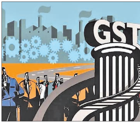
ବେଳେ ସେଥିମଧ୍ୟରୁ କେନ୍ଦ୍ରୀୟ ଟିକସ (ଜିଏସ୍ଟି) ୨୮,୯୬୩ କୋଟି ଟଙ୍କା

ସଂଗ୍ରହ ସମ୍ପର୍କରେ ମଙ୍ଗଳବାର ଅର୍ଥ ମନ୍ତ୍ରଣାଳୟ ପକ୍ଷରୁ ବିସ୍ତୃତ ସୂଚନା ପ୍ରଦାନ କରାଯାଇଛି। ବିଶେଷକରି ଚଳିତ ବର୍ଷ ଜାନୁୟାରୀରେ ଦେଶର ଜିଏସ୍ଟି ସଂଗ୍ରହ ୧.୫୬ (୧,୫୫,୯୨୨) ଲକ୍ଷ କୋଟି ଟଙ୍କା ଟିକସ ଆଦାୟରେ ସଂଗ୍ରହ କରାଯାଇଛି। ଅପରପକ୍ଷରେ ୨୦୨୨ ଜାନୁୟାରୀରେ ସଂଗ୍ରହୀତ ଜିଏସ୍ଟି ରାଜସ୍ୱ ଅପେକ୍ଷା ୨୦୨୩ ଜାନୁୟାରୀର ଟିକସ ସଂଗ୍ରହ ପ୍ରାୟ ୨୪% ଅଧିକ ବୋଲି ମନ୍ତ୍ରଣାଳୟ ପକ୍ଷରୁ ଜଣାଯାଇଛି। ଉଲ୍ଲେଖଯୋଗ୍ୟ, ୨୦୨୩ ଜାନୁୟାରୀରେ ସଂଗ୍ରହୀତ ମୋଟ ଜିଏସ୍ଟି ରାଜସ୍ୱ ୧,୫୫,୯୨୨ ଲକ୍ଷ କୋଟି ରହିଥିବା