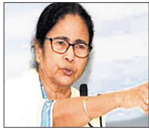
ପଶ୍ଚିମବଙ୍ଗ ମୁଖ୍ୟମନ୍ତ୍ରୀ ମମତା ବାନାର୍ଜୀ

ପଶ୍ଚିମବଙ୍ଗ ମୁଖ୍ୟମନ୍ତ୍ରୀ ମମତା ବାନାର୍ଜୀ ମଙ୍ଗଳବାର ଅଭିଯୋଗ କରିଛନ୍ତି ଯେ କେନ୍ଦ୍ରର ଭାଜପା ସରକାର ନାଗରିକତ୍ୱ ସଂଶୋଧନ ଅଧିନିୟମ (ସିଏଏ) ଲାଗୁ କରିବା ନାମରେ ଲୋକଙ୍କୁ ବିଭ୍ରାନ୍ତ କରୁଛନ୍ତି। ତିନିଦିନ ପୂର୍ବରୁ ମାଲଦାରେ ଆୟୋଜିତ ଏକ ସରକାରୀ କାର୍ଯ୍ୟକ୍ରମରେ ଏଭଳି କହିଛନ୍ତି। ଆଜି ଦୀର୍ଘ ଦିନ ଧରି ମମତା ପ୍ରସ୍ତାବର ଲୋକଙ୍କ ଯତ୍ନ ନେଉଛନ୍ତି କିନ୍ତୁ କେନ୍ଦ୍ର ସରକାର ପାଖରେ ଆସୁଛି, ଭାଜପା ସେମାନଙ୍କ ପାଖକୁ ଯାଇ ସିଏଏକୁ ରଦ୍ଦକରି ଦେବା ପାଇଁ ସେମାନଙ୍କର ବନ୍ଧୁ ବୋଲି ଦାବି କରୁଛନ୍ତି। ମମତା ପ୍ରସ୍ତାବର ପୂର୍ବ ପାକିସ୍ତାନ ପ୍ରସ୍ତାବ ସମ୍ପର୍କରେ ମମତା ବାନାର୍ଜୀ ପାର୍ଥୀ ଏବଂ ଶ୍ରୀକ୍ଷିତା ସମ୍ପ୍ରଦାୟର ପ୍ରତ୍ୟାଶାକୁ ନାଗରିକତ୍ୱ ପ୍ରଦାନ ପାଇଁ ନାଗରିକତ୍ୱ ସଂଶୋଧନ ଅଧିନିୟମ ପ୍ରଦାନ କରାଯାଇଛି। ତେବେ ଏପର୍ଯ୍ୟନ୍ତ ଏହି ଆଇନ ଅନୁଯାୟୀ କାହାକୁ ନାଗରିକତ୍ୱ ଦିଆଯାଇ ନାହିଁ, କାରଣ କେନ୍ଦ୍ର ସରକାର ଏ ବାବଦରେ ଏପର୍ଯ୍ୟନ୍ତ ନିର୍ଣ୍ଣୟ କରିନାହାନ୍ତି। ମମତା ମଧ୍ୟ ଭାଜପା ନେତୃତ୍ୱାଧୀନ କେନ୍ଦ୍ର ସରକାର ରାଜ୍ୟ ସରକାରଙ୍କ ବଦଳରେ ଦେଇ ପ୍ରଦାନ କରୁ ନ ଥିବା ଅଭିଯୋଗ କରିଛନ୍ତି।