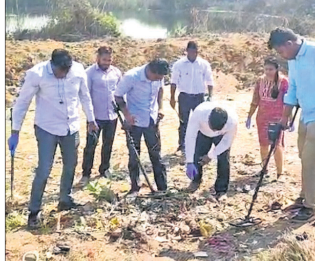
କ୍ରାଇମ୍‌ଟ୍ରାଷ୍ଟି ପୋଲିସ୍ ଟିମ୍ ଗୁଳିକାଣ୍ଡ ସ୍ଥାନରେ ପ୍ରାତି ତିନେକଣ୍ଠନ କ୍ୟାମେରା ଲଗାଇ ତଦନ୍ତ କରୁଛି।