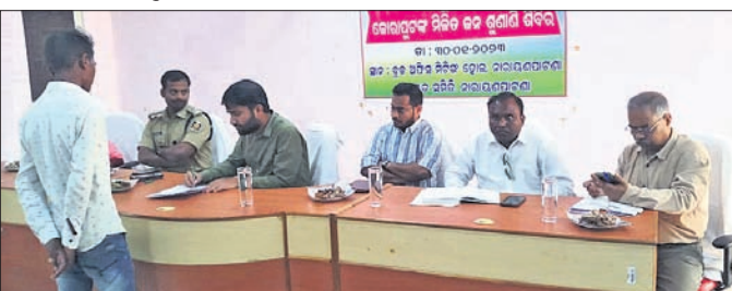
ଅଭିଯୋଗ ଶୁଣିଛନ୍ତି ଜିଲ୍ଲାପାଳ।