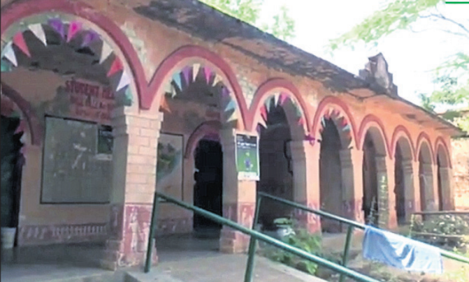
ରୁଣ୍ଡାଗୁଡ଼ା ପ୍ରାଥମିକ ବିଦ୍ୟାଳୟ।

କୋରାପୁଟ ପୌରାଞ୍ଚଳ ଅଧୀନ ରୁଣ୍ଡାଗୁଡ଼ା ପ୍ରାଥମିକ ବିଦ୍ୟାଳୟ ଏବେ ବିପଦସଙ୍କୁଳ ଅବସ୍ଥାରେ ରହିଛି। ପାଠପଢ଼ା ଚାଲୁଥିବାବେଳେ ବିଦ୍ୟାଳୟ ଗୃହ ଛାତ୍ରକୁ କଂକ୍ରିଟ ଖସୁଛି। ଏନେଇ ଅଭିଭାବକମାନେ ପୌର ପ୍ରଶାସନ ଓ ଶିକ୍ଷା ବିଭାଗ ନିକଟରେ ବିଦ୍ୟାଳୟର ମରାମତି ନେଇ ଦାବି କରିଛନ୍ତି। ପ୍ରଥମରୁ ୫ ଶ୍ରେଣୀ ଯାଏ ରହିଥିବା ଏହି ବିଦ୍ୟାଳୟରେ ୧୬ ଜଣ ଛାତ୍ରାଛାତ୍ରୀ ପାଠ ପଢୁଛନ୍ତି। ବିଦ୍ୟାଳୟରେ ଦୁଇଟି ଗୃହ ରହିଥିବାବେଳେ ଏହି ଗୃହଗୁଡ଼ିକର କାନ୍ଥ ଫାଟି ଥାଏ। ଖାତରୁ ସିମେଣ୍ଟ ପାଖୁର ଖସୁଥିବା ଜଣାପଡିଛି। ବିଦ୍ୟାଳୟରେ ଯୋଗଦାନ ପାଠପଢ଼ା ଚାଲିଥିବାବେଳେ ଶ୍ରେଣୀ ଗୃହର ଛାତରୁ ଏକ ସିମେଣ୍ଟ ଖଣ୍ଡ ଖସି ଜଣେ ଛାତ୍ରୀଙ୍କ ବ୍ୟାଗ ଉପରେ ପଡିଥିଲା। ଫଳରେ ଛାତ୍ରୀ ଜଣକ ବର୍ତ୍ତମାନ ଉପଚିକିତ୍ସିତ।