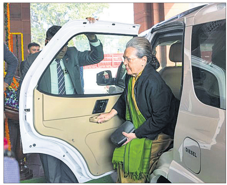
କେନ୍ଦ୍ର ସେବନ ପ୍ରଥମ ଦିନ ମଙ୍ଗଳବାର ପାଲିମେଣ୍ଟ ଭବନକୁ ପ୍ରବେଶ ପାଇଁ ଗାଡ଼ିକୁ ଉତ୍ତରାଧିକାରୀ କର୍ମଚାରୀଙ୍କୁ ଯୋଗାଇ ଦିଆଯାଇଛି।

ସେଠାରେ ଯୋଗୁ ୧୯୫୦ ଦଶକରୁ ସେମାନେ ପଶ୍ଚିମବଙ୍ଗକୁ ସ୍ଥାନାନ୍ତର ହେବା ଆରମ୍ଭ କରିଥିଲେ। ଆଫଗାନିସ୍ତାନ, ବାଂଲାଦେଶ ଏବଂ ପାକିସ୍ତାନରୁ ଆସୁଥିବା ହିନ୍ଦୁ, ଶିଖ, ବୌଦ୍ଧ, ଜୈନ, ପାର୍ଥୀ ଏବଂ ଶ୍ରୀକ୍ଷିତା ସମ୍ପ୍ରଦାୟର ପ୍ରବାସୀଙ୍କୁ ନାଗରିକତ୍ୱ ପ୍ରଦାନ ପାଇଁ ନାଗରିକତ୍ୱ ସଂଶୋଧନ ଅଧିନିୟମ ପ୍ରଦାନ କରାଯାଇଛି। ତେବେ ଏପର୍ଯ୍ୟନ୍ତ ଏହି ଆଇନ ଅନୁଯାୟୀ କାହାକୁ ନାଗରିକତ୍ୱ ଦିଆଯାଇ ନାହିଁ, କାରଣ କେନ୍ଦ୍ର ସରକାର ଏ ବାବଦରେ ଏପର୍ଯ୍ୟନ୍ତ ନିର୍ଣ୍ଣୟ କରିନାହାନ୍ତି। ମମତା ମଧ୍ୟ ଭାଜପା ନେତୃତ୍ୱାଧୀନ କେନ୍ଦ୍ର ସରକାର ରାଜ୍ୟ ସରକାରଙ୍କ ବଦଳରେ ଦେଇ ପ୍ରଦାନ କରୁ ନ ଥିବା ଅଭିଯୋଗ କରିଛନ୍ତି।