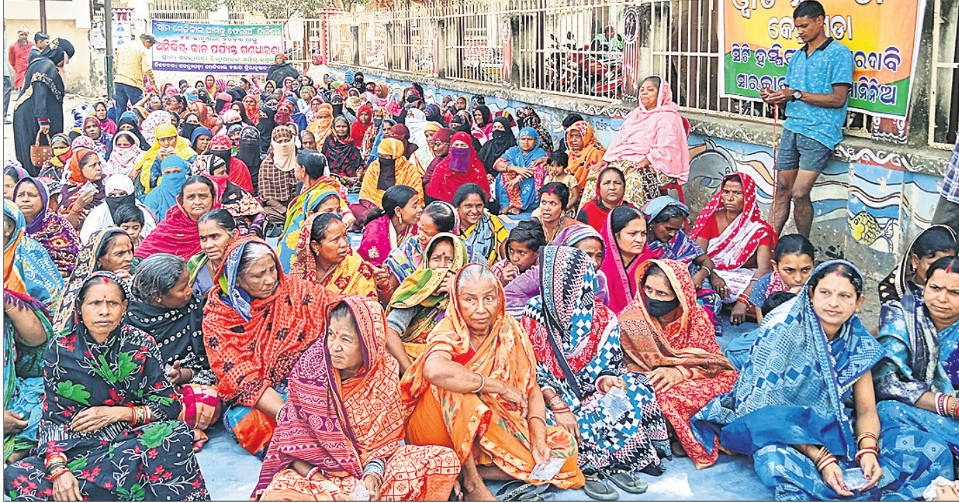
ସିଟି ହସ୍ପିଟାଲ ଦାବିରେ କେନ୍ଦ୍ରାପଡ଼ା ଜିଲ୍ଲାପାଳଙ୍କ କାର୍ଯ୍ୟାଳୟ ସମ୍ମୁଖରେ ଧାରଣା ଦେଇ ମହିଳା ଓ ଅନ୍ୟମାନେ।