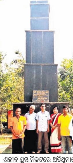
ଶହୀଦ ସ୍ତମ୍ଭ ନିକଟରେ ଅତିଥିମାନେ।