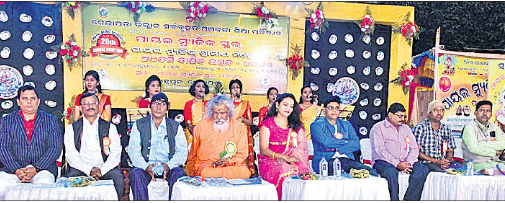
ଉତ୍ସବରେ ମଞ୍ଚାସୀନ ଅତିଥିମାନେ।