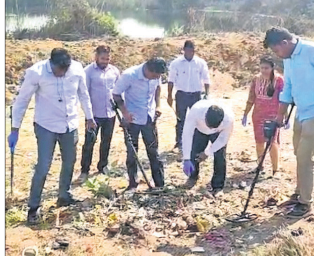
କ୍ରାଇମ୍‌ଟ୍ରାଷ୍ଟି ପୋଲିସ୍ ଟିମ୍ ଗୁଳିକାଣ୍ଡ ସ୍ଥାନରେ ପ୍ରୀତି ତିନେକ୍ଷଣ କ୍ୟାମେରା ଲଗାଇ ତଦନ୍ତ କରୁଛି।

ଝାରସୁଗୁଡ଼ା ଅଫିସ୍, ୩୧.୧ ପ୍ରକରାଜନଗର ଗାନ୍ଧୀ ଛକଠାରେ ସ୍ୱାସ୍ଥ୍ୟମନ୍ତ୍ରୀ ନବ କିଶୋର ଦାସଙ୍କୁ ଗୁଳିମାଡ଼ କରାଯାଇଥିଲା। ଏହି ସ୍ଥାନକୁ କ୍ରାଇମ୍‌ଟ୍ରାଷ୍ଟି ପୋଲିସ୍ ରିଭିଜରାଉଁ ସିଲ୍ କରି ପ୍ରୀତି ତିନେକ୍ଷଣ କ୍ୟାମେରା ଲଗାଇ ତଦନ୍ତ କରାଯାଇଛି।