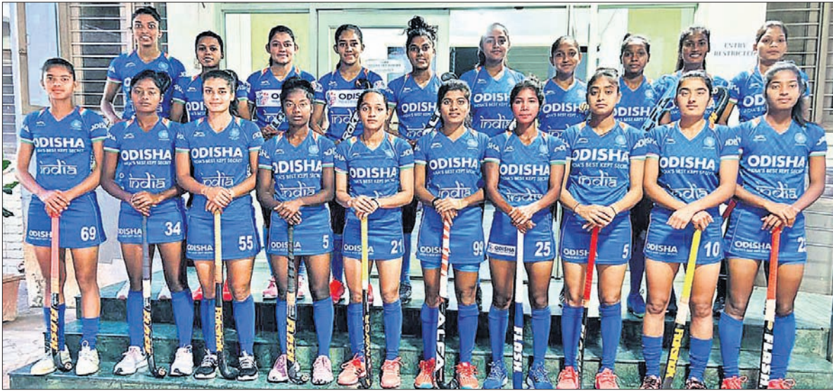
ଦକ୍ଷିଣ ଆଫ୍ରିକା ଗସ୍ତ ପାଇଁ ନନୋନାଟ ଭାରତୀୟ ଲକ୍ଷ୍ମୀ ପିଠା କ୍ୟୁରେଟର ଦଳର ସଭ୍ୟମାନଙ୍କର ଗ୍ରୁପ୍ ଫଟୋ