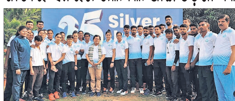
ଓଡ଼ିଶା ଭଲିବଲ ଦଳର ସଦସ୍ୟଙ୍କ ଗହଣରେ କିଂ ଓ କିଂସ୍ ପ୍ରତିଷ୍ଠାତା ତଥା ଏମ୍ପି ଅଲୁଟ ସାମନ୍ତ