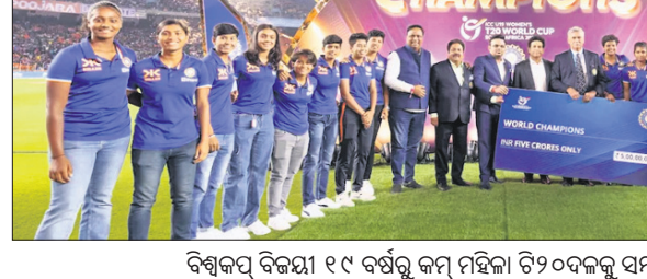
ବିଶ୍ୱକପ୍ ବିଜୟୀ ୧୯ ବର୍ଷରୁ କମ୍ ମହିଳା ଟି୨୦ଦଳକୁ ସମ୍ବର୍ଦ୍ଧିତ କରାଯାଇଛି।

ଅନେକ ବାଳିକା ଓ ମହିଳାଙ୍କୁ ନିଜର ସ୍ୱପ୍ନ ପୂରଣର ରାସ୍ତା ଦେଖାଇବା ବୋଲି କହିଛନ୍ତି ତେନ୍ଦୁଲକର। ଭାରତୀୟ ଦଳର ଏହି ସଫଳତା ପାଇଁ ଦୁଇଜଣ ଶୁଭେଚ୍ଛା ଜଣାଇବାକୁ ଚାହୁଁଛି। ମୋର କ୍ରିକେଟର ସ୍ୱପ୍ନ ୧୯୮୩ ବିଶ୍ୱକପ୍ ବିଜୟ ପରଠାରୁ ଆରମ୍ଭ ହୋଇଥିଲା। ଏହି ବିଶ୍ୱକପ୍ ବିଜୟ ସେମିତି ଲକ୍ଷ ଲକ୍ଷ ନୂତନ ସ୍ୱପ୍ନକୁ ଜନ୍ମ ଦେବ ବୋଲି କହିଛନ୍ତି ତେନ୍ଦୁଲକର। କେବଳ କ୍ରୀଡ଼ା ରୁହେଁ ବରଂ ବାସ୍ତବ ଜୀବନରେ ଭଲ ସୂଚକ ଓ ମହିଳାଙ୍କୁ ସମାନ ସୁଯୋଗ ମିଳିବା ଉଚିତ। ଆଗାମୀ ଦିନରେ ଓମେନ୍ ପ୍ରିମିୟର ଲିଗ୍ ମହିଳା କ୍ରିକେଟକୁ ଏକ ନୂତନ ସୋପାନରେ ପହଞ୍ଚାଇବାରେ ସମର୍ଥ ହେବ ବୋଲି ସେ କହିଛନ୍ତି। ମହିଳା କ୍ରିକେଟର ବିକାଶ ପାଇଁ ବିସିଆଇ ପକ୍ଷରୁ ସମସ୍ତ ପଦକ୍ଷେପ ଗ୍ରହଣ କରାଯାଉଛି ଏବଂ ଆଗାମୀ ଦିନରେ ମହିଳା କ୍ରିକେଟ ଆହୁରି ଉନ୍ନତ କରିବ ବୋଲି ସେ କହିଥିଲେ।