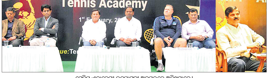
ଚେନିସ ଏକାଡେମୀ ଉଦ୍ଘାଟନା ଅବସରରେ ଅତିଥିମାନେ।

ଭୁବନେଶ୍ୱର, ୧୨ (କ୍ରୀଡ଼ା ପ୍ରତିନିଧି) ଜର୍ମାନୀର ପୂର୍ବତନ ଗ୍ରାଣ୍ଡ ସ୍ଲାମ୍ ତାରକା ଆଲେକଜାଣ୍ଡର ଖାସକେ ତାଲିମ ଦେବେ