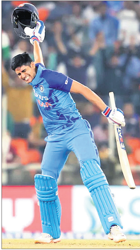
ଶତକ ହାସଲ ପରେ ଶୁବମନ ଗିଲ୍।

ଲିମ୍‌ସ ଖେଳିଥିଲେ। ୨୨ ବଲର ତ୍ରିପାଠୀଙ୍କ ଇନିଂସରେ ୪ ଚୋକା ଓ ୩ ଛକା ସାମିଲ ଥିଲା। ଗିଲ୍‌ଙ୍କ ସହ ୮୦ ରନ୍ ଯୋଗ କରିବା ପରେ ତ୍ରିପାଠୀ ପ୍ୟାଟିଲିୟନ ଫେରିଥିଲେ। ଆରମ୍ଭରୁ ଗିଲ୍ ସାମାନ୍ୟ ଧ୍ୱାମା ବ୍ୟାଟିଂ କରିଥିଲେ। ତ୍ରିପାଠୀ ଏବଂ ସୂର୍ଯ୍ୟକୂମାର ଆକ୍ରମଣ କରିଥିବା ବେଳେ ଗିଲ୍ ଇନିଂସ ସମାପ୍ତ କରିଥିଲେ।