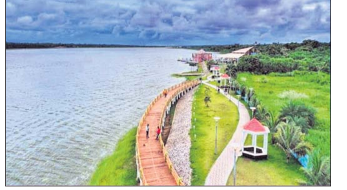
ତାମିରା ହ୍ରଦ ।

ସ୍ୱରାଜ୍ୟ ବିଶ୍ୱ ପାଳନ କରିଛି ଆଦୁଭୂମି ଦିବସ। ନୂଆକରି ରାମସର ଆଦୁଭୂମି (୨୪୮୯) ଚାଲିକାରେ ସାମିଲ ହୋଇଥିବା ଗଞ୍ଜାମ ଜିଲାର ତାମିରା ହ୍ରଦଠାରେ ଏହି ଦିବସ ପାଳନ କରାଯାଇଛି। ଏଥିରେ ବନ ବିଭାଗ ଏବଂ ବ୍ରହ୍ମପୁର ବିଶ୍ୱ ବିଦ୍ୟାଳୟର ଛାତ୍ରୀଛାତ୍ରଙ୍କ ସମେତ ବିଭିନ୍ନ ଗବେଷକ ଯୋଗଦେଇ କାବସଭା ବଞ୍ଚିରହିବା ପାଇଁ ଆଦୁଭୂମିର ଆବଶ୍ୟକତା ଏବଂ କେମିତି ଏହାର ସୁରକ୍ଷା କରାଯିବ ଏହି ବିଷୟରେ ଆଲୋଚନା କରିଥିଲେ। ଏହାପରେ ଏକ ରାଲି କରାଯାଇ ଆଦୁଭୂମିକୁ ସଂରକ୍ଷଣ କରି ରଖିବା, ପରିବେଶ ପ୍ରଭୁକ୍ଷଣକୁ ରୋକିବା