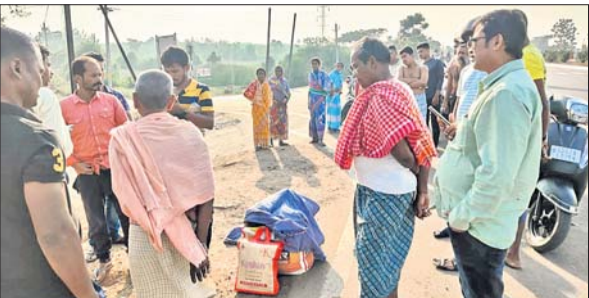
ମୃତଦେହ ପଠାଇବା ବ୍ୟବସ୍ଥା କରୁଥିବା ପୁଲିସ୍ ଅଫିସରେ ।