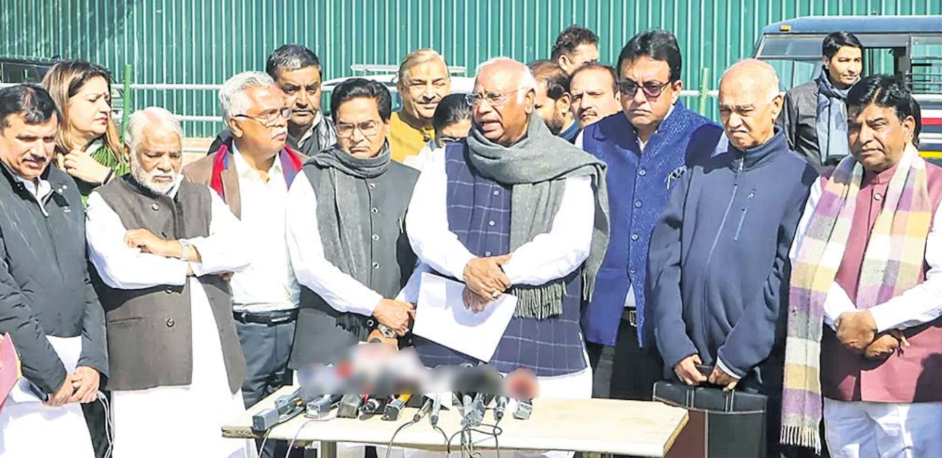
ପାଇଁମେଣ୍ଟ ବାହାରେ ଗୁରୁବାର କଂଗ୍ରେସ ଅଧ୍ୟକ୍ଷ ମଲ୍ଲିକାର୍ଜୁନ ଖାଟ୍ଟରଙ୍କ ସମେତ ବିରୋଧୀ ନେତାମାନେ ଜେପିସି ତଦନ୍ତ ଦାବି କରୁଛନ୍ତି।

ବିଶିଷ୍ଟ ଶିଳ୍ପପତି ଗୌତମ ଆଦାନୀଙ୍କ ଅନୁଧ୍ୟାୟୀ ବିନ ବଡ଼ିବାରେ ଲାଗିଛି। ଆଦାନୀ ସମ୍ବନ୍ଧରେ ବିରୋଧରେ ଆମେରିକାୟ ଆକୃଷ୍ଟ ଲନ୍ଦନରେ ହିନ୍ଦି-ନର୍ତ୍ତକ ରିଭର୍ ଆର୍ଟିଷ୍ଟା ସ୍କୁଲ ଓ ଆକାଉଣ୍ଟସ ହେଉଥିବା ଅଭିଯୋଗର ତଦନ୍ତ ଦାବି ଭାରତରେ ଜାରି ରହିଛି। ମୁମ୍ବାଇର ପାଇଁମେଣ୍ଟ ବଜେଟ ଅଧିବେଶନର ତୃତୀୟ ଦିନରେ କଂଗ୍ରେସ ସମେତ ବିରୋଧୀ ଦଳଗୁଡ଼ିକ ଉଚ୍ଚ ପ୍ରସଙ୍ଗରେ ବିତର୍କ ଏବଂ ସ୍ତମ୍ଭ ସଂସଦାୟ କମିଟି (ଜେପିସି) ଦ୍ୱାରା ଅଭିଯୋଗଗୁଡ଼ିକର ତଦନ୍ତ ଦାବିରେ ଅଡ଼ିଗସ୍ତୁଅଛି। ବିପକ୍ଷର ସଦସ୍ୟମାନେ ଉଭୟ ଲୋକ ସଭା ଓ ରାଜ୍ୟ ସଭାରେ ଗୋପନ ଭାବେ ହତ୍ୟାକାଣ୍ଡ କରିଥିଲେ। ଫଳରେ ସୁଦ୍ଧା ସଦନରେ ଗୃହକାର୍ଯ୍ୟ ବାଧାପ୍ରାପ୍ତ ହୋଇଥିଲା। ହୋଇଛି। ମଧ୍ୟରେ ଗୃହକୁ ବାରମ୍ବାର ଘୃଷ୍ଣିତ କରିବାକୁ ପଡ଼ିଥିଲା। ଶେଷରେ ରାଜ୍ୟ ସଭା ଅଧ୍ୟକ୍ଷ ଏବଂ ଲୋକ ସଭା ବାଚସ୍ପତି ଗୃହକୁ ଦିନ ପାଇଁ ମୁଲତବା ଘୋଷଣା କରିଥିଲେ।