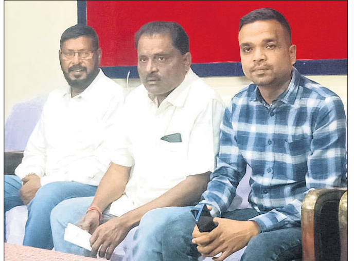
ବଲାଙ୍ଗୀର ସାମ୍ବାଦିକ ଭବନଠାରେ ବିଜେଡି ପକ୍ଷରୁ ଆୟୋଜିତ ଖବରଦାତା ସମ୍ମିଳନୀ।