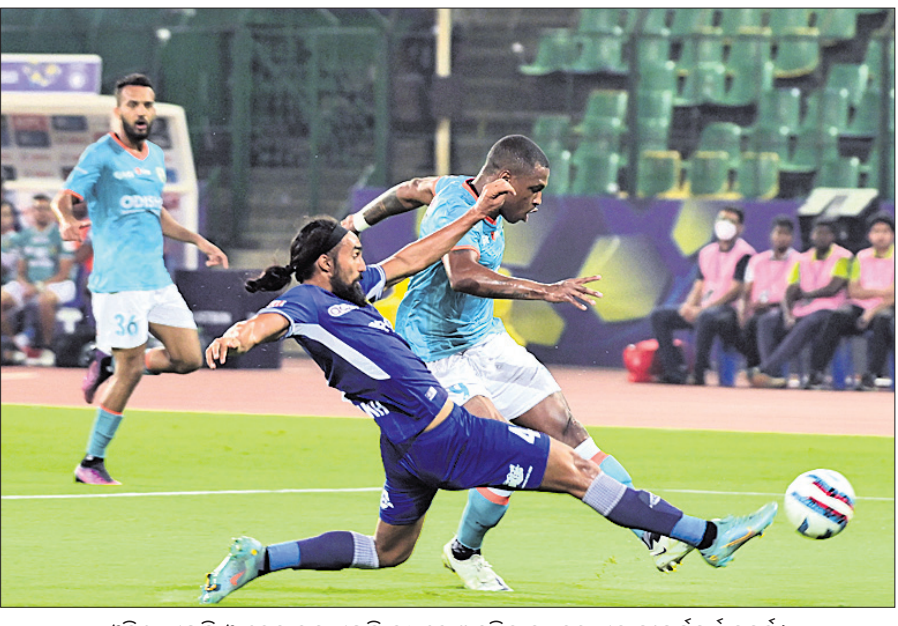
ଓଡ଼ିଶା ଏଫ୍‌ସି ଓ ଚେନାଇନ୍ ଏଫ୍‌ସି ମଧ୍ୟରେ ଅନୁଷ୍ଠିତ ମ୍ୟାଚର ଏକ ସଂଘର୍ଷପୂର୍ଣ୍ଣ ପୁରୁଣ୍ଡ।

ଚେନାଇ, ୨୧୨ ଚେନାଇର ଜବାହର ଲାଲ ନେହେରୁ କ୍ଷତ୍ରିୟମରେ ଖେଳାଯାଇଥିବା ଚେନାଇନ୍ ଏଫ୍‌ସି ବିପକ୍ଷ ମ୍ୟାଚରେ ପଏଣ୍ଟ ବାଣ୍ଟି ଓଡ଼ିଶା ଏଫ୍‌ସି। ଏହି ମ୍ୟାଚରୁ ଦଳ ୧ ପଏଣ୍ଟ ହାସଲ କରିଥିବା ବେଳେ ଦେଖାଲୁକୁ ଓଏଫ୍‌ସିକୁ ପଛରେ ପକାଇ ପଏଣ୍ଟ ଟେବଲର କ୍ଷତ୍ରିୟ ସ୍ଥାନକୁ ଦଳ ଉନ୍ନତ ହୋଇଛି। ନିର୍ଦ୍ଧାରିତ ସମୟରେ ମ୍ୟାଚ