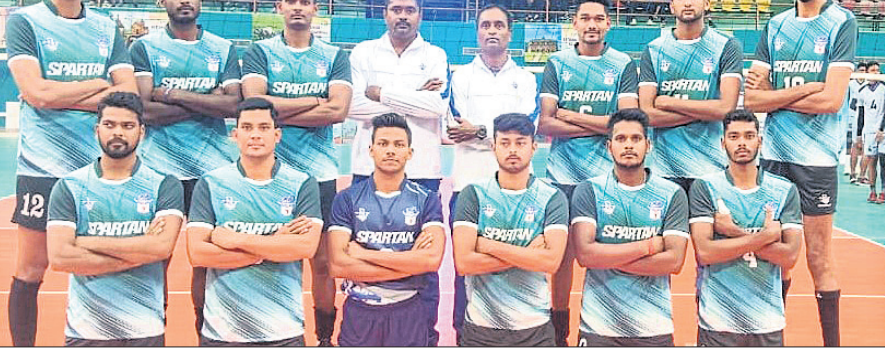
ଓଡ଼ିଶା ପୁରୁଷ ଭଲିବଲ୍ ଦଳ।