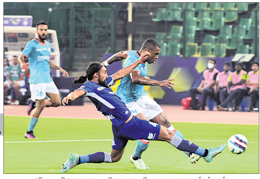
ଓଡ଼ିଶା ଏଫସି ଓ ଚେନାଇନ୍ ଏଫସି ମଧ୍ୟରେ ଅନୁଷ୍ଠିତ ମ୍ୟାଚର ଏକ ସଂଘର୍ଷପୂର୍ଣ୍ଣ ପୁରୁଣା।

ଚେନାଇ, ୨୧୨ ଚେନାଇର ଜବାହର ଲାଲ ନେହେରୁ କ୍ଷତ୍ରିୟମରେ ଖେଳାଯାଇଥିବା ଚେନାଇନ୍ ଏଫସି ବିପକ୍ଷ ମ୍ୟାଚରେ ପଏଣ୍ଟ ବାଣ୍ଟି ଓଡ଼ିଶା ଏଫସି। ଏହି ମ୍ୟାଚରୁ ଦଳ ୧ ପଏଣ୍ଟ ହାସଲ କରିଥିବା ବେଳେ ଦେଶାନ୍ତରୁ ଓଏଫସିକୁ ପଛରେ ପକାଇ ପଏଣ୍ଟ ଟେବଲର ଷଷ୍ଠ ସ୍ଥାନକୁ ଦଳ ଉଠାଇ ହୋଇଛି। ନିର୍ଦ୍ଧାରିତ ସମୟରେ ମ୍ୟାଚ