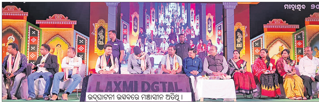
ଉଦ୍‌ଘାଟନା ଉତ୍ସବରେ ମଞ୍ଚାସୀନ ଅତିଥି।

ନୂଆଗାଁ ବ୍ଲକ ପଞ୍ଚୁପାଣ୍ଡବ ମହୋତ୍ସବ ଓ ପଲ୍ଲିଶ୍ରୀ ମେଳା ଗୁରୁବାର ନୂଆଗାଁ ମହାବିଦ୍ୟାଳୟ ସମ୍ମୁଖେ ଖେଳପଡ଼ିଆରେ ଉଦ୍‌ଘାଟିତ ହୋଇଯାଇଛି।