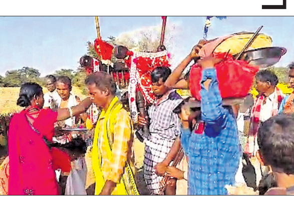
ମାଉଜିଙ୍କ ମଣ୍ଡେଇ ଯାତ୍ରା ।