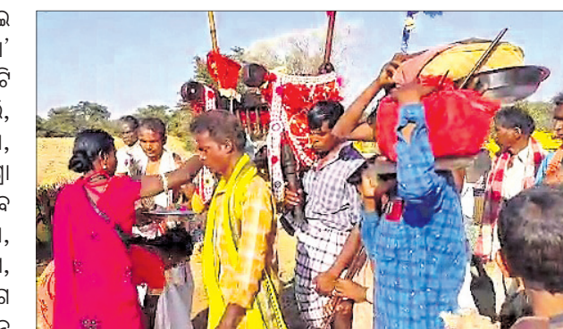
ମାଉଲିକ ମଣ୍ଡେଇ ଯାତ୍ରା।