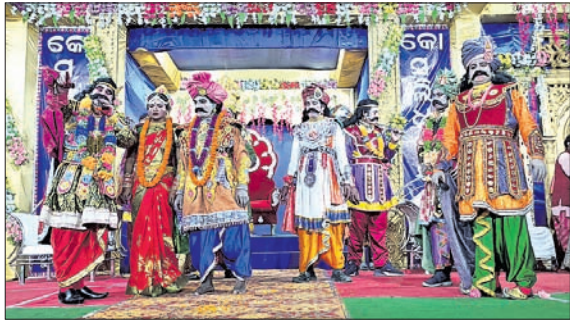
ପରିବେଷିତ ନାଟକର ଏକ ଦୃଶ୍ୟ ।