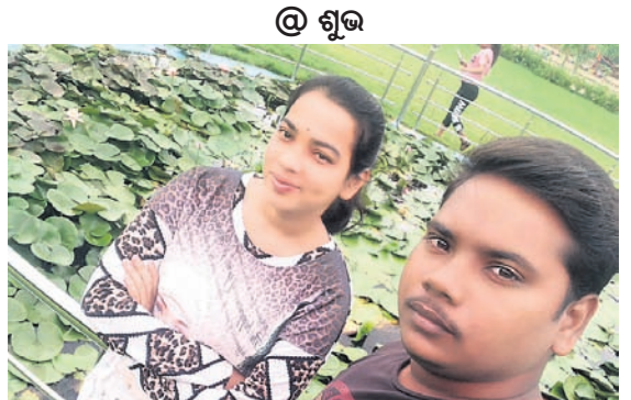
ସେଲ୍ଫି ପଠାଇବା ସମୟରେ ନିଜର ନାମ ଏବଂ ମୋବାଇଲ ନମ୍ବର ଦେବାକୁ ଭୁଲନ୍ତୁ ନାହିଁ ଯୋଗାଯୋଗ କରିବା ପାଇଁ ପ୍ରକାଶ ପାଇବ।

ମାଓବାଦୀ କ୍ୟାମ୍ପ ଠାରୁ ବିଭିନ୍ନ ସାମଗ୍ରୀ ଜବତ