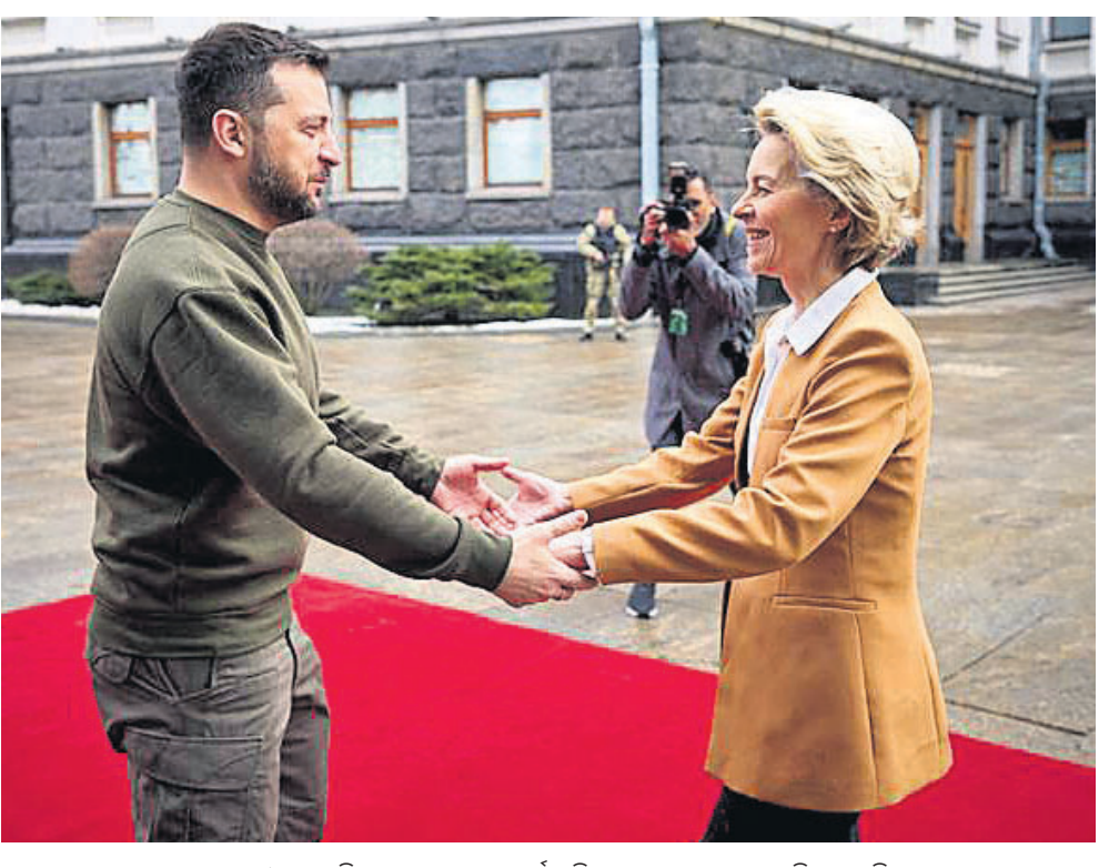
ଆସନ୍ତା ୨୪ରେ ଭୁବନେଶ୍ୱର ଆକ୍ରମଣକୁ ବର୍ଷେ ପୂରିବାକୁ ଥିବାବେଳେ ଯୁରୋପିଆନ୍ କମିଶନ ଅଧ୍ୟକ୍ଷା ରର୍ସୁଲା ଭୋର୍ଡେର ଲେୟୋନିଜ୍ କିଭରେ ସାଗତ କରୁଛନ୍ତି ଯୁକ୍ତେନ୍ଦ୍ର ରାଷ୍ଟ୍ରପତି ଭୋଲୋଡିମିର ଜେଲେନ୍ସ୍କି।

ବେଙ୍ଗାଳ, ୩୧: ଆରୁଧ୍ୟାବାକୁ କାଳିକଟ୍ ଯାଉଥିବା ଏୟାର ଇଣ୍ଡିଆ ଏକ୍ସପ୍ରେସ୍ ଏକ ବିମାନର ଗୋଟିଏ ଇଞ୍ଜିନ୍ରେ ନିଆଁ ଦେଖାଦେବାରୁ ଏହାକୁ ଆରୁଧ୍ୟାବା ବିମାନବନ୍ଦୀକୁ ଫେରାଇ ନିଆଯାଇ ଜରୁରୀ ଅବତରଣ କରାଯାଇଛି।