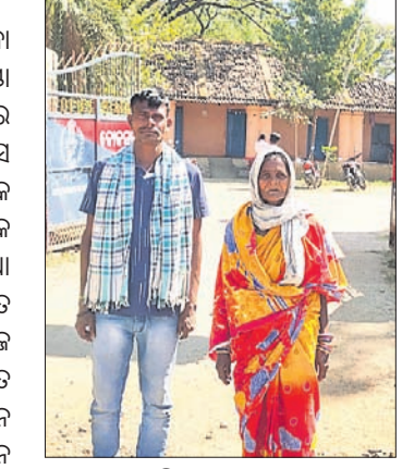
ସ୍ତ୍ରୀମାନେ ନିଖୋଜ ହେବା ପରେ ସ୍ତ୍ରୀ ଓ ପୁଅ ଆନାର ଦ୍ୱାରରୁ ହେଲେ ସ୍ତ୍ରୀ