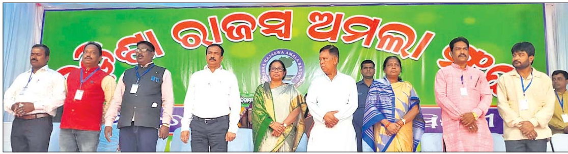
ଓଡ଼ିଶା ରାଜ୍ୟ ଅମଳା ସଂଘର ରାଜ୍ୟ ସମିଳନୀରେ ଉପସ୍ଥିତ ଅତିଥିମାନେ।