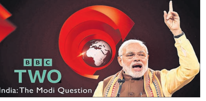
India: The Modi Question

ଭାରତର ପ୍ରଧାନ ବିଚାରପତି (ସିଜେଆଇ) ଡି.ଓ.ଇ. ଚନ୍ଦ୍ରବ୍ରତଙ୍କ ସହ ଶୁକ୍ରବାର ବେଞ୍ଚ ଶେୟାର କରିଛନ୍ତି ସିଦ୍ଧାପୁର ପ୍ରତିପକ୍ଷ ସୁନ୍ଦରେଶ ମେନନ୍।