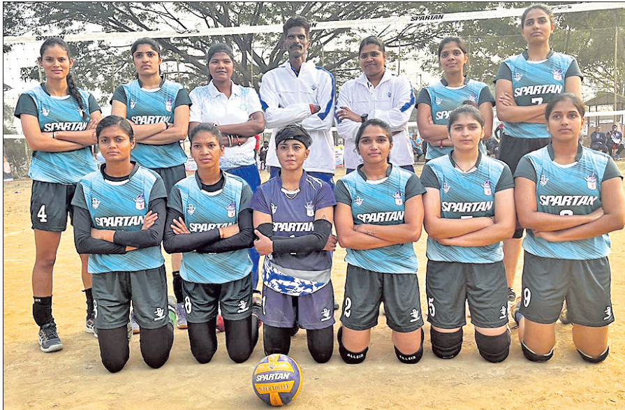
ଗୁଆହାଟୀରେ ଚାଲିଥିବା ଜାତୀୟ ସିନିୟର ଭଲିବଲରେ ଶୁକ୍ରବାର ପୁରୁଚେରାକୁ ହରାଇଥିବା ଓଡ଼ିଶା ମହିଳା ଦଳ।