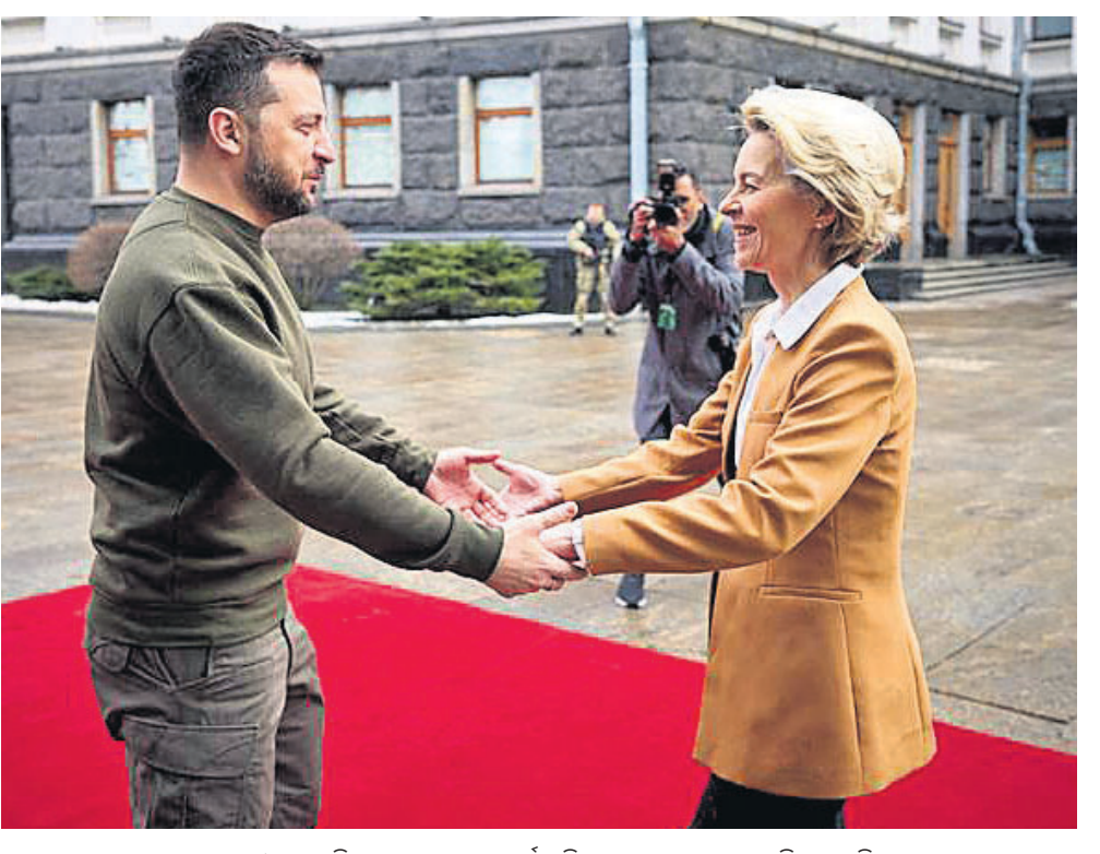
ଆସନ୍ତା ୨୪ରେ ଭୁବନେଶ୍ୱର ଆକ୍ରମଣକୁ ବର୍ଷେ ପୂରିବାକୁ ଥିବାବେଳେ ଯୁରୋପିଆନ୍ କମିଶନ ଅଧ୍ୟକ୍ଷା ରର୍ସୁଲା ଭୋର୍ ଡେର ଲେୟୋଙ୍କୁ ଜିଉରେ ସାଗତ କରୁଛନ୍ତି ଯୁକ୍ତେନ୍ଦ୍ର ରାଷ୍ଟ୍ରପତି ଭୋଲୋଡିମିର ଜେଲେନ୍ସ୍କି।

ବେଙ୍ଗାଳ, ୩୧: ଆରୁଧ୍ୟାବାକୁ କାଳିକଟ୍ ଯାଉଥିବା ଏୟାର ଇଣ୍ଡିଆ ଏକ୍ସପ୍ରେସ୍ ଏକ ବିମାନର ଗୋଟିଏ ଇଞ୍ଜିନ୍‌ରେ ନିଆଁ ଦେଖାଦେବାରୁ ଏହାକୁ ଆରୁଧ୍ୟାବା ବିମାନବନ୍ଦୀକୁ ଫେରାଇ ନିଆଯାଇ ଜରୁରୀ ଅବତରଣ କରାଯାଇଛି।