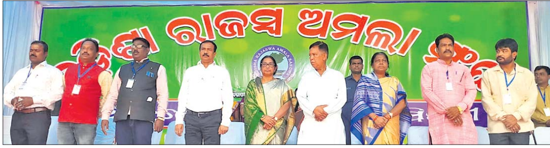
ଓଡ଼ିଶା ରାଜ୍ୟ ଅମଳା ସଂଘର ରାଜ୍ୟ ସମିଳନୀରେ ଉପସ୍ଥିତ ଅତିଥିମାନେ।