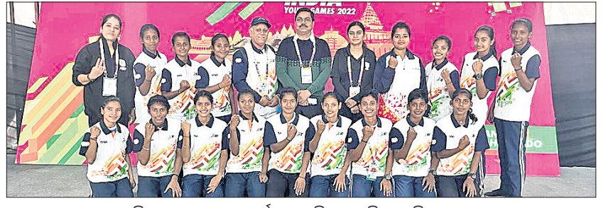
ଖେଳୋ ଇଣ୍ଡିଆ ଯୁଥ୍ ଗେମ୍ସରେ ସ୍ୱର୍ଣ୍ଣ ପଦକ ବିଜୟୀ ଓଡ଼ିଶା ବାଲିକା ଖୋ ଖୋ ଦଳ।