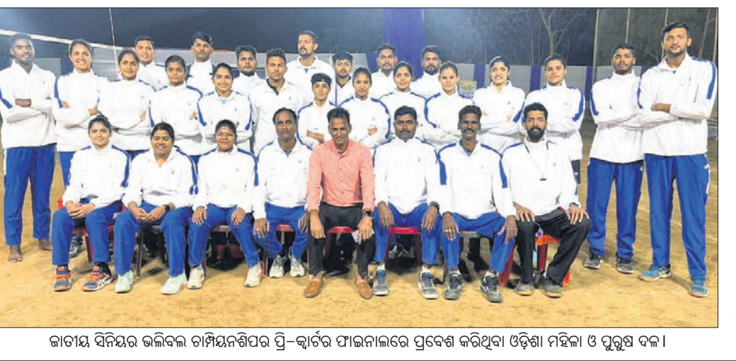
କାତୀୟ ସିନିୟର ଭଲିବଲ ଚାମ୍ପିୟନଶିପର ପ୍ରି-କ୍ୱାର୍ଟର ଫାଇନାଲରେ ପ୍ରବେଶ କରିଥିବା ଓଡ଼ିଶା ମହିଳା ଓ ପୁରୁଷ ଦଳ।