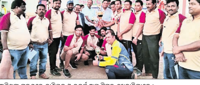
ଅତିଥିଙ୍କ ଗହଣରେ ଚାମ୍ପିୟନ ଓ ରନର୍ସ ଅପ୍ ଚିମ୍ବୁ ଖେଳାଳିମାନେ।