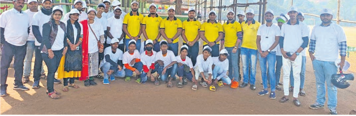
'ଖୁସି ଦ ଲନିକ୍ରିଡ଼େବଲ୍ ଭାରତ' ସ୍ଥୁ କ୍ଷୁର ସଦସ୍ୟମାନେ ।