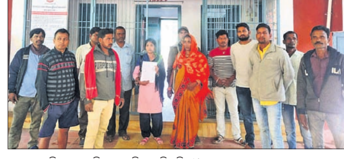
ଆନାକୁ ଅଭିଯୋଗ କରିବାକୁ ଆସିଥିବା ଶିକ୍ଷୟିତ୍ରୀ।