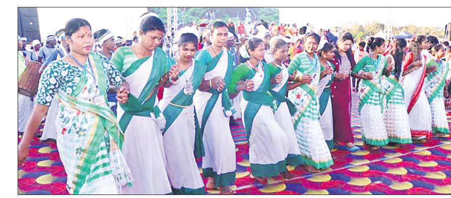
କଳାକାର ସମାଗମରେ ନୃତ୍ୟ ପରିବେଷଣ କରାଯାଇଛି।