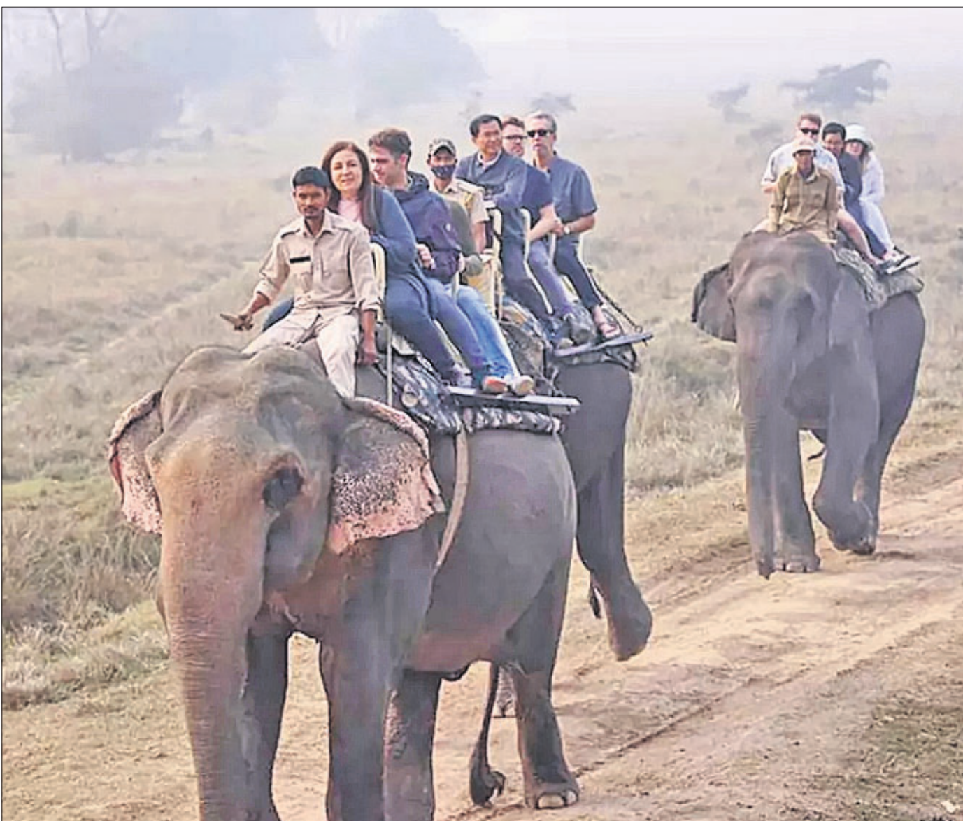
ଜି-୨୦ ପ୍ରତିନିଧିମାନେ ଶନିବାର ଆସାମର ମୋରିଗାଁଠି ଜିଲ୍ଲାରେ ଥିବା ପୋବିତୋରା ବନ୍ୟପ୍ରାଣୀ ଅଭୟାରଣ୍ୟରେ ହାତୀ ସଫାରିର ମଜା ନେଉଛନ୍ତି।