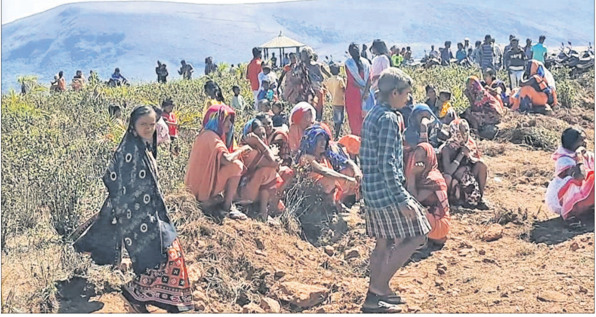
୫-ଟି ସଚିବଙ୍କୁ ଭେଟି ଆଲୋଚନା କରିବାକୁ ମାଳି ପାହାଡ଼ ଉପରେ ଶନିବାର ଅପେକ୍ଷାରତ ଗ୍ରାମବାସୀ।

ଗତ ୨/୩ ଦିନ ହେବ ରାଜ୍ୟରେ ହାଲୁକା ଶୀତ ଲାଗି ରହିଛି। ରାଜ୍ୟକୁ ଉତ୍ତରପୂର୍ବ ଦିଗରୁ ଅଣ୍ଡାବାୟୁ ପ୍ରବାହ କାରି ରହିଛି। ଏଥିପାଇଁ ରାଜ୍ୟର କେତେକ ସ୍ଥାନରେ ସର୍ବନିମ୍ନ ତାପମାତ୍ରା ୧୦ ଡିଗ୍ରୀ ସେଲ୍ସିୟସ୍ ତଳକୁ ଖସିଛି। ଆସନ୍ତା ୨୪ ଘଣ୍ଟା ମଧ୍ୟରେ ଝାରସୁଗୁଡ଼ା, ସୁନ୍ଦରଗଡ଼, କନ୍ଧମାଳର କେତେକ ସ୍ଥାନରେ ଅଣ୍ଡା ଲହରି ପ୍ରବାହିତ ହେବ। ଏ ନେଇ ପାଣିପାଗ ବିଭାଗ ପକ୍ଷରୁ ଯେଲୋ ଖୁନି କାରି କରାଯାଇଛି। ଅନ୍ୟପକ୍ଷରେ ରାଜ୍ୟର ବିଭିନ୍ନ ସ୍ଥାନରେ ପାରଦ ତଳହୁଆଁ ହୋଇଛି। ଏପରିକି ୫ଟି ସହରରେ ରାତ୍ରିର ସର୍ବନିମ୍ନ ତାପମାତ୍ରା ୧୦ ଡିଗ୍ରୀ ତଳକୁ ଖସିଯାଇଛି। ଆଞ୍ଚଳିକ ପାଣିପାଗ କାର୍ଯ୍ୟାଳୟ ସ୍ତରରୁ ମିଳିଥିବା ସୂଚନା ଅନୁଯାୟୀ, ଶୁକ୍ରବାର ପୁଲିବାଣୀରେ ସର୍ବନିମ୍ନ ତାପମାତ୍ରା ୫.୬ ଡିଗ୍ରୀ ସେଲ୍ସିୟସ୍ ରେକର୍ଡ କରାଯାଇଥିବା ବେଳେ ଝାରସୁଗୁଡ଼ା ୮.୬, ସୁନ୍ଦରଗଡ଼ ୯, ଭବାନୀପାଟଣା ୯.୫, କୋରାପୁଟ ୮.୫, ରାଉରକେଲା ୮.୩, ଦାରିଙ୍ଗପାଟି ୧୦.୫ ଏବଂ ସୋନପୁରରେ ସର୍ବନିମ୍ନ ତାପମାତ୍ରା ୧୦.୪ ଡିଗ୍ରୀ ସେଲ୍ସିୟସ୍ ଥିବା ଜଣାଯାଇଛି।