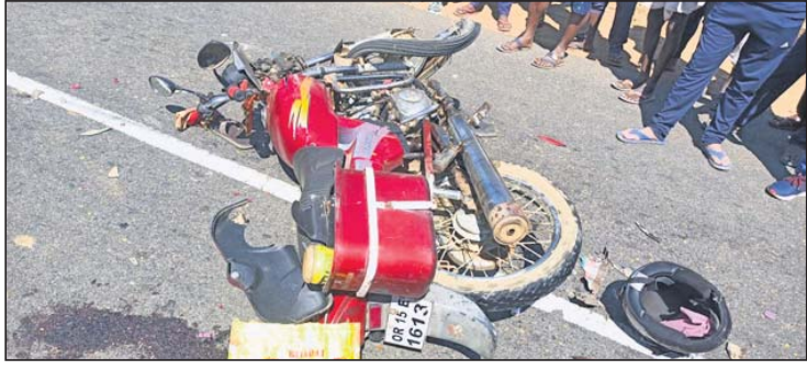
ଟ୍ରକ୍ ଧକ୍କାରେ ବାଇକ୍ ଭାଙ୍ଗିଲେ ରାସ୍ତାରେ ପଡ଼ିଛି।

ଭୁବନେଶ୍ୱର ଜିଲ୍ଲା ଲକ୍ଷ୍ମୀପୁର ଥାନା ଅଞ୍ଚଳରେ ଶନିବାର ରାତି ପ୍ରାୟ ୧୦ଟି ବାଇକ୍ ଟ୍ରକ୍ ଦ୍ୱାରା ଧକ୍କା ଖାଇଥିଲା।