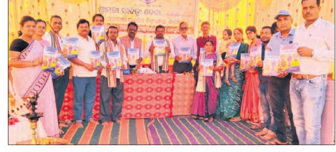
ଅତିଥିମାନେ ପୁସ୍ତକ 'ସାବିତ୍ରୀ' ଲୋକାର୍ପଣ କରୁଛନ୍ତି।

ଖୋର୍ଦ୍ଧା ଅଫିସ, ୪୧୨: ସିଆଇଟିୟୁ ଜିଲ୍ଲା କମିଟି ଖୋର୍ଦ୍ଧା ପକ୍ଷରୁ ଶନିବାର ଶ୍ରୀମନ୍ଦିର ବିଭିନ୍ନ ଦାସ ପୁରଣ ପାଇଁ ଜିଲ୍ଲାପାଳଙ୍କ କାର୍ଯ୍ୟାଳୟ ଆଗରେ ବିକ୍ଷୋଭ ଅନୁଷ୍ଠିତ ହୋଇଯାଇଛି। ନୂଆ ବସ୍ତାଏ ଠାକୁ ଏକ ଶୋଭାଯାତ୍ରା ବାହାରି ଜିଲ୍ଲାପାଳଙ୍କ କାର୍ଯ୍ୟାଳୟ ସମ୍ମୁଖରେ ପହଞ୍ଚିଥିଲା।