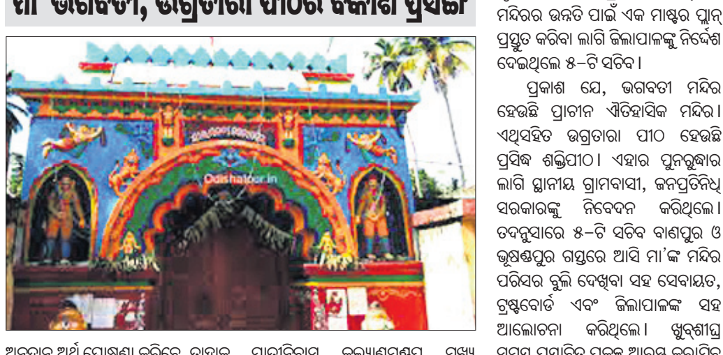
ଅନୁଦାନ ଅର୍ଥ ଘୋଷଣା କରିବେ, ତାହାକୁ ଜିଲ୍ଲାବାସୀ ଅପେକ୍ଷା କରିଛନ୍ତି।

ରାଜ୍ୟର ଐତିହାସିକ ସ୍ଥଳ, ମନ୍ଦିର, ଶକ୍ତିପୀଠ ଆଦିର ରକ୍ଷିତ ପାଇଁ ରାଜ୍ୟ ସରକାର ଗୁରୁତ୍ୱ ଦେଉଛନ୍ତି। ମୁଖ୍ୟମନ୍ତ୍ରୀ ନବୀନ ପଟ୍ଟନାୟକଙ୍କ ନିର୍ଦ୍ଦେଶକ୍ରମେ ୫-ଟି ସର୍ବିସ ଭି.କେ. ପାଣ୍ଡିଆନ ବିଭିନ୍ନ ଐତିହାସିକ ସ୍ଥାନ ଓ ମନ୍ଦିର ପରିବର୍ଦ୍ଧନ କରୁଛନ୍ତି। ଏହି କ୍ରମରେ ପାଣ୍ଡିଆନ ଗତ ନଭେମ୍ବର ୨୬ରେ ଖୋର୍ଦ୍ଧା ଗସ୍ତରେ ଆସି ବାଣପୁରସ୍ଥିତ ପା' ଭଗବତୀ ଓ ଚାନ୍ଦୀ ଭୃଷଣପୁରସ୍ଥିତ ଉଗ୍ରତାରା ପୀଠ ପରିବର୍ଦ୍ଧନ କରିଥିଲେ।