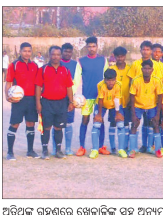
ଅତିଥିକ ଗହଣରେ ଖେଳାଳିଙ୍କ ସହ ଅନ୍ୟମାନେ।

ଖୋର୍ଦ୍ଧା ଅଫିସ, ୪୧୨: ଧାର୍ଯ୍ୟ ଆସୋସିଏଶନ ଆନୁକୂଲ୍ୟରେ ସ୍ଥାନୀୟ ଖୁଣ୍ଟିୟମରେ ରାଜିଥିବା ସର୍ବଭାରତୀୟ ପ୍ରସଙ୍ଗ ଡ୍ୟାଲେଜି ସିଲ୍ଲୁ ଫୁଟବଲ ଟୁର୍ନାମେଣ୍ଟର ଶନିବାର ଢେଙ୍କାନାଳର ପପୁଲାର କ୍ଳବ ଓ ପଶ୍ଚିମବଙ୍ଗ ବର୍ଦ୍ଧମାନର ବିଏମପ୍ଲାଇ ମଧ୍ୟରେ ହୋଇଥିଲା।