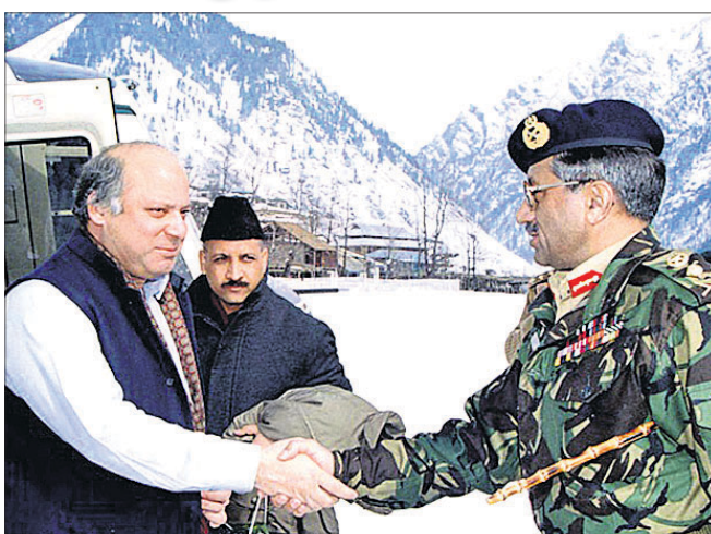
୧୯୯୯ ମେ ୩ରୁ ଜୁଲାଇ ୨୬ ପର୍ଯ୍ୟନ୍ତ ୨ ମାସ ୩ ସପ୍ତାହ ୨ ଦିନ ଧରି ଭାରତ ଓ ପାକିସ୍ତାନ ମଧ୍ୟରେ କାର୍ତ୍ତବୀର ମୁକ୍ତ ହୋଇଥିଲା। ମୁକ୍ତ ଚାଲିଥିବାବେଳେ ଜୁନ୍ ୨୪ରେ ପାକିସ୍ତାନ ପ୍ରଧାନମନ୍ତ୍ରୀ ନୂଆଦିଲ୍ଲୀରେ ଶିରଫଙ୍କ ସହ ଚଳାକାନ ସେନା ମୁଖ୍ୟ ପରଭେଦ ପୂର୍ଣ୍ଣଙ୍କୁ

ପାକିସ୍ତାନର ପୂର୍ବତନ ସାମରିକ ଶାସକ ଜେନେରାଲ ପରଭେଦ ପୂର୍ଣ୍ଣ ୧୯୯୯ କାର୍ତ୍ତବୀର ମୁକ୍ତର ଖଳନାୟକ ଥିଲେ। ପାକିସ୍ତାନରେ ଦୀର୍ଘ ୯ ବର୍ଷ ଧରି ଏକଜୁଟିବାଦ ଶାସନ କରିଥିବା ଏହି ଫୋର୍-ଷ୍ଟାର ଜେନେରାଲ ଆନୁରାଗରେ ଥିବାବେଳେ ରବିବାର ୭୯ ବର୍ଷ ବୟସରେ ଦୁବାଇରେ ଆଖି ବୁଜିଦେଇଛନ୍ତି। ୧୯୪୩ରେ ନୂଆଦିଲ୍ଲୀରେ ଜନ୍ମିତ ପୂର୍ଣ୍ଣଙ୍କ ପରିବାର ଲୋକେ ୧୯୪୭ ବିଭାଜନ ପରେ ପାକିସ୍ତାନ ଚାଲିଯାଇଥିଲେ।