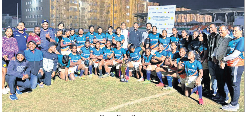
ଜାତୀୟ ଚାମ୍ପିୟନ୍ ଓଡ଼ିଶା ମହିଳା ରଙ୍ଗୀ ଦଳ ।

ଭୁବନେଶ୍ୱର, ୫୨ (ସୋର୍ସ୍ ଟ୍ୟୁବୋ): ୧୫ ତମ ଜାତୀୟ ରଙ୍ଗୀ ଗାମ୍ଭୀରଣୀୟରେ ଓଡ଼ିଶା ମହିଳା ଦଳ କିର୍ ବିଶ୍ୱବିଦ୍ୟାଳୟ ଗ୍ରୀଷ୍ମଋତୁରେ ଖେଳା ପରାସ୍ତ କରିଥିଲା । ଦିଲ୍ଲୀ ମହିଳା ଦଳ ଯାଇଥିବା ଚୂନାମେଣ୍ଟର ଫାଇନାଲରେ ଓଡ଼ିଶା ୪୭-୨ ପଏଣ୍ଟରେ ବିହାରକୁ ପରାସ୍ତ କରିଥିଲା । ଦିଲ୍ଲୀ ମହିଳା ଦଳ ଟ୍ରୋଫି ପଦକ ହାସଲ କରିଥିଲା ।