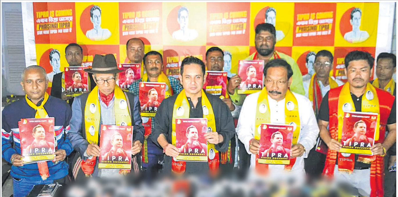
ଆଗାମୀ ତ୍ରିପୁରା ବିଧାନସଭା ନିର୍ବାଚନ ପାଇଁ ବିପ୍ରସା ଇତିହାସିକ ଉପକ୍ରମକୁ ଆଲିଆନ୍ସ (ଟିଆଇପିଆର୍ଏ) ମୁଖ୍ୟ ପ୍ରତ୍ୟାକ୍ଷିକ ବିକ୍ରମ ମାଣିକ୍ୟ ଦେବବର୍ମା ଓ ଅନ୍ୟ ନେତାମାନେ ଅଗରତାଳାରେ ଦକ୍ଷ ଉପକ୍ରମ କରୁଛନ୍ତି ।