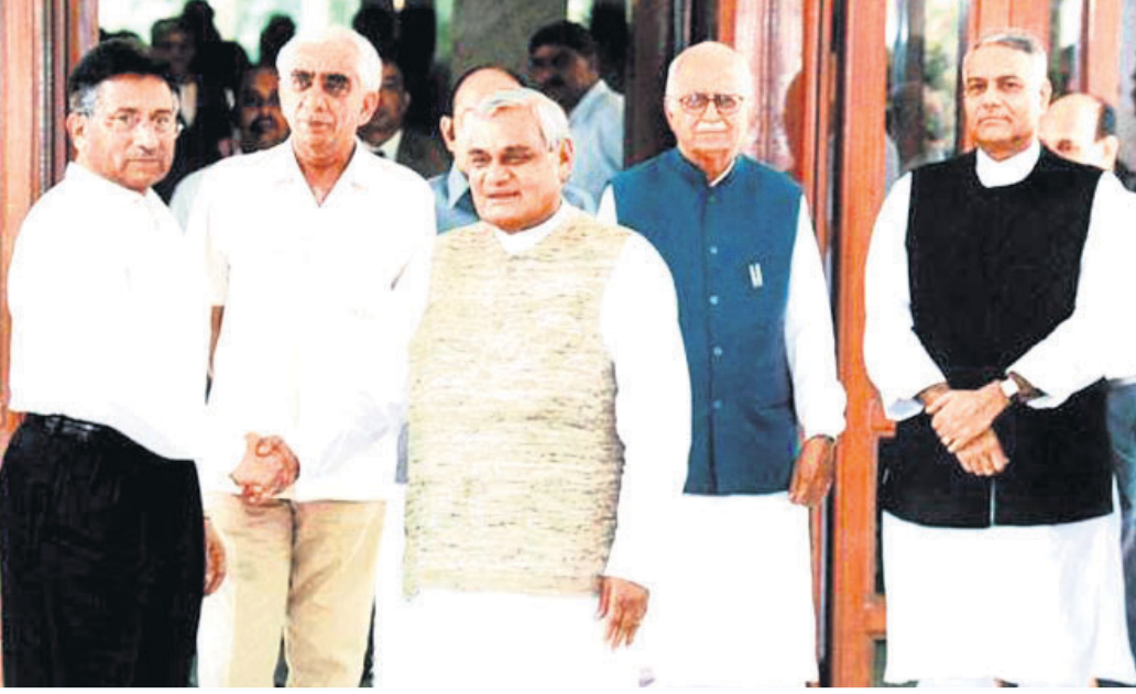
୨୦୦୧ ଜୁଲାଇରେ ଦୁଇଦିନିଆ ଆଗ୍ରା ସମ୍ମିଳନୀ ବେଳେ ପ୍ରଧାନମନ୍ତ୍ରୀ ଅଟଳ ବିହାରୀ ବାଜପେୟୀଙ୍କ ସହ ପରଭେଦ ପୂର୍ଣ୍ଣ ନିକଟରେ ଅଛନ୍ତି ଉପପ୍ରଧାନମନ୍ତ୍ରୀ ଲାଲକୃଷ୍ଣ ଆଡ଼ବାନୀ, ପ୍ରତିରକ୍ଷା ମନ୍ତ୍ରୀ ଯଶଓତ୍ତ ସିଂ ଏବଂ ବହିର୍ବ୍ୟାପାର ମନ୍ତ୍ରୀ ଯଶଓତ୍ତ ସିଂହ।