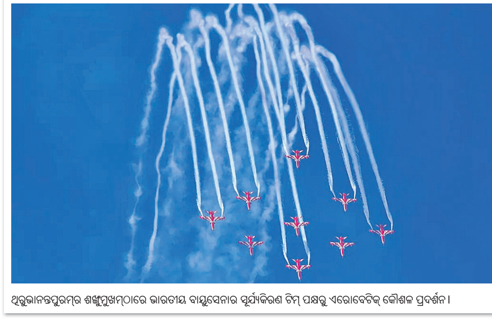
ଅରୁଣାକପୁରମ୍ବର ଶଙ୍କୁମୁଖ୍ୟମୂଳରେ ଭାରତୀୟ ବାୟୁସେନାର ପୂର୍ଯ୍ୟକରଣ ଚିମ୍ ପକ୍ଷରୁ ଏରୋବେଟିକ୍ କୌଶଳ ପ୍ରଦର୍ଶନ।

କରିଛନ୍ତି। ଘଟଣା ନେଇ ଦିଲ୍ଲୀରେ ପୋଲିସ ବିଭାଗ ଓ ଡାକ୍ତରଖାନା କର୍ତ୍ତୃପକ୍ଷ ପ୍ରତିକ୍ରିୟା ଦେବାକୁ ମନା କରିଛନ୍ତି। ବୟସ୍କଙ୍କୁ ସହ ତିବା ଚୁର୍ଚ୍ଚାର ଲଗ୍ନାବଳରେ ରହୁଥିଲେ। ତାଙ୍କ ମୁହଁବର କିଛିଦିନ ପୂର୍ବେ ତିବା ଭାରତରେ ରହୁଥିବା ତାଙ୍କ ବାପାଙ୍କୁ ପାଖକୁ ଚାଲିଆସିଥିଲେ। ତିବା ପୁଣିଥରେ ଚୁର୍ଚ୍ଚା ସିଦ୍ଧାନ୍ତୀ ଯୋଗନା କରୁଥିବାବେଳେ ତାଙ୍କ ବାପା ଏହାକୁ ବିରୋଧ କରୁଥିଲେ। ଦୁର୍ଘଟଣା ମଧ୍ୟରେ ଭାଗ୍ୟ ବଦଳିଥିବାବେଳେ ତିବାଙ୍କୁ ତାଙ୍କ ବାପା ହତ୍ୟା କରିଥିଲେ। ୨୦୨୧ରୁ ତିବା ମୁହଁବର ତ୍ୟାଗେଣ ଆରମ୍ଭ କରିଥିଲେ ତାଙ୍କ ତ୍ୟାଗେଣରେ ୨୦,୦୦୦ ସଦସ୍ୟଙ୍କର ଅଛନ୍ତି।