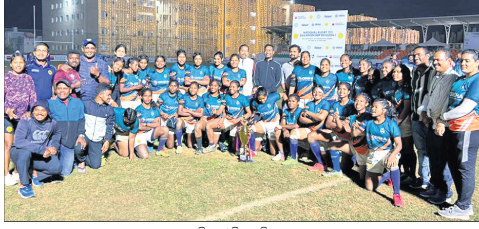
ଜାତୀୟ ଚାମ୍ପିୟନ୍ ଓଡ଼ିଶା ମହିଳା ରଙ୍ଗୀ ଦଳ ।

ଭୁବନେଶ୍ୱର, ୫୨ (ସ୍ପୋର୍ଟ୍ସ୍ ଡ୍ୟୁଭୋ): ୧୫ ତମ ଜାତୀୟ ରଙ୍ଗୀ ଗାମ୍ଭୀରଣୀୟରେ ଓଡ଼ିଶା ମହିଳା ଦଳ କିର୍ ବିଶ୍ୱବିଦ୍ୟାଳୟ ଗ୍ରୀଷ୍ମଋତୁରେ ଖେଳା ପରାସ୍ତ କରିଥିଲା । ଦିଲ୍ଲୀ ମହିଳା ଦଳ ଓଡ଼ିଶା ୪୭-୨ ପଏଣ୍ଟରେ ବିହାରକୁ ପରାସ୍ତ କରିଥିଲା । ଦିଲ୍ଲୀ ମହିଳା ଦଳ ଓଡ଼ିଶା ପଦକ ହାସଲ କରିଥିଲା ।