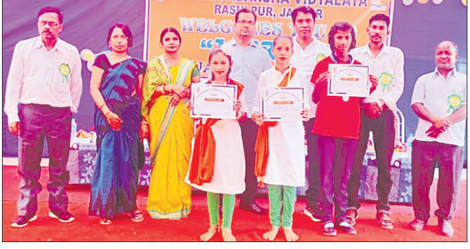
ଅତିଥି କୃତା ଛାତ୍ରମାନଙ୍କୁ ପୁରସ୍କୃତ କରୁଛନ୍ତି।