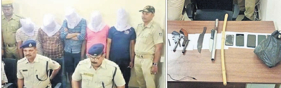
ଗିରଫ ଅଭିଯୁକ୍ତଙ୍କ ସମ୍ପର୍କରେ ପୋଲିସ୍ ସୂଚନା ଦେଉଛି।

ବନ୍ଧୁକ, ମାରଣାସ୍ତ୍ର, ବାଉଁଶ ଡକାୟତି ଉଦ୍‌ଧ୍ୟମ ବେଳେ ୪ ଗିରଫ