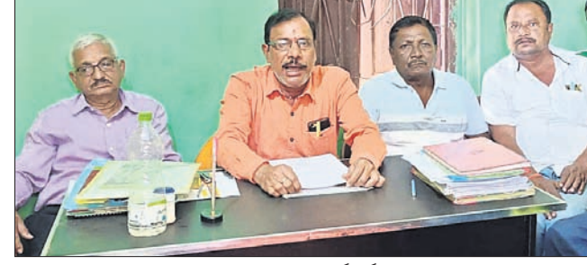
ଖବରଦାତା ସମ୍ମିଳନୀରେ ଡିଲର ମହାସଂଘର କର୍ମକର୍ମୀମାନେ ।