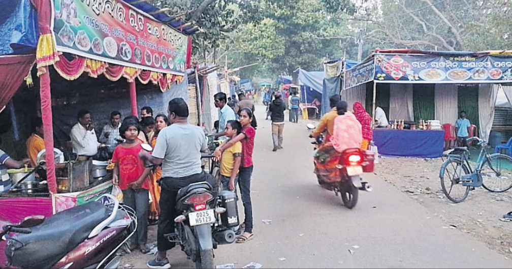
ମାଘ ମେଳା ପଡ଼ିଆ ଖାଁଖାଁ।