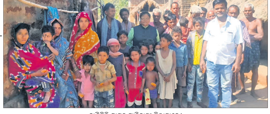
ନାହିଁର ଗ୍ରାମର ଆଦିବାସୀ ପିଲାମାନେ ।