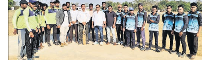
ଅତିଥିକ ଗହଣରେ ୨ ଦଳର ଖେଳାଳି।