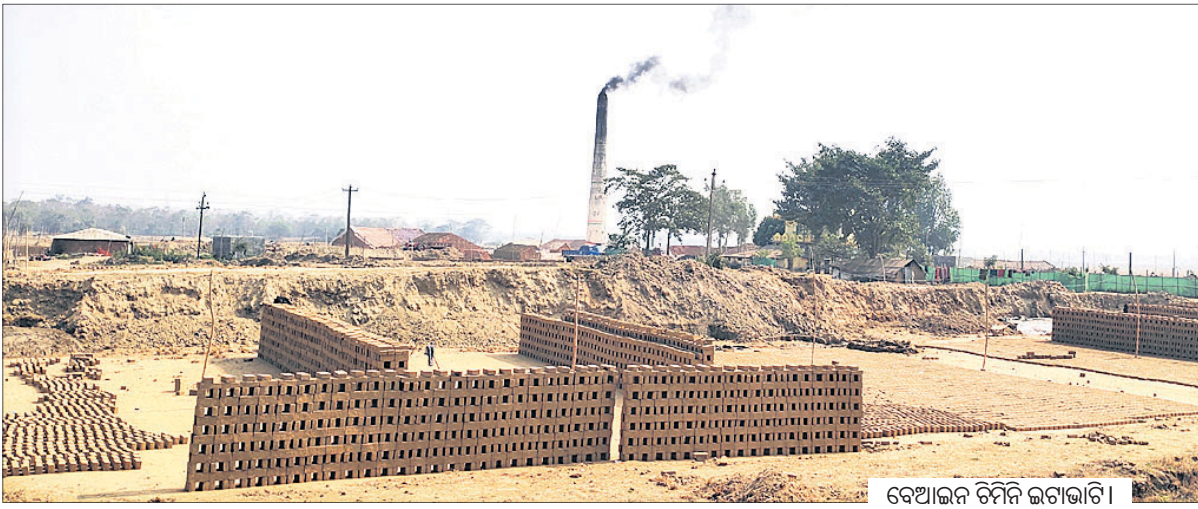
ବେଆଇନ ଚିନିନ ଇଟାଭାଟି