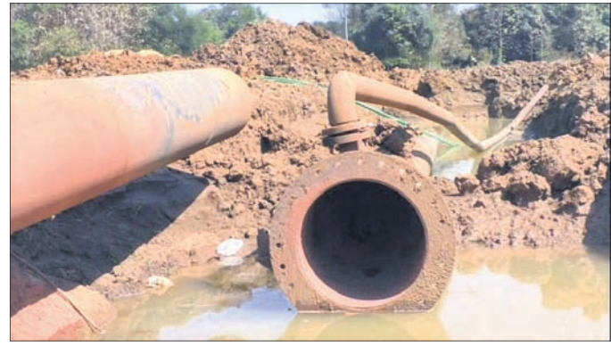
ଶନିବାର ଏଇଠି ଘଟିଥିଲା ଦୁର୍ଘଟଣା ।