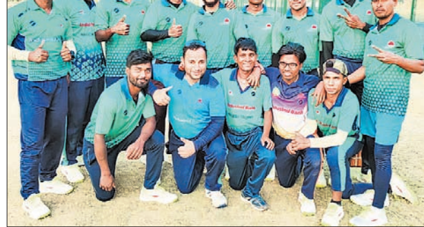
ନାଗେଶ ଟ୍ରଷ୍ଟି ପାଇଁ ମନୋନୀତ ଓଡ଼ିଶା ଦଳ