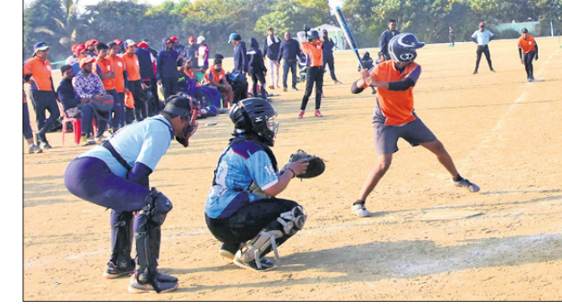
ମହାରାଷ୍ଟ୍ର ଓ ମଧ୍ୟପ୍ରଦେଶ ମଧ୍ୟରେ ଅନୁଷ୍ଠିତ ମ୍ୟାଚ୍

ପୁରୀ ଅଫିସ, ୭୧୨ ଉପକେଶ ୧୯-୦୦ରେ ଓଡ଼ିଶାକୁ କେବଳ ୦୫-୦୦ରେ ଦିଲ୍ଲୀକୁ ଆକ୍ରମଣ ୦୭-୦୧ରେ ଟେକ୍ନୋଲୋଜି, ମହାରାଷ୍ଟ୍ର ୧୦-୦୦ରେ ପଞ୍ଜାବକୁ ହରାଇଛି। ସେହିପରି ପୁରୁଷ ବର୍ଗରେ ଅନୁଷ୍ଠିତ ମ୍ୟାଚଗୁଡ଼ିକରେ ପଞ୍ଜାବ ୨-୦୦ରେ ମହାରାଷ୍ଟ୍ରକୁ, ଓଡ଼ିଶା ଦିନରେ ଅନୁଷ୍ଠିତ ମହିଳା ବିଭାଗ ମ୍ୟାଚରେ ମହାରାଷ୍ଟ୍ର ୫-୦୦ରେ ମଧ୍ୟପ୍ରଦେଶକୁ, ଆକ୍ରମଣ ୩-୦୦ରେ ରାଜସ୍ଥାନକୁ, ଟେକ୍ନୋଲୋଜି ୩-୦୨ରେ କର୍ନାଟକକୁ, ପଞ୍ଜାବ ୧୦-୦୦ରେ ଭାରତ ପ୍ରଦେଶକୁ ହରାଇଥିଲେ। ଅନ୍ୟ ସୁପର ଲିଗ ମ୍ୟାଚରେ କେବଳ ୩-୦୦ରେ ଓଡ଼ିଶାକୁ, ଛତିଶଗଡ଼ ୭-୦୦ରେ ଦିଲ୍ଲୀକୁ, ଛତିଶଗଡ଼ ୧୦-୦୦ରେ କେବଳକୁ, ମହାରାଷ୍ଟ୍ର ୧-୦୦ରେ ଆକ୍ରମଣକୁ, ପଞ୍ଜାବ ୯-୦୩ରେ ଟେକ୍ନୋଲୋଜିକୁ, ଆକ୍ରମଣ ୦୩-୦୦