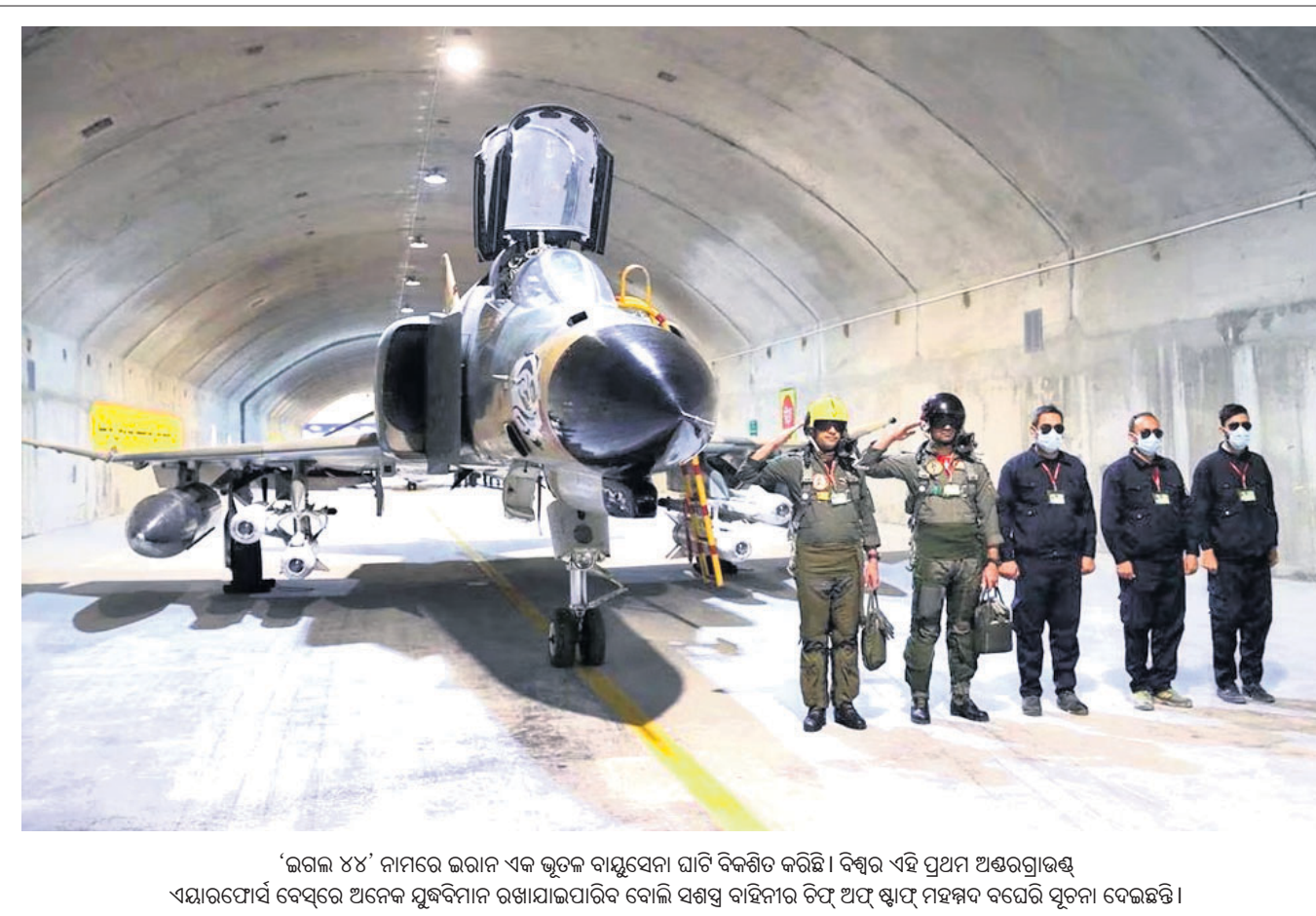
‘ଇଗଲ ୪୪’ ନାମରେ ଜଣାଣ ଏକ ଭୂତକ ବାୟୁସେନା ଘାଟି ବିକଶିତ କରିଛି। ବିଶ୍ୱର ଏହି ପ୍ରଥମ ଅଣୁରାତ୍ନ ଉପାଦାନ ଯେଉଁ ଘୋଷାରିନେଲା ଯେଉଁ ଶୁଭକାରୀଙ୍କୁ ବାୟୁସେନା କର୍ମଚାରୀଙ୍କୁ ନିରାଶ କରିଥିବା ସହ ସେମାନଙ୍କ କାହିକା କ୍ଷତାଜ ନେଇଛି ବୋଲି ବିରୋଧୀ ଦଳ ଅଭିଯୋଗ କରିଛନ୍ତି। କମ୍ପାନୀର ୨୦ ଜିଲାରୁ କରାଯିବା ଉଦ୍ଦେଶ୍ୟ କରାଯିବା ସହ ସେମାନଙ୍କ ନିର୍ମାଣ କରାଯାଇଛି। ଏହି ଅଭିଯୋଗ କମ୍ପାନୀରେ ପାଲେଷ୍ଟାଇନ୍ ଓ ଆଫଗାନିସ୍ତାନ ଘିଡି ସୃଷ୍ଟି କରିଥିବା ପୂର୍ବରୁ ମୃତ୍ୟୁମନ୍ତ୍ରୀ ତଥା ପିଡିପି ଜଣକ ରିଟର୍ କରାଯିବା ସହ ଅନ୍ୟ