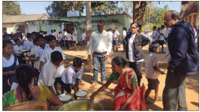
ମଧ୍ୟାହ୍ନଭୋଜନ ଯାଞ୍ଚ କରୁଛନ୍ତି ଉପଜିଲ୍ଲାପାଳ ।