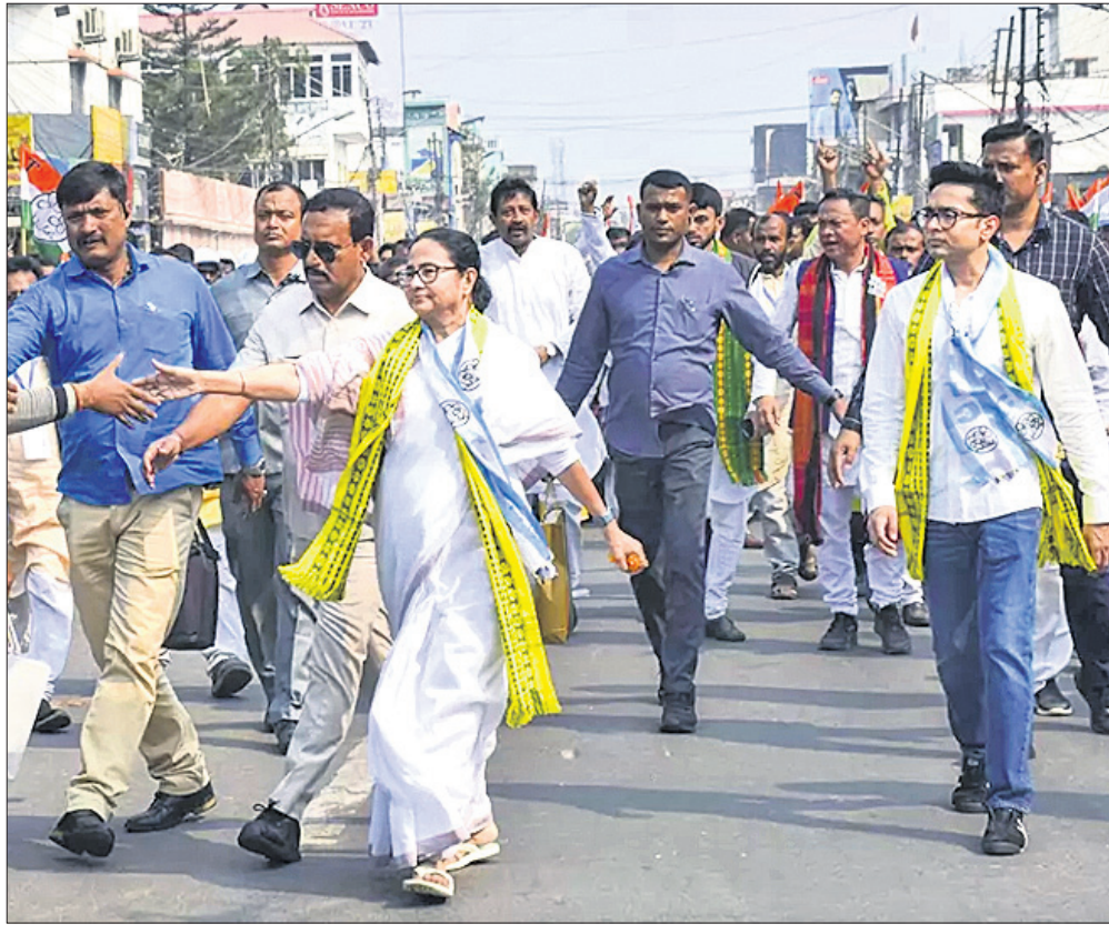
ଅଗରତାଳାରେ ମୁଖ୍ୟମନ୍ତ୍ରୀ ଡି.ପି.ଶରମାଙ୍କୁ ଭେଟିବା ପାଇଁ ବିଜେଡି ରାଜ୍ୟରେ ଗଠନ କରାଯାଇଛି।

ଅଗରତାଳା, ୭.୧୨ (ଧି.ଟି.) ଭୁବନେଶ୍ୱରରେ ମୁଖ୍ୟମନ୍ତ୍ରୀ ଡି.ପି.ଶରମାଙ୍କୁ ଭେଟିବା ପାଇଁ ବିଜେଡି ରାଜ୍ୟରେ ଗଠନ କରାଯାଇଛି। ରାଜ୍ୟରେ ଗଠନ କରାଯାଇଥିବା ପ୍ରଥମ ଗଠନ... ଯୋଗୀଙ୍କୁ ସମର୍ଥନ ଦେବାକୁ ପ୍ରସ୍ତୁତ ରହିବେ।