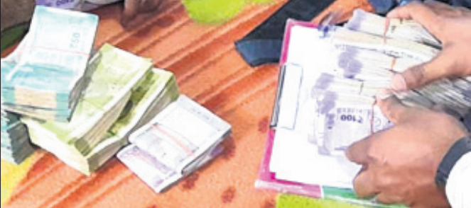
ଜବତ ହୋଇଥିବା ଟଙ୍କା।