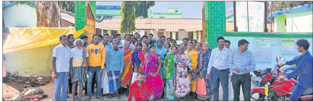
ରୁପୁଡ଼ିବନ୍ଧ ରୁକ୍ମିଣୀ ଦାବିପତ୍ର ପ୍ରଦାନ କରିବାକୁ ଆସିଥିବା ଲୋକେ ।