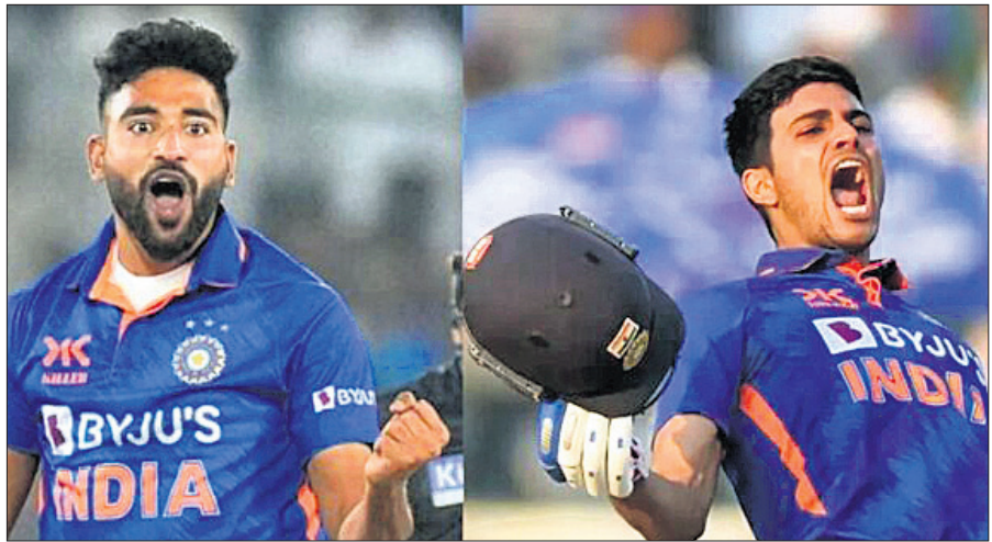
ମହମ୍ମଦ ସିରାଜ (ବାମ) ଓ ଶୁବମନ ରିଲ୍

କାନ୍ଥୁରୀ ମାସରେ ଚମତ୍କାର ପ୍ରଦର୍ଶନ ପାଇଁ ଆଇସିସି ସେଣ୍ଟର ଅଫ ଦି ମାଟ୍ ପୁରସ୍କାର ଦୌଡ଼ରେ ଭାରତ ପେପ୍ ବୋଲର ମହମ୍ମଦ ସିରାଜ ଓ ଓପନର ଶୁବମନ ରିଲ୍ ରହିଛନ୍ତି। ପୁରସ୍କାର ପାଇଁ ଦୁହେଁ ଦାବିଦାର ରହିଛନ୍ତି।