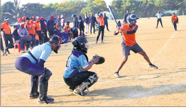
ମହାରାଷ୍ଟ୍ର ଓ ମଧ୍ୟପ୍ରଦେଶ ମଧ୍ୟରେ ଅନୁଷ୍ଠିତ ମ୍ୟାଚ୍।

ଛତିଶଗଡ଼ ୧-୦ରେ ଓଡ଼ିଶାକୁ, କେରଳ ୦୫-୦ରେ ଦିଲ୍ଲୀକୁ, ଆନ୍ଧ୍ର ପ୍ରଦେଶ ୦୭-୦ରେ ତେଲଙ୍ଗାନାକୁ, ମହାରାଷ୍ଟ୍ର ୧୦-୦ରେ ପଞ୍ଜାବକୁ ହରାଇଛି। ସେହିପରି ପୁରୁଷ ବର୍ଗରେ ଅନୁଷ୍ଠିତ ମ୍ୟାଚଗୁଡ଼ିକରେ ପଞ୍ଜାବ ୨-୦ରେ ମହାରାଷ୍ଟ୍ରକୁ, ରାଜସ୍ଥାନ ୦୨-୦ରେ ଜମ୍ମୁକଶ୍ମୀରକୁ, ଦିଲ୍ଲୀ ୬-୦୨ ଓଡ଼ିଶାକୁ, ମଧ୍ୟପ୍ରଦେଶ ୧-୦-୦୨ପ୍ରଦେଶକୁ, ଛତିଶଗଡ଼ ୪-୦ରେ ଉତ୍ତରାଖଣ୍ଡକୁ, ଛତିଶଗଡ଼ ୨-୦ରେ କେରଳକୁ, ହରିୟାଣା ୬-୦ରେ ତେଲଙ୍ଗାନାକୁ, ଆନ୍ଧ୍ର ପ୍ରଦେଶ ୧୦-୦ରେ ଗୁଜରାଟକୁ ହରାଇଛି। ଅପରପକ୍ଷେ ପୁରୁଷ ବିଭାଗ ସୁପର ଲିଗ୍ ମ୍ୟାଚରେ ପଞ୍ଜାବ ୫-୦ରେ ରାଜସ୍ଥାନକୁ, ଦିଲ୍ଲୀ ୪-୦ରେ ମଧ୍ୟପ୍ରଦେଶକୁ, ଛତିଶଗଡ଼ ୬-୦୩ ଛତିଶଗଡ଼କୁ, ଆନ୍ଧ୍ର ପ୍ରଦେଶ ୦୩-୦୦