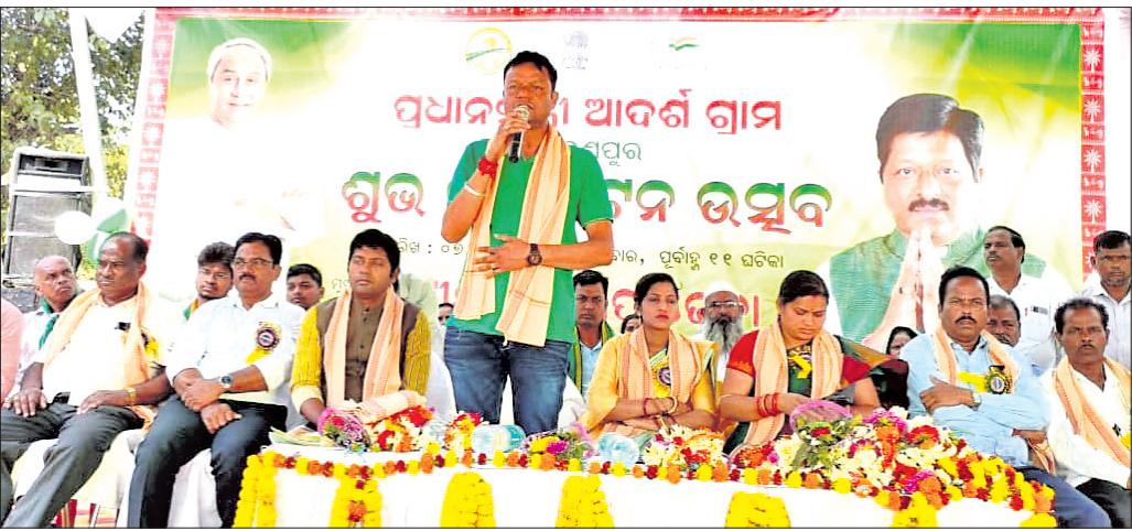
ବିଭିନ୍ନ ପ୍ରକଳ୍ପର ଲୋକାର୍ପଣ ଉତ୍ସବରେ ଯୋଗଦେଇଥିବା ଅତିଥି ଓ ଅନ୍ୟମାନେ।