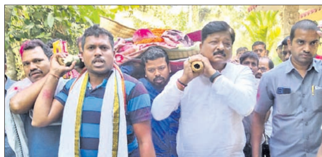
ବିଧାୟକ ପ୍ରତାପ ଜେନା ଓ ଅନ୍ୟମାନେ କୋଳେଇ କାନ୍ଧେଇ ଶୁଣାନ୍ତୁ ଯାଉଛନ୍ତି।