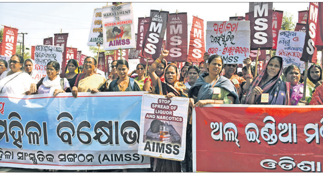
ରାଜ୍ୟରେ ନାରୀ ନିର୍ଯାତନା, ମାଦକ ଦ୍ରବ୍ୟ ଏବଂ ଅପସଂସ୍କୃତିର ପ୍ରସାର ରୋକିବା ସହ ଅନ୍ୟାନ୍ୟ ଦାବିରେ ଅଲ୍‌ଭିଆ ମହିଳା ସଂସ୍କୃତିକ ସଙ୍ଗଠନ (ଏଆଇଏମ୍‌ଏସ୍‌ଏସ୍) ପକ୍ଷରୁ ମଙ୍ଗଳବାର ଭୁବନେଶ୍ୱର ଲୋୟର ପିଏମ୍‌ଜିରେ ବିକ୍ଷୋଭ ପ୍ରଦର୍ଶନ କରାଯାଇଛି।

ଭୁବନେଶ୍ୱର, ୭୧୨ (ବୁଧବାର) ଯୋଗୋଗ୍ୟ ଦେଶ ବା ରାଜ୍ୟର ଅର୍ଥନୈତିକ ପ୍ରଗତିରେ ଏକ ଉତ୍ତମ ପରିବହନ ବ୍ୟବସ୍ଥା ଚୁକ୍ତିକା ଅତ୍ୟନ୍ତ ଉତ୍ତମ ଦାୟିତ୍ୱ ନିଜୁଥିବାକୁ ମନ୍ତ୍ରୀ କନକଲ୍ୟାଣକାରୀ ପରିବହନ ବ୍ୟବସ୍ଥା କନକଲ୍ୟାଣକାରୀ ଯୋଗାଇଦେବା ଆମ ସମଗ୍ର ଦାୟିତ୍ୱ ଓ କର୍ତ୍ତବ୍ୟ ବୋଲି ପରିବହନ ମନ୍ତ୍ରୀ ଚୁକ୍ତି ସାଧୁ କହିଛନ୍ତି। ମଙ୍ଗଳବାର କୃଷି ଭବନ ସମ୍ମିଳନୀ କକ୍ଷରେ ଆୟୋଜିତ ସଡ଼କ ପରିବହନ ନୀତି ଓ ଏହାର କାର୍ଯ୍ୟକାରୀତା ସମ୍ପର୍କରେ ଆଞ୍ଚଳିକ ପରିବହନ ଅଧିକାରୀଙ୍କୁ ରାଜ୍ୟସ୍ତରୀୟ କର୍ମଶାଳାରେ ଅଧ୍ୟକ୍ଷତା କରି ସେ କହିଛନ୍ତି, ବିଭାଗ ପକ୍ଷରୁ ନିଆଯାଉଥିବା ବିଭିନ୍ନ ନିଷ୍ପତ୍ତି ଓ ପଲିସି ସବୁ ଚୁକ୍ତିଗ୍ରହଣରେ ଠିକ୍‌ଭାବେ କାର୍ଯ୍ୟକାରୀ ହେଉ। ସେଥିପ୍ରତି ଆପଣମାନେ ଯତ୍ନବାନ ହେବେ। ବିଭିନ୍ନ ଅନୁଲୋଚନା ସେବା ପ୍ରଦାନ ଏବଂ ବିଭାଗରେ ଆଧୁନିକୀକରଣ ପ୍ରୟୋଗ କରିବାରେ ଆମ ରାଜ୍ୟ ଭାରତବର୍ଷରେ କର୍ମଶାଳାରେ ଅଧିକାରୀଙ୍କୁ ପ୍ରସ୍ତୁତ କରିବାକୁ ଅଧିକ ଅଗ୍ରଣୀ। ସେବା ପ୍ରଦାନ ସହ ବାକି ପଡ଼ିଥିବା ମୋଟରଯାନ ଟିକସ ଆଦାୟ କରିବା, ଏନ୍‌ଡୋର୍ସମେଣ୍ଟ ପରିଚାଳନା ପାଇଁ ମଧ୍ୟ ଆଞ୍ଚଳିକ