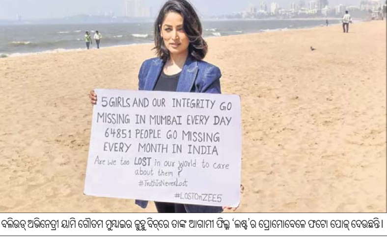
ବିଲଭ୍ ଅଭିନେତ୍ରୀ ଯାମି ଗୌତମ ମୁଖଭର ଛୁଇଁ ବିବେଚନା ଗାଆନା ପିଠା 'ଇଷ୍ଟ'ର ପ୍ରମୋସେସନ ପରେ ପୋଡ଼ ଦେଉଛନ୍ତି।