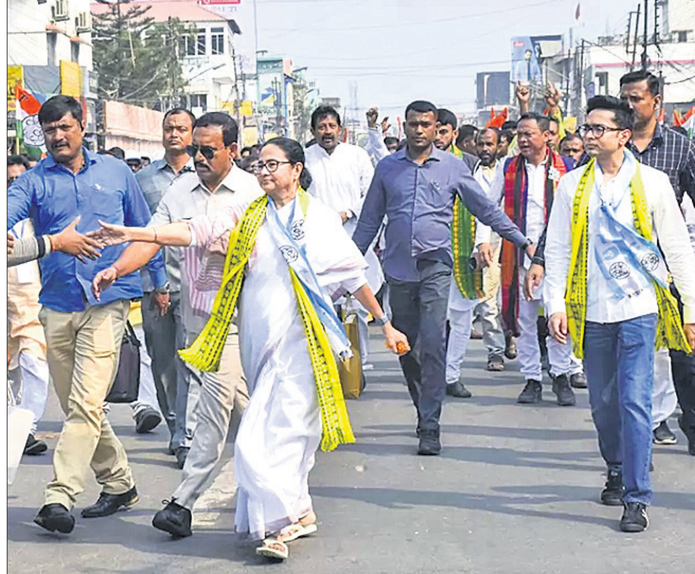
ଅଗରତାଲାରେ ମଙ୍ଗଳବାର ଆୟୋଜିତ ଏକ ରୋଡ୍ ଶୋ'ରେ ପଶ୍ଚିମବଙ୍ଗ ମୁଖ୍ୟମନ୍ତ୍ରୀ ମମତା ବାନାର୍ଜୀ।

ଅଗରତାଲା, ୭।୨ ଦ୍ୱିପୁରା ବିଧାନସଭା ନିର୍ବାଚନ ପାଇଁ ବିଜେଡିର ଉପକ୍ରମିକ ଦଳ ପକ୍ଷରୁ ଗଠନର ପ୍ରଚାର ଚାଲିଛି। ବିଜେଡି ଦଳର ଗୁଡ଼ା ନେତାମାନେ ରାଜ୍ୟର ଗ୍ରାମ କୁଳୁଣ୍ଡି। ଏହି କ୍ରମରେ ମଙ୍ଗଳବାର ଉତ୍ତରପ୍ରଦେଶ ମୁଖ୍ୟମନ୍ତ୍ରୀ ଯୋଗୀ ଆଦିତ୍ୟନାଥ ଖୋର୍ଦ୍ଧାରେ ପହଞ୍ଚିଥିଲେ। ସେଠାରେ ଏକ ନିର୍ବାଚନ ସଭାରେ ସେ କଂଗ୍ରେସ ଏବଂ ବାମପନ୍ଥୀ ଦଳକୁ ଚାରେଟ କରିଥିଲେ। ସେ କହିଥିଲେ, ରାଜ୍ୟରେ ବିକାଶ କାର୍ଯ୍ୟ ବହୁ ପୂର୍ବରୁ ହୋଇ ପାରିଆନ୍ତା। କିନ୍ତୁ କମ୍ୟୁନିଷ୍ଟ ପାର୍ଟି କି କଂଗ୍ରେସ ତାହା କରି ନ ଥିଲେ। କାରଣ