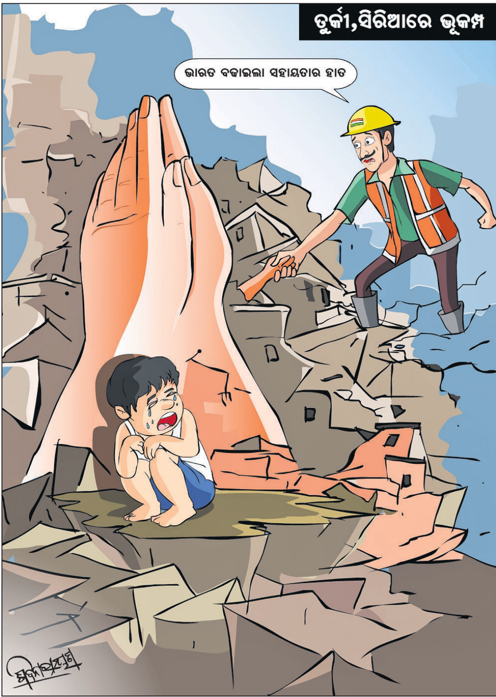
ଭୁକ୍ତୀ, ସିରିଆରେ ଭୁକ୍ତୀ

ଭୁବନେଶ୍ୱର, ୭/୨ (ବୁଧବାର) ରାଜ୍ୟରେ ସର୍ପଦଂଶନଜନିତ ମୃତ୍ୟୁସଂଖ୍ୟାରେ ରୋକ ଲାଗିପାଉନାହିଁ। ୨୦୧୫ ମସିହାରେ ରାଜ୍ୟରେ ୫୨୨ଜଣ ଲୋକଙ୍କର ସାପକାମୁଡ଼ାରେ ମୃତ୍ୟୁ ଘଟିଥିବା ପଞ୍ଜୀକୃତ ହୋଇଥିବା ବେଳେ ୨୦୨୧ରେ ଏହି ସଂଖ୍ୟା ବୃଦ୍ଧିପାଇ ୧,୧୫୯ରେ ପହଞ୍ଚିଥିବା ଓଡ଼ିଶା ରାଜ୍ୟ ବିପର୍ଯ୍ୟୟ ପରିଚାଳନା କର୍ତ୍ତୃପକ୍ଷ (ଓସ୍‌ପିଆ) ତଥ୍ୟରୁ ସୂଚନା ମିଳିଛି। ୨୦୧୫ରୁ ୨୦୨୨ ଅର୍ଥାତ୍ ଗତ ୭ବର୍ଷ ମଧ୍ୟରେ ଓଡ଼ିଶାରେ ମୋଟ ୬,୩୫୧ଜଣଙ୍କର ସର୍ପଦଂଶନରେ ଜୀବନ ଯାଇଛି। ସେଥିମଧ୍ୟରେ ଗଞ୍ଜାମ ଜିଲ୍ଲାରେ ସର୍ବାଧିକ ୩୦୬ ଜଣ ରହିଛନ୍ତି। ସାପକାମୁଡ଼ାଜନିତ ମୃତ୍ୟୁରେ ରାଜ୍ୟରେ ଗଞ୍ଜାମ ଜିଲ୍ଲା ଏକ ନମ୍ବର ରହିଛି। ଏହା ପଛକୁ ୨୯୭ ମୃତ୍ୟୁ ସଂଖ୍ୟା ସହିତ କେନ୍ଦୁଝର ଜିଲ୍ଲା, ୨୯୩ ମୃତ୍ୟୁ ସହ ବାଲେଶ୍ୱର ଜିଲ୍ଲା ଏବଂ ୨୯୦ ମୃତ୍ୟୁ ସହ ମୟୂରଭଞ୍ଜ ଜିଲ୍ଲା ଚତୁର୍ଥ ସ୍ଥାନରେ ରହିଛି। ଏହା ପଛକୁ ଭଦ୍ରକ ୧୯୨, କଟକ ୧୯୧, ଯାଜପୁର ୧୯୧, ପୁରୀ ୧୭୨, ଜେଜିନାଳ ୧୫୫, ସୁନ୍ଦରଗଡ଼ ୧୪୬, ନବରଙ୍ଗପୁର ୧୪୫, ଅନୁଗୋଳ ୧୩୮, କେନ୍ଦ୍ରାପଡ଼ା ୧୧୮, ସମ୍ବଲପୁର ୧୧୮, ଖୋର୍ଦ୍ଧା ୯୬, ନୟାଗଡ଼ ୯୧, ବରଗଡ଼ ୭୮, ମାଲକାନଗିରି ୭୮, ଦେବଗଡ଼ ୭୫, କୋରାପୁଟ ୭୫, ବଲାଙ୍ଗୀର ୭୦, ଜଗତସିଂହପୁର ୬୭, କଳାହାଣ୍ଡି ୫୭, ରାୟଗଡ଼ା ୫୫, ସୁବର୍ଣ୍ଣପୁର ୫୫, ନୂଆପଡ଼ା ୩୫, ଖାରସିଗୁଡ଼ା ୩୧, କନ୍ଧମାଳ ୨୭, ବୌଦ୍ଧ ୨୫ ଏବଂ ଗଜପତି ଜିଲ୍ଲାରେ ସବୁଠାରୁ କମ୍ ମୃତ୍ୟୁ ସଂଖ୍ୟା ୧୮ ପଞ୍ଜୀକୃତ ହୋଇଛି। ଅପରପକ୍ଷେ ତହସିଲ/ବ୍ଲକ୍ ସ୍ତରରେ ସବୁଠାରୁ ଅଧିକ ସାପକାମୁଡ଼ାଜନିତ ମୃତ୍ୟୁ ସଂଖ୍ୟାରେ କିଛି ଆଶ୍ଚର୍ଯ୍ୟଜନକ ତାରତମ୍ୟ ଦେଖିବାକୁ ମିଳିଛି। ଗଞ୍ଜାମ ଯଦିଓ ସାମଗ୍ରିକ ଭାବେ ଏକ ନମ୍ବର ସ୍ଥାନରେ ରହିଛି କିନ୍ତୁ ଏହି ଜିଲ୍ଲାର କୌଣସି ତହସିଲ ବା ବ୍ଲକ୍ ପ୍ରଥମ ୧୦ଟି ସ୍ଥାନରେ ନାହିଁ। ୨୦୧୫ରୁ ୨୦୨୨ ମଧ୍ୟରେ ବାଲେଶ୍ୱର ଜିଲ୍ଲା ବସ୍ତା ବ୍ଲକ୍ରେ ସାପକାମୁଡ଼ାରେ ୪୩ ଜଣଙ୍କ