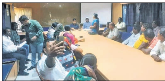
ବୈଠକରେ ଯୋଗଦେଇଥିବା ପ୍ରଶାସନିକ ଅଧିକାରୀ ଓ ଲୋକପ୍ରତିନିଧି।