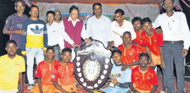
ଚାମ୍ପିୟନ କଳିଙ୍ଗ ସ୍ପୋର୍ଟ୍ସ୍ କ୍ଲବ୍‌ର ଖେଳାଳିମାନେ ଅତିଥିଙ୍କ ସହ ।

ଖୋର୍ଦ୍ଧା ଅଫିସ୍, ୭/୨: ଖୋର୍ଦ୍ଧା ସ୍ପୋର୍ଟ୍ସ୍ ଆସୋସିଏସନ ଆରକ୍ଷକଙ୍କୁ ସ୍ୱାଗତ କରିବା ପାଇଁ ଚାମ୍ପିୟନ ଚାଲେଞ୍ଜି ବିଲ୍ ପୁରୁଷଙ୍କୁ ଉଦ୍‌ଘାଟିତ ହୋଇଯାଇଛି । ଚଳିତ ବର୍ଷ ଭୁବନେଶ୍ୱରର କଳିଙ୍ଗ ସ୍ପୋର୍ଟ୍ସ୍ କ୍ଲବ୍ ଚାମ୍ପିୟନ ଆଖ୍ୟା ଅର୍ଜନ କରିଛି ।