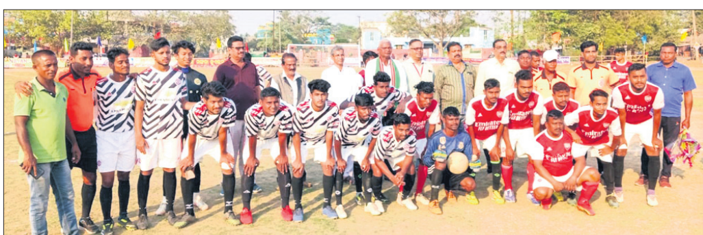
ରାଜ୍ୟସ୍ତରୀୟ ସାଲେପୁର କପ୍ ପୁଟବଳ ପୁନର୍ମେଣ୍ଟରେ ଅତିଥିଙ୍କ ଗହଣରେ ଉଭୟ ଦଳର ଖେଳାଳି।