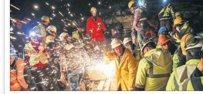
ତୁର୍କୀର ହତାୟତରେ ଉଦ୍ଧାର କାର୍ଯ୍ୟ ଜାରି ରହିଛି।

ରାଜିଆଣ୍ଡେପ, ୮୧୨: ଭୁକମ୍ପ ସ୍ଥିତି ପରିବର୍ତ୍ତନ କଲେ ତୁର୍କୀ ରାଷ୍ଟ୍ରପତି ଇର୍ଡୋଗାନ କାର୍ଯ୍ୟ ଜାରି ରହିଛି। ଅନ୍ୟପକ୍ଷେ ସିରିଆ ସ୍ୱାସ୍ଥ୍ୟ ମନ୍ତ୍ରଣାଳୟ ପକ୍ଷରୁ ସଂଗୃହୀତ ସୂଚନା ଅନୁସାରେ ୧,୨୫୦ ଜଣଙ୍କ ୧୧,୦୦୦ରେ ପହଞ୍ଚିଛି। ତୁର୍କୀ ରାଷ୍ଟ୍ରପତି ମୃତ୍ୟୁ ଘଟିଥିବାବେଳେ ୨,୦୫୪ ରିସେପ ଗାୟି ପ ଇର୍ଡୋଗାନ୍ ଭୁକମ୍ପରେ ଯିଥିବା ଅଧିକାରୀଙ୍କୁ ଦେଖିଛନ୍ତି। କୌଣସି ନାଗରିକଙ୍କୁ ଅସହାୟ ଭାବେ ରାତ୍ରି କଡ଼ରେ ଛଡ଼ାଯିବ ନାହିଁ ବୋଲି ଇର୍ଡୋଗାନ୍ ଭୁକମ୍ପ ସ୍ଥିତି ପରିବର୍ତ୍ତନ ବେଳେ କହିଛନ୍ତି। ଭୁକମ୍ପରେ ତୁର୍କୀରେ ବର୍ତ୍ତମାନ ସୁଦ୍ଧା ୮,୫୦୦ ଲୋକଙ୍କ ମୃତ୍ୟୁ ଘଟିଥିବା ସେ ସୂଚନା ଦେଇଛନ୍ତି। ରେଷ୍ଟାରିମ୍ ପକ୍ଷରୁ ଦିନରାତି ଉଦ୍ଧାର