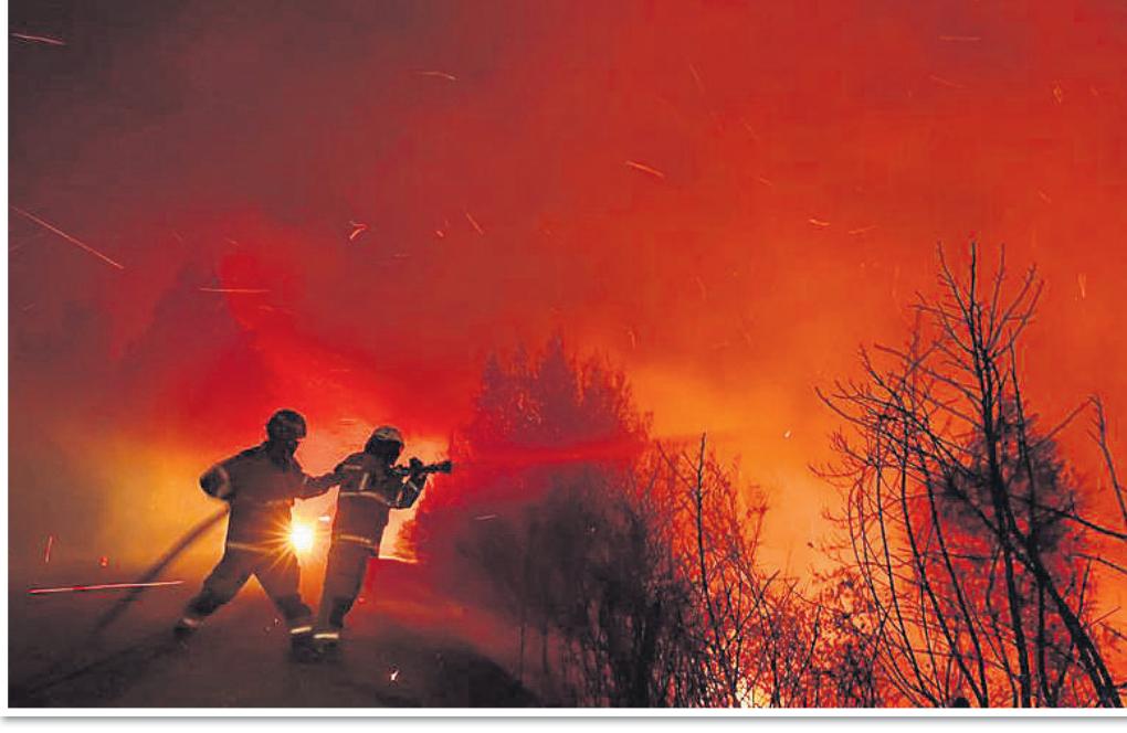
ଚିଲିରେ ବନାଗ୍ନି ଘାତକ ସାଜିଥିବାବେଳେ କ୍ୱିଲୋନରେ ନିଆଁ ଲାଭାଉଛନ୍ତି ଅଗ୍ନିଶମ ବାହିନୀ।