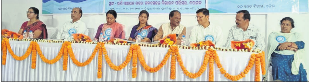
ଜିଲ୍ଲାପ୍ରଧାନ ପାଣି ପଞ୍ଚାୟତର ଉପସଭାରେ ମଞ୍ଚାଧ୍ୟକ୍ଷ ଅତିଥିବୃନ୍ଦ।

ବରଗଡ଼ କେନାଲ କଲୋନୀ ପରିସରରେ ଥିବା ପାଣି ପଞ୍ଚାୟତ ଭବନରେ ବୁଧବାର ଜିଲ୍ଲାପ୍ରଧାନ ପାଣି ପଞ୍ଚାୟତର ଉପସଭା ଯୋଜନା କରାଯାଇଥିଲା।