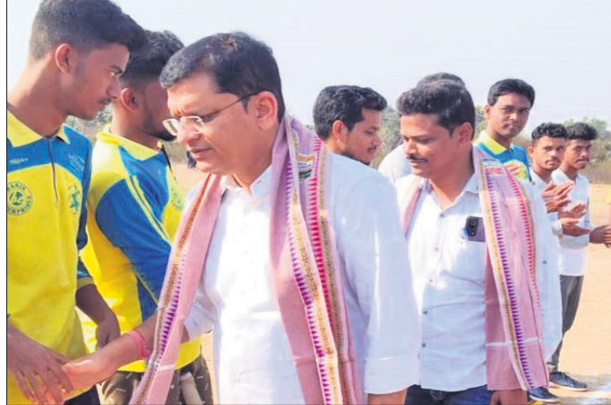
ବରଗଡ଼ ବିଧାୟକ ଖେଳାଳିଙ୍କ ସହିତ କରମନ୍ଦନ କରୁଛନ୍ତି।

ବରଗଡ଼ ବ୍ଲକ୍ ଅନ୍ତର୍ଗତ ଶସୁପାଲି ଗ୍ରାମରେ ଏକଦିବସୀୟ କ୍ରିକେଟ୍ ପ୍ରତିଯୋଗିତା ଅନୁଷ୍ଠିତ ହୋଇଛି। ପ୍ରତିଯୋଗିତାରେ ବିଶିପାଲି, ଶସୁପାଲି, ବାଲିଯୋଡା, ସାହସପୁର, କଳାଟାପାଲି, ଶ୍ରୀଗିଡ଼ା, ବାନ୍ଦେନବାହାଳ, ଚିକନିପାଲି ଏବଂ ବାନ୍ଦେନବାହାଳ ଫାଇନାଲକୁ ଉନ୍ନତ ହୋଇଥିଲେ।