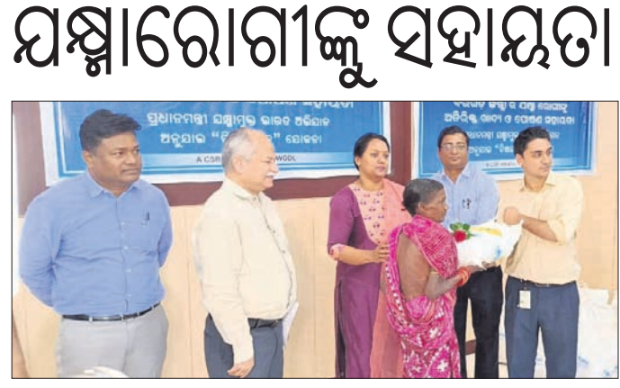
ଚିତ୍ରକୁତ୍ସିତ-ଏଲ ପକ୍ଷରୁ ଯତ୍ନାବେଶୀଙ୍କୁ ସହାୟତା ପ୍ରଦାନ କରାଯାଇଛି।

ଫେରାଦ ହୋଇଥିଲେ। ଜିଲ୍ଲା ନିଶା କାରବାର ହଟାଇବା ସହିତ ପୋଲିସ୍ ପାଟ୍ରୋଲିଂ କଡ଼ାକଡ଼ି କରିବା ଏବଂ ସେଭଳି ଅସାମାଜିକ କାର୍ଯ୍ୟକଳାପରେ ସମ୍ପୂର୍ଣ୍ଣ ଅଭିଯୋଗ ବିରୋଧରେ ଦୃଢ଼ କାର୍ଯ୍ୟାନୁଷ୍ଠାନ ନେବାକୁ ସେମାନେ ଦାବି କରିଛନ୍ତି।