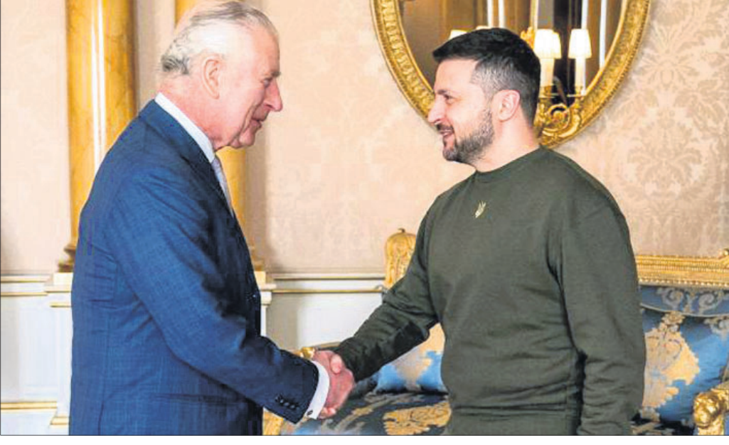
ବକ୍ସିହାମ୍ ପ୍ୟାଲେସରେ କିଙ୍ଗ୍ ଚାର୍ଲ୍ସ୍ ଥାଉସଣ୍ଡ୍ ସହ କରମର୍ଦନ କରୁଥିବା ମୁକ୍ତେନ୍ଦ୍ର ରାଷ୍ଟ୍ରପତି ଭୋଲୋଡିମିର ଜେଲେନ୍ସ୍କି।