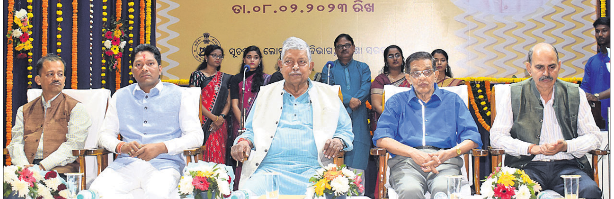
ସୂଚନା ଭବନଠାରେ ସ୍ୱରାଜ୍ୟ ପବିତ୍ର ମୋହନ ପ୍ରଧାନଙ୍କ ରାଜ୍ୟସ୍ତରୀୟ ଜୟନ୍ତୀ କାର୍ଯ୍ୟକ୍ରମରେ ଉପସ୍ଥିତ ଅତିଥିମାନେ।

ଭୁବନେଶ୍ୱର, ୮୨ (ବ୍ୟୁରୋ) ଓଡ଼ିଶାର ଗଡ଼ଜାତ ଅଞ୍ଚଳର ରାଜା, ଜର୍ମିନାରଳ ଅତ୍ୟାଚାରୀ ଶାସନ ବିରୋଧରେ ସ୍ୱର ଉତ୍ତୋଳନ କରିଥିଲେ ବିଶିଷ୍ଟ ସଂଗ୍ରାମୀ ତଥା ଓଡ଼ିଶାର ପୂର୍ବତନ ଉପମୁଖ୍ୟମନ୍ତ୍ରୀ ପବିତ୍ର ମୋହନ ପ୍ରଧାନ। ଅପୂର୍ବ ତ୍ୟାଗ, ସାହସିକତା ଓ ନିଷ୍ଠା ବଳରେ ଜନସାଧାରଣଙ୍କ ପାଖରେ ସେ ନିଜର ଏକ ସ୍ୱତନ୍ତ୍ର ପରିଚୟ ସୃଷ୍ଟି କରିପାରିଥିଲେ। ମୂଲ୍ୟବୋଧଭିତ୍ତିକ ଆଦର୍ଶ, ତ୍ୟାଗ, ସଂଗ୍ରାମୀ କାର୍ଯ୍ୟକଳାପ, ସାହିତ୍ୟ