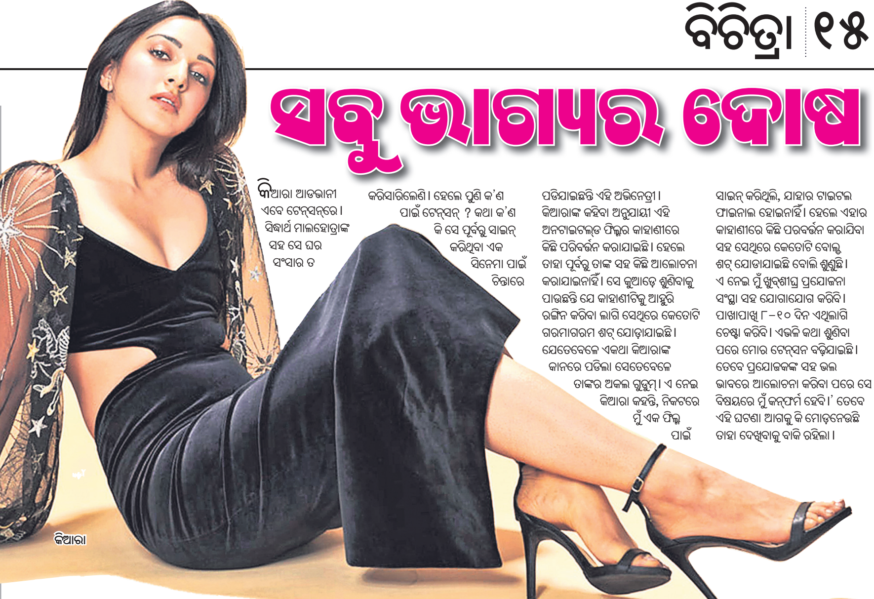
କିଆରା ଆଡଭାନୀ ଏବେ ଟେଲିଭିସନ୍ରେ। ସିଦ୍ଧାର୍ଥ ମାଲହୋତ୍ରାଙ୍କ ସହ ସେ ଘର ସଂସାର ତ