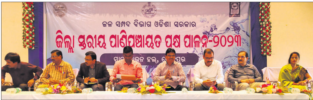
ଜଳ ସମ୍ପଦ ବିଭାଗ ଓଡ଼ିଶା ସରକାର ଜିଲ୍ଲା ସ୍ତରୀୟ ପାଣିପାଗର ପସ ପାଳନ-୨୦୨୩

ସୁବର୍ଣ୍ଣପୁର ଜିଲ୍ଲାସ୍ତରୀୟ ପାଣି ପଞ୍ଚାୟତ ପସ ପାଳନ ଅବସରରେ ମଞ୍ଚାସୀନ ଅତିଥି ବୃନ୍ଦ ।