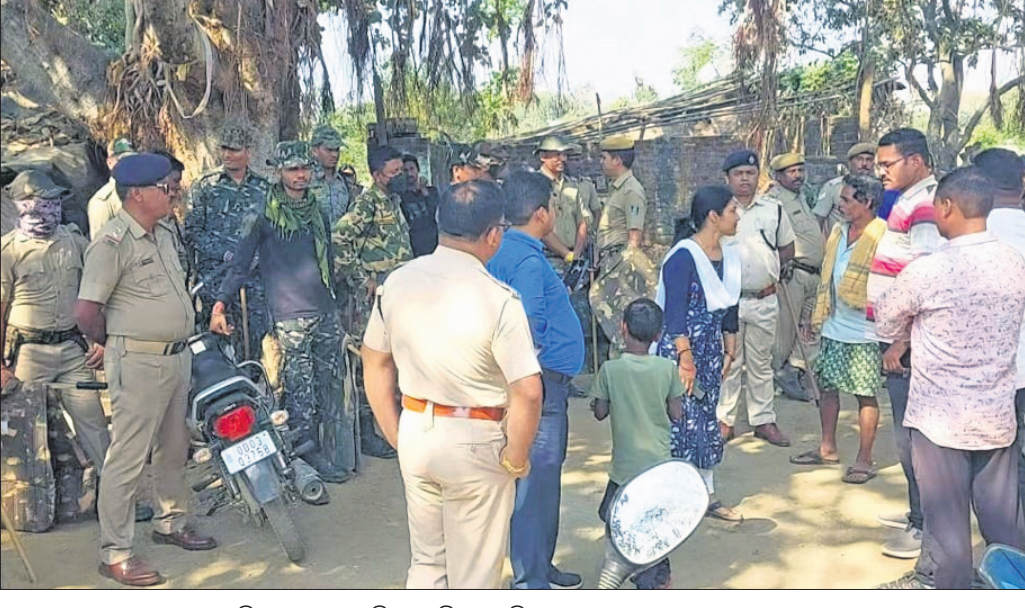
ଭୁଲସାନଗର ଠାରେ ଉଦ୍ଧୃତ କରିବାକୁ ଯାଇଥିବା ଟିଏ ଫୋଟି ଆସୁଛନ୍ତି।