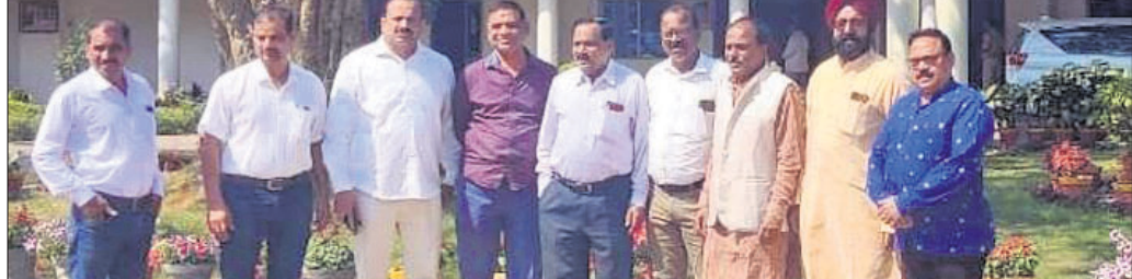
ଏସ୍ପିଙ୍କୁ ଫେରାଦ ହୋଇଥିବା ଭାଜପା ପ୍ରତିନିଧି ଦଳ।

ବରଗଡ଼ ଅଫିସ୍, ୮୧୨ ବରଗଡ଼ ଜିଲ୍ଲାରେ ଆପରାଧୀଙ୍କୁ