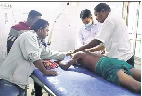
ଡାକ୍ତରଖାନାରେ ଚିକିତ୍ସିତ ଗୁରୁତର ଲୋକେ।

ଆନନ୍ଦପୁର, ୮୨ (ସ.ପ୍ର.): କେନ୍ଦୁଝର ଜିଲ୍ଲା ଆନନ୍ଦପୁର ପୌରପରିଷଦ ଅନ୍ତର୍ଗତ ୧୫ ନଂ. ଖାର୍ତ୍ତ ଘଣ୍ଟିପୁରସ୍ଥିତ ଝାଡ଼େଶ୍ୱର ମନ୍ଦିର ନିକଟରେ ମହୁମାଛି ଆକ୍ରମଣରେ ୧୯ରୁ ଉର୍ଦ୍ଧ୍ୱ ଆହତ ହୋଇଛନ୍ତି। ସେଥି ମଧ୍ୟରୁ ୪ ଜଣଙ୍କ ଅବସ୍ଥା ଗୁରୁତର ହେବାରୁ ଆନନ୍ଦପୁର ମୁଖ୍ୟ ଚିକିତ୍ସାଳୟରେ ଭର୍ତ୍ତି କରାଯାଇଛି। ସୂଚନା ଅନୁଯାୟୀ, ମନ୍ଦିର ନିକଟ ଏକ ଗଛରେ ମହୁମାଛି ଘୋର ରହିଥିଲା। ରୁଧିରାଭର ମହୁମାଛି କୌଣସି କାରଣରୁ ବିଶିଷ୍ଟ ଅବସ୍ଥାରେ ଏଗୋଟିଗୋଟି ବୁଲୁଥିଲେ। ଫଳରେ ରାସ୍ତାରେ ଯାତାୟତ କରୁଥିବା ଲୋକଙ୍କୁ ଆକ୍ରମଣ କରିଥିଲେ। ୧୯ ଜଣ ମହୁମାଛି ଆକ୍ରମଣର ଶିକାର ହୋଇଥିଲେ। ସମସ୍ତଙ୍କୁ ଚିକିତ୍ସା ନିମନ୍ତେ ଆନନ୍ଦପୁର ମୁଖ୍ୟ ଚିକିତ୍ସାଳୟରେ ଭର୍ତ୍ତି କରାଯାଇଥିଲା। ୧୫ ଜଣ ପ୍ରାଥମିକ ଚିକିତ୍ସା ପରେ ଘରକୁ ଫେରିଯାଇଥିବା ବେଳେ ୪ ଜଣ ଗୁରୁତର ଚିକିତ୍ସା କାରି ରହିଛି। ସେମାନଙ୍କ ସ୍ୱାସ୍ଥ୍ୟ ବସ୍ତା ସ୍ଥିର ଥିବା ଡାକ୍ତରଖାନା ପକ୍ଷରୁ ସୂଚନା ମିଳିଛି।