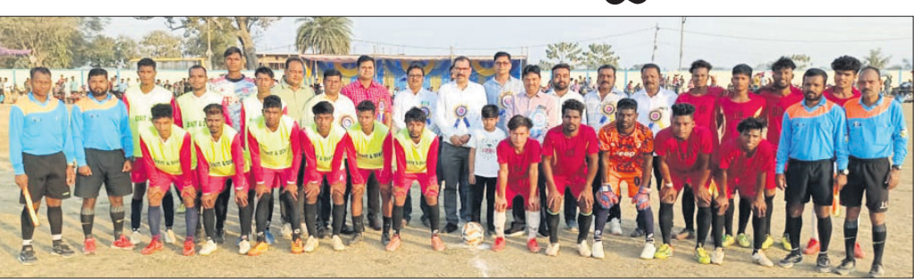
ଅତିଥିଙ୍କ ଗହଣରେ ଖେଳାଳି ।