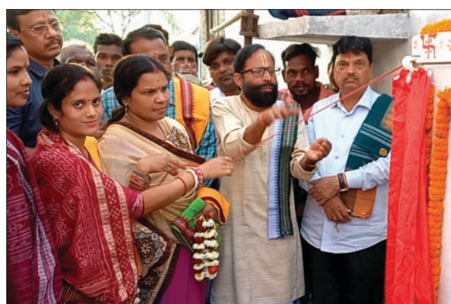
ମନ୍ତ୍ରୀ ନିରଞ୍ଜନ ପୂଜାରୀଙ୍କ ଦ୍ୱାରା ରାସ୍ତା ଉନ୍ନତିକାରଣ ପାଇଁ ଭିଡିପ୍ରସ୍ତର ସ୍ଥାପନ କରାଯାଇଛି ।