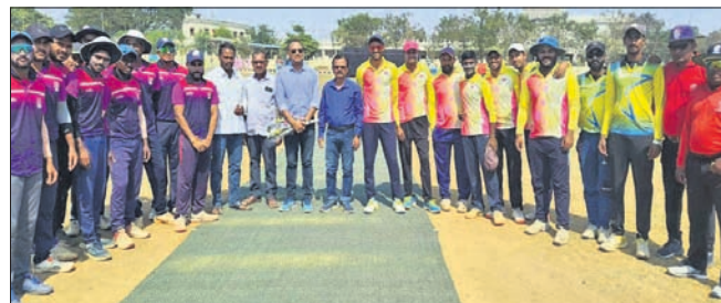
ଖେଳାଳି ଓ ଅତିଥି ।