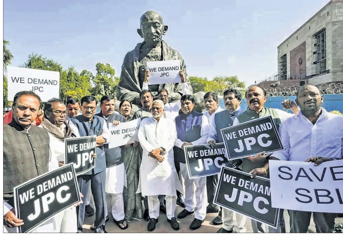
ଆଦାନୀ ଗ୍ରୁପର କାଲିଆଡ଼ ବିରୋଧରେ ଯୁବ ସଂସଦାୟ କମିଟି (କେପିସି) ଦ୍ୱାରା ଯାଜ୍ଞ କରାଯାଇଥିବା ଦାବିରେ ବିରୋଧୀ ଦଳଗୁଡ଼ିକର ଏମ୍ପିମାନଙ୍କ ରୁଧିବାର ପାଇଁ ନେତୃତ୍ୱ ଦେଇଥିବା ସମ୍ମୁଖରେ ବିକ୍ଷୋଭ କରୁଛନ୍ତି।

ସାରଥ ଅଭିନେତ୍ରୀ ସାମନ୍ତା ରୁଥ ପ୍ରଭୁଙ୍କ ଫିଲ୍ମ 'ଶକ୍ତିକମଳ' ରିଲିଜ୍ ଡାଟାରିଖ ଘୋଷଣା ନେଇ ଫିଲ୍ମ ନିର୍ମାତା ଏକ ପୋଷ୍ଟ ଶେୟାର କରି ସନ୍ତୁଷ୍ଟ କରିଛନ୍ତି।