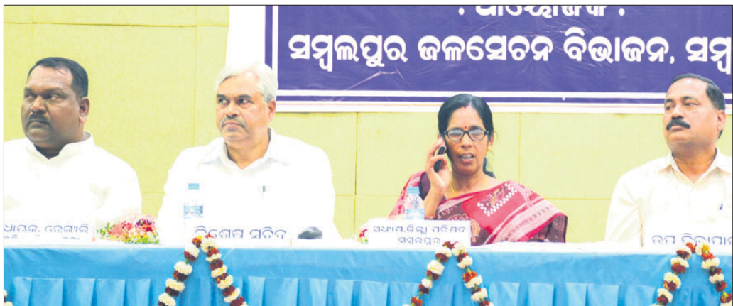
ଜିଲାସ୍ତରୀୟ ପାଣିପଞ୍ଚାୟତ ପକ୍ଷ । ସମ୍ବଲପୁର, ୮୨ (ଭୁବନେ)

ସମ୍ବଲପୁର ଜିଲାସ୍ତରୀୟ ପାଣିପଞ୍ଚାୟତ ପକ୍ଷ ଗୁଣାଧାରୀ ତପସ୍ୱିନୀ ପ୍ରେମାକ୍ଷୟରେ ରୁଧିରୀ ପାଣିତ ହୋଇଯାଇଛି।