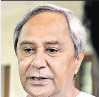
ଭୁବନେଶ୍ୱର, ୮୨ (ବୁଧବୋ)

କେନ୍ଦୁଝର ଜିଲ୍ଲା ଯୋଡ଼ା ଖଣି ମଣ୍ଡଳରୁ ସିରାଜୁଦ୍ଦିନ ଖଣି କମ୍ପାନୀରେ ରୁଧିରାଭର କେନ୍ଦ୍ରୀୟ ଆୟତ୍ତକର ବିଭାଗ ପକ୍ଷରୁ ଚଢ଼ାଉ କରାଯାଇଛି। କେନ୍ଦୁଝର ସହରସ୍ଥିତ ଖଣି କାର୍ଯ୍ୟାଳୟ ସମେତ ଯୋଡ଼ା ଓ କୋଲକାତା କାର୍ଯ୍ୟାଳୟରେ ଚଢ଼ାଉ ଚାଲିଥିବା ସୂଚନା ମିଳିଛି। ଆୟତ୍ତକର ବିଭାଗର ୪ ଟି ଚଢ଼ାଉରେ ସାମିଲ ହୋଇଛନ୍ତି। ଆୟତ୍ତକର ବିଭାଗ ସହିତ ଡାକ୍ତରଖାନା କେନ୍ଦ୍ରରାଜ କର୍ମସିଦ୍ଧାଳ ଇଞ୍ଜିନିୟରିଂ (ଡିଜିଆଇ)ର ଅଧିକାରୀମାନେ ମଧ୍ୟ ଚଢ଼ାଉରେ ସାମିଲ ଥିବା ବିଶ୍ୱସ୍ତ ହୋଇପାରେ। ଖଣି ଖନନ ଅର୍ଥରୁ ଶେଷ ପରେ ନିର୍ମାଣ ପ୍ରକ୍ରିୟାରେ ସିରାଜୁଦ୍ଦିନ କମ୍ପାନୀ ଖଣିକୁ ପୁନଃ ହାତେଇ ଥିଲେ ହେଁ ବିଭିନ୍ନ ବିଧାନିକ କାରଣ ହେତୁ ଏହା ବନ୍ଦ ହୋଇଯାଇଥିଲା। ମାତ୍ର ଏକ ମାସ ହେଲା ଖଣିରେ ପୁର୍ବ ରହିତ ଖଣିକୁ ପରିବହନ ପାଇଁ ସରକାରୀ ଅନୁମୋଦନ ମିଳିଥିଲା। ପରିବହନ କାର୍ଯ୍ୟ ଚାଲିଥିବା ବେଳେ କମ୍ପାନୀ ରୁଧିରାଭର କେନ୍ଦ୍ରୀୟ ଆୟତ୍ତକର ବିଭାଗ ଦ୍ୱାରା ଚଢ଼ାଉର ସମ୍ପୂର୍ଣ୍ଣ ହୋଇଛି। ଚଢ଼ାଉରେ ସାମିଲ ଥିବା ଅଧିକାରୀମାନେ ଗଣମାଧ୍ୟମକୁ କୌଣସି ସୂଚନା ଦେଇ ନ ଥିଲେ। ଏ ନେଇ ଖଣି ନିୟନ୍ତ୍ରଣ ସହ ଯୋଗାଯୋଗ କରାଯାଇଥିଲେ ହେଁ ସେମାନେ ଏ ନେଇ କୌଣସି ପ୍ରତିକ୍ରିୟା ଦେଇ ନାହାନ୍ତି। ଆର୍ଥିକ ହେରଫେରକୁ ନେଇ ଚଢ଼ାଉ ହୋଇଥିବା କୁହାଯାଇଛି।