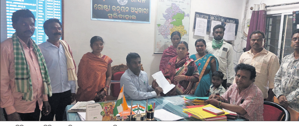
ଜନ ପ୍ରତିନିଧିମାନେ ବିତିଓକୁ ଦାବିପତ୍ର ପ୍ରଦାନ କରୁଛନ୍ତି।