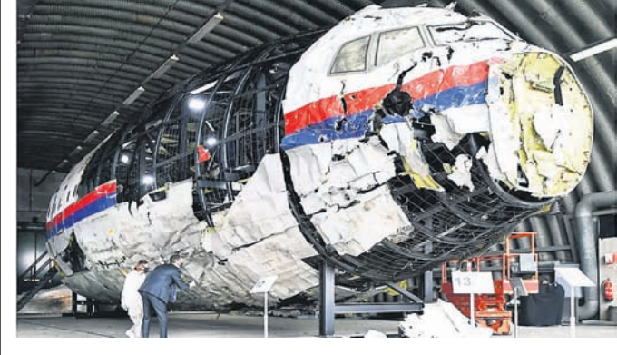
୨୦୧୪ ଜୁଲାଇ ୧୭ରେ ଆମ୍ବୁଗଡ଼ାମରୁ କୁଆଳାକୁସ୍ତ୍ରୀର ଅଭିମୁଖେ ଯାତ୍ରାକରୁଥିବା ମାଲେସିଆ ଏୟାରଲାଇନ୍ସର ଏମ୍ୱଏର୍ ୧୭ ବିମାନ ପୂର୍ବ ଯୁକ୍ରେନ୍ରେ ଭୁଲିତଗାନ୍ତ୍ରଣ ହୋଇଥିଲା। ଏଥିରେ ସମସ୍ତ ୨୯୮ ଯାତ୍ରୀ ପ୍ରାଣ ହରାଇଥିଲେ। ବିରୋଧୀ ମିଶାଲଲ୍ ଆକ୍ରମଣରେ ବିମାନ ଖସିପଡ଼ିଥିବା ପରବର୍ତ୍ତୀ

ଫ୍ରେସ୍ ମିନିଷ୍ଟର ହଲରେ ନିଜ ଐତିହାସିକ ଅଭିଭାଷଣରେ କହିଛନ୍ତି, ଆମ ବୀର ସୈନ୍ୟଙ୍କ ତରଫରୁ ଆପଣମାନଙ୍କୁ ଧନ୍ୟବାଦ ଦେଉଛି। ଏହି ମୁଦ୍ଦରେ ମଧ୍ୟେ ହାରିବ। ରୁଷିଆର ବର୍ତ୍ତତା ବିରୋଧରେ ଯୁକ୍ରେନ୍ ବିଜୟ ହାସଲ କରିବ। ଏହା ଆମ କରିଛନ୍ତି। ତ୍ରେନ୍ମାର୍ଗ ଓ ଲିଫ୍ଟ୍ ସ୍ୱେଚ୍ଚାର୍ଡ୍ ପିନ୍ଧିଥିବା ଜେଲେନ୍ସ୍କି ବ୍ରିଟେନ ପ୍ରଧାନମନ୍ତ୍ରୀ