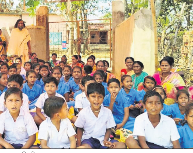
ତାଲା ପଡ଼ିଥିବା ଯୋଗୁଁ ଛାତ୍ରାଛାତ୍ରୀ ବିଦ୍ୟାଳୟ ବାହାରେ ବସିଛନ୍ତି।