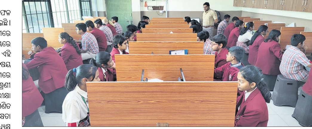
ବିକାଶରେ ଚାଳିଥିବା ସଫଳ ପରୀକ୍ଷା କାର୍ଯ୍ୟକ୍ରମ।

ଉଚ୍ଚ ଶିକ୍ଷାନୁଷ୍ଠାନ ଅଷ୍ଟମ ଶ୍ରେଣୀରେ ପଢୁଥିବା ୧୨୦ଜଣ ଛାତ୍ରଛାତ୍ରୀ ଗପଯାୟତରେ ପରୀକ୍ଷାରେ ଅଂଶଗ୍ରହଣ କରିଛନ୍ତି। ଏହି ପରୀକ୍ଷାରେ ବିଜ୍ଞାନ, ଗଣିତ, ଇଂଲିଶ ବିଷୟ ଖାସ୍ତାରେ ଅନୁଲୀନ ମାଧ୍ୟମରେ କରାଯାଇଛି।