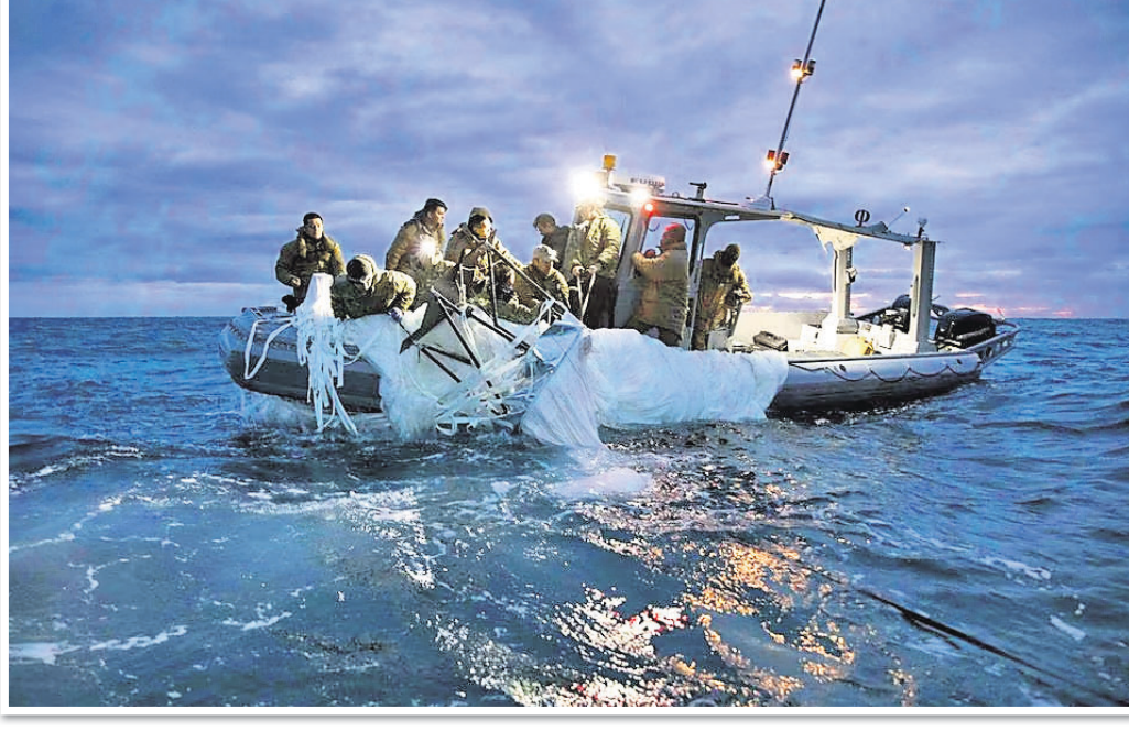
ଆମେରିକାରେ ଉଦ୍ଧୃତବା ଚାଲିନାର ଏକ ସନ୍ଦିଗ୍ଧ ବେଙ୍ଗୁଲୁ ଶନିବାର ସାଉଥ୍ କାରୋଲିନା ଉପକୂଳ ଆକାଶରୁ ଏଫ୍-୨୨ ଫାଇଟର କରିଆରେ ସ୍ତେପଶାସ୍ତ୍ର ମାଡ଼ କରି ଖସାଇ ଦିଆଯାଇଥିଲା। ଏକ୍ସପ୍ଲୋସିଭ୍ ଅର୍ଡନାନ୍ସ ଡିହୋଲାଲ ଗ୍ରୁପ୍ ୨ ଏହାର ଅବଶେଷକୁ ମିଳିତ ବିଦ୍ ନିକଟରେ ଠାବ କରିଛି।