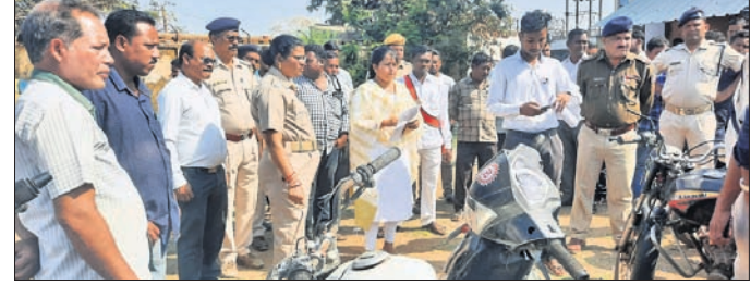
ଗାଡ଼ି ନିରୀକ୍ଷଣ କରୁଛନ୍ତି ଏସିଡିଜିଏସ୍ ଓ ପୋଲିସ୍ ଅଧିକାରୀ।

ଆଦି ଦୃଶ୍ୟ ପରିବେଷିତ ହୋଇଥିଲା। ଭୁବନେଶ୍ୱର ପ୍ରଧାନ ଓ ସାଧୁ ଅଭିନୟ ସମସ୍ତଙ୍କୁ ମନୁଷ୍ୟ କରିଥିଲା।