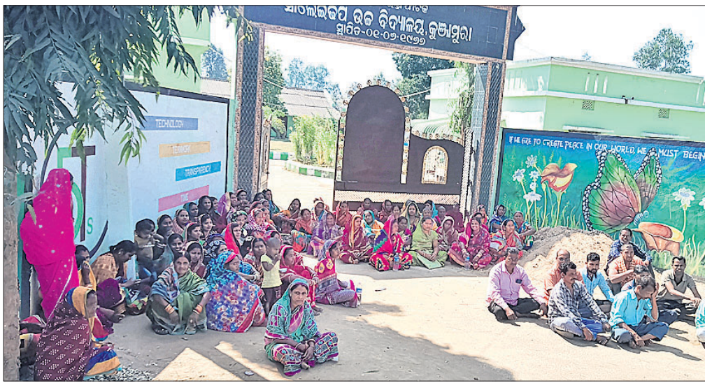
ବିଦ୍ୟାଳୟ ସମ୍ମୁଖରେ ଧାରଣା ଦେଇଛନ୍ତି ମହିଳାମାନେ।

ନାକଟିଦେଉଳ ବ୍ଲକ ବାଟୋରୁ ଲୁଗାପୁରା ସାଲେଇତପ ଉଚ୍ଚବିଦ୍ୟାଳୟରେ ରାତ୍ର ଜଗୁଆଳି ଓ ଝାଡୁଦାର ନିୟୁକ୍ତିରେ ଚଞ୍ଚଳତା କରାଯାଇଥିବା ଅଭିଯୋଗରେ ରୁଧିରୀ ଲୁଗାପୁରା ଗ୍ରାମର ବିଜ୍ଞାନ ମହିଳା ସ୍ୱୟଂ ସହାୟକ ଗୋଷ୍ଠୀର ମହିଳାମାନେ