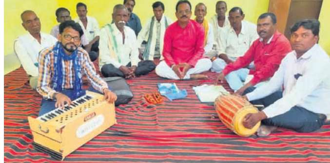
ବୈଠକରେ ଉପସ୍ଥିତ କଳାକାର ଓ ଜନ ପ୍ରତିନିଧି।

ଦୁଇଦିନ ଧରି ଅନୁଷ୍ଠିତ ହେବ। ଏହି ବୈଠକରେ ବାର ବଜରଙ୍ଗବଳି କଳା ଲୋକ ପ୍ରତିଭାକୁ ଉତ୍ସାହିତ କରିବା ଓ ଯୁବପଢ଼ିକ୍ରମ ଲୋକ କଳା ପ୍ରତି ଆକୃଷ୍ଟ କରିବା ପାଇଁ ନିଷ୍ପତ୍ତି ନିଆଯାଇଛି।