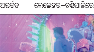
କଂସ ଦରବାରରେ ରାଜ ଅତିଥି।

ଚାଳିଥିବା ଧନୁଯାତ୍ରା ଉତ୍ସବରେ ବୁଧବାର ମଥୁରାନଗରରେ କୃଷ୍ଣ, ବଳରାମକୁ ନିଧନ ପାଇଁ କଂସ ମହାରାଜ ପୁତନାକୁ ଗୋପପୁର