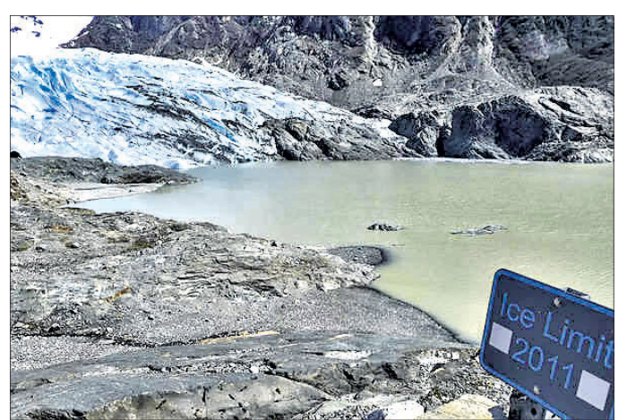
ଲୋକ ବସବାସ କରନ୍ତି। ହିମାବହୁଳ ସୃଷ୍ଟି ହୋଇଥିବା ଏହି ହିମ ହ୍ରଦ ସୃଷ୍ଟି ବାୟୁମଣ୍ଡଳରେ ତାପମାତ୍ରା ବୃଦ୍ଧି ଘଟିବା ଦ୍ୱାରା ହିମ ହ୍ରଦ ଚରଳିବା ଆରମ୍ଭ କରିବ, ଯାହାଫଳରେ କିଏଲ୍ଏଏଏ ବା ହିମ ହ୍ରଦ ବନ୍ୟା ସୃଷ୍ଟି ହେବ। ପ୍ରକାଶିତ ରିପୋର୍ଟ୍ ସୁଦ୍ଧା ହିମ ହ୍ରଦ ବନ୍ୟା ସୃଷ୍ଟି ହେବା ଦ୍ୱାରା ଏହି ବାୟୁମଣ୍ଡଳରେ ତାପମାତ୍ରା ବୃଦ୍ଧି ଘଟିବା ଦ୍ୱାରା ହିମ ହ୍ରଦ ଚରଳିବା ଆରମ୍ଭ କରିବ, ଯାହାଫଳରେ କିଏଲ୍ଏଏଏ ବା ହିମ ହ୍ରଦ

ଭବିଷ୍ୟତରେ ସାରା ବିଶ୍ୱ ହିମ ହ୍ରଦ ବନ୍ୟା ହେବାର ପ୍ରଭାବିତ ହେବାକୁ ଯାଉଛି। ବ୍ରିଟେନ ଟ୍ୟୁକାଣ୍ଡଲ୍ ସୁନିଭର୍ସିଟି ବିଶେଷଜ୍ଞମାନଙ୍କ ଦ୍ୱାରା କରାଯାଇଥିବା ଅଧ୍ୟୟନରେ ଏହା ଜଣାପଡ଼ିଛି। ଗ୍ଲାସିଆଲ୍ ଲେକ୍ ଆଉଟ୍ରିଷ୍ଟ୍ ଫ୍ଲୁ (କିଏଲ୍ଏଏଏ) ବା ହିମ ହ୍ରଦ ବନ୍ୟା ସମ୍ପର୍କିତ ଅଧ୍ୟୟନର ବିସ୍ତୃତ ତଥ୍ୟ ଜର୍ମାନି ନେଟର କମ୍ୟୁନିକେଶନ୍ରେ ପ୍ରକାଶ ପାଇଛି। ରିପୋର୍ଟ୍ ସୁଚନା ଦେଖି ୧୫ ନିୟୁତ ଲୋକେ ଏହା ଦ୍ୱାରା ପ୍ରଭାବିତ ହେବେ। ଭାରତ ଉପରେ ମଧ୍ୟ ଏହାର ପ୍ରଭାବ ପଡ଼ିବ ଯଦ୍ୱାରା ପାଖାପାଖି ୩ ନିୟୁତ ଲୋକଙ୍କୁ କିଏଲ୍ଏଏଏ ପ୍ରଭାବିତ କରିବ। ଭାରତ, ପାକିସ୍ତାନ, ଚେଚ୍ଚେନ ଓ ତାଲିକା ବିଶ୍ୱର ୪ ଜନବହୁଳ ରାଷ୍ଟ୍ର। ଏଗୁଡ଼ିକ ମଧ୍ୟରୁ ଭାରତ ଓ ପାକିସ୍ତାନରେ ସର୍ବାଧିକ