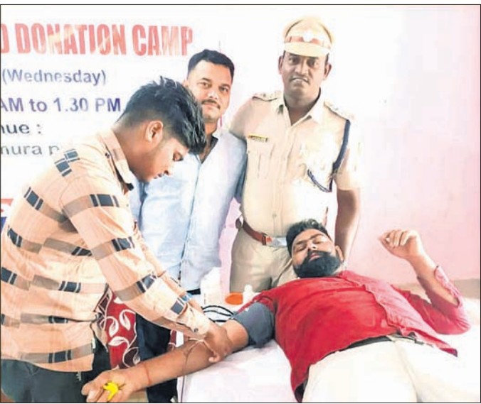
ଜଣେ ସ୍ୱେଚ୍ଛାସେବୀ ରକ୍ତଦାନ କରୁଛନ୍ତି। ବରିଷ୍ଠ ଲାଏ ଡାକ୍ତରୀଆନ ସହୋଷ ଗୋଟ, କାଉନସିଲର କର୍ମଦେବ

ସୁଯୁକ୍ତ ସମୟ ଆନା ପରିସରରେ ରୁଧିରୀର ଜିଲା ପୋଲିସ ପକ୍ଷରୁ ରକ୍ତଦାନ ଶିବିର ଆୟୋଜନ କରାଯାଇଥିଲା। ଏଥିରେ ମୋଟ ୪୬ ଯୁନିଟ୍ ରକ୍ତ ସଂଗ୍ରହ ହୋଇଥିଲା।