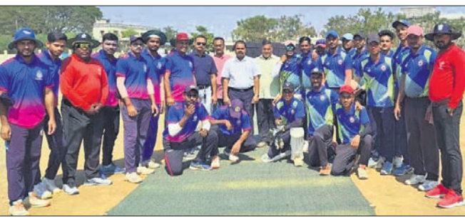
ଖେଳାଳି ଓ ଅତିଥି ।