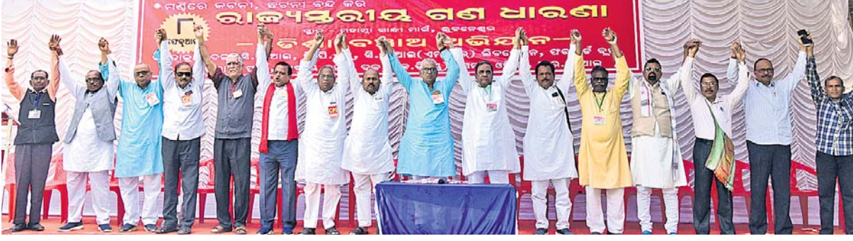
ଭୁବନେଶ୍ୱର, ୯୨ (ସୁ.ରୋ.)

ଚଳିତବର୍ଷ ଚାଷୀ ଉପାଦିତ ଧାନ ବିକ୍ରି କରିବାରେ ଘୋର କ୍ଷତି ଓ ଅସୁବିଧାର ସମ୍ମୁଖୀନ ହେଉଛନ୍ତି । କିଣା ସମୟରେ କଟକ ଛଟନା ଦ୍ୱାରା ଶୋଷଣ କରାଯାଇଛି । ସରକାର ଭାଗଚାଷୀଙ୍କୁ ଚାଷୀର ମାନ୍ୟତା ଦେଇ ସରକାରୀ କ୍ରୟ କେନ୍ଦ୍ରରେ ଧାନ ବିକ୍ରି କରିବାର ଅଧିକାର ଦେଉନାହାନ୍ତି । ଚାଷୀଙ୍କୁ ମିଳିବାକୁ ଥିବା ଅନ୍ୟାନ୍ୟ ସୁବିଧା ମଧ୍ୟ ସେମାନଙ୍କୁ ଦିଆଯାଇ ନାହିଁ । ଧାନ କିଣାବିକାରେ ପ୍ରବଳ ଦୁର୍ନୀତି ହେଉଛି । ଚାଷୀଙ୍କୁ ବିକ୍ରି କେନ୍ଦ୍ର ପ୍ରଦାନରେ ବିଲମ୍ବ ହେଉଥିବାରୁ ଏହାର ପ୍ରତିବାଦରେ ୧୦ ବିରୋଧୀ ରାଜନୈତିକ ଦଳକୁ ନେଇ ଗଠିତ ଓଡ଼ିଶା ବଞ୍ଚା ଅଭିଯାନ ପକ୍ଷରୁ ଲୋକସଭା ପିଏମ୍‌ଜିରେ ରାଜ୍ୟସଭାରେ ଗଣଧାରଣା ଦିଆଯାଇଥିଲା । ଏଥିରେ ସମଗ୍ରାନ୍ତ ଦଳ, ସିପିଆଇ(ଏମ୍),