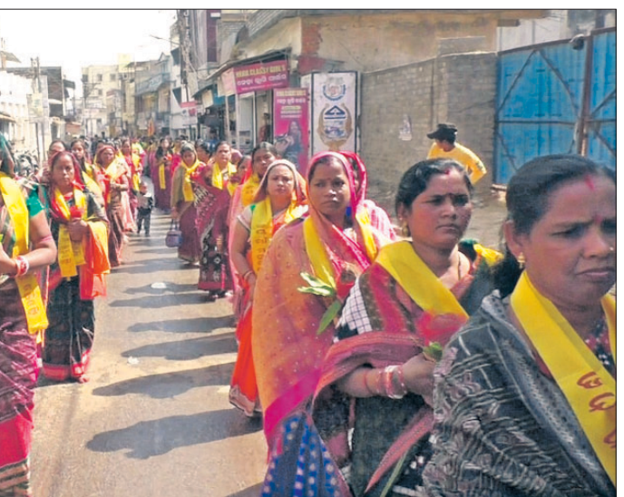
ମହିଳାମାନେ କଳସ ଯାତ୍ରାରେ ବାହାରିଛନ୍ତି।