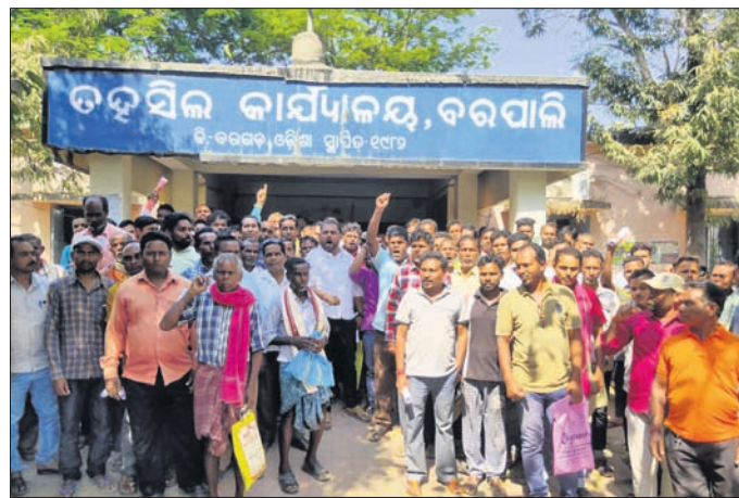
ଉପଭୋକ୍ତାମାନେ ତହସିଲ ଅଫିସ ଘେରାଉ କରିଛନ୍ତି।

ଏରିୟର ବିଲକୁ ନେଇ ବରଗଡ଼ ଜିଲ୍ଲା ବରପାଲି ବ୍ଲକ ଅନ୍ତର୍ଗତ ୨୩ଟି ପଞ୍ଚାୟତ ଓ ବରପାଲି ସହରର ବିଦ୍ୟୁତ୍ ଉପଭୋକ୍ତାଙ୍କ ମଧ୍ୟରେ ଅସନ୍ତୋଷ ପ୍ରକାଶ ପାଇଛି।