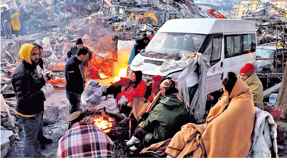
ଶୀତରୁ ରକ୍ଷା ପାଇବା ପାଇଁ ଭୂକମ୍ପ ବିପନ୍ନମାନେ ନିଆଁ ପୋଉଛନ୍ତି।

ଆକାଶ/ତାପାସକ୍ଷ, ୯।୨ ଦୁର୍ଗା ଓ ସିରିଆରେ ପ୍ରକଳ୍ପକାରୀ ଭୂକମ୍ପନିତ ମୃତ୍ୟୁସଂଖ୍ୟା ଗୁରୁବାର ୧୯,୩୦୦ ଟପିଛି। ଭୂକମ୍ପକୁ ୪ ଦିନ ବିଚ୍ଛିନ୍ନ ହେଉଥିବା ସତ୍ତ୍ୱେ ମୋଟ ହଜାର ୧୯,୩୦୦ କାର୍ଯ୍ୟ ବାଧାପ୍ରାପ୍ତ ହୋଇଛି। ଭଗବାନେଶ୍ୱର ଚଳୁ ଜୀବନ ବଞ୍ଚାଇବା ପାଇଁ ୭୨ ଘଣ୍ଟା ଗୁରୁତ୍ୱପୂର୍ଣ୍ଣ ବୋଲି ବିଶେଷଜ୍ଞମାନେ କହୁଥିବାବେଳେ ସେହି ସମୟ ଅତିକ୍ରାନ୍ତ ହୋଇଯାଇଛି। ଆକାଶ୍ୟ ସହରର ହସ୍ପିଟାଲ ପାଇଁ ସ୍ଥାନରେ ସୁତରାହ ରଖାଯାଇଥିବା ବ୍ୟତୀତ ଲୋକମାନେ ସେମାନଙ୍କ ନିକଟାଳ ସମ୍ପର୍କୀୟଙ୍କୁ ଖୋଜୁଥିବା ଦେଖାଯାଇଛି। ଭୂକମ୍ପରେ ବାସହରା ଲୋକମାନେ ପ୍ରବଳ ଶୀତରେ ନାହିଁ ନ ଥିବା ଅଧିବିଧାର ସମ୍ମୁଖୀନ ହୋଇଛନ୍ତି। ରହିବା ପାଇଁ ଆଶ୍ରୟସ୍ଥଳ ନ ଥିବାବେଳେ ଖାଦ୍ୟ ଓ ବିଦ୍ୟୁତ୍ ଘୋର ଅଭାବ ଦେଖାଦେଇଛି। ଉଦ୍ଧାର କାର୍ଯ୍ୟରେ ୧,୧୩,୨୦୦ ରୁ ଅଧିକ କର୍ମଚାରୀ ନିୟୋଜିତ ହୋଇଛନ୍ତି। ଭୂକମ୍ପ କ୍ଷତିଗ୍ରସ୍ତ ଅଞ୍ଚଳକୁ ଗୁରୁତ୍ୱପୂର୍ଣ୍ଣ ବୋଲି ବିଶେଷଜ୍ଞମାନେ କହୁଥିବାବେଳେ ସେହି ସମୟ ଅତିକ୍ରାନ୍ତ ହୋଇଯାଇଛି। ଆକାଶ୍ୟ ସହରର ହସ୍ପିଟାଲ ପାଇଁ ସ୍ଥାନରେ ସୁତରାହ ରଖାଯାଇଥିବା ବ୍ୟତୀତ ଲୋକମାନେ ସେମାନଙ୍କ ନିକଟାଳ ସମ୍ପର୍କୀୟଙ୍କୁ ଖୋଜୁଥିବା ଦେଖାଯାଇଛି।