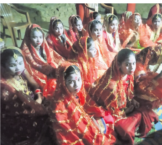
ଗୋପାମାନେ ଉତ୍ସବ ମନାଉଛନ୍ତି।

ବରଗଡ଼ ଜିଲ୍ଲା ଅୟାଜୋନା ବ୍ଲକ ଅନ୍ତର୍ଗତ ଲେଲେହର-ଚଣ୍ଡିପାଲି ଧନୁଯାତ୍ରା ମହୋତ୍ସବ ଅବସରରେ ଗୁରୁବାର ଗୋପପୁରରେ ନନ୍ଦୋତ୍ସବ ହୋଇଥିଲା।