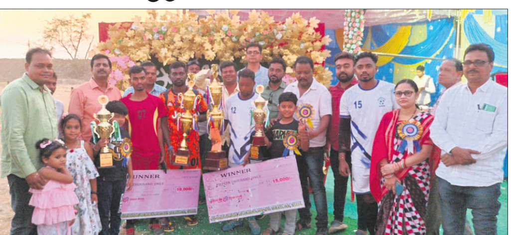
ଅତିଥିଙ୍କ ସହ ଖେଳାଳି ।