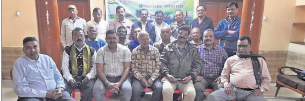
ବୈଠକରେ ଉପସ୍ଥିତ ମଞ୍ଚର କର୍ମକର୍ତ୍ତାଗଣ।