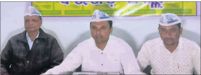
ଖବରଦାତା ସମ୍ମିଳନୀରେ ଏଏପିର ନେତୃତ୍ୱ।

ବେଳେ ହଠାତ୍ ଭାଜପାକୁ ଚାଷୀ ବିରୋଧୀ କହିବା ଆହୁରି ଚକିତ କରୁଛି। ବରପାଲି ବ୍ଲକ, କୃଷି ଆଇନ, ପେଟ୍ରୋଲ, ଡିଜେଲ, ଗ୍ୟାସ୍ ଦରବୃଦ୍ଧି ବେଳେ କେବେ ବିଜେଡି ବିରୋଧୀ ନ କରି ଓଲଟା ଭାଜପାକୁ ସମର୍ଥନ ଦେଇଆସିଛି।