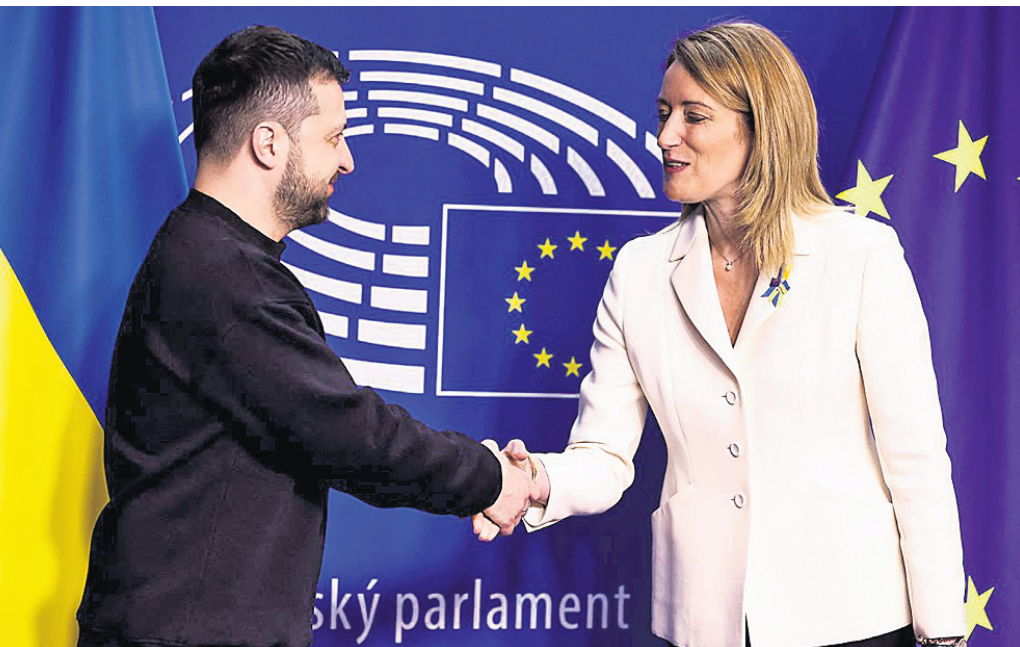
ୟୁକ୍ତମୁକ୍ତ ରାଷ୍ଟ୍ରପତି ଭୋଲୋଡିମିର ଜେଲେନ୍ସ୍କି ୟୁରୋପୀୟ ପାର୍ଲିମେଣ୍ଟ ପ୍ରେସିଡେଣ୍ଟ ଭେରଗ୍‌ନା ମେଟସୋଲାଙ୍କ ସହ କରମର୍ଦ୍ଦନ କରୁଛନ୍ତି।

ବ୍ରସେଲ୍, ୯।୨ ଯୁକ୍ତମୁକ୍ତ ରାଷ୍ଟ୍ରପତି ଭୋଲୋଡିମିର ଜେଲେନ୍ସ୍କି ଗୁରୁବାର ୟୁରୋପୀୟ ପାର୍ଲିମେଣ୍ଟରେ ଉଦ୍‌ବୋଧନ ଦେଇ ରୁଷିଆର ମୁକାବିଲା ପାଇଁ ଅଧିକ ସୈନ୍ୟ ବଳ ଯୋଗାଇ ଦେବାଲାଗି ଅନୁରୋଧ କରିଛନ୍ତି। ଏହି ଅବସରରେ ସେ କହିଛନ୍ତି, ଯୁକ୍ତମୁକ୍ତ ଏବଂ ୟୁରୋପୀୟ ସଂଘ ମିଳିତ ଭାବେ ରୁଷିଆ ବିରୋଧରେ ଲଢ଼େଇ ଆରମ୍ଭ କରିବାକୁ ପ୍ରୋତ୍ସାହନ ଦେବାକୁ ଅନୁରୋଧ କରିଛନ୍ତି।