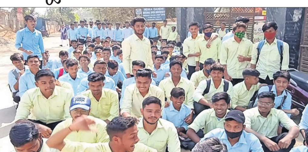
ବରଗଡ଼ ପଞ୍ଚାୟତ କଲେଜ ଆଗରେ ଛାତ୍ରାବାସ ଅନ୍ତେବାସୀ ଧାରଣାରେ ବସିଛନ୍ତି।

ବରଗଡ଼ ପଞ୍ଚାୟତ କଲେଜ ଛାତ୍ରାବାସ ଅନ୍ତେବାସୀଙ୍କୁ ମୌଳିକ ସୁବିଧା ପୁଞ୍ଜା ମିଳୁନାହିଁ। ଏକ ଅଭିଯୋଗ କରି ଗୁରୁବାର ସେମାନେ କଲେଜ ଆଗରେ ଧାରଣାରେ ବସିଥିଲେ।