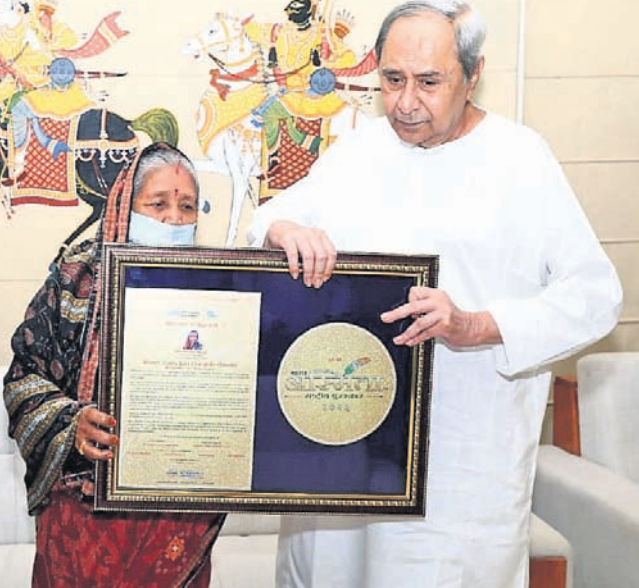
ପୁଣ୍ୟମନ୍ତ୍ରୀଙ୍କ ରିଲିଫ୍ ପାଠିକ୍ରମ ପ୍ରଦାନ ରୀତି ୨୫ ହଜାର ଟଙ୍କା