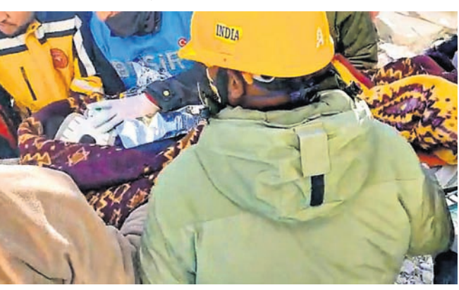
ନୂଆଦିଲ୍ଲୀ, ୯।୨ ଦୁର୍ଗା ଭୂକମ୍ପ ବିଧ୍ୱସ୍ତ ଅଞ୍ଚଳରେ ଉଦ୍ଧାର କାର୍ଯ୍ୟରେ ନିୟୋଜିତ ଥିବା ଭାରତର ଜାତୀୟ ବିପର୍ଯ୍ୟୟ ପ୍ରଶମନ ବଳ (ଏନ୍ଡିଆରଏଫ୍) ଟିମ୍ ଜଣେ ୬ ବର୍ଷର ବାଳିକାକୁ ଭଗବାନେଶ୍ୱର ଚଳୁ ପୁରୁଣିତ ଉଦ୍ଧାର କରିଛନ୍ତି। କମଳରେ ଗୁରାଯାଇଥିବା ଶିଶୁଟିକୁ ଏନ୍ଡିଆରଏଫ୍

ନୂଆଦିଲ୍ଲୀ, ୯।୨ ଦୁର୍ଗା ଭୂକମ୍ପ ବିଧ୍ୱସ୍ତ ଅଞ୍ଚଳରେ ଉଦ୍ଧାର କାର୍ଯ୍ୟରେ ନିୟୋଜିତ ଥିବା ଭାରତର ଜାତୀୟ ବିପର୍ଯ୍ୟୟ ପ୍ରଶମନ ବଳ (ଏନ୍ଡିଆରଏଫ୍) ଟିମ୍ ଜଣେ ୬ ବର୍ଷର ବାଳିକାକୁ ଭଗବାନେଶ୍ୱର ଚଳୁ ପୁରୁଣିତ ଉଦ୍ଧାର କରିଛନ୍ତି। କମଳରେ ଗୁରାଯାଇଥିବା ଶିଶୁଟିକୁ ଏନ୍ଡିଆରଏଫ୍ ଦୁର୍ଗା ଭୂକମ୍ପ ବିଧ୍ୱସ୍ତ ଅଞ୍ଚଳରେ ନେଉଥିବା ଦେଖିବାକୁ ମିଳିଛି। ଗ୍ରାହଣ ବିରୋଧେ ଭାରତର ଏନ୍ଡିଆରଏଫ୍ ଯବାନମାନେ ଉଦ୍ଧାର ଓ ରିଲିଫ୍ କାର୍ଯ୍ୟରେ ନିୟୋଜିତ ଅଛନ୍ତି। ଗୁରୁବାର ଟିମ୍ ଜଣେ-୧୧ ନାଜିଆଖେପୁର ନୁରଦାରି ଅଞ୍ଚଳକୁ ୬ ବର୍ଷର ଝିଅକୁ ଉଦ୍ଧାର କରିଥିବା ସ୍ୱରାଷ୍ଟ୍ର ମନ୍ତ୍ରାଳୟରୁ ମୁଖ୍ୟମନ୍ତ୍ରୀ କୁହାଯାଇଛି।