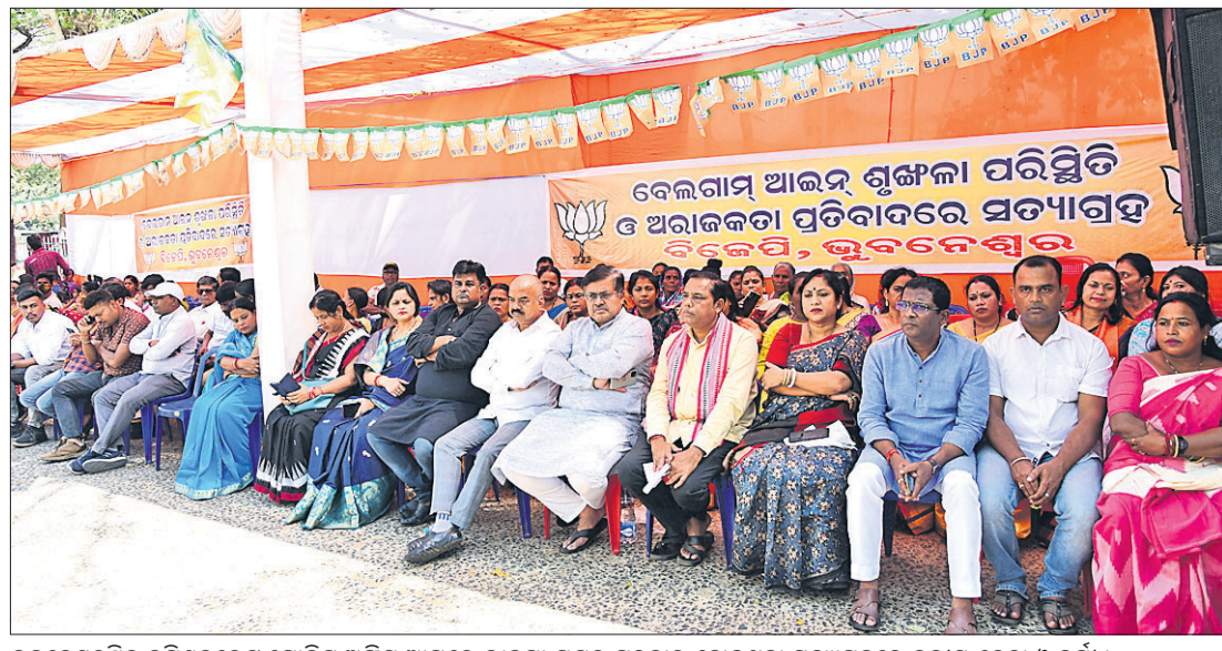
ଭୁବନେଶ୍ଵରରୁ କମିଶନରେଟ୍ ପୋଲିସ୍ ଅଫିସ୍ ଆଗରେ ଭାଜପା ପକ୍ଷରୁ ଗୁରୁବାର ହୋଇଥିବା ସତ୍ୟଗ୍ରହରେ ଦଳୀୟ ନେତା ଓ କର୍ମୀ ।