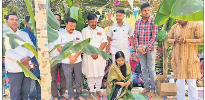
ଉତ୍ସବରେ ବିଧାୟକଙ୍କ ସହ ଅନ୍ୟମାନେ ।