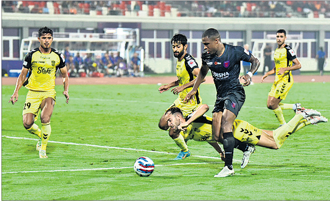
ଓଡ଼ିଶା ଏଫସି ଓ ହାଇଦ୍ରାବାଦ ଏଫସି ମଧ୍ୟରେ ଅନୁଷ୍ଠିତ ମ୍ୟାଚର ଏକ ସଂଘର୍ଷପୂର୍ଣ୍ଣ ପୂର୍ଣ୍ଣ।

୪୪ତମ ମିନିଟରେ ନିମ୍ନ ବୋର୍ଡିଙ୍ଗ ଓଏଫସି ଗୋଲ ଅମରିତର ସିଂଲ୍ ଚକମା ଦେଇ ଖୋରି କରିଥିଲେ। ପ୍ରଥମାର୍ଦ୍ଧ ୧-୧ରେ ଶେଷ ହେବା ପରେ ୭୨ ତମ ମିନିଟରେ ଓଏଫସି ଅଗ୍ରଣୀ ହାସଲ କରିଥିଲା। ଓଏଫସି ମରିସିଓକ ପାଶୁ ନନ୍ଦକୁମାର ଶେକର ଗୋଲ ଯୋଷ୍ଟି ଆଡ଼କୁ ମାରିଥିଲେ। ତେବେ ବୋର୍ଡିଙ୍ଗ ଦୁର୍ବଳ ଡିଫେଣ୍ଡିଂ କାରଣରୁ ଏହା ଆୟତ୍ତାତୀ ଗୋଲରେ ପରିଣତ ହୋଇଥିଲା।