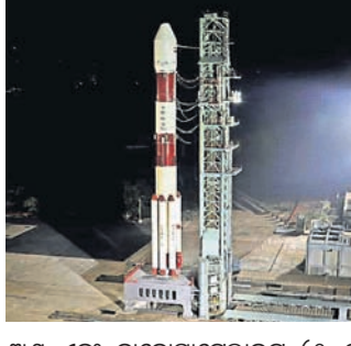
ଅଣ୍ଡୁ ଏବଂ ନାନୋସାତେଲାଇଟ୍ (୧୦ରୁ ୫୦୦ କିଲୋଗ୍ରାମ ଓଜନ) ପୃଥିବୀର ନିମ୍ନ କକ୍ଷପଥରେ ସ୍ଥାପନ କରାଯାଇପାରିବ।

ଚେନାଇ, ୧୦/୧୧: ଭାରତୀୟ ମହାକାଶ ଗବେଷଣା ସଂସ୍ଥା (ଇସ୍କୋ) ଶୁକ୍ରବାର ୩ଟି ସାତେଲାଇଟ୍‌ସୁ ସେମାନଙ୍କ ନିର୍ଦ୍ଦେଶ କକ୍ଷପଥରେ ସଫଳତାର ସହ ସ୍ଥାପନ କରିଛି। ଶ୍ରୀହରିକୋଟାର ସତ୍ୟା ଧାଡ଼ନ ଉଡ଼େଶପକ୍ଷ କେନ୍ଦ୍ରର ପ୍ରଥମ ଲକ୍ଷ୍ୟ ପ୍ୟାକେଜ୍ ପୂର୍ଣ୍ଣ ୯ଟା ୧୮ ମିନିଟ୍ ସମୟରେ ଇସ୍କୋର ସ୍ୱଳ୍ପ ସାତେଲାଇଟ୍‌ସୁ ଉଡ଼େଇଲେ ବୋଲି ପ୍ରଧାନମନ୍ତ୍ରୀ ଶେହବାଜ୍ ଶରିଫ୍ କହିଛନ୍ତି। ଅନ୍ୟତମରେ ଉଭୟ ପକ୍ଷ ମଧ୍ୟରେ ଆଲୋଚନା ବିଫଳ ହୋଇଥିବା ବେଳେ ଗଣମାଧ୍ୟମରେ ରିପୋର୍ଟ ପ୍ରକାଶ ପାଇଛି।