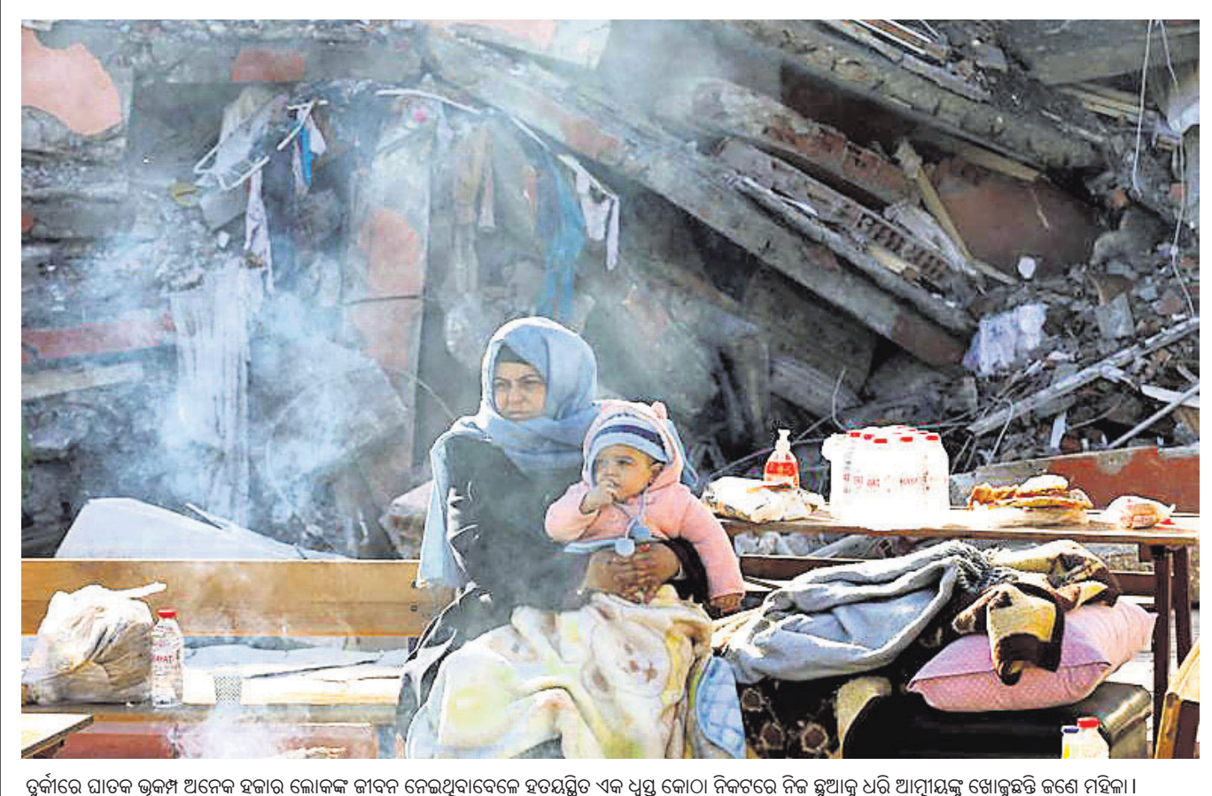
ରୁକ୍ମାରେ ଘାତକ ଭୂକମ୍ପ ଅନେକ ହଜାର ଲୋକଙ୍କ ଜୀବନ ନେଇଥିବାବେଳେ ହତୟତ୍ନିତ ଏକ ଧୂସ୍ର କୋଠା ନିକଟରେ ନିଜ ଛୁଆକୁ ଧରି ଆତ୍ମହତ୍ୟା ଖୋଜୁଛନ୍ତି ଜଣେ ମହିଳା।

ନୂଆଦିଲ୍ଲୀ, ୧୦/୧୧ (ପି.ଟି.): ଭାରତର ବିମାନ ଚଳାଚଳ ନିରାପତ୍ତା ନିରୀକ୍ଷଣ ର୍ୟାଲିଟି ୫୫ତମ ସ୍ଥାନକୁ ଉନ୍ନତ ହୋଇଛି। ପୂର୍ବରୁ ଭାରତ ଏହି ର୍ୟାଲିଟିରେ ୧୧୨ତମ ସ୍ଥାନରେ ରହିଥିଲା। ବିମାନ ଚଳାଚଳ ନିରାପତ୍ତା ଅନ୍ତର୍ଜାତୀୟ ବେସାମରିକ ବିମାନ ଚଳାଚଳ ଏମ୍.ଏ.ଏ.ଏ. (ଆଇସିଏଓ)ର ସମନ୍ୱିତ ଭାଗିଦେଶ ମିଶ୍ରଣରେ ଭାରତ ଯଥେଷ୍ଟ ଉନ୍ନତ କରିଥିବା ଡିଜିଟାଲ ପକ୍ଷରୁ କୁହାଯାଇଛି। ଗତବର୍ଷ ନଭେମ୍ବର ୯ରୁ ୧୬ ତାରିଖ ମଧ୍ୟରେ ଭାରତରେ ବିମାନ ଚଳାଚଳ ନିରାପତ୍ତା ଉପରେ ଅନୁଧ୍ୟାନ କରାଯାଇଥିଲା। ଆଇସିଏଓର ଟିଏମ୍.ଏ.ଏ.ଏ. ପ୍ରୋଗ୍ରାମକୁ ପ୍ରଶ୍ନ (ପିକ୍ସ)ରୁ ନିରାପତ୍ତା ପ୍ରଦାନର ସମାପ୍ତ କରିଥିଲେ। ୧୦୧ଟି ପିକ୍ସରେ ସ୍ଥିତି ସଂଶୋଧନକକୁ ପରିବର୍ତ୍ତନ ହୋଇଥିବାବେଳେ ଗୋଟିଏ ପିକ୍ସ ଲାଗୁ ହୋଇ ନ ଥିଲା। ୩୫ଟି ପିକ୍ସ ସଂଶୋଧନକ ନ ଥିଲା।