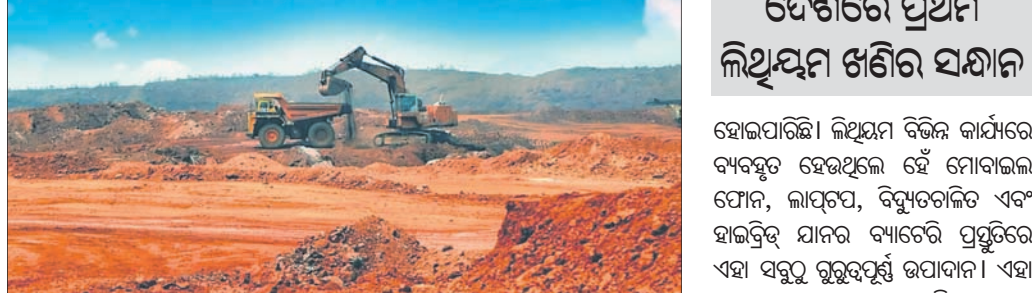
ହୋଇପାରିଛି। ଲିଥିୟମ ବିଭିନ୍ନ କାର୍ଯ୍ୟରେ ବ୍ୟବହୃତ ହେଉଥିଲେ ଚୈ ମୋବାଇଲ୍ ଫୋନ୍, ଲାପ୍‌ଟପ୍, ବିଦ୍ୟୁତ୍‌ଚଳିତ ଏବଂ ହାଇବ୍ରିଡ୍ ଯାନର ବ୍ୟାଟେରି ପ୍ରଭୃତିରେ ଏହା ସବୁରୁ ଗୁରୁତ୍ୱପୂର୍ଣ୍ଣ ଉପାଦାନ। ଏହା ବ୍ୟତୀତ କାଚ ଏବଂ ସେରାମିକ୍‌ସୁ ସୁଦ୍ଧ ଓ ତାପ ପ୍ରତିରୋଧୀ କରିବାକୁ ସେଥିରେ ଲିଥିୟମ ମିଶ୍ରଣ କରାଯାଇଥାଏ। ଆଲୁମିନିୟମ ଏବଂ ତମ୍ବା ସହ ଲିଥିୟମ ମିଶ୍ରଣ ବିମାନ, ମହାକାଶ ଯାନ ନିର୍ମାଣରେ ବ୍ୟବହାର କରାଯାଇଥାଏ।