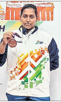
ଭୁବନେଶ୍ୱର, ୧୦୧୨ (ସୋହାସ୍ କ୍ଷୁଦ୍ରଗୋ)

ମଧ୍ୟପ୍ରଦେଶର ଇନ୍ଦୋରରେ ଅନୁଷ୍ଠିତ ହୋଇଥିବା ଖେଳାଳି ଇତିହାସ ଯୁଦ୍ଧ ରେପୁରେ କିଛି ବିଶ୍ୱବିଦ୍ୟାଳୟ ଛାତ୍ରୀ କାମୁଡ଼ି ଅଭିଶିକ୍ତା ମହିଳା ୮୧ କେଜି କ୍ଲାସରେ ଭାରତୀୟ ଖେଳାଳିଙ୍କର ଏକ ବ୍ରୋଞ୍ଜ ପଦକ ଲାଭ କରିଛନ୍ତି।