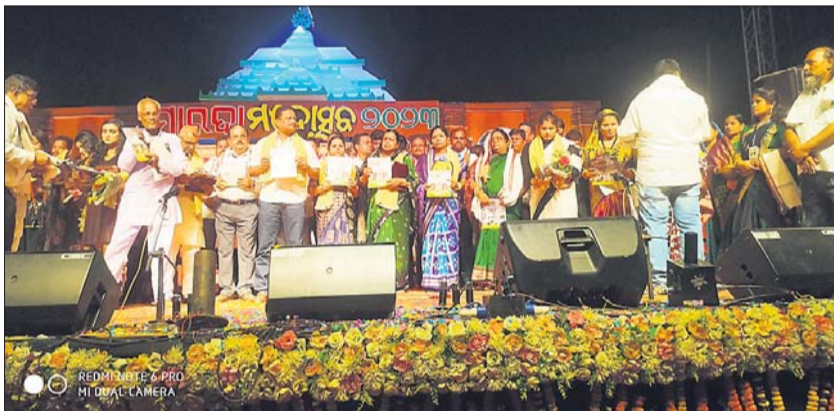
ମାରଦା ମହୋତ୍ସବ ଉଦ୍‌ଘାଟନା ଦିବସରେ ମଞ୍ଚାସନ ଅତିଥିଙ୍କ ସହ ସମ୍ପର୍କିତ ବ୍ୟକ୍ତି ।