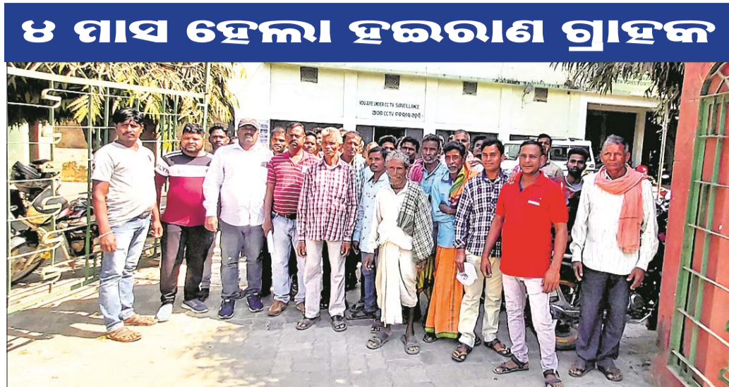
୪ ମାସ ହେଲା ହଇରାଣ ଗ୍ରାହକ ବିଦ୍ୟୁତ୍ ବିଭାଗର ଉତ୍ତର ଗୁମ୍ଫାସର ବନଖଣ୍ଡର ଅନେକ ଗ୍ରାମରେ ଗତ ୪ ମାସ ହେବ ବିଦ୍ୟୁତ୍ ବିଭାଗ ଲାଗିରହିଛି । ସନ୍ଧ୍ୟା ହେଲେ ଆପେ ଆପେ ବିଦ୍ୟୁତ୍ ଚାଲିଯାଇ ପ୍ରାୟ ୧୨ ଘଣ୍ଟା ପରେ ଆସୁଛି ।

ଭଞ୍ଜନଗର, ୧୦୧୨ (ଡି.ଏନ.ଏ.) ଭଞ୍ଜନଗର ଉତ୍ତର ଗୁମ୍ଫାସର ବନଖଣ୍ଡର ଅନେକ ଗ୍ରାମରେ ଗତ ୪ ମାସ ହେବ ବିଦ୍ୟୁତ୍ ବିଭାଗ ଲାଗିରହିଛି । ସନ୍ଧ୍ୟା ହେଲେ ଆପେ ଆପେ ବିଦ୍ୟୁତ୍ ଚାଲିଯାଇ ପ୍ରାୟ ୧୨ ଘଣ୍ଟା ପରେ ଆସୁଛି । ଦିନରେ ମାତ୍ର ୨୭୮ ଘଣ୍ଟା ବିଦ୍ୟୁତ୍ ରହିବା ପରେ ପୁଣି ସନ୍ଧ୍ୟା ୫ ଘଣ୍ଟା ପରେ ଚାଲିଯାଉଛି ।