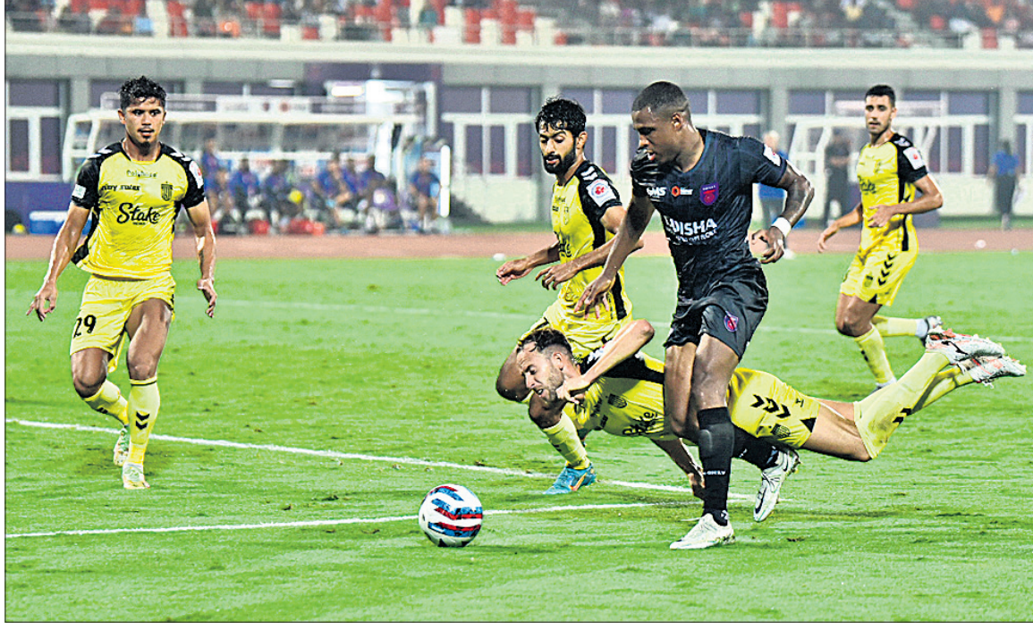
ଓଡିଶା ଏସିଏଫସି ଓ ହାଇଦ୍ରାବାଦ ଏସିଏଫସି ମଧ୍ୟରେ ଅନୁଷ୍ଠିତ ମ୍ୟାଚର ଏକ ସଂଘର୍ଷପୂର୍ଣ୍ଣ ପୂର୍ଣ୍ଣ।

୪୪ତମ ମିନିଟରେ ନିମ୍ନ ଦୋର୍ଜି ଓଏଫସି ଟୀମର ଗୋଲକୀର୍ତ୍ତୀ ହେଲେ ଚମତ୍ତା। ଓଏଫସି ଟୀମର ଗୋଲର ଗୋଲକୀର୍ତ୍ତୀ ହେଲେ ଚମତ୍ତା।