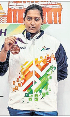
ଭୁବନେଶ୍ୱର, ୧୦୧୨ (ସୋହର୍ଲ୍ ବ୍ୟୁରୋ)

ମଧ୍ୟପ୍ରଦେଶର ଲେନୋରରେ ଅନୁଷ୍ଠିତ ହୋଇଯାଇଥିବା ଖେଳାଳି ଯୁଥ୍ ଗେଷ୍ଟରେ କିଛି ବିଶ୍ୱବିଦ୍ୟାଳୟ ଛାତ୍ରୀ କାମୁଡ଼ି ଅଭିଶିକ୍ତା ମହିଳା ୮୧ କେଜି କ୍ଲାସରେ ଭାରତୀୟତାରେ ଏକ ବ୍ରୋଞ୍ଜ ପଦକ ଲାଭ କରିଛନ୍ତି।