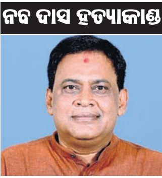
ନବ ଦାସ ହତ୍ୟାକାଣ୍ଡ କିଛି ସମ୍ପର୍କ ପୂର୍ବେ ୨ କେନ୍ଦ୍ରମନ୍ତ୍ରୀଙ୍କୁ ଭେଟିଥିଲେ