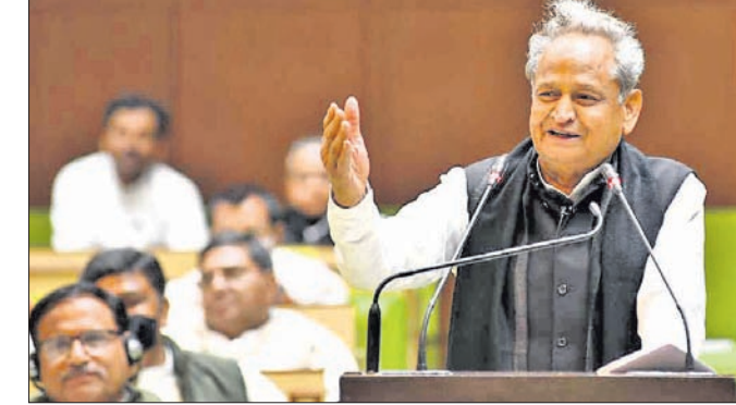
ରାଜସ୍ଥାନ ପୁଖ୍ୟମନ୍ତ୍ରୀ ଅଶୋକ ଗେହଲଟ ବଜେଟ୍ ଉପସ୍ଥାପନ କରୁଛନ୍ତି।

ଜୟପୁର, ୧୦/୨ ଚଳିବର୍ଷ ଶେଷ ଆଡ଼କୁ ରାଜସ୍ଥାନ ବିଧାନସଭା ନିର୍ବାଚନ ଆନୁଷ୍ଠିତ ହେବ। ଏଥିପାଇଁ ପୁଖ୍ୟମନ୍ତ୍ରୀ ଅଶୋକ ଗେହଲଟଙ୍କ ନେତୃତ୍ୱାଧୀନ କଂଗ୍ରେସ ସରକାର ଅନେକ ପ୍ରସ୍ତୁତି ଚଳାଇଥିଲେ। ବିଶେଷକରି ଯୁବବର୍ଗର ଭୋଟରଙ୍କୁ ଆକୃଷ୍ଟ କରିବା ଲାଗି ୨୦୨୩-୨୪ ଆର୍ଥିକବର୍ଷର ବଜେଟ୍‌ରେ ସେମାନଙ୍କ ପାଇଁ ଅନେକ ସୁବିଧା କରିଥିଲେ। କିନ୍ତୁ ଶୁକ୍ରବାର ବଜେଟ୍ ଉପସ୍ଥାପନ ବେଳେ ବିଭ୍ରାଟ ହେଲା। ଗେହଲଟ ୨୦୨୨-୨୩ ଆର୍ଥିକବର୍ଷର ବଜେଟ୍ ଦସ୍ତାବିଜକୁ ପଢ଼ିଚାଲିଥିଲେ। ସହରାଞ୍ଚଳରେ ନିୟୁକ୍ରି ଏବଂ କୃଷକ କଲ୍ୟାଣ ସମ୍ପର୍କିତ ପ୍ରଥମ ପଦକ୍ଷେପ ଗ୍ରହଣ ପୂର୍ବ ବର୍ଷର ବୋଲି