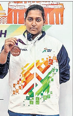
ଭୁବନେଶ୍ୱର, ୧୦୧୨ (ସୋମ୍ବର ଖୁସରୋ)

ମଧ୍ୟପ୍ରଦେଶର ଲେନୋରରେ ଅନୁଷ୍ଠିତ ହୋଇଯାଇଥିବା ଖେଳାଳି ଯୁଦ୍ଧ ଗେମ୍ରେ କିଛି ବିଶ୍ୱବିଦ୍ୟାଳୟ ଛାତ୍ରୀ କାମୁଡ଼ି ଅଭିଶିକ୍ତା ମହିଳା ୮୧ କେଜି କ୍ଲାସରେ ଭାରତୀୟ ଖେଳାଳିଙ୍କୁ ଏକ ବ୍ରୋଞ୍ଜ ପଦକ ଲାଭ କରିଛନ୍ତି।